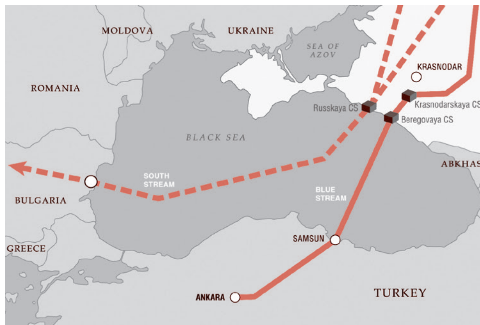
Планировавшийся газопровод «Южный поток» и функционирующий с 2003 года газопровод «Голубой поток»

Представители Еврокомиссии заявили, что надеются на то, что решение России по «Южному потоку» не окончательное, и что переговоры по этому газопроводу с заинтересованными странами ЕС назначены на 9 декабря.