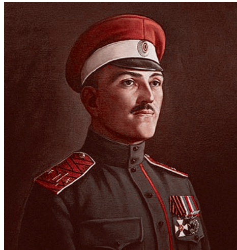
Туркул. А. В.

Данная «особая оговорка» мэрии Новороссийска представляет собой краткое изложение настойчиво распространяемого сегодня мифа о Туркуле, «патриоте, несмотря на сотрудничество с фашистами». Распространение подобных мифов наносит страшный удар по идентичности нашего народа, и так страшно надломленной благодаря разнузданной антисоветской пропаганде последних десятилетий и держащейся в основном лишь благодаря памяти о Великой Отечественной войне.