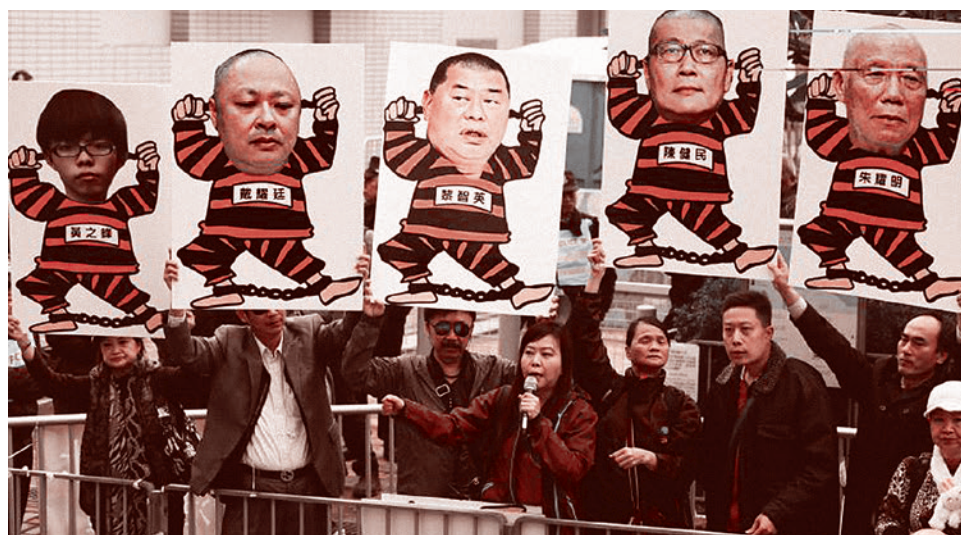
Противники движения Оксиу Central встречают лидеров движения пришедших в полицейский участок