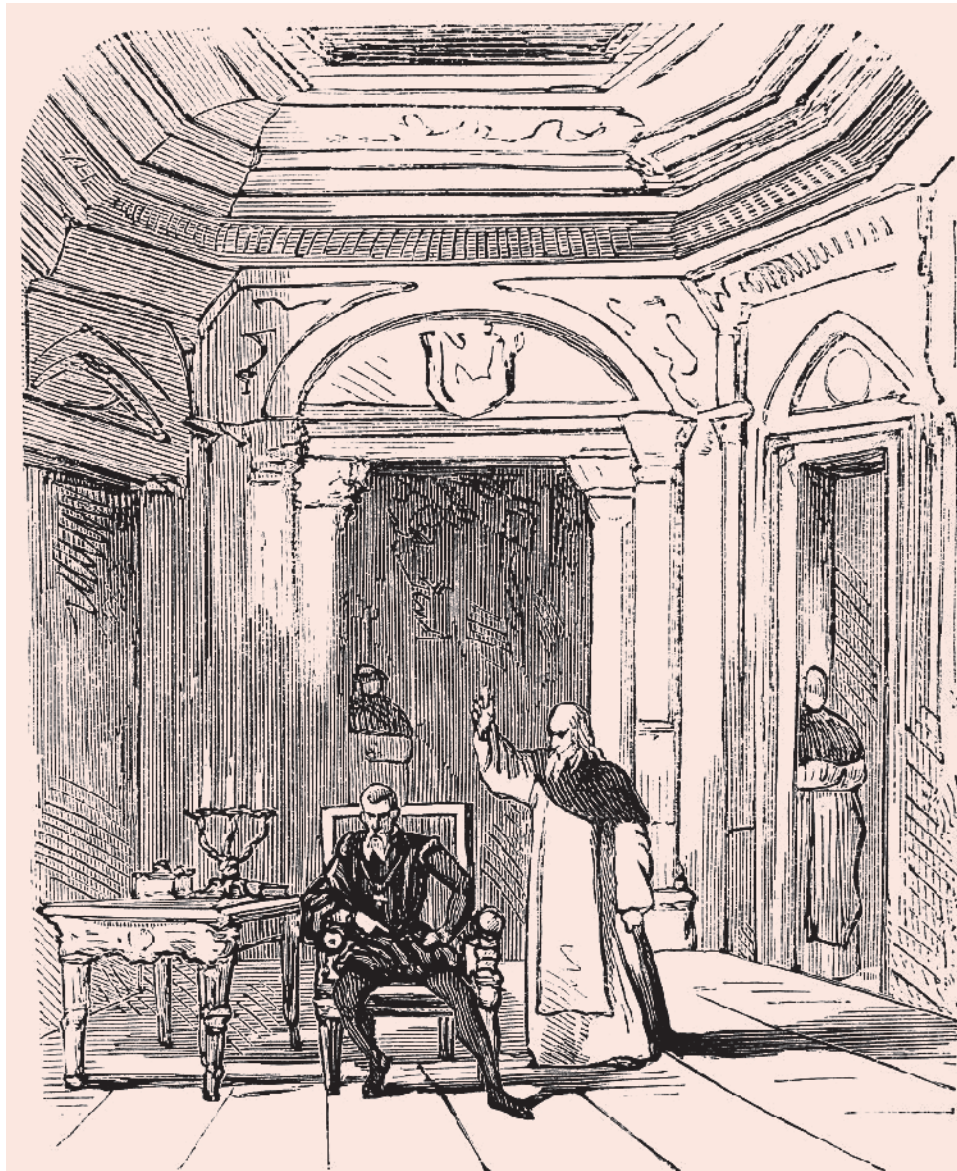
Король Филипп II и Великий Инквизитор. Иллюстрация к опере Джузеппе Верди «Дон Карлос»