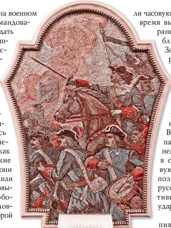
Полтавская битва — Мозаичное панно на ст. метро Киевская в Москве

К четверем часам дня оба войска так устали от битвы, что сели в половине пушечного выстрела друг от друга и устрои-