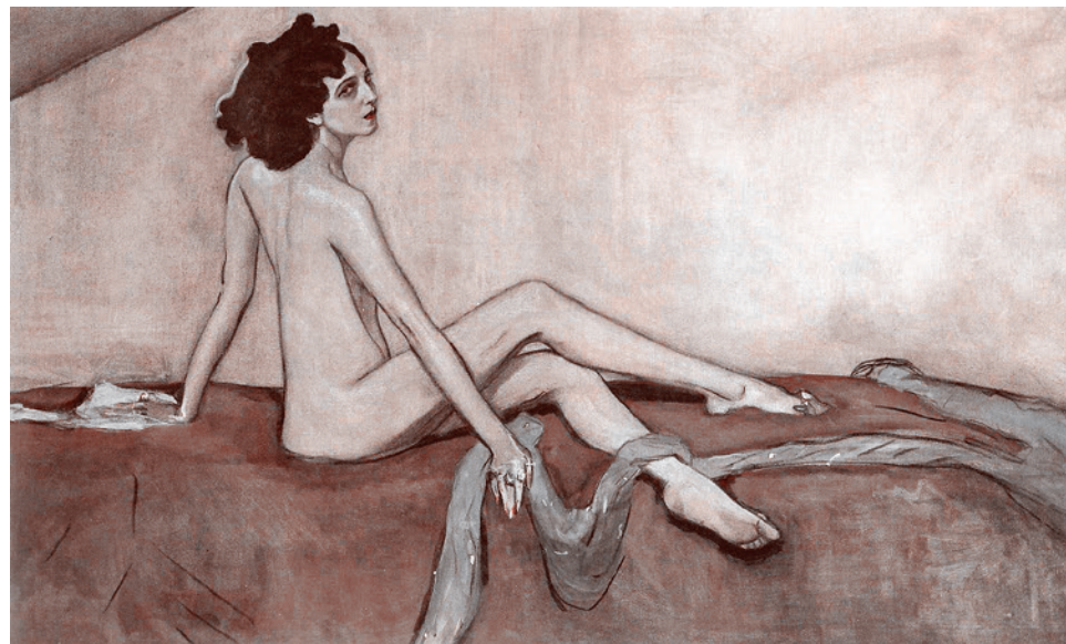
В. Серов. Портрет Иды Рубинштейн. 1910 г.

Этот портрет на время ставшей звездой дягилевского балета актрисы-любительницы и экстравагантной миллионерши, первой в русском театре полностью «снявшей покровы» в балете по «Саломее» Оскара Уальда, вызывал (и вызывает) самые противоречивые отзывы, в том числе возмущенные. Ценители искусства Серова,