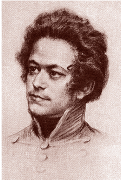
Карл Маркс в молодости

Если в самом начале этого строительства надо вовлекать полноценное содержание в не до конца его вмещающую матрицу, то, поскольку вы стремитесь к гибкой многомерной матрице, к идео-