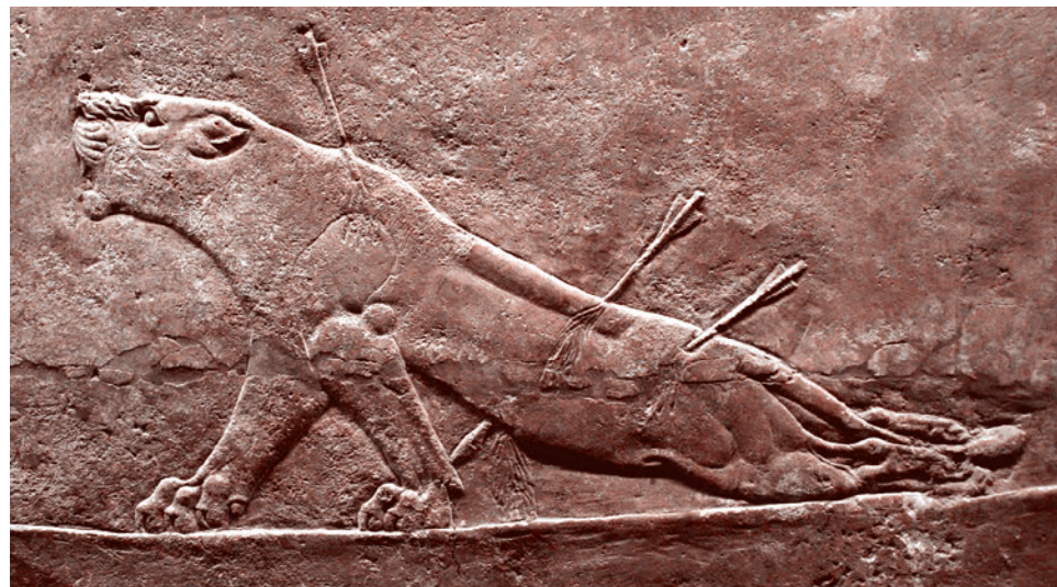
Раненая львица. Рельеф из дворца Ашшурбанипала в Ниневии. Алебастр. VII в. до н.э. Лондон. Британский музей

увидели в этом портрете измену мастера своим принципам.