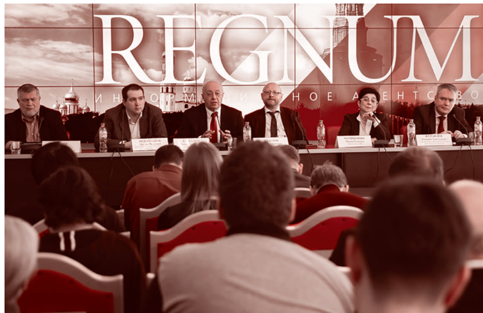
Пресс-конференция в ИА REGNUM. 29 марта 2017 г.