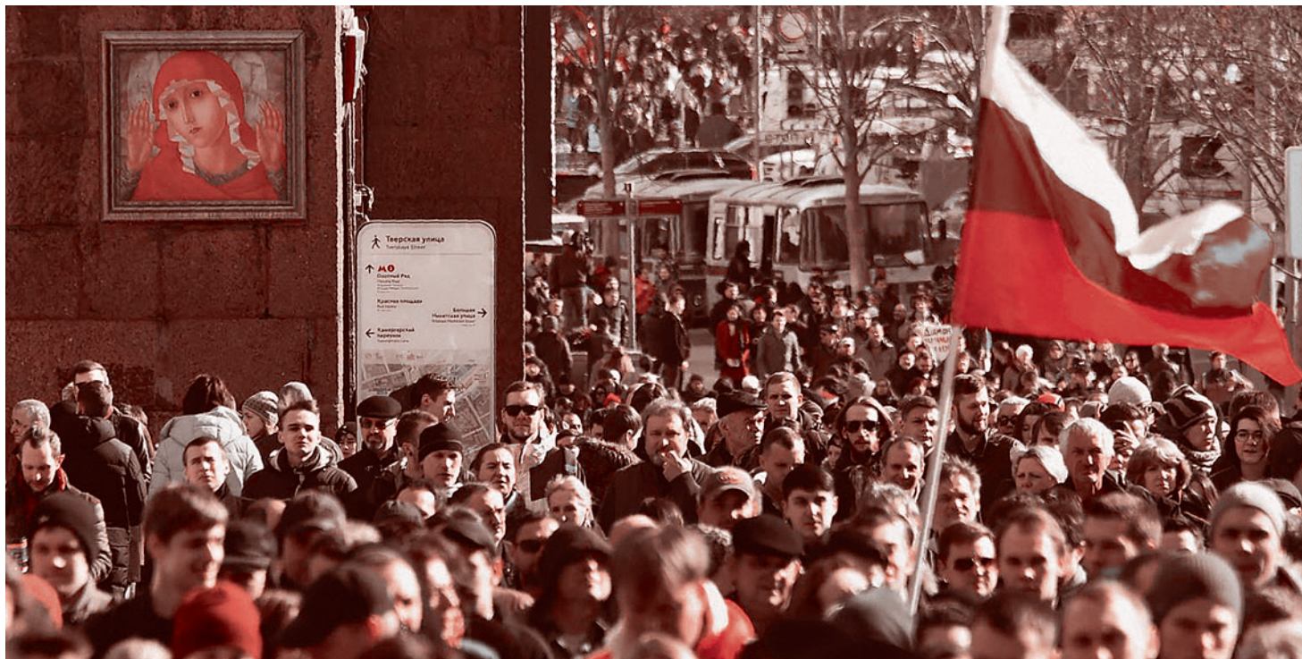
Протестующие на ул. Тверская в Москве. 26 марта 2017 г.

« Мы не видим необходимости какого-то расследования в рамках каких-то попыток дискредитировать председателя правительства именно перед отчетом правительства в Госдуме, который пройдет 19 апреля », — заявил «Ъ» вице-спикер Госдумы, секретарь ген-