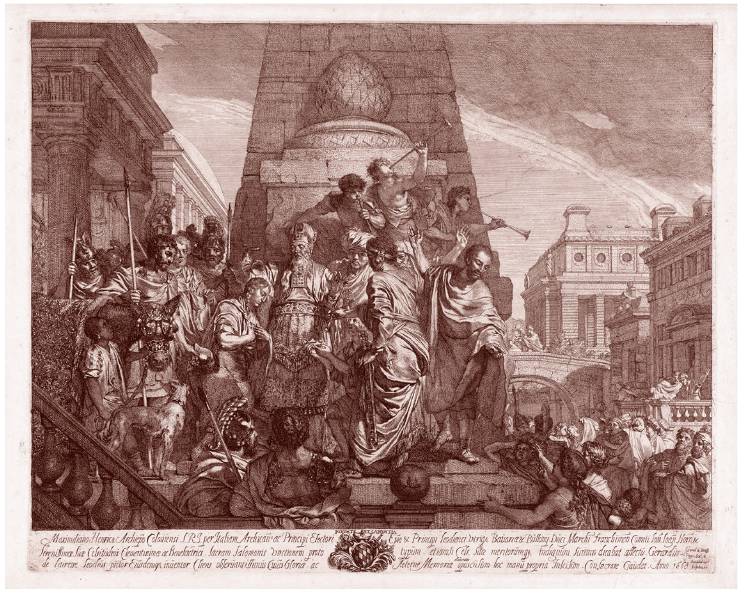
Герард де Левесс. Помазание Соломона на царство. 1668

Нельзя не изумляться! И это изумление является одной из странных констант в истории западного человечества. А в силу особой роли западного человечества в мировой истории — и в мировой истории вообще. Причем чаще всего это изумление порождает у других народов мира достаточно глубокое неприятие еврейства как такового, а в крайнем случае — и теорию еврейского мирового заговора, согласно которой евреи тайно правят миром на протяжении чуть ли не всей его истории, что невозможно без сопричастности евреев к некоему нездешнему невероятно могучему злему началу — тому или ино-