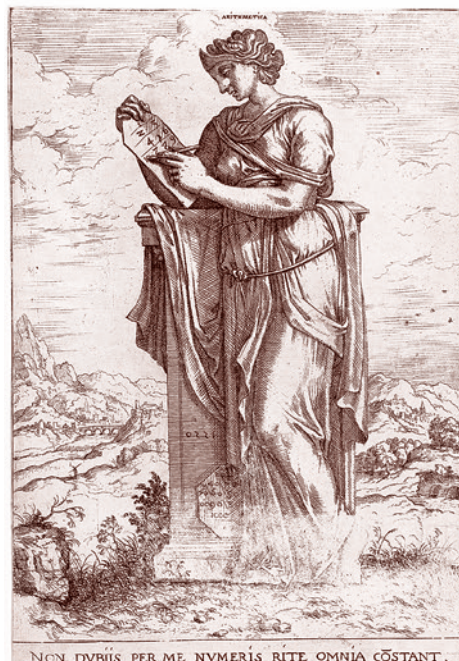
Иероним Кок. Арифметика. 1550

Нет ничего удивительного в том, что подход, основанный на отказе от предметных базовых знаний, подрывает основы существования всех классических школ, физико-математических в том числе. Вот