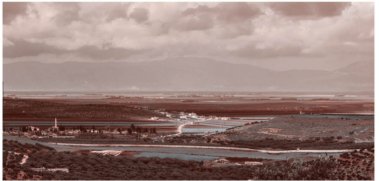
Сирийско-турецкая граница, вид из провинции Идлиб

Так что второй этап сирийской войны будет представлять собой процесс взаимовыяснения разнородных интересов этих