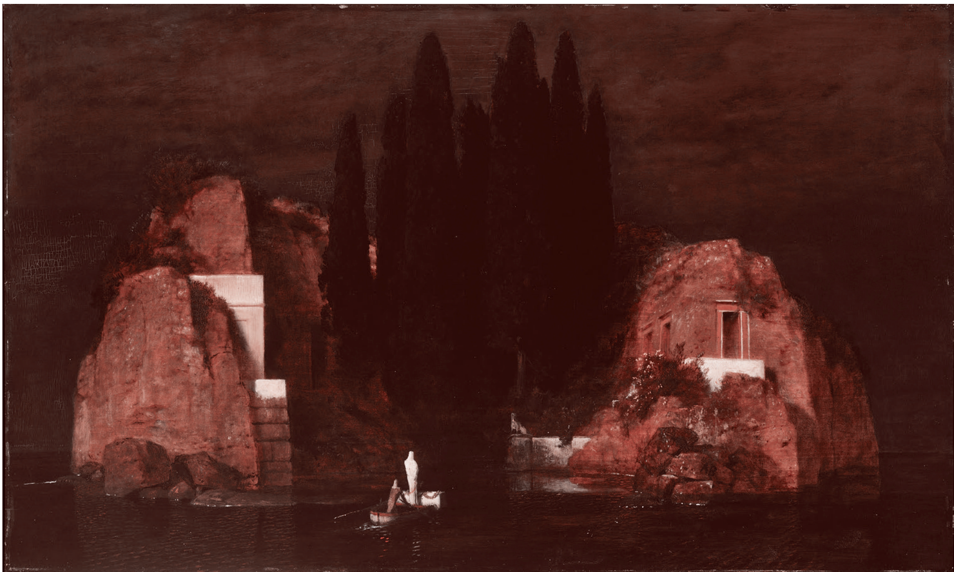
Арнольд Бёклин. Остров мёртвых. 1880

Признавшись Боткину в том, что Гегель, в котором он искал спасения от тотального пессимизма, теперь уже для него таким спасением не является. Белинский далее пишет: «Глушцы врут, говоря, что