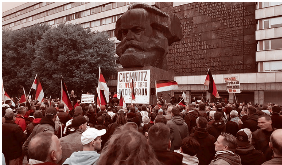
Демонстрация праворадикального движения Pro Chemnitz. Сентябрь 2018 г.

Как отмечает немецкое издание, все намеченные мероприятия прошли мирно, никаких столкновений между участниками или с полицией зафиксировано не было.