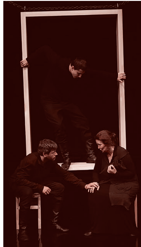
Сцена из спектакля «Пастырь»

Любопытно, как он себя ведет, этот герой. Он передвигается, да, он действует, но все-таки очень часто он созерцает. Вот он сидит и смотрит на происходящее, подчас довольно отрешенно. Сознывая себя, ну или, предлагая зрителю осознать себя как часть некой мистерии, которая развернута в пространстве национальной истории. Соответствующим образом