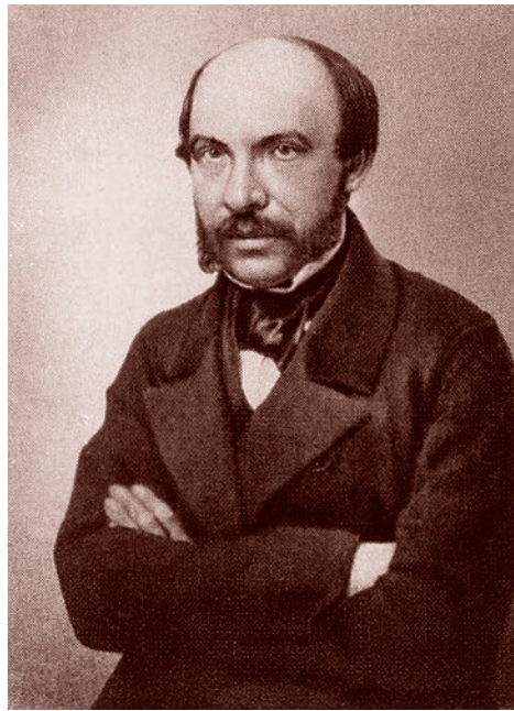
Василий Петрович Боткин. 1856

Потом Белинский попытался найти в Гегеле оправдание настоящей реальности, той, которая, в отличие от фиктеанской идеальности, не дышит мертвечиной, и потому начал вопрошать реальность вообще и прежде всего реальность российскую: «Эй, покажи, что там в тебе есть идеального!»