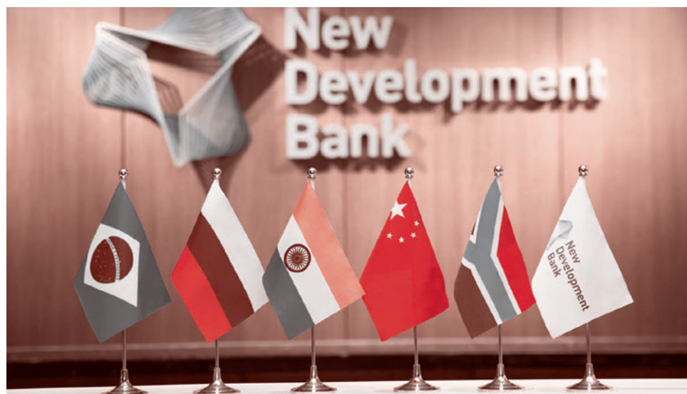
Новый банк развития

4 апреля премьер-министр Малайзии Анвар Ибрагим заявил, что нет «никаких причин для Малайзии продолжать зави-