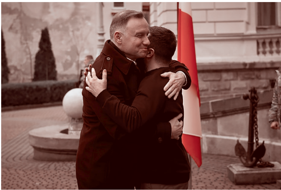
Президент Польши Анджей Дуда обнимает президента Украины Владимира Зеленского

А километром туда или обратно... да, каждый дом важен. И будут еще неприятные вещи, но пока русский дух не сдался, это кончится, по минимуму, в Киеве.