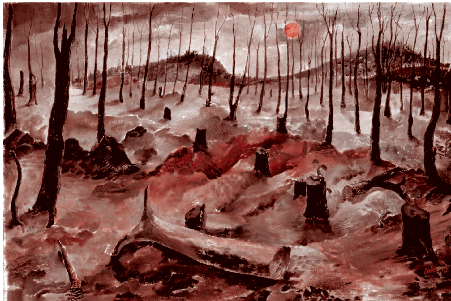
Лесли Коул. Выжженная земля. 1946