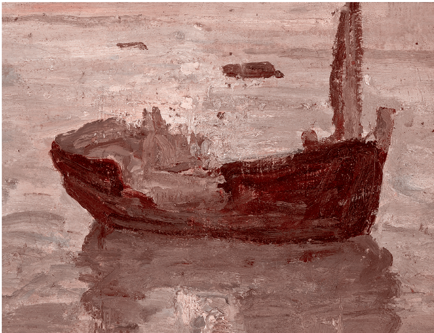
Генри Отанер. Кораблекрушение. XIX–XX век

му в штаны, ничего, что всё побило, только б не было войны!»