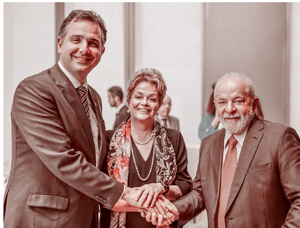
Президент Бразилии Луис Инасио Лула да Силва во время визита в штаб-квартиру НБР. Китай

Почему? Дело в том, что правительство США в очередной раз фактически достигло «разрешенного» законом потолка федерального госдолга в $31,4 трлн и делать новые займы для поддержки банков уже не может. То есть через конгресс нужно проводить новый закон о повышении потолка госдолга — вступать в межпартийное соглашение и договариваться. А это сделать всё труднее. Так, уже 19 апреля спикер палаты представителей Кевин Маккарти представил условия (в частности, весьма болезненные для президента