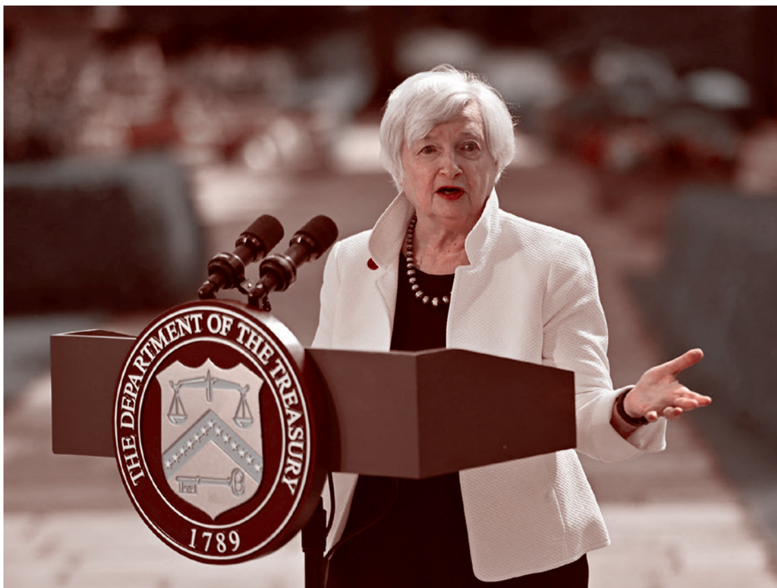
Министр финансов США Джанет Йеллен

Газета «Суть времени» зарегистрирована Федеральной службой по надзору в сфере связи, информационных технологий и массовых коммуникаций (Роскомнадзор) Свидетельство ПИ № ФС77-50554 от 9 июля 2012 года