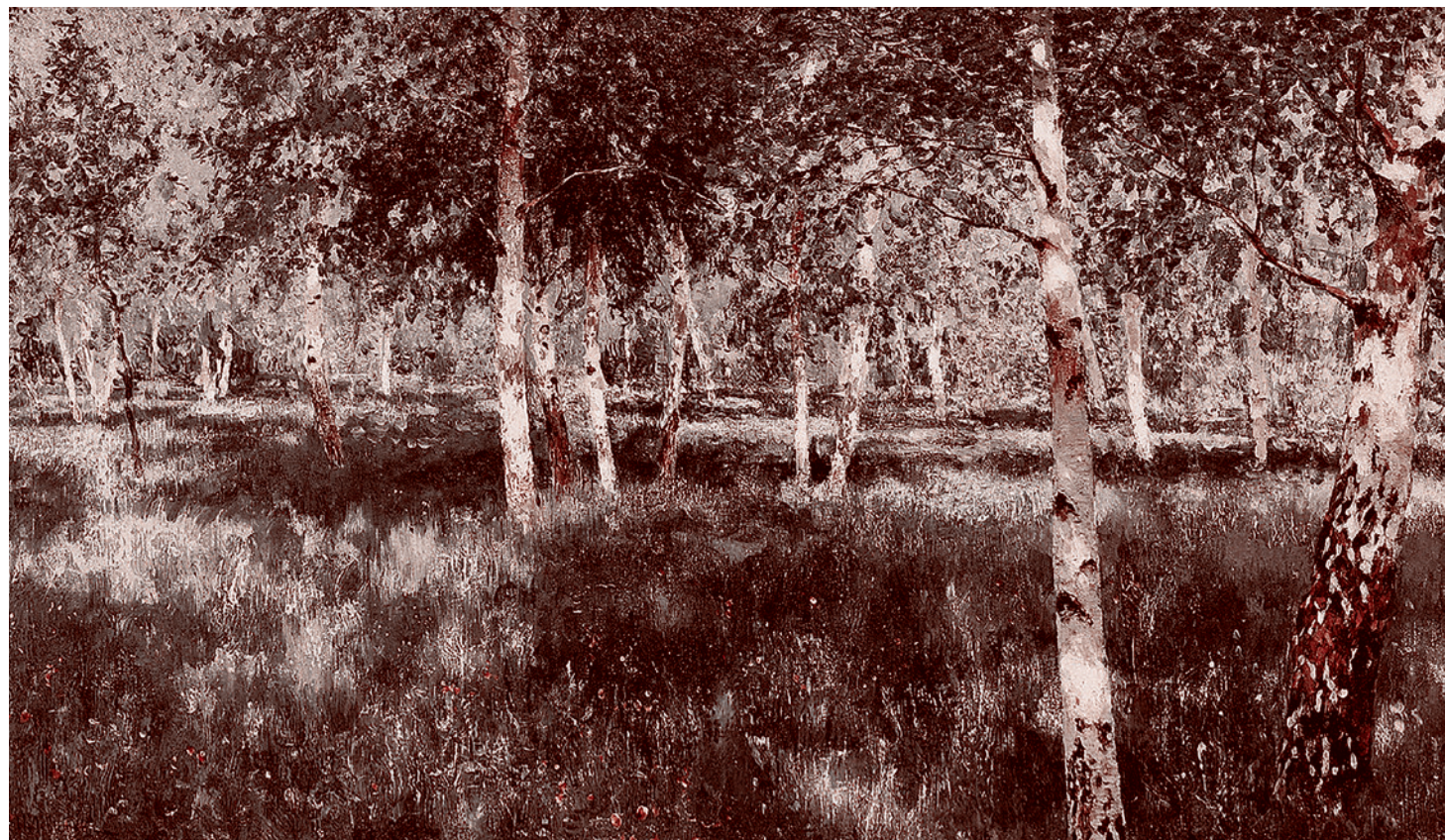
Исаак Левитан. Березовая роща. 1889