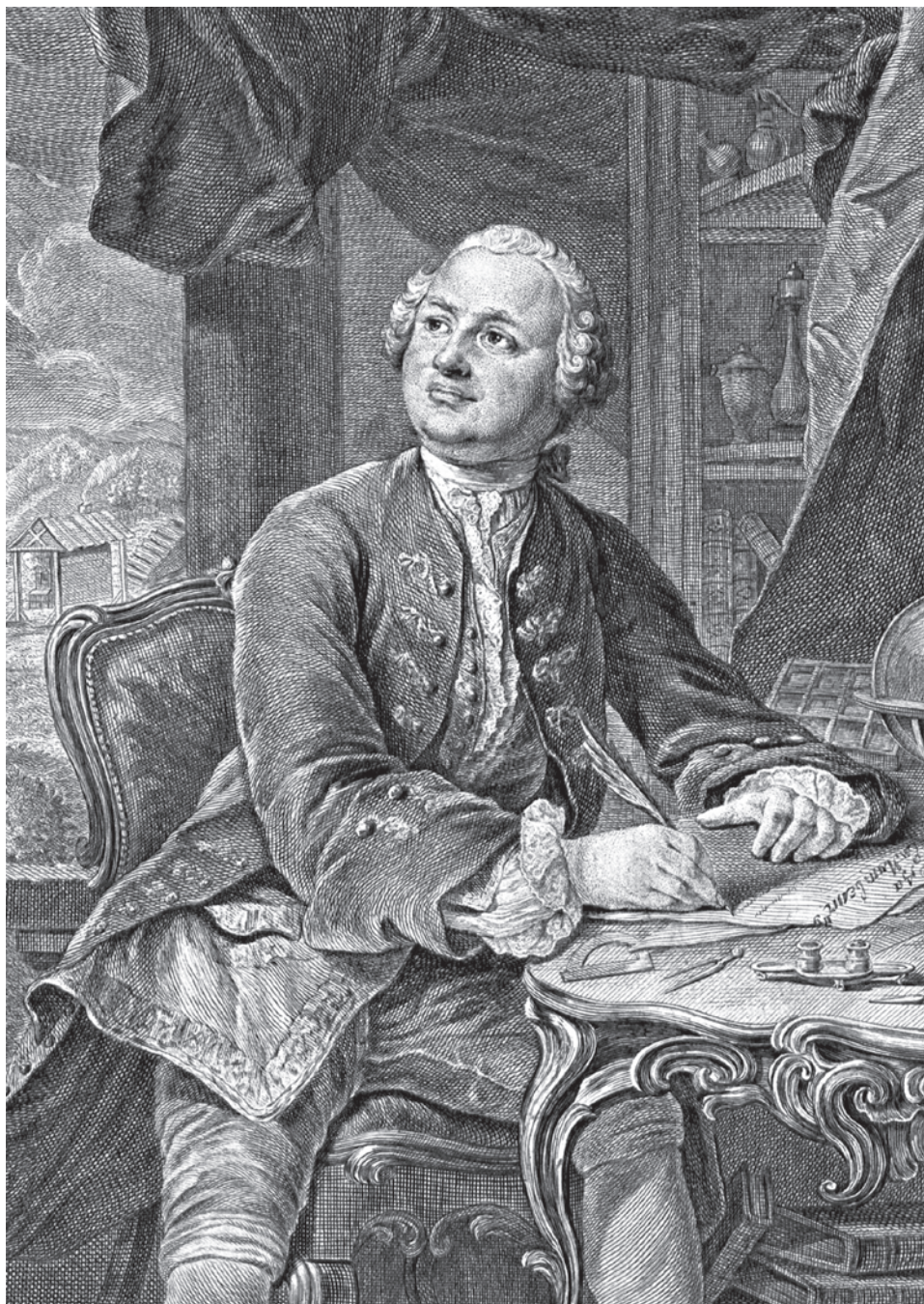
Вортман Христиан-Альберт. Михаил Ломоносов. 1757

Так, может быть, весь смысл заключается в том, что мы-то, Россия, «це нэ Троя»? И тогда я обращаю внимание на то, что говорил великий Ломоносов. Если бы это был не настолько великий человек и не настолько важный для России во всех смыслах, то можно было пропустить мимо ушей, но когда Ломоносов говорит об альтернативной концепции истории Руси, то он же апеллирует к чему? Он страшно ненавидит норманнскую теорию, которая стала общепринятой — о Рюрике и так далее. Он говорит: «Откуда берет Русь