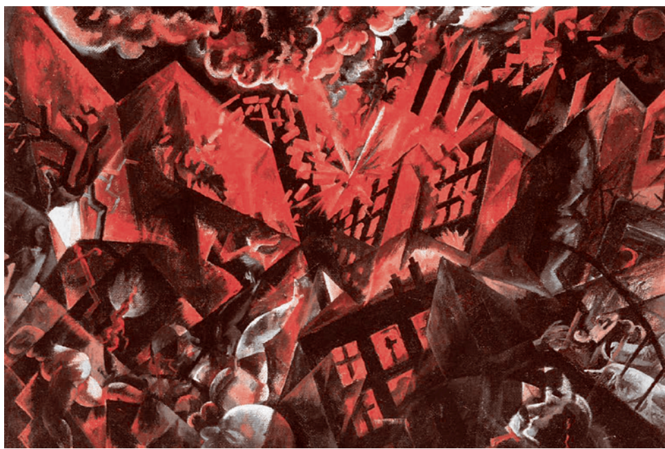
Георг Гросс. Взрыв. 1917

В стратегическом плане эта действительность не позволяет России выстоять. И потому ее надо менять. Но создатели этой действительности, во-первых, заданы в том, что касается своей любви к ней. Мне эта действительность кажется отвратительной, а им — замечательной. Прекрасной, как никогда в истории России. И при этом оправдывающей их земное существо-