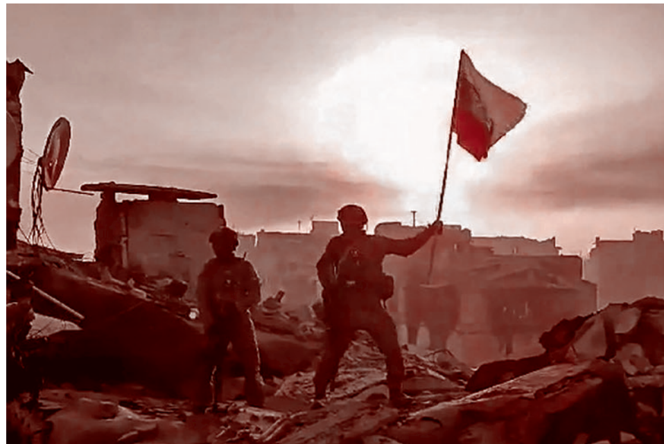
Установка российского флага в честь взятия Артёмовска под контроль ВС РФ

Заявление Пригожина о намерении отступить может быть попыткой ввести