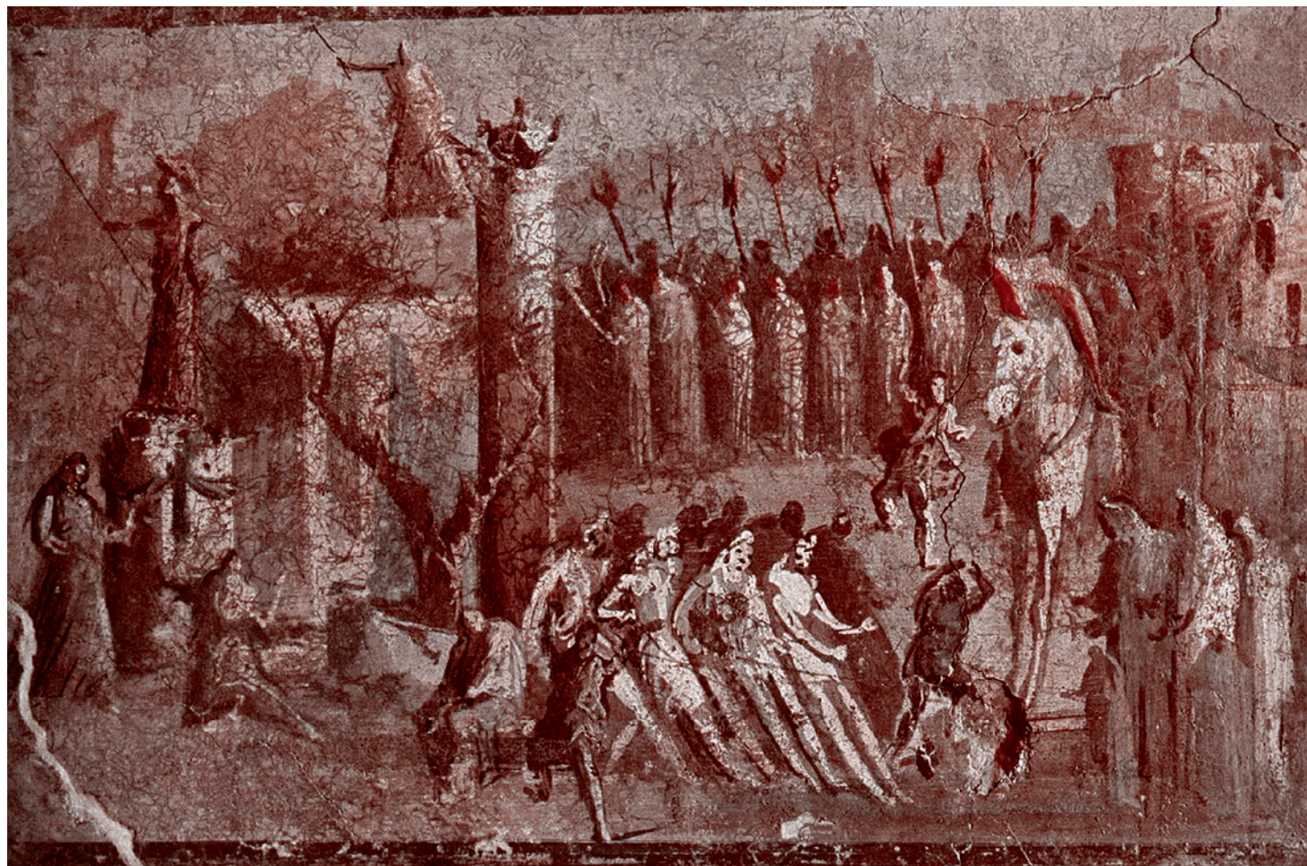
Фреска «Троянский конь», изображающая прибытие троянского коня в Трою. Помпеи, 45–79 гг.

Но мы другая, православная, цивилизация. И это огромное различие с Западом. Это различие прежде всего адресует к Византии. «Москва — третий Рим», то есть преемница Византии. И когда мы говорили это, мы тем самым говорили, что