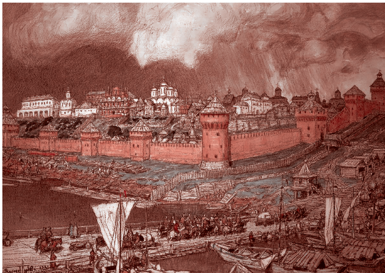
Апполинарий Васнецов. Московский кремль при Иване III. 1921

Через какое-то время замечаю такого скромного, чем-то похожего на бухгалтера человека, вокруг которого носятся все посольства и говорят: «Хантингтон, Хан-