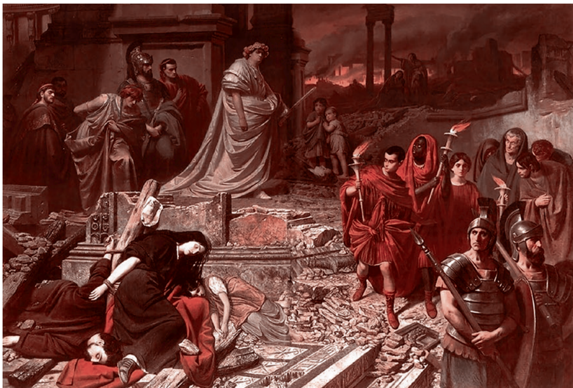
Карл Теодор фон Пилоти. Нерон смотрит на горящий Рим. 1861