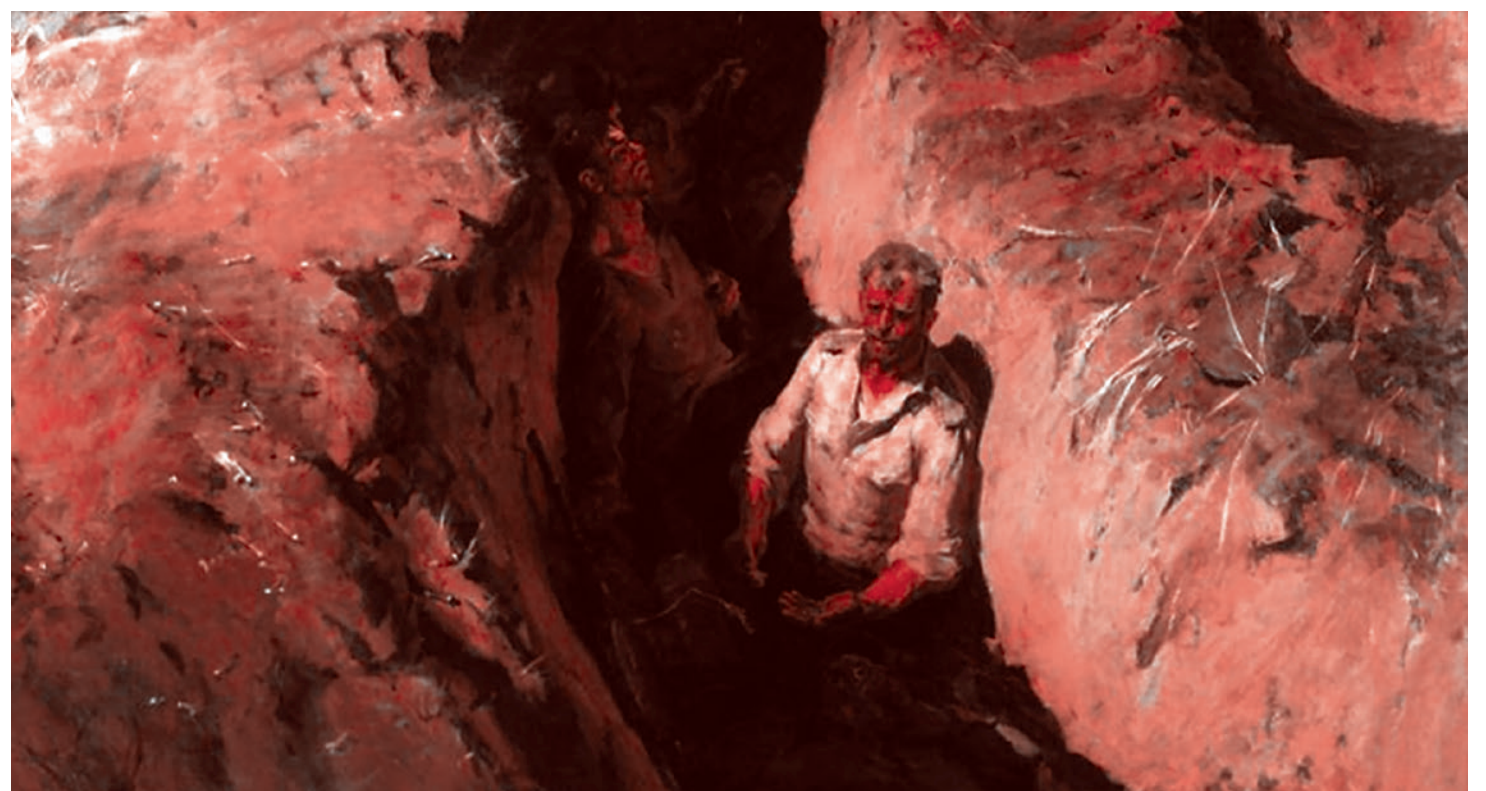
Борис Неменский. Земля опаленная. 1957