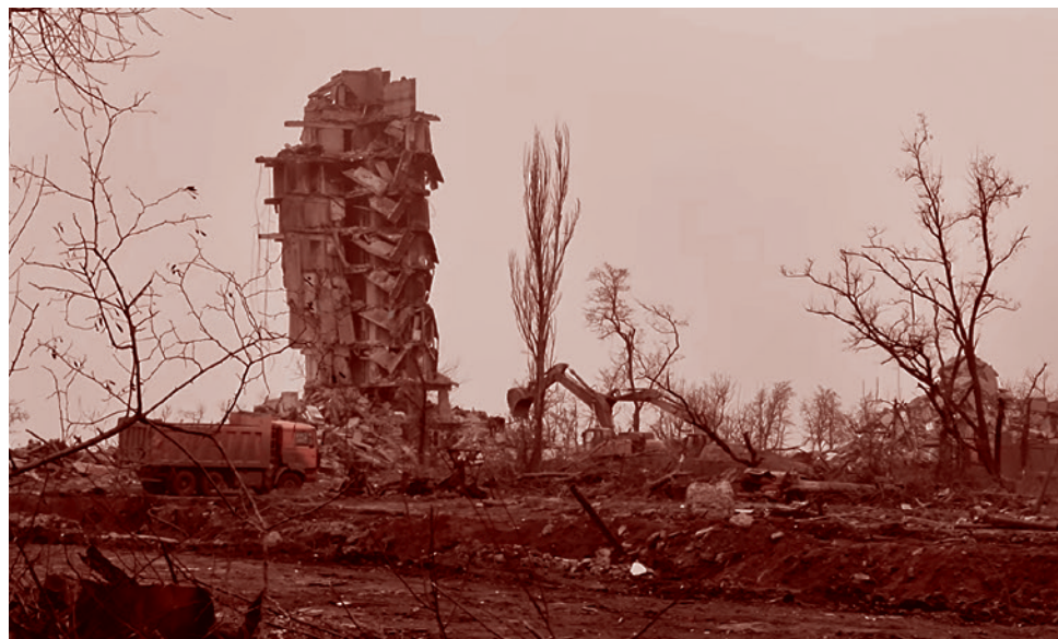
Разрушенный дом в Мариуполе

Теперь посмотрите на эти города, посмотрите на Артёмовск, посмотрите на Волноваху, посмотрите на Мариуполь, и вы увидите, что такое война на истощение с современными видами оружия, фантастически отличающимися от оружия Второй мировой войны. И вот на эту ржавую индустриальную зону, которой является практически вся Украина. Посмотрите на это, присмотритесь к преступным украинским действиям на Каховском водохранилище. Они нам хотят оставить выжженную землю. Идущая война на истощение и означает, что будет выжженная земля. Значит, на этой выжженной земле нужно будет строить принципиально новую жизнь. Не вписываться в ту, которая была. И вот