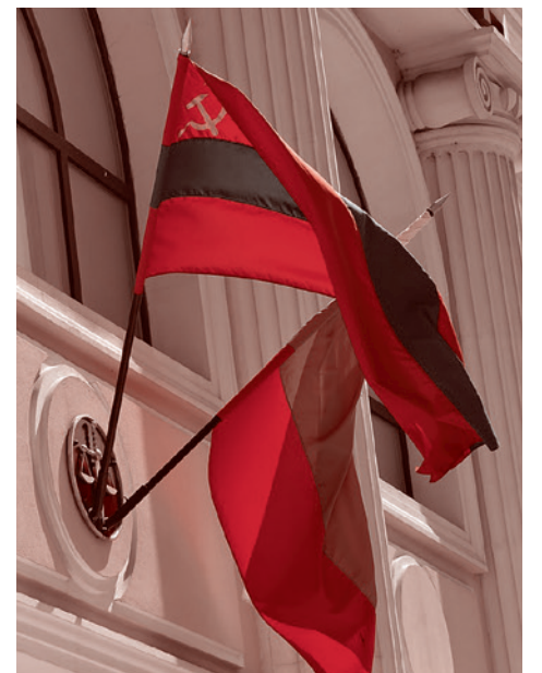
Приднестровский и российские флаги на фасаде здания в Тирасполе

Что главное из нематериальных активов? Любовь! Она главное. «А мы попробуем любовью», — сказал Тютчев, отвечая Бисмарку. Мы готовы строить мир любви? Прежде всего — практически — любви к тем, кто нас любит. Мы готовы строить мир на взаимной основе? Мы готовы так искупать прошлое, чтобы все нам поверили, что второй раз мы никого не кинем? Мы готовы так восстанавливать свое лицо? Мы готовы действовать в этой логике? Так тогда есть только мы, потому что западный мир в том виде, каков он сегодня, идет-таки к своему концу. Пелось когда-то в иро-