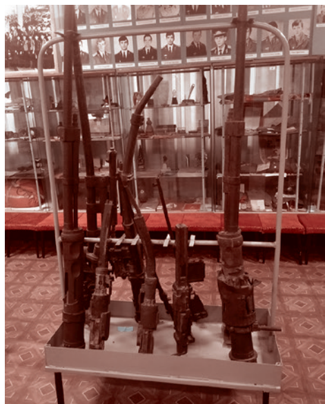
Экспонаты музея Боевой Славы