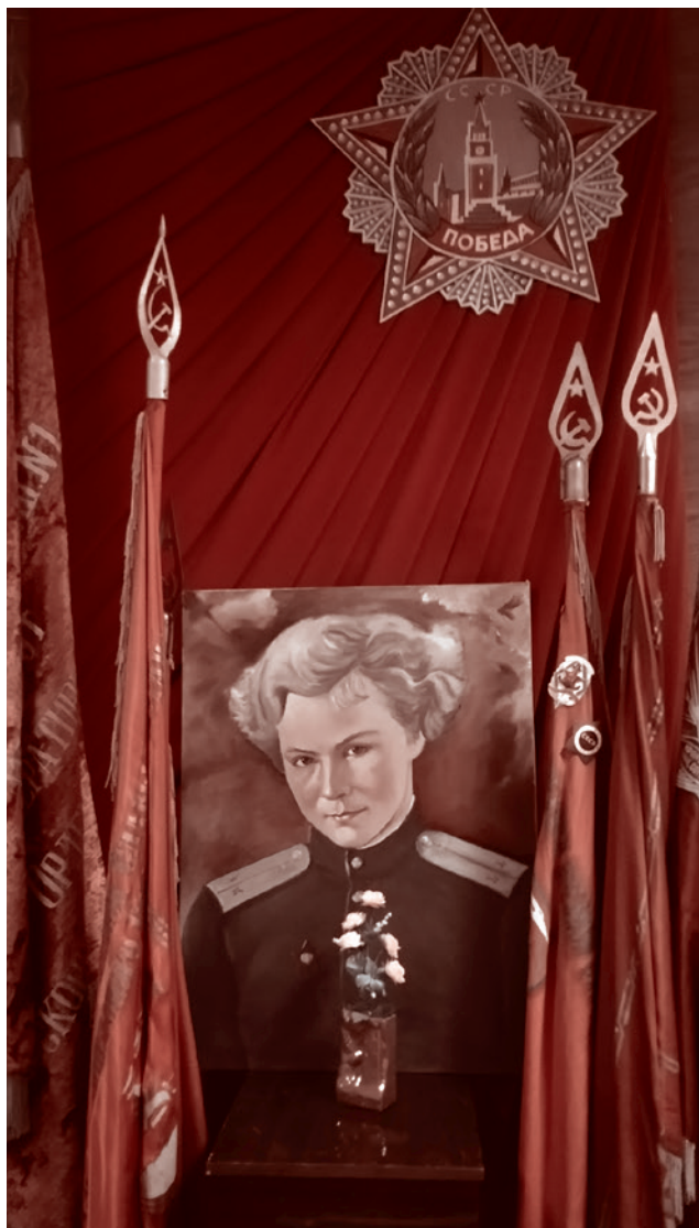
Портрет Лилии Литвяк в музее Боевой Славы