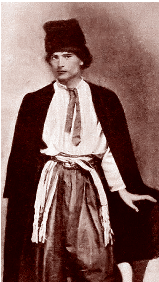
Владимир Антонович в крестьянском костюме. 1860

В 1899 году в литературно-научном журнале «Правда», печатавшемся в городе Львове (на то время — Лемберг, Австро-Венгрия), появилась статья Владимира Антоновича, российского историка