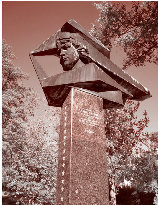
Памятник Лилии Литвяк перед Гимназией № 1

— Да, нашли самолет, нашли личные вещи пилота, единственное — не было документов, кому они принадлежат. Но по номерным знакам самолет был установлен, потом Валентина Ивановна вместе с ребятами связались с полком, в котором он числился, вышли на Москву, подняли архивные данные. И оказалось, что да, действительно это был ее самолет, сама