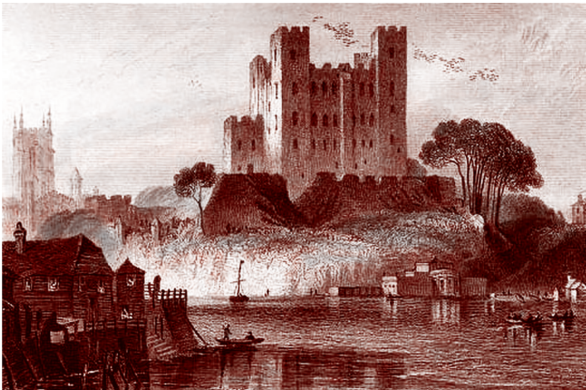
Рочестерский замок, выгравированный Х.Адлардом по Г.Ф.Сарджену. 1836

«COVID-19 усилил эрозию доверия к традиционным институтам и усугубил поляризацию во многих западных обществах. Эта поляризация создает множество новых проблем для руководителей компаний. Политические активисты или средства массовой информации мо-