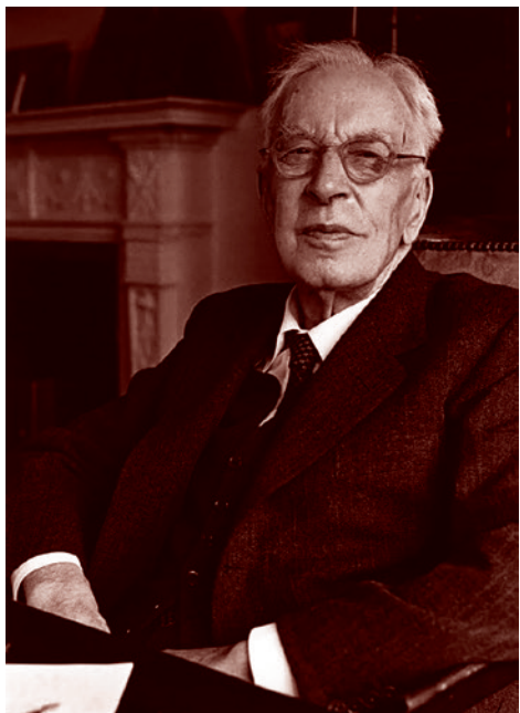
Арнольд Джозеф Тойнби

Так давайте скажем: «Да, просчитались. Да, считали, что это будет некий неокрымский сценарий, а возникло что-то совсем другое. Да, была допущена эта