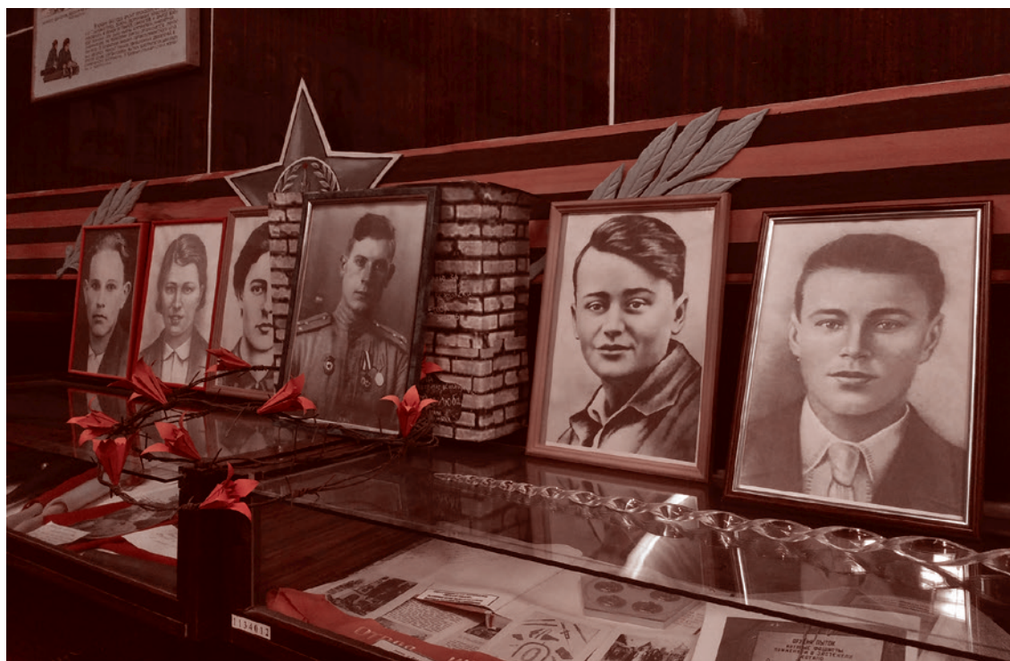
Портреты подпольщиков-молодогвардейцев в музее

Газета «Суть времени» зарегистрирована Федеральной службой по надзору в сфере связи, информационных технологий и массовых коммуникаций (Роскомнадзор) Свидетельство ПИ № ФС77-50554 от 9 июля 2012 года