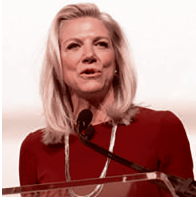
Основатель группы компаний «Коалиция за инклюзивный капитализм» Линн Форестер де Ротшильд

В 2012 году Линн Форестер де Ротшильд возглавила англо-американскую «Инициативу» Генри Джексона по инклюзивному капитализму, формально призван-