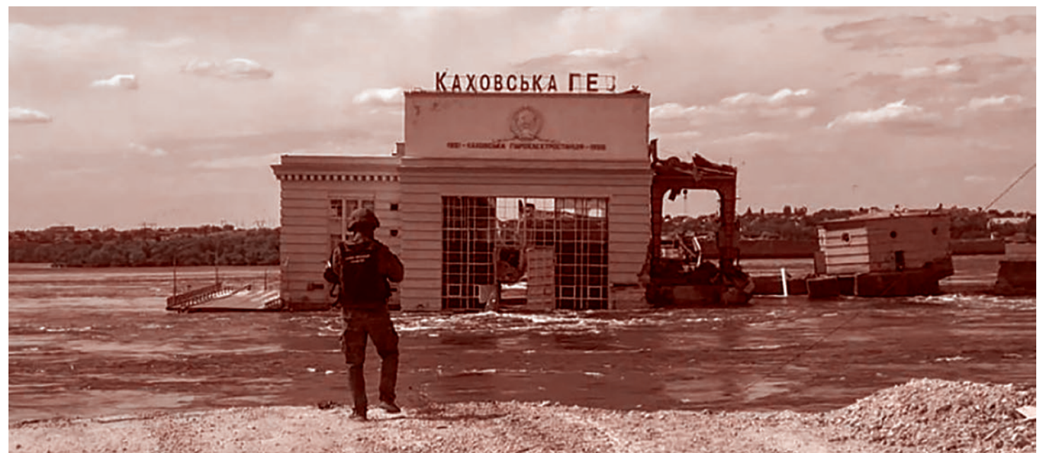
Разрушение Каховской ГЭС

Второй очевидной причиной уничтожения плотины является обмеление Каховского водохранилища для успешного наступления ВСУ. Но некоторые эксперты уверены: если водохранилище будет полностью спущено, там останется многометровый слой ила, по которому наступать нереально. Вода сделает непригодной для движения прибрежную зону на российской стороне — превратит всё в болото. Размыв минных полей — тоже опасная штука. К тому же наступать придется под огнем, на открытой местности, а за спиной будут не города со складами, госпиталями и прочей необходимой тыловой инфраструктурой, а одна из широчайших рек в Европе. Едва ли ко-