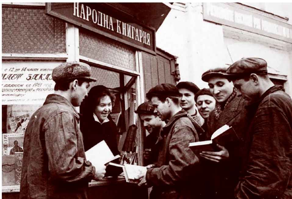
Люди покупают книги. Киев, Украина. 1961

В книжных магазинах Украины, по крайней мере до 2014 года, почти не продавались книги на украинском языке, за исключением учебной литературы и книг для детей. В советское время наблюдалось обратное — книжные магазины Украи-