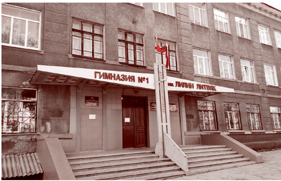
Гимназия № 1 имени Лилии Литвяк. Красный Луч

В первый раз я побывал в гимназии № 1 города Красный Луч (ЛНР) в октябре 2022 года, через пару недель после включения республики в состав России. Целью было общение с учениками старших классов на историческую тему — я рассказывал школьникам о Сталинградской битве. После живой беседы педагоги гимназии повели меня в их святилище — без всяких капычек — школьный музей боевой и трудовой славы, посвященный временам Великой Отечественной войны и особенно легендарной советской летчице Лилии Литвяк (к слову, гимназия носит ее имя).