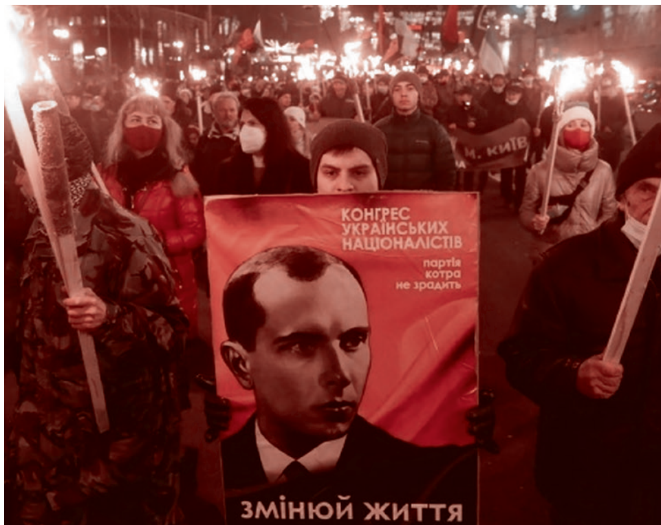
Украинские националисты устраивают шествия в центре Киева с факелами и портретами Степана Бандеры

Такой процесс известен. У выдающегося историка и аналитика Арнольда Тойнби, который является как раз одним из основных пропагандистов и ученых, раз-