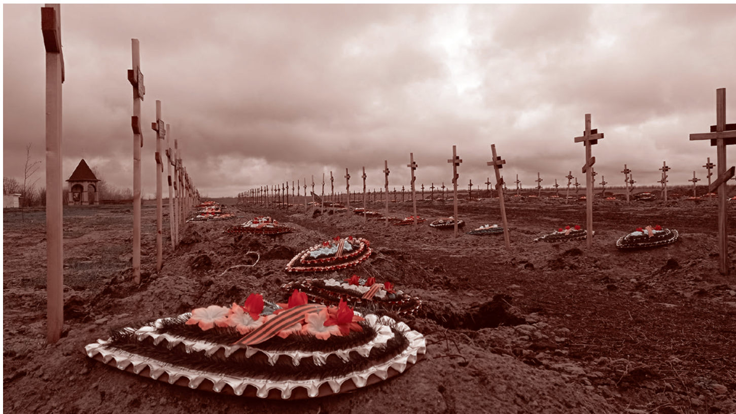
Война на истощение. Захоронения людей, пострадавших от рук киевского режима