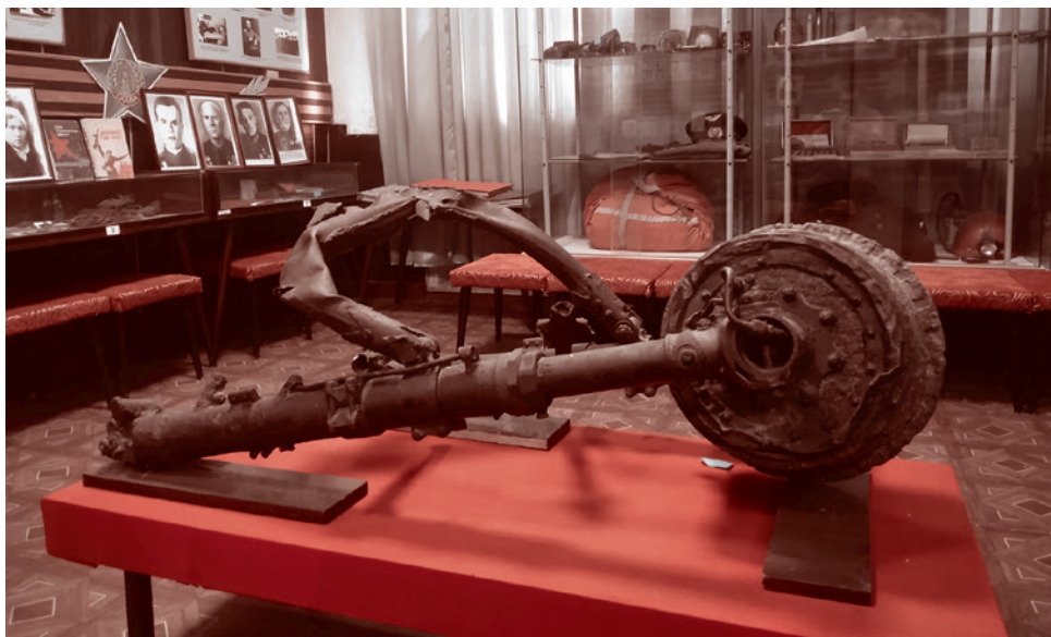
Экспонат музея Боевой Славы