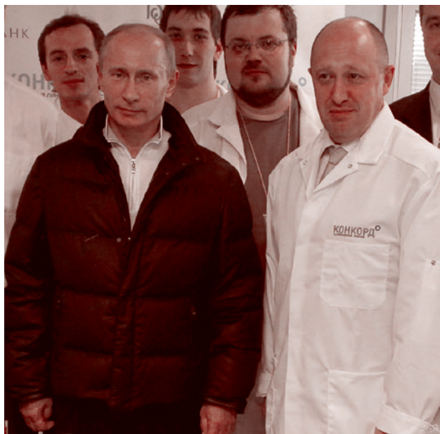
Владимир Путин и Евгений Пригожин. 2010

Самое крупное за 20 с лишним лет, что сделал президент с точки зрения строительства альтернативных систем, был «Вагнер». Это неслабый крупный эксперимент. Смелый, безоглядный, эксцентричный, масштабный. И этот эксперимент проводил сам президент России. Он это делал, и все это понимали, и никто, кроме него,