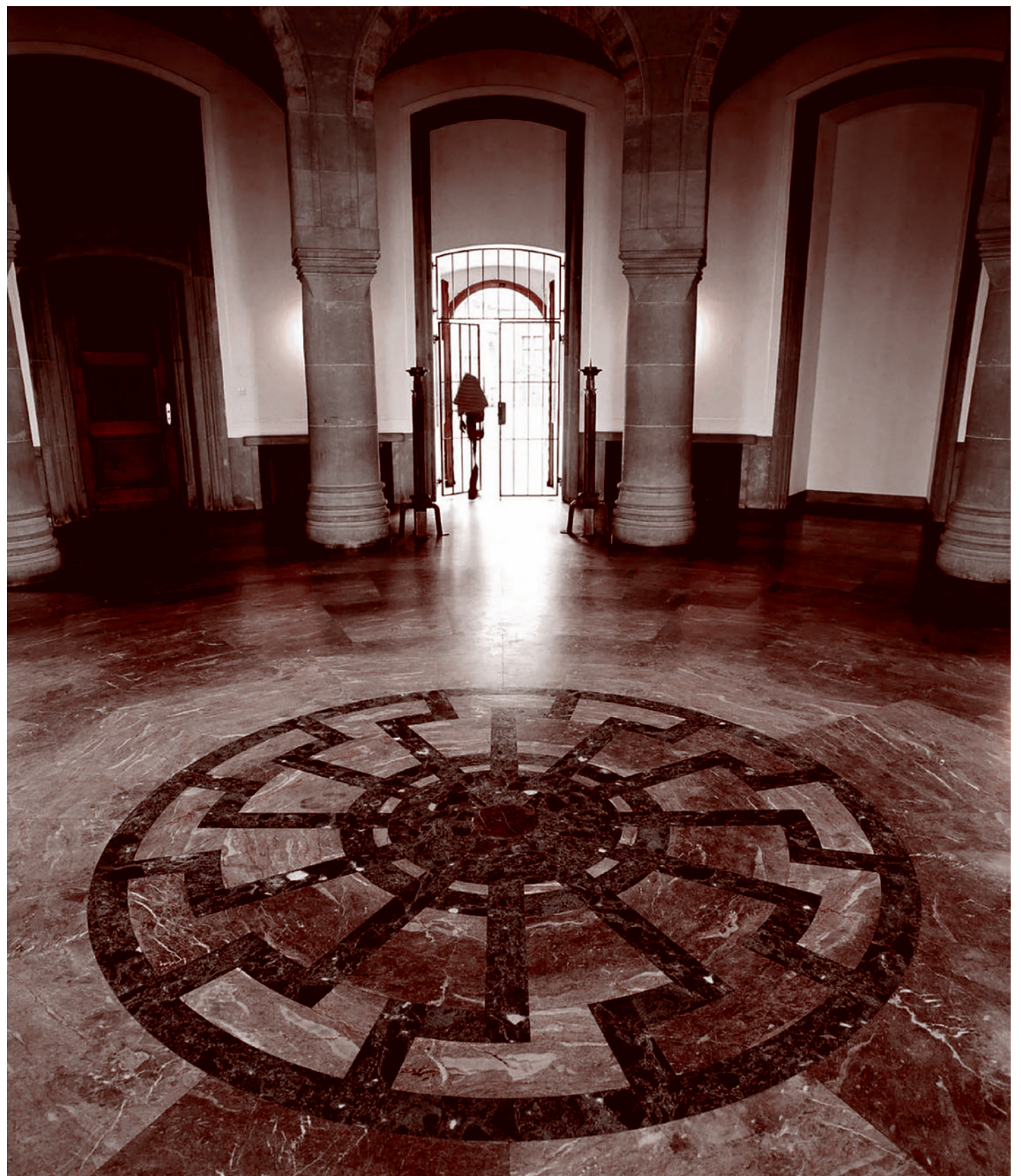
Черное солнце на полу Зала обергруппенфюреров в замке Вевельсбург

В этой ситуации спасением для европейской цивилизации, согласно Вышинскому, является создание некоей «третьей геополитической формации европеоидной (Белой) расы», которая должна противостоять и «семито-негроидной» талассократии, и «тюрко-монголоидной» теллуократии... и, конечно, победить. Вышинский подчеркивает, что «расовый упадок и геополитическое нивелирование Западной Европы» приводит к тому, что