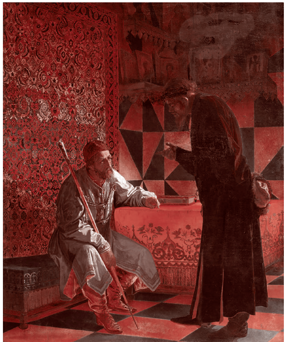
Григорий Седов. Иван Грозный и Малюта Скуратов. 1871