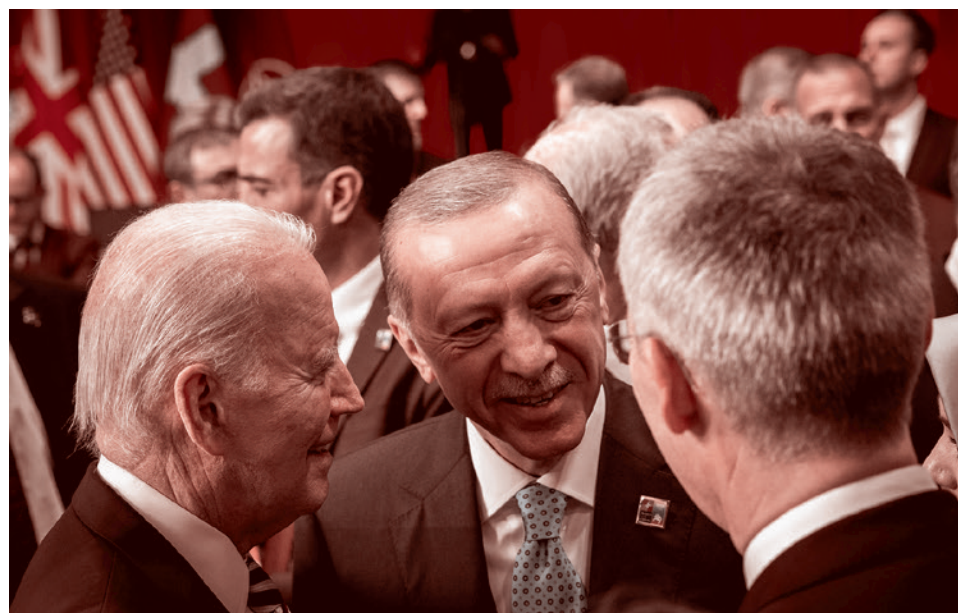
Президент США Джо Байден с президентом Турции Реджепом Тайипом Эрдоганом и генсекретарем НАТО Йенсом Столтенбергом на заседании Совета НАТО–Украина на уровне глав государств и правительств. 2023

Он отмечает, что «сейчас, в разгар военных действий на Украине, мы являемся свидетелями очередных изменений в политике Турции. В последние дни сообщалось, что Турция согласилась одобрить вступление Швеции в НАТО. Она также передала часть сил «Азова»** Украине. По мере того, как происходят эти изменения в позициях, в последний месяц также всплывает вопрос о связи Турции