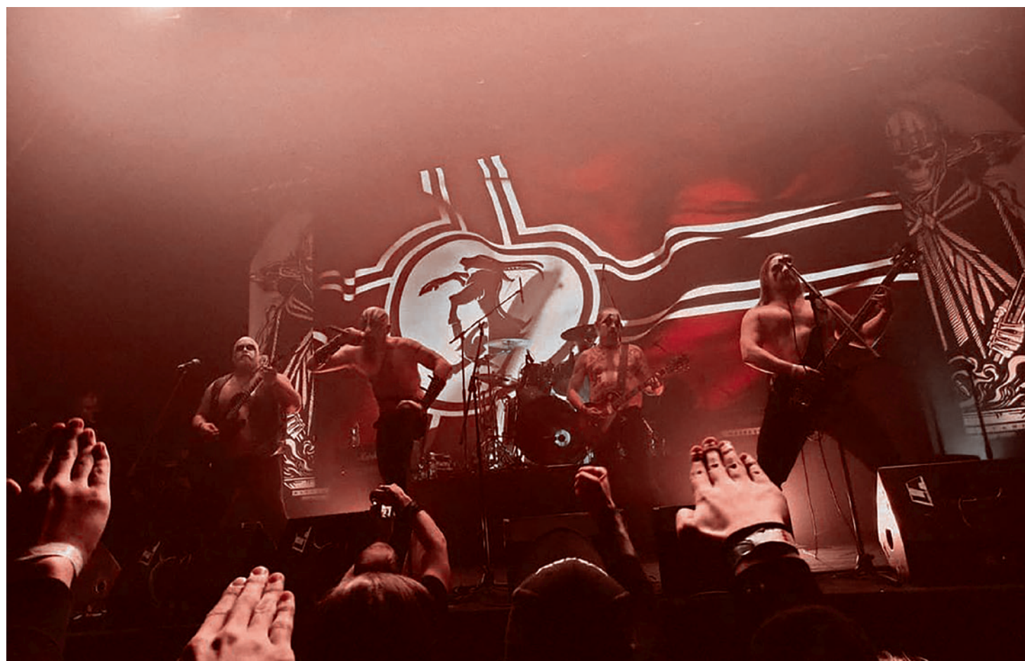
Финская неонацистская группа Goatmoon выступает на киевском фестивале Asgardrei. 2019