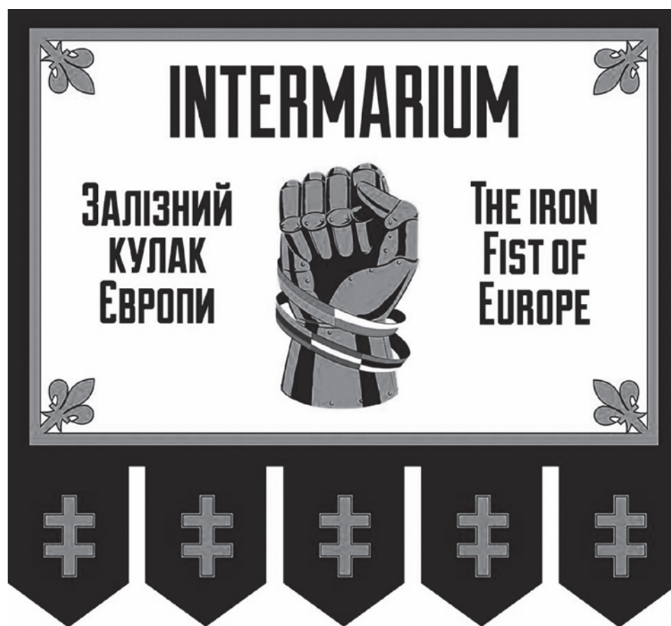
«Intermarium — железный кулак Европы». Лозунг конференции «Азова»* «Интермарийум: геополитическая альтернатива для Центральной и Восточной Европы». 2016

Азовский* Intermarium сразу же позиционировал себя как « альтернативу ЕС ». « Наша идея — мы не восток и не запад, мы — Интермарийум, Междуморье, Балто-Черноморская общность », — заявил Билецкий в том же 2016 году в интервью украинскому журналу «Фокус» и пояснил, что ядром этого союза должны стать Польша и Украина. А противостоять союз