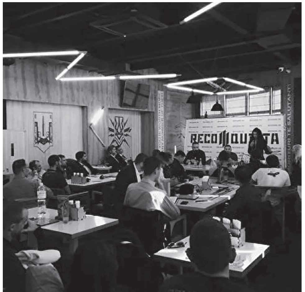
Вторая «Панъевропейская конференция» азовской* «Реконкисты». Киев. 2018

Действительно, идея Реконкисты как международного союза неонацистов с центром на Украине озвучивалась со времен евромайдана. Так, в феврале 2014 года в ролике о «Правом секторе»* под названием «Правый сектор*. Великая украинская Реконкиста» голос диктора провозглашал: «За что мы боремся?... За великую украинскую и европейскую Реконкисту!» Завершался ролик словами лидера «Правого сектора»* Дмитрия Яроша, который заявлял: «Все только начинается! Начинается возрождение Руси-Украины. Начи-