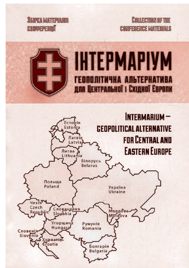
Сборник материалов к конференции «Азова»* «Интермарийум — геополитическая альтернатива для Центральной и Восточной Европы». 2016