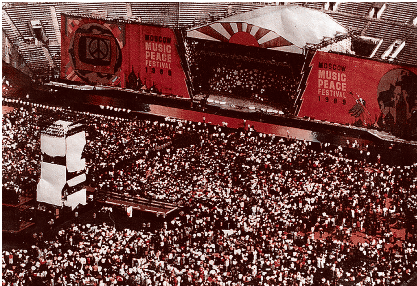
Лужники, 1989 г. Московский международный рок-фестиваль, организованный «Центром Стаса Намина» и Советским комитетом защиты мира

никать западная контркультура: рок-музыка, битломания, хиппи, джинсы, длинные волосы, наркотики. Новые неформалы к началу 1970-х годов образовали целое движение в масштабе страны с самоназванием «Система», включавшее места тусовок во всех крупных городах и сеть «флетов» — квартир, где каждый хиппи мог провести ночь. Со временем к «Системе» присоединились панки и металлисты.