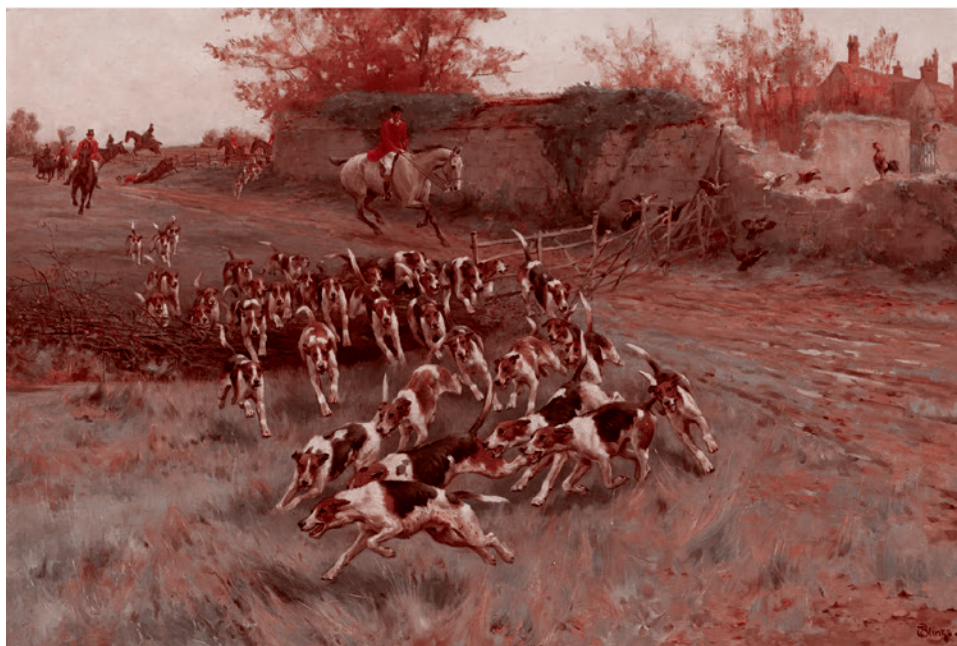
Томас Блинкс. Английская охота. Конец XIX — начало XX