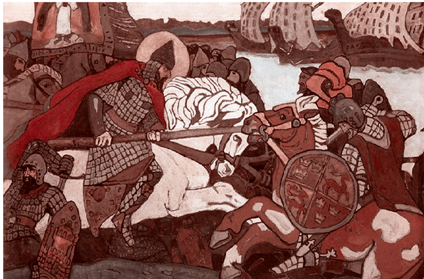
Н.К.Рефих. Александр Невский поражает ярла Биргера. 1904