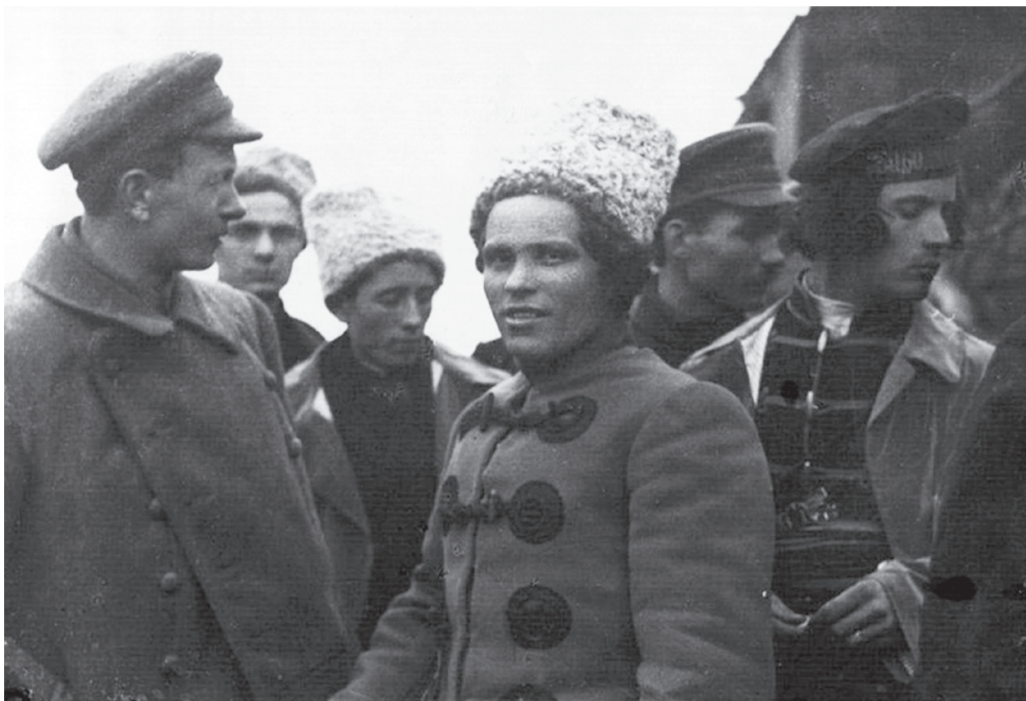
Нестор Махно (в центре). 1919