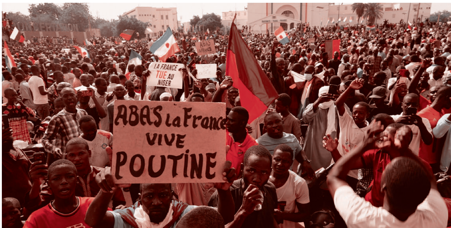
Протесты в Нигере. 2023

Необходимость безоговорочной поддержки Украины, высказанная экспертами