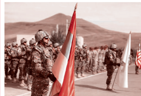
Совместные военные учения Армении с США Eagle Partner 2023