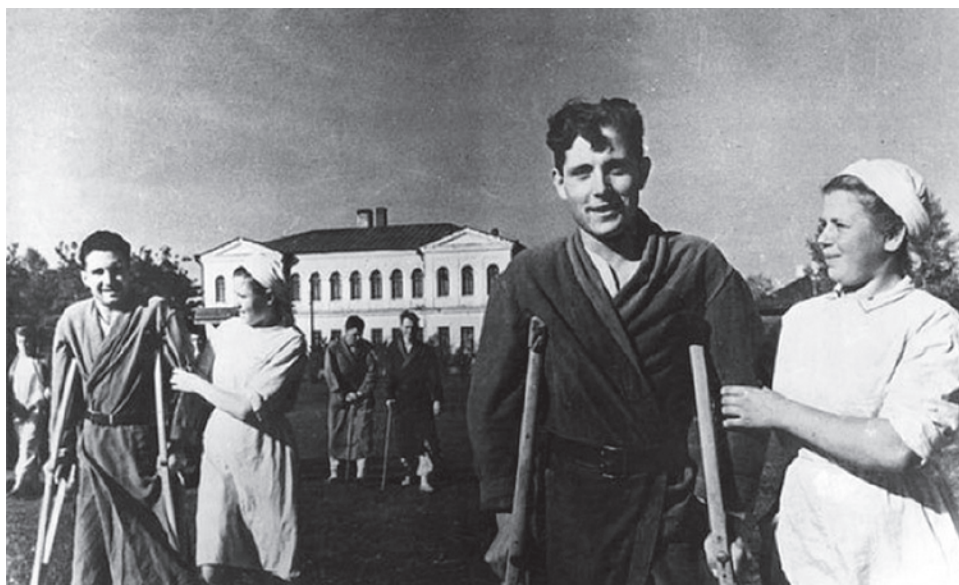
Раненые красноармейцы во время прогулки в госпитале. 1941–1945