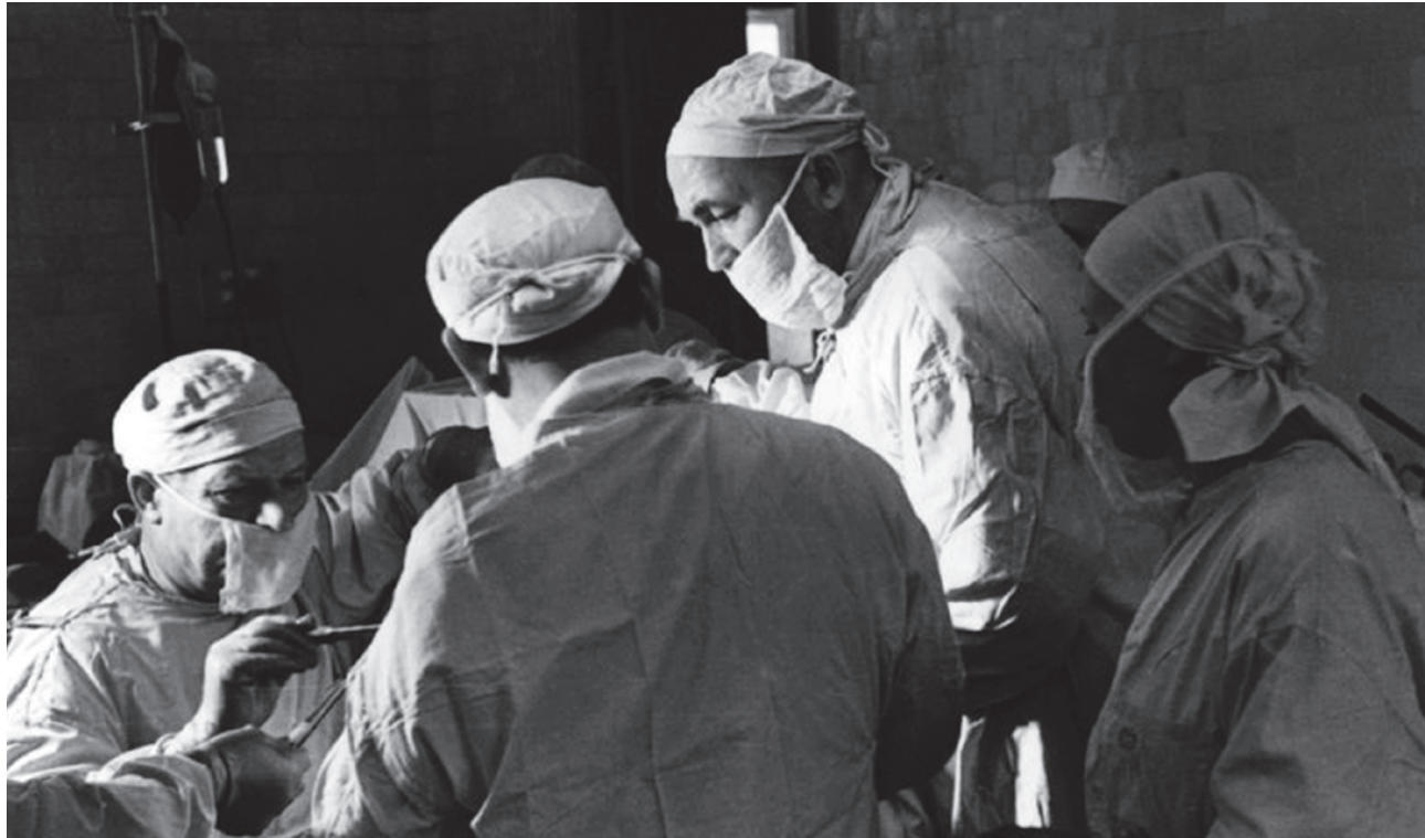
Главный хирург Красной Армии Н. Н. Бурденко во время операции

Воины Красной Армии знали, что медицина СССР находится на высоком уровне