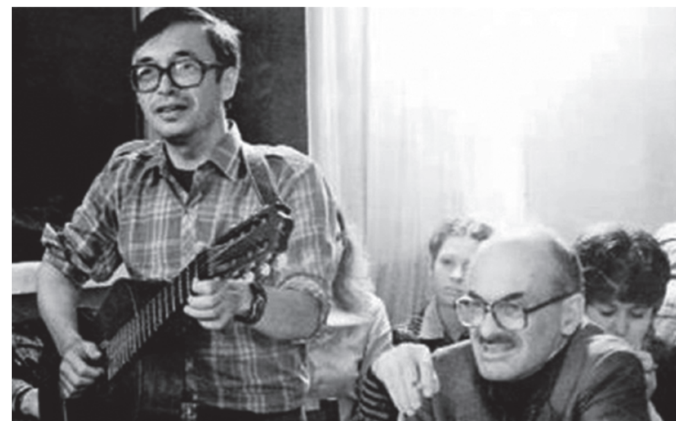
Юлий Ким и Булат Окуджава

В последней трети шестидесятых в среду советской молодежи начала про-