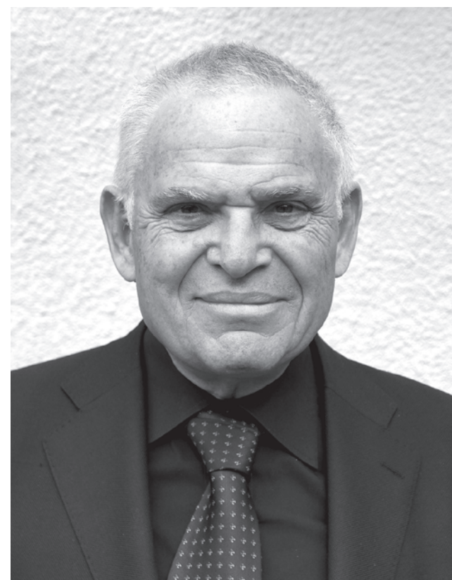
Американский историк Эдвард Люттвак

Да нет, милье, не отдельный случай! Вы эту войну экзистенциальную соединяете с образом жизни из «шоколада» — и возникает гибрид. Этот гибрид абсолютно контрпродуктивен. Как говорилось в известном анекдоте, «Вы либо крестик снимите, либо шайкой прикройтесь». Нельзя одновременно за-