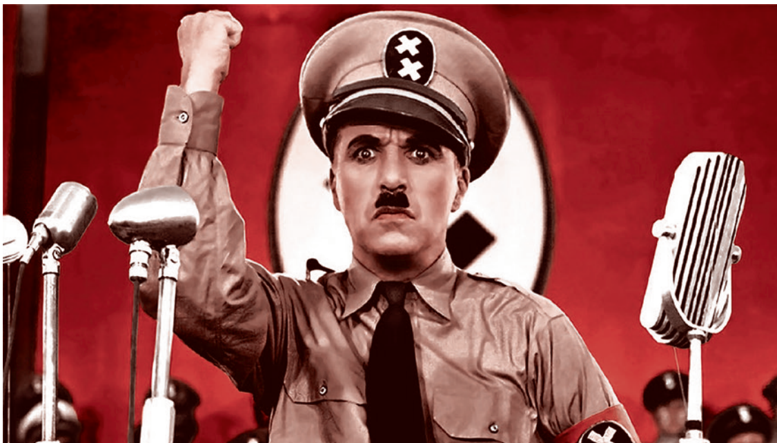
Комик Чарли Чаплин в роли Гитлера. Цитата из фильма «Великий диктатор». Режиссер Ч. Чаплин. 1940

Что является для этой военной богемы — на протяжении всей истории — козырной картой? Плохое обеспечение армии. Не поверите? Пожалуйста. Вот был такой генерал Дюмурье Шарль Франсуа, героический офицер, участник Семилетней войны, многократно раненый, имеющий высшие награды от Людовика XV, разработавший разные планы. Но он шустрил не в Африке, а на Корсике или где-нибудь еще. Он был дипломатическим представителем, разрабатывал планы того, как именно Франция должна захватить Корсику. Потом интриги привели к тому, что он попал в Бастилию. Потом Людовик XVI его вывел, наградил высокими орденами. Потом он перебежал к жирондистам. Потом к якобинцам. В итоге он стал прекрасным организатором революционной французской армии, великолепным! Он гениально осуществил отступление в Арденнах, он потом победил пруссаков в битве при Валь-