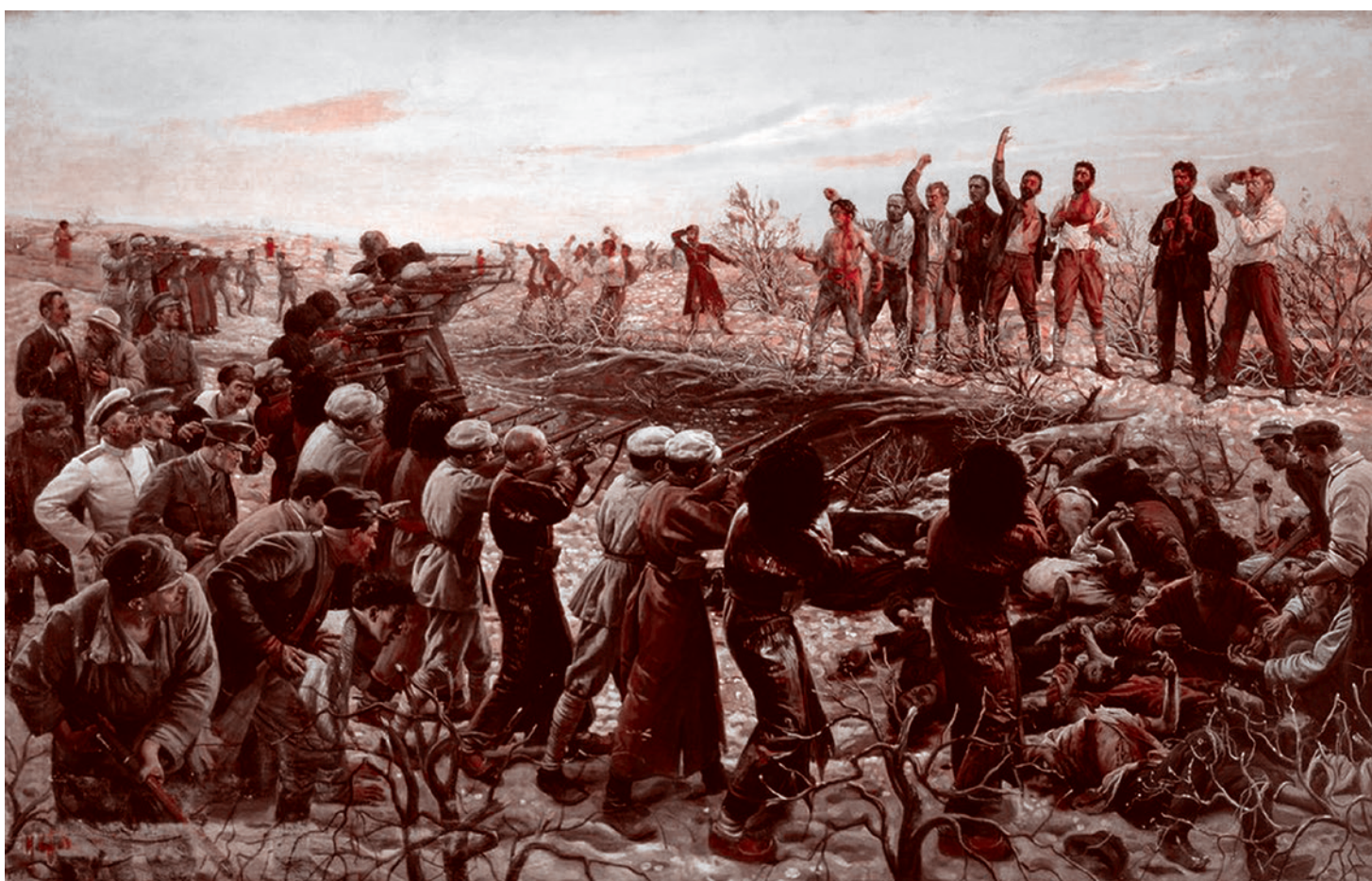
Исаак Бродский. Расстрел 26 бакинских комиссаров. 1925

Планируется, что через территорию Ирана Индия будет иметь выход в Европу. Это гораздо короче, чем гонять корабли вокруг Африки или через Суэцкий канал. Это достаточно действенные и ин-