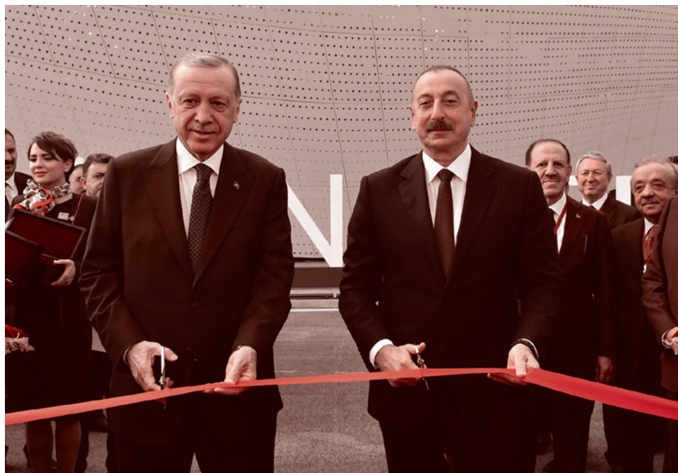
Президент Азербайджана Ильхам Алиев и президент Турции Реджеп Тайип Эрдоган на открытии Зангиланского аэропорта в Карабахе. 20 октября 2022

Но и турецкое восприятие азербайджанцев тоже специфично. Для турка азербайджанец — это презренный шиит. В народе такое отношение к ним было всегда. А то, что творится наверху, в правящих