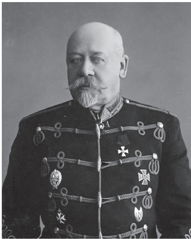
Военный министр Российской Империи генерал от кавалерии Владимир Сухомлинов

писания. Только сами требования были весьма скромными, и при имевшемся количестве орудий боеприпасов накопили меньше положенного по нормам: на 512 гаубиц 122-мм — 449,5 тысячи выстрелов (87,8%), на 164 гаубицы 152-мм — 99,9 тысячи выстрелов (60,9%), на 76 пушек 107-мм — 22,3 тысячи выстрелов (24,5%).