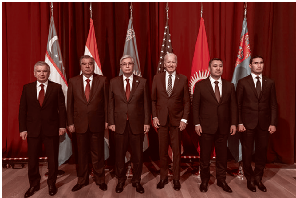
Лидеры стран Средней Азии и США в формате С5+1

По ее данным, 19 сентября в соответствии с программой пребывания в Нью-Йорке Мирзиёев принял участие в первом саммите лидеров стран Средней Азии и США в формате С5+1, в ходе которого его участники обсудили перспективы развития торгово-экономического сотрудничества, а также взаимодействия в вопросах региональной безопасности и борьбы с терроризмом и трансграничной преступностью.