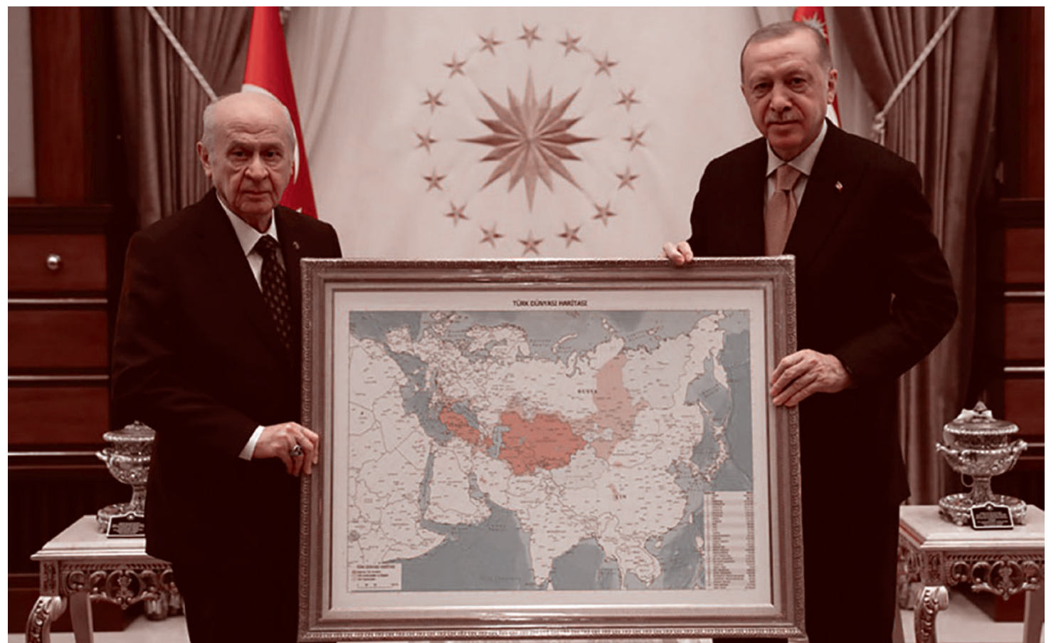
Девлет Бахчели (слева) и Реджеп Эрдоган