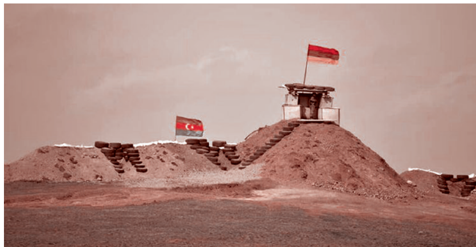
Граница Азербайджана и Армении. Аппарат президента республики Армения