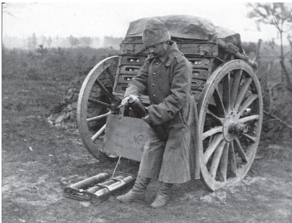
Зарядный ящик (1915–1916)

Газета «Суть времени» зарегистрирована Федеральной службой по надзору в сфере связи, информационных технологий и массовых коммуникаций (Роскомнадзор) Свидетельство ПИ № ФС77–50554 от 9 июля 2012 года