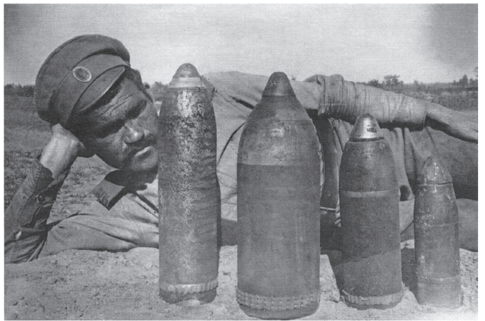
Солдат пехотного полка со снарядами. 1915–1916

Но подобные условия выпадали всё реже — уж слишком ужасным было зрелище изрешеченных шрапнелью или осколками сослуживцев. Поэтому сражающиеся быстро поняли, насколько опасно движение и вообще нахождение на открытом пространстве без огневого подавления про-