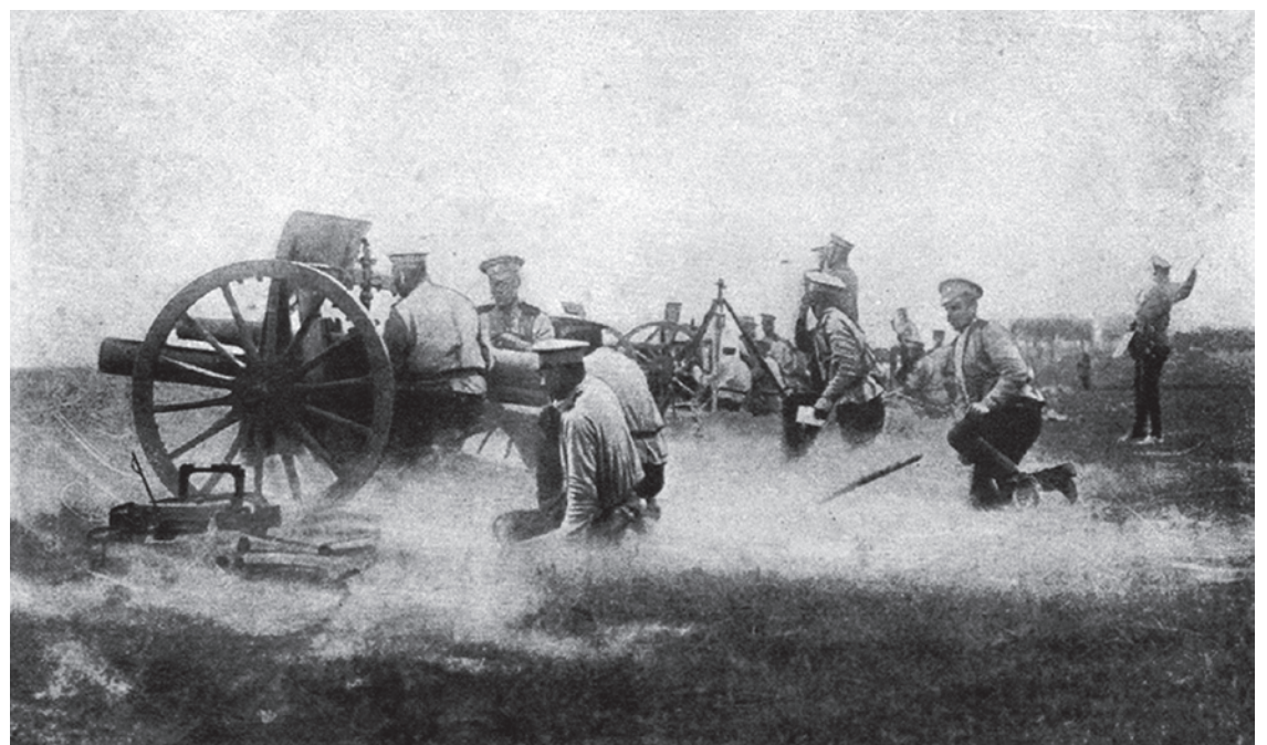
Русская батарея в бою. Великая война в образах и картинах. 1914

С полевой средней и тяжелой артиллерией обошлось без такого нигилизма, количество орудий в ней не слишком уступало требованиям мобилизационного рас-