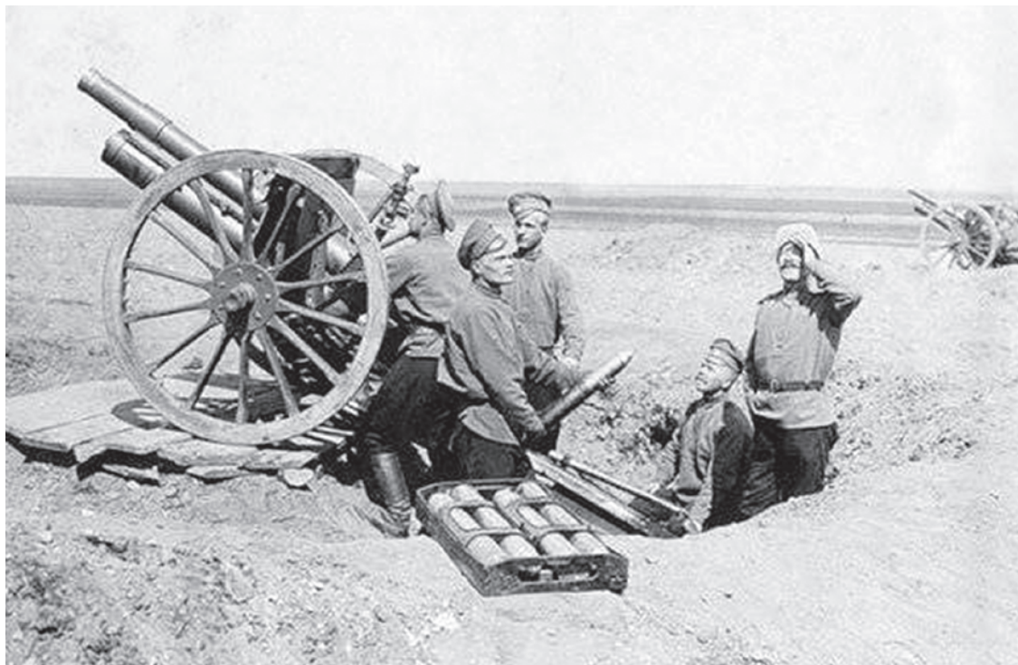
76-мм пушка образца 1902 года

К лету 1914 года положение с обеспечением Русской армии вооружением и боеприпасами могло считаться хоть и не столь благостным, как расписывал Сухомлинов, но относительно неплохим. Во всяком случае, если сравнивать с положением дел у союзников и противников и в контексте преобладавших тогда ожиданий относительно характера приближавшейся войны и потребностей войск в ней. Преобладали же представления, что военное столкновение ведущих мировых держав будет чрезвычайно напряженным, но скоротечным —