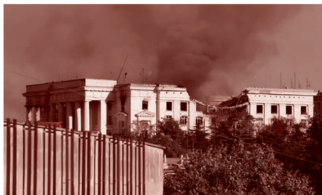
Штаб Черноморского Флота РФ после обстрела