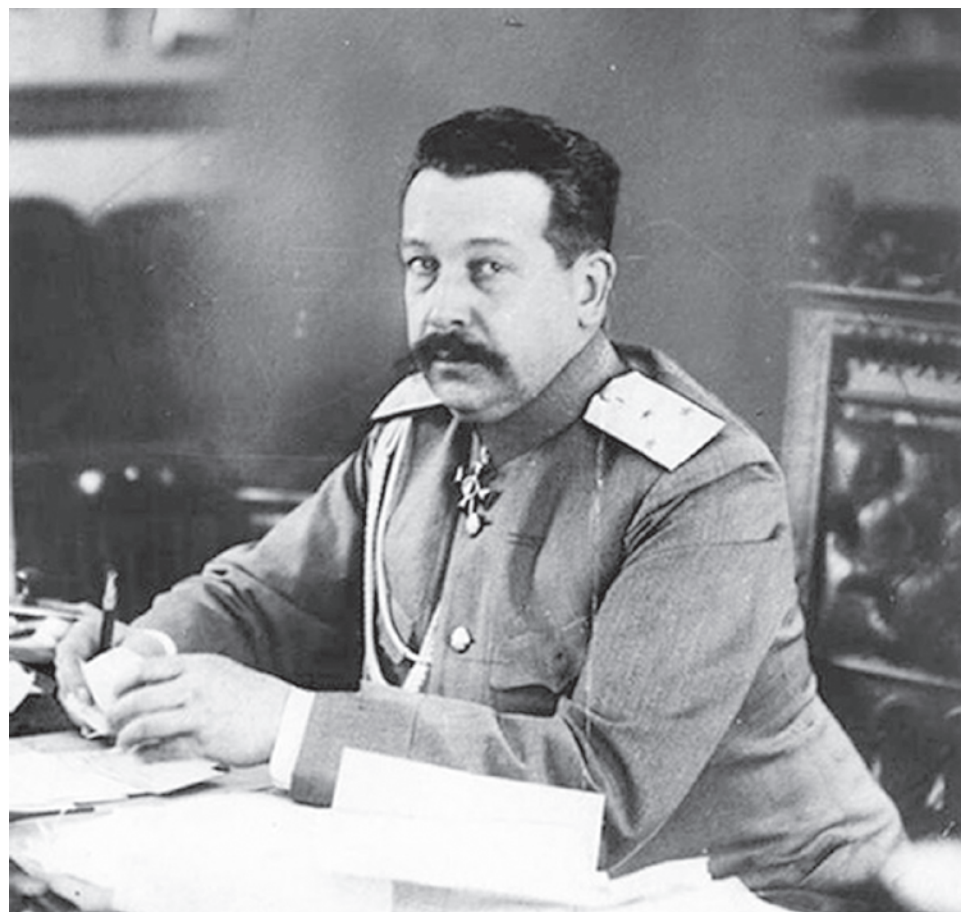
Начальник штаба Верховного Главнокомандующего Русской армии в Первую мировую войну Николай Янушкевич

Естественно, поступление боеприпасов из местных парков не могло покрыть расход, намного превзошедший ожидания, так что возимые действующими войсками запасы стремительно истощались. Возникшие в такой ситуации настроения у артиллеристов на фронте описал в своем труде «Боевое снабжение Русской армии в мировую войну» генерал Алексей Алексеевич Маниковский: «Им было ни тепло, ни холодно от того, что где-то там в тылу имеются еще склады выстрелов. Им вынь да подай эти выстрелы в их возимый запас, в их летучие парки». Отметим, что Маниковский высказал и ряд спорных суждений, в том числе нацеленных на оправдание несомненных просчетов Глав-