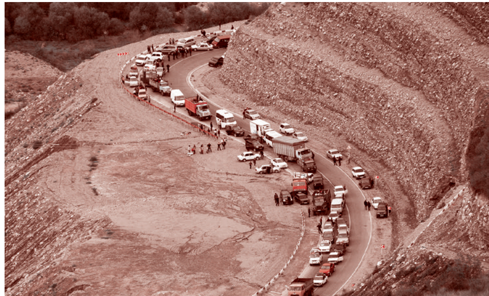
Автомобильная пробка на выезде на границе из Нагорного Карабаха

Вслушаемся как подобает в звон этого колокола. Поймем, что он звонит по нам. И предуготовимся, поелику это возможно.