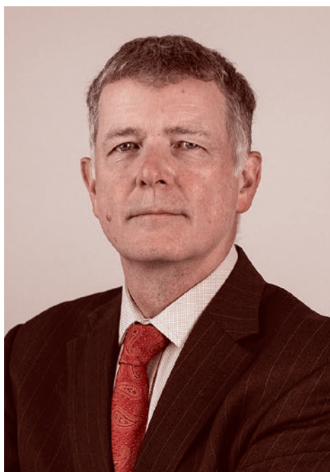
Глава М16 Ричард Мур