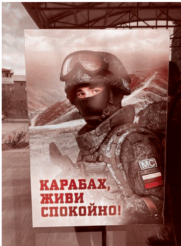
Постер на автобусной остановке в Степанакерте

Что сделали мы? Мы тоже заговорили о туранизме и неоосманстве. Вот это понять можно только в логике эзков, которым нужны покровители. Евразия, господа и товарищи, срочно перекрашивающаяся из западничества в «а ля рус», была изобре-