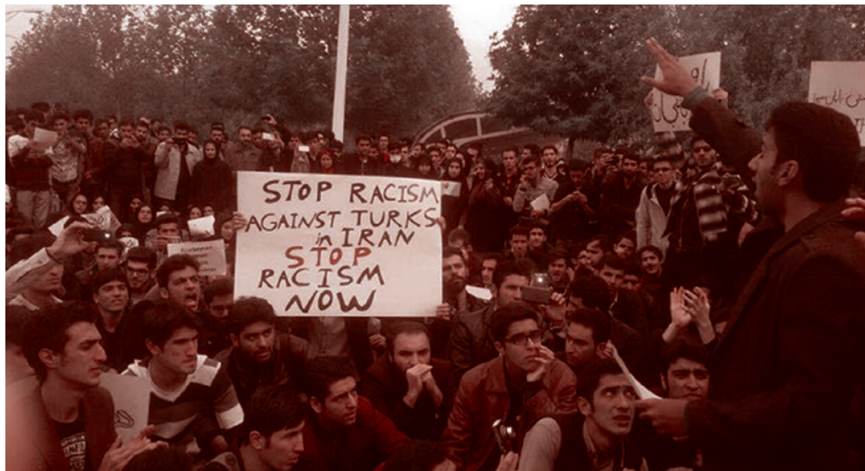
Акции протеста азербайджанцев в Иране. 2015

классах, кругах, отличается от отношения обычных верующих. Это тоже играет роль, конечно.