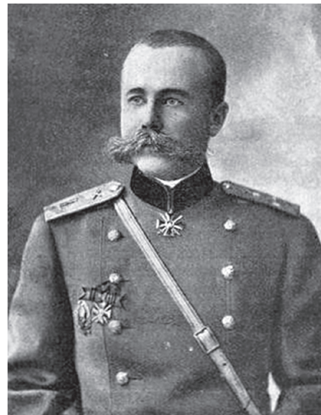
Генерал от артиллерии Алексей Маниковский

Сравнение величины расхода с предвоенным запасом, конечно, не может не вызвать вопроса: а с чего вдруг такой алар-