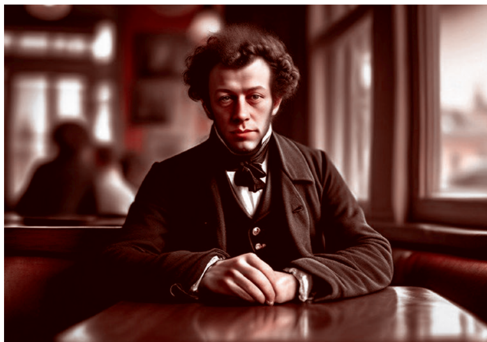
А. С. Пушкин, нарисованный при помощи ИИ

Другой подход заключается в том, чтобы усовершенствовать средства обнаружения дипфейков. Крупная база дан-