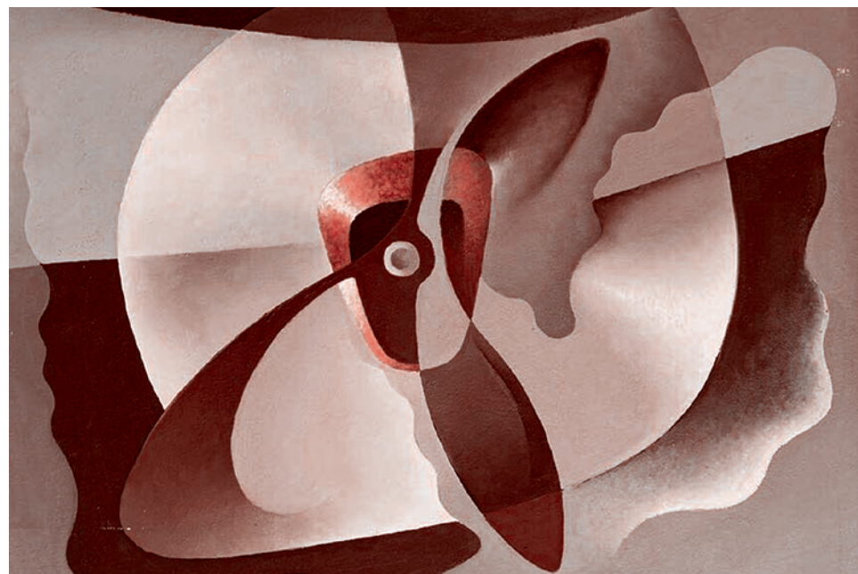
Туллио Крали. Сломался двигатель самолета. 1931

перь я руководитель практики, просто потому, что где-то кому-то надо отчитаться.