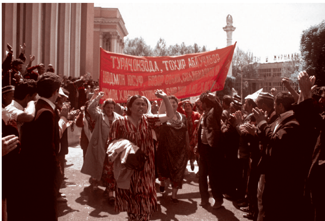
Женская демонстрация на площади Озоди, 3 мая 1992

Вдохновленные победой Набиева, ленинабдцы провели на пост руководителя Верховного Совета Сафарали Кенджаева, молодого политика центристской ориентации, лидера ягнобцев — малочисленной