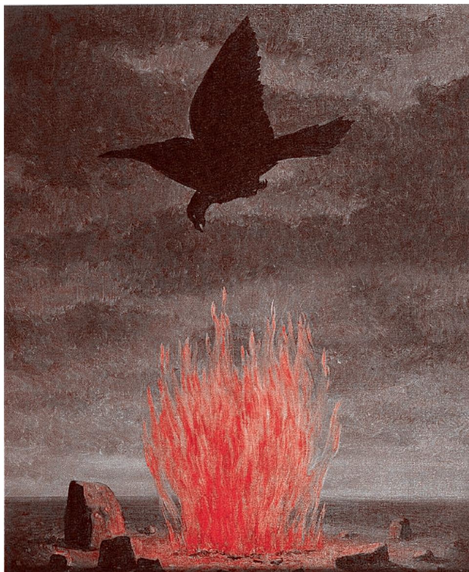
Рене Магритт. Фанатики. 1943