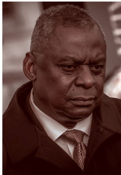
Шеф Пентагона Ллойд Остин