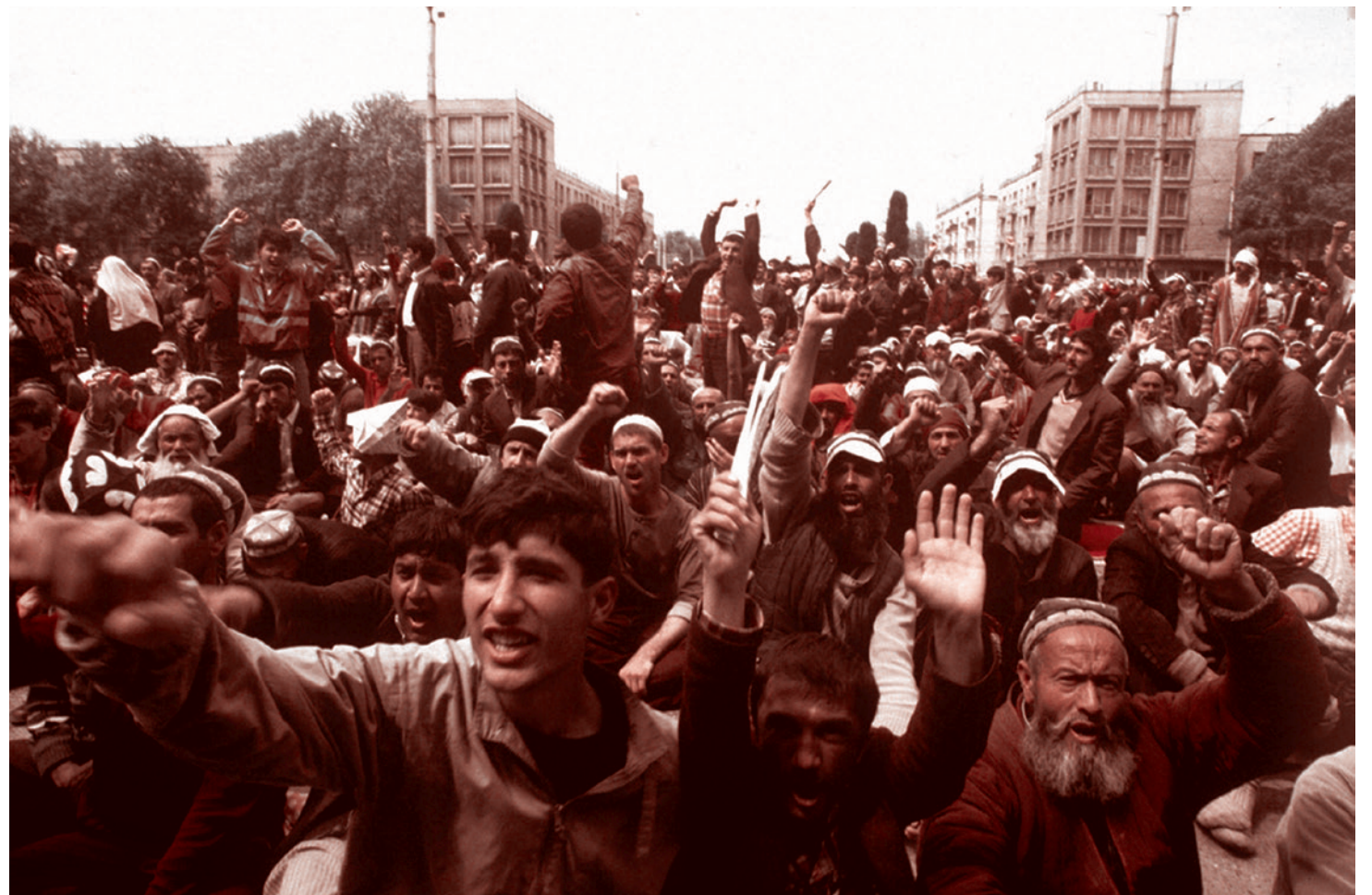
Митинг на площади Шохидон. 3 мая 1992

Конфликт приобрел новые очертания: не ленинабская номенклатура выступала против гармской торговли, а народный ислам — против насильственно внедряемой антинародной саудитской версии ваххабизма. Достаточно было донести это но-