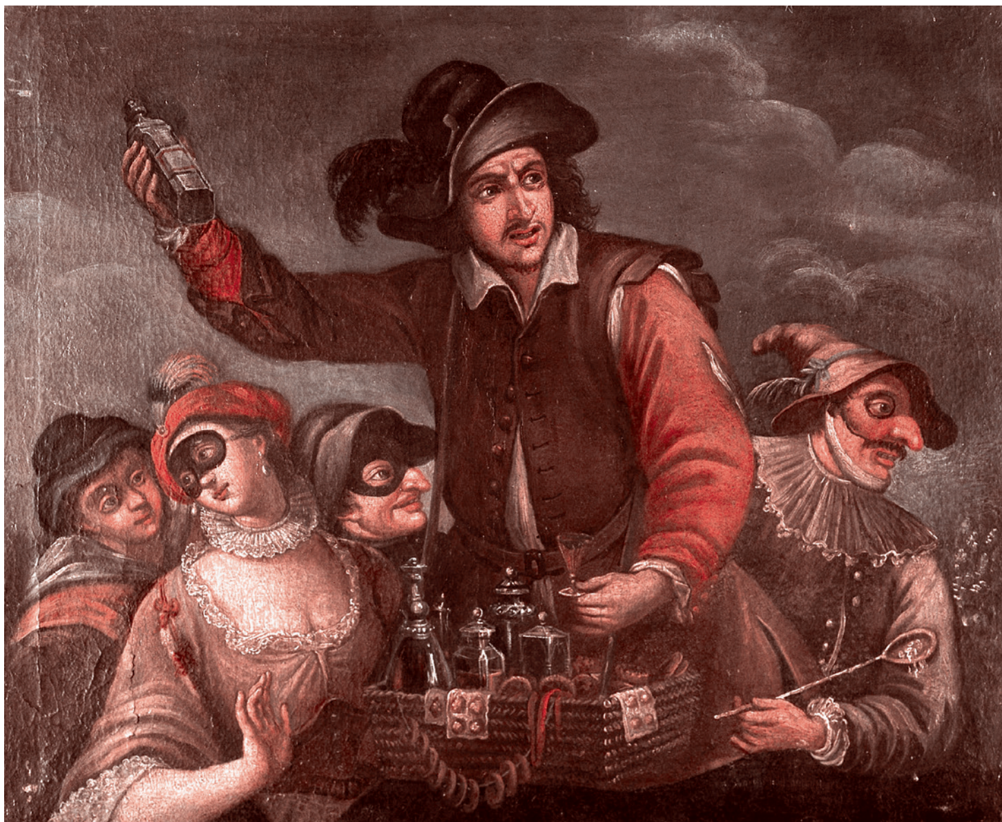
Неизвестный автор. Шарлатан, продающий лекарства. XIX век

здоров, либо умирает, возникает человек, который и живет, и нездоров, и глотает пригоршнями лекарства. Так это и есть идеальный рыночный субъект фармацевтики, именно он для нее нужен! Он должен жить и больше глотать разных лекарств. Ну это же очевидно! Теперь это самая главная инвестиционная отрасль мира.