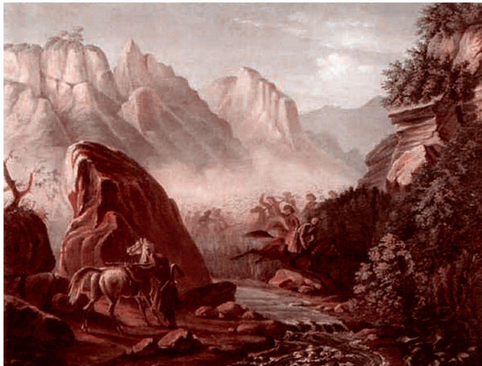
М. Ю. Лермонтов. Перестрелка в горах Дагестана. 1840—1841