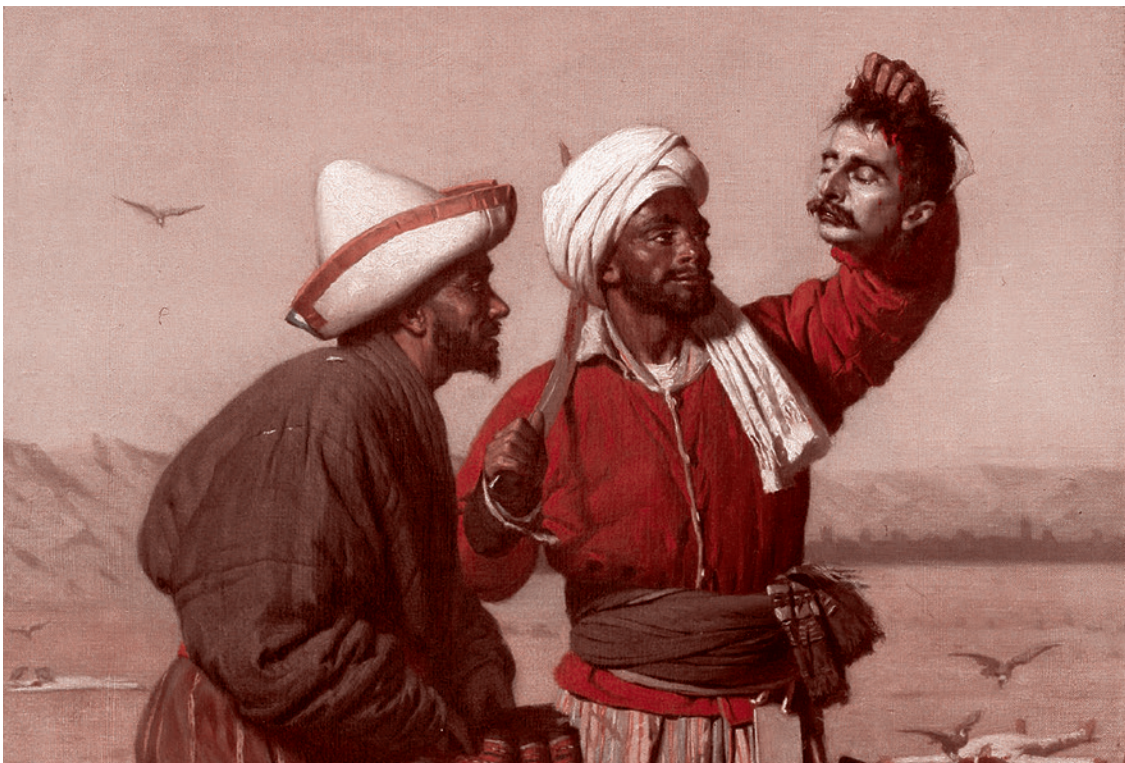
Василий Верещагин. После удачи (фрагмент). 1868