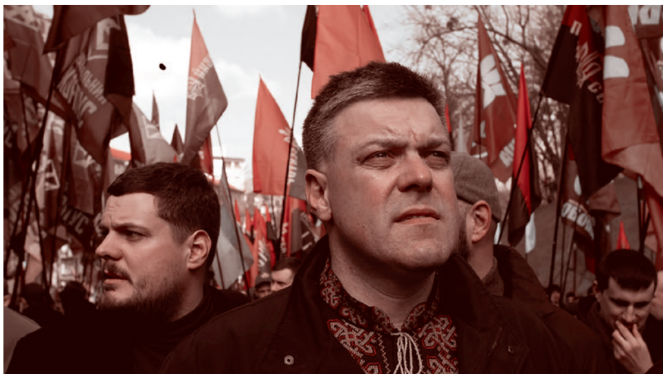
Олег Тягнибок. Митинг партии «Свобода» и «Правого сектора»*

врагом в лесу или во время уличных акций сопротивления.