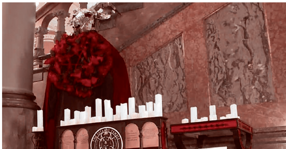
Экспозиция сатанистов в Айове

«Я надеюсь, что люди осознают, что духовная война реальна. Что существуют злые сатанинские силы, которые пытаются проникнуть в наше государство», — сказала она.