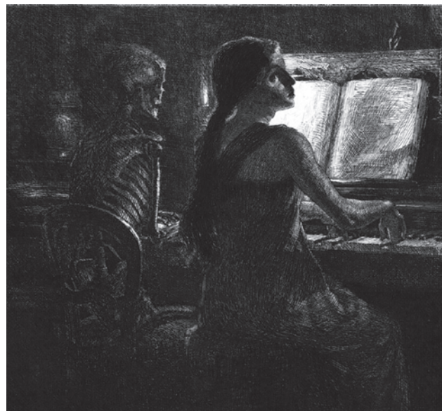
Марсель Ру. «Пьеса в четыре руки» или «Смерть играет с нами». 1905

Хотелось бы верить, что у России найдется чем ответить на какие-нибудь новые вирусы профессора Барика и других, помимо копирования западного подхода и внедрения должным образом непротестированной генной терапии. Отметим, что область нормализации работы иммунной системы обходится официальной медицинской молчанием и отдала на откуп натуропатам, но это самое эффективное направление, если иметь в виду здоровье нации.