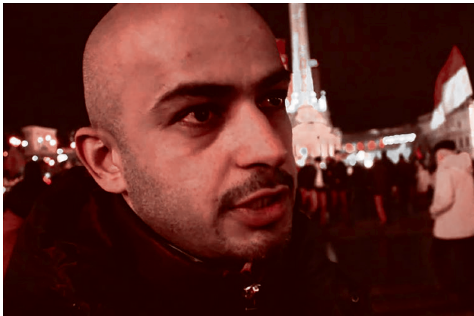
Мустафа Найем. Митинг в Киеве, ноябрь 2013

Диверсантам тогда удалось взорвать полотно железной дороги Таллин — Ленинград, в группу вступило около двух тысяч эстонских ополченцев, но затем она была окружена войсками Красной Армии и в полном составе уничтожена в одном из болот Северной Эстонии. В честь этой диверсионной группы на территории Эстонии ежегодно проводится международная военно-диверсионная игра EгnaRetk («Поход Эрны»), включающая и тематические тактические занятия, к примеру — борьба с