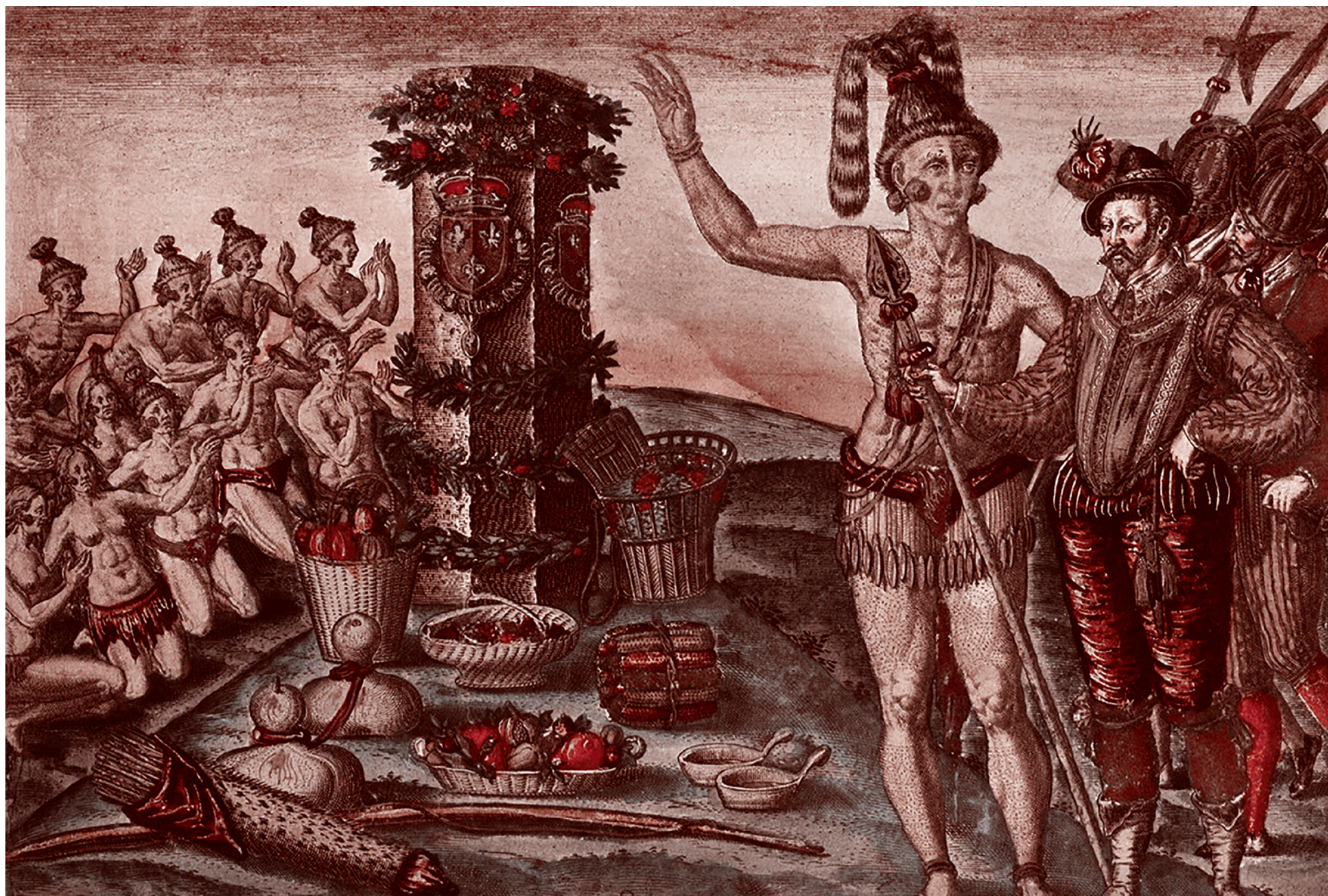
Теодор де Бри. Коренные жители Флориды поклоняются колонне, установленной предводителем колонизаторов. Иллюстрация из книги «Великие путешествия». 1596

Начавшись почти два года назад, СВО с каждым днем всё стремительней и очевиднее превращалась из спецоперации против бандеровского режима в геополитическую войну против коллективного Запада. Причем о ее быстром завершении говорить не приходится.