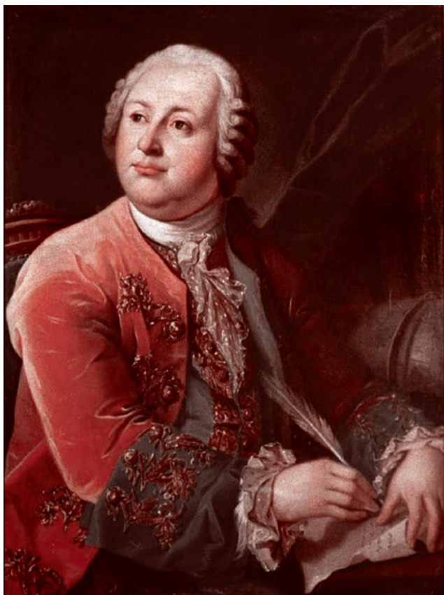
Леонтий Мировольский. Михаил Ломоносов. 1787

грегации и всего остального, на многих ресторанах еще были таблички «евреям и собакам вход воспрещен». И это происходило в стране, власти которой называли Zionist Occupation Government — там якобы одни евреи господствуют. Рузвельт впервые пустил их в политику. Это был очень специфический нацистский мир. И вдруг по другую сторону этого мира, который уже катился к нацизму — и Алексей Толстой очень хорошо понимал, как именно, — задолго до Гитлера, вдруг появилась коммунистическая альтернатива, которая разгромила нацизм. И все понимали, что это сделали русские.