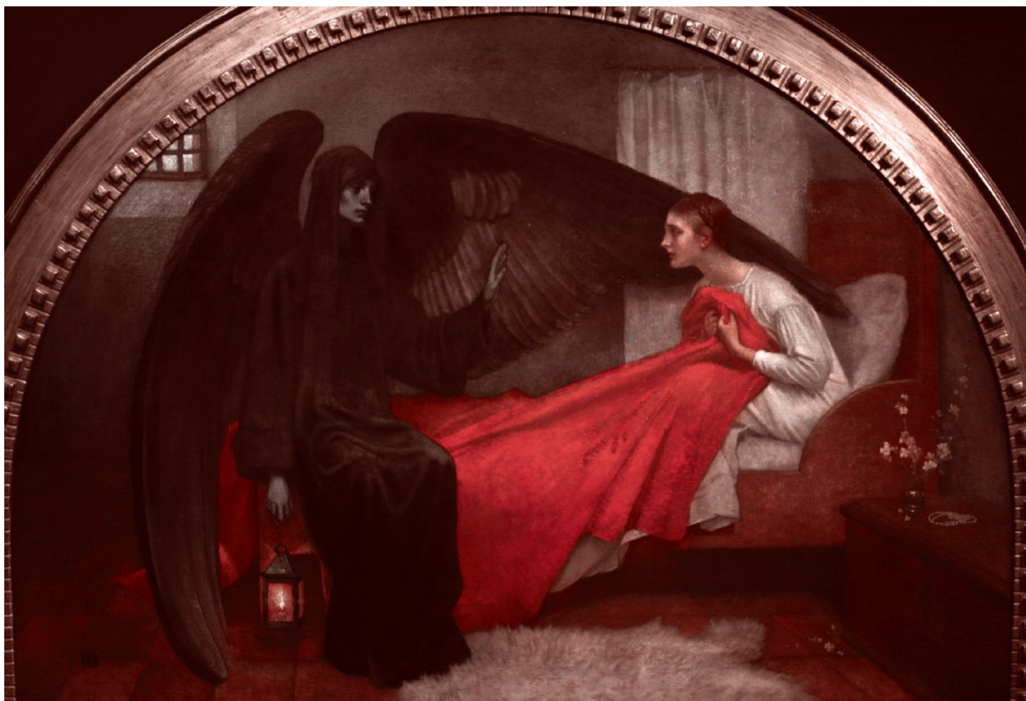
Марианна Стоукс. Смерть и дева. 1908

Фильм «Цирк» не так прост, как это кажется. Надо помнить, каким был тогдашний Запад, в котором, помимо се-