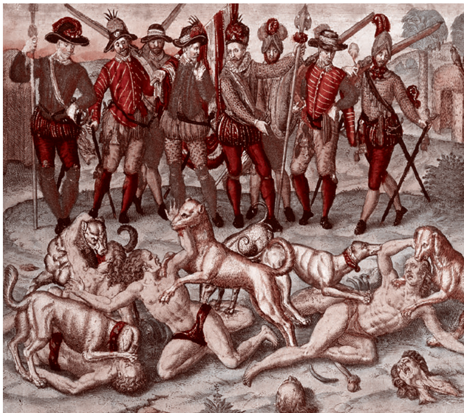
Теодор де Бри. Травля индейцев собаками. Иллюстрация из книги «Великие путешествия». 1596

При этом представления об украинской свободе у Прошинского весьма специфические, поскольку, говоря о своей уверенности в победе над Россией, он тут же добавляет, что главный вопрос заключается в том, под чьим протекторатом будет вставать на ноги Украина после предполагаемой «победы». Причем под победой