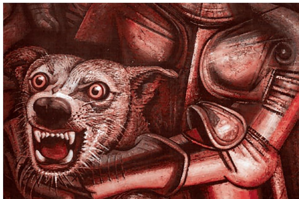
Хосе Давид Альфаро Сикейрос. Фрагмент фрески «Портрет буржуазии». 1950–1951

Можно создать профессиональную трехмиллионную армию: меньше нельзя для будущего, если я прав в том, как именно нас ненавидят. Можно этой армии дать соответствующую экономику. Можно дать ей нужное оружие, и можно развить хотя бы станкостроение и еще 3–4 отрасли. Это можно сделать за оставшиеся нам 5–7 лет. Эта ненависть обернется страшными вещами для русских, если мы не продемонстрируем несокрушимую силу и самодостаточность — и идеологическую, и материальную. Это то, что касается практики.