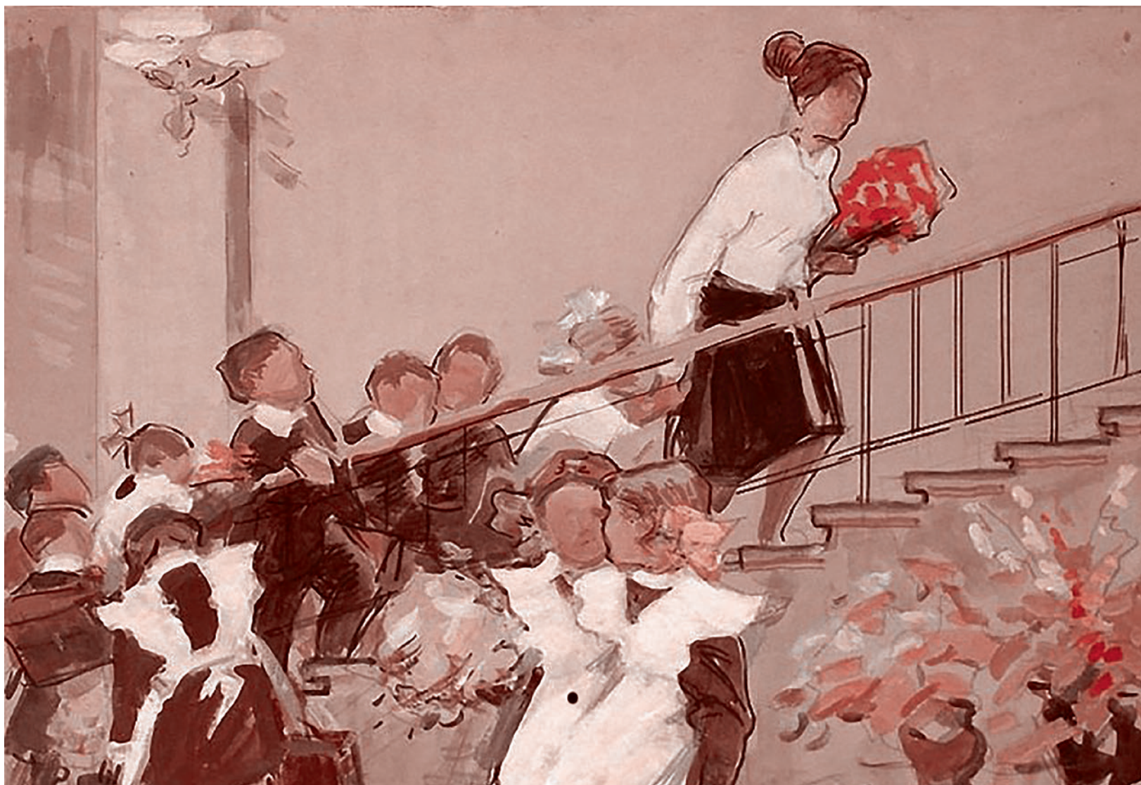
Павел Семячкин. Первоклассники . 1960-е

Газета «Суть времени» зарегистрирована Федеральной службой по надзору в сфере связи, информационных технологий и массовых коммуникаций (Роскомнадзор) Свидетельство ПИ № ФС77-50554 от 9 июля 2012 года