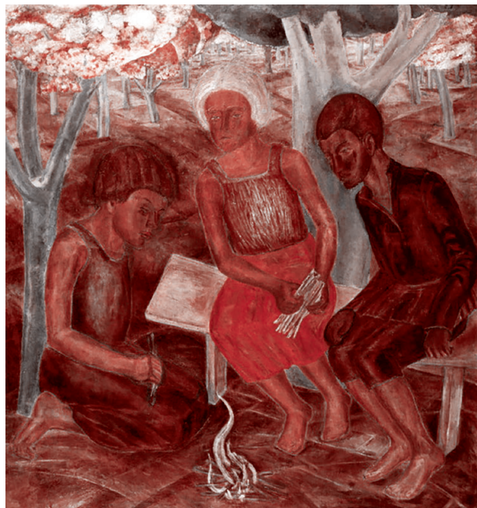
Павел Голубятников. Дети в саду. 1928