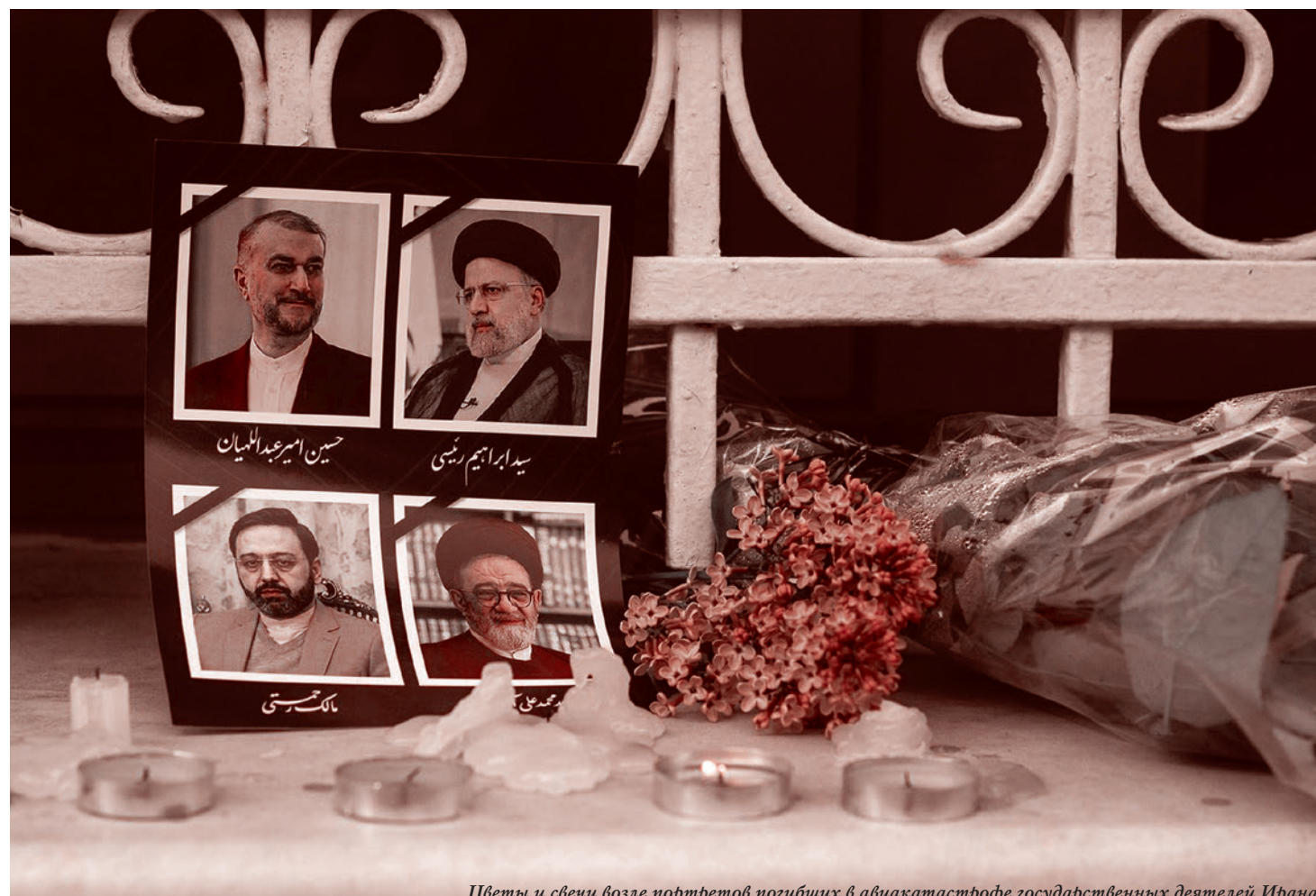
Цветы и свечи возле портретов погибших в авиакатастрофе государственных деятелей Ирана