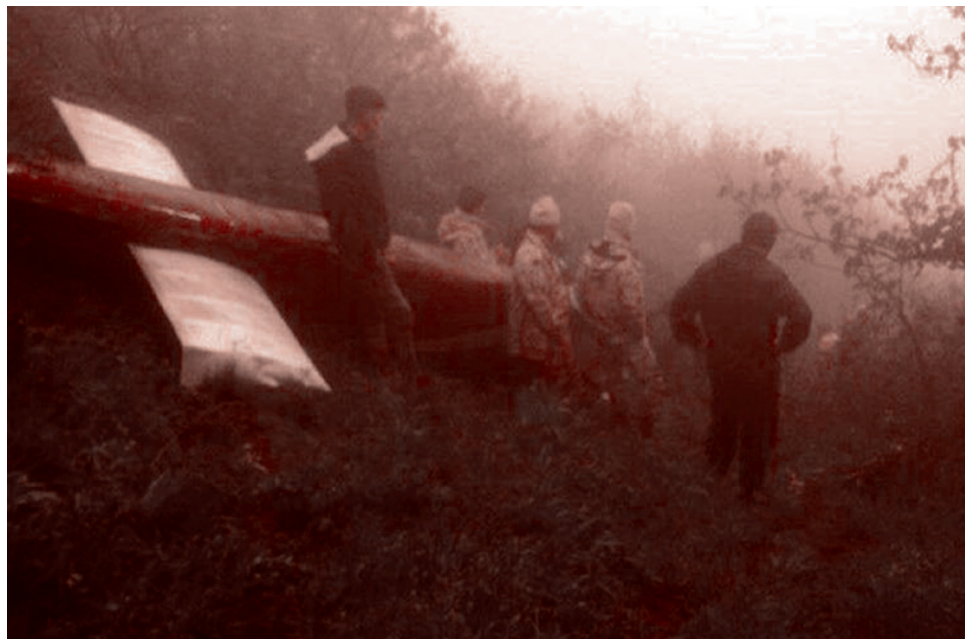
Обломки вертолета, на котором летел Раиси

Такой деталью оказалась белая рубашка, в которую был одет на открытии шестого созыва Ассамблеи экспертов по лидерству бывший президент Ирана Махмуд Ахмадинежад. Тот самый, который, во-первых, счел возможным не присутствовать на похоронах Раиси, и, во-вторых, в совсем уж обязательном соболезновании по поводу смерти Раиси почему-то не на-