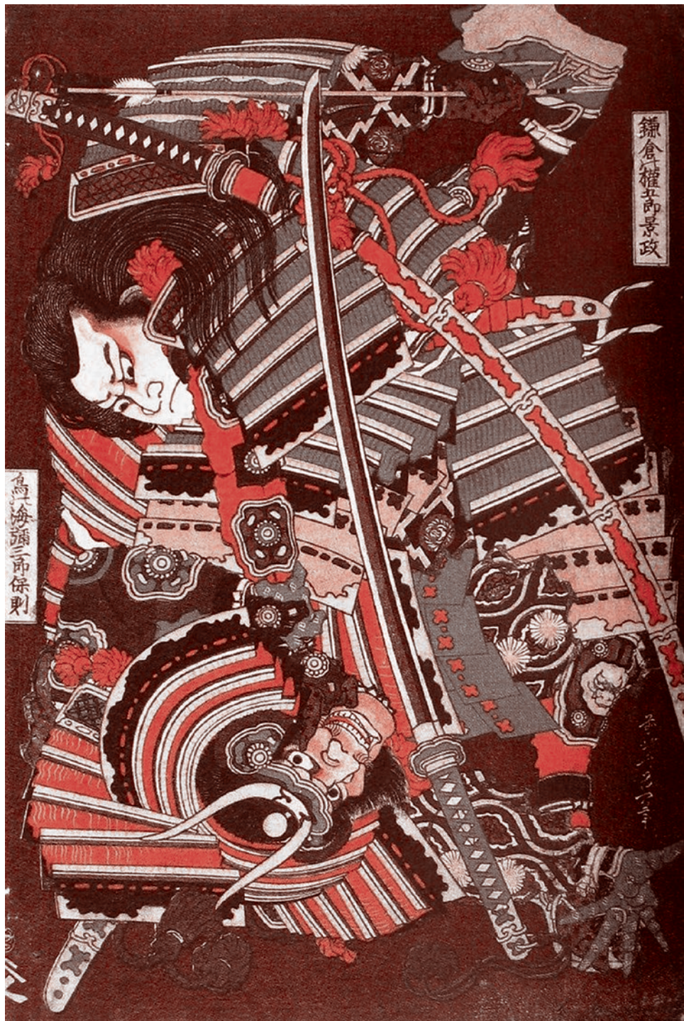
Кацусика Хокусай. Бой героев. 1827–1832

Япония занимает лидирующее место по оказанию помощи развивающимся странам. Однако для выстраивания тесных отношений со странами АТР одной финансовой поддержкой не обойдешься, мешают «проблемы исторического прошлого». В 1990-х годах власти Японии заговорили о раскаянии за военные преступления и оккупацию сопредельных государств.