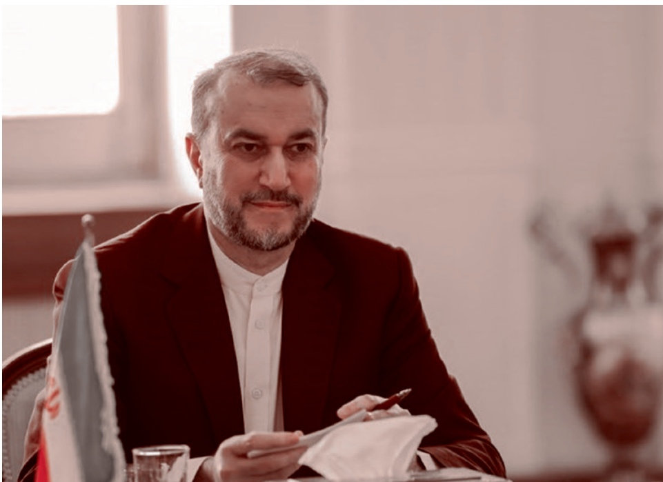
Министр иностранных дел Ирана Хосейн Амир Абдолахиян