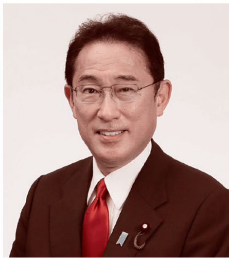
Премьер-министр Японии Фумио Кисида

одной из самых передовых армий в мире? Каковы основные этапы становления современных вооруженных сил Японии?