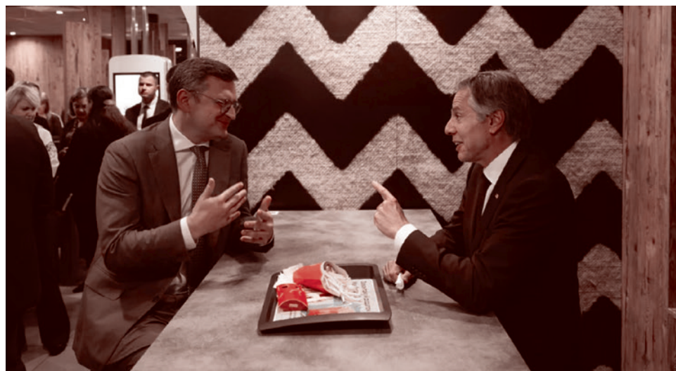
Глава МИД Украины Дмитрий Кулеба и госсекретарь США Энтони Блинкен в киевском Макдоналдсе

США позволяют Киеву самому решить, как ему вести боевые действия против России, заявил госсекретарь Энтони Блинкен на пресс-конференции в Киеве с главой украинского МИД Кулебой, комментируя