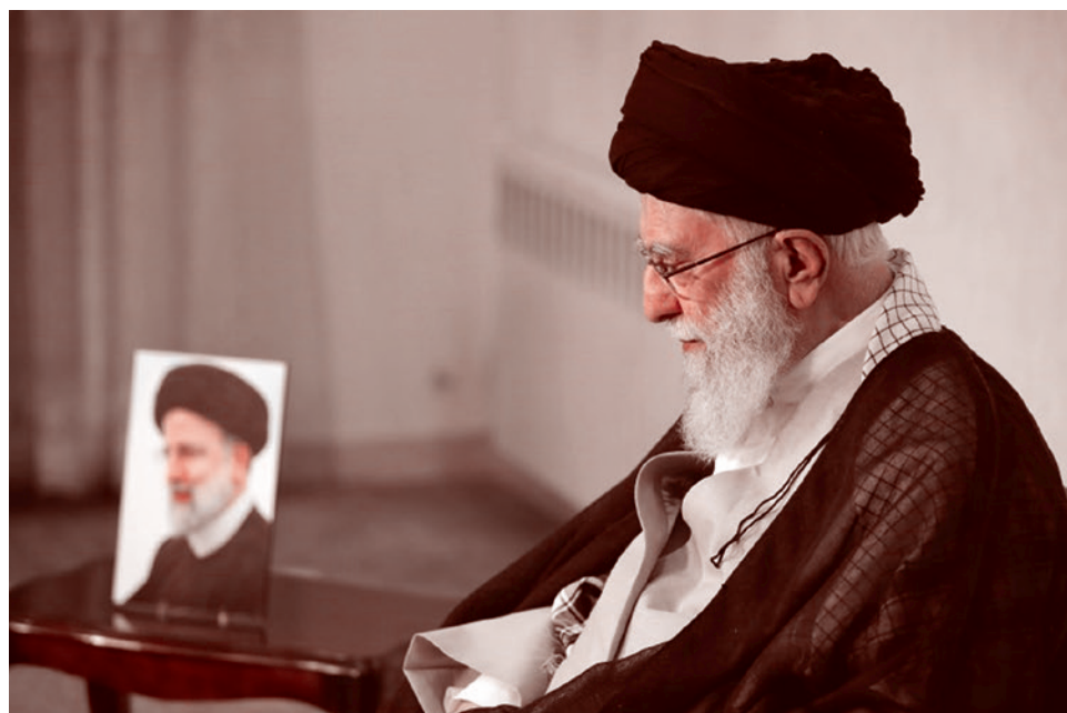
Верховный духовный лидер Ирана Али Хаменеи