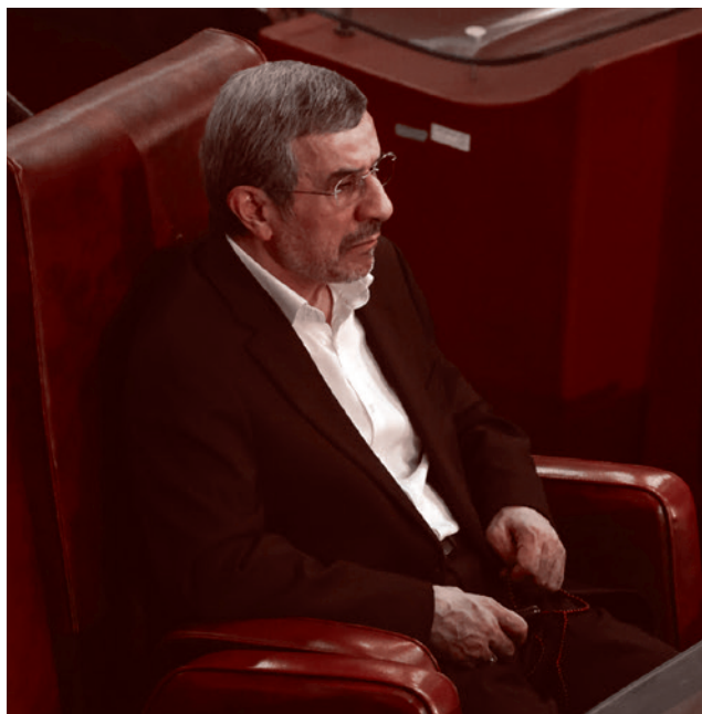
Махмуд Ахмадинежад в белой рубашке

звал Раиси «мучеником». И когда вдобавок он облачился в белую рубашку (см. фото), то это вызвало «тихий взрыв» в очень узких, но крайне влиятельных группах иранской элиты.