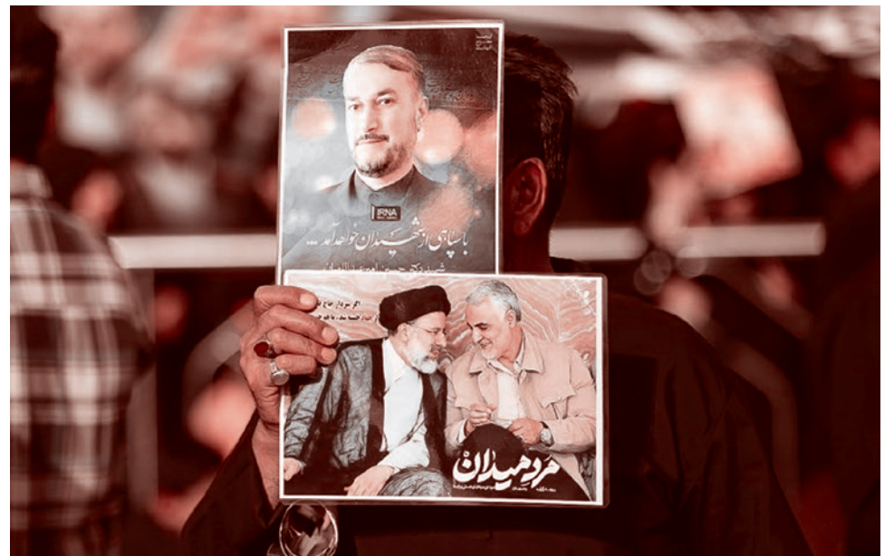
Мужчина с портретами Раиси и Абдоллахияна, погибших в результате крушения вертолета, на церемонии похорон