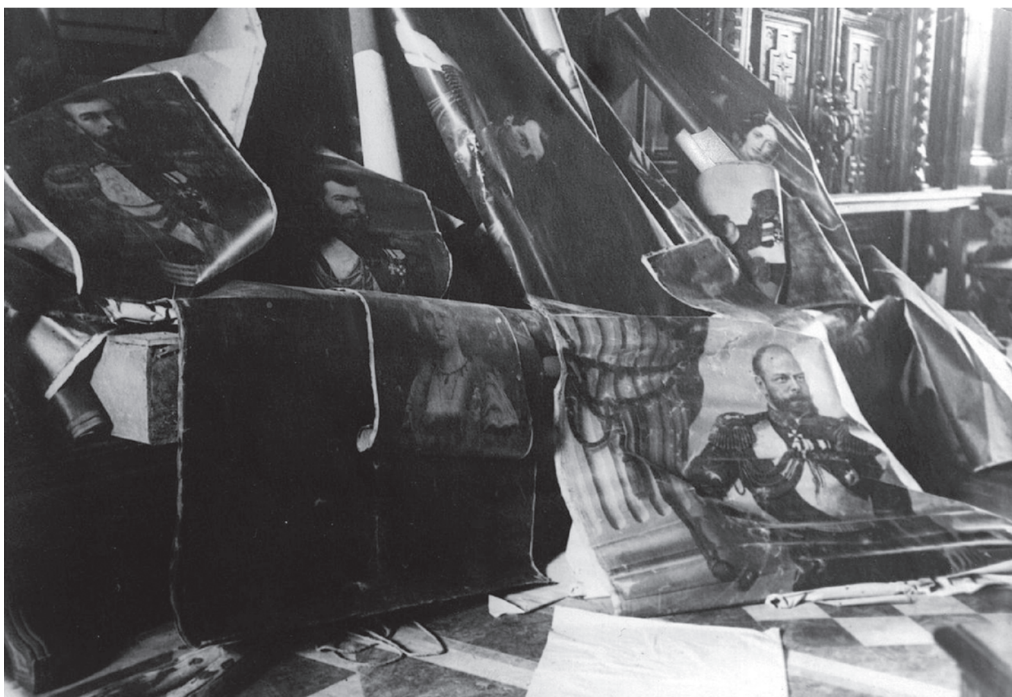
Сорванные со стен портреты представителей низложенной династии