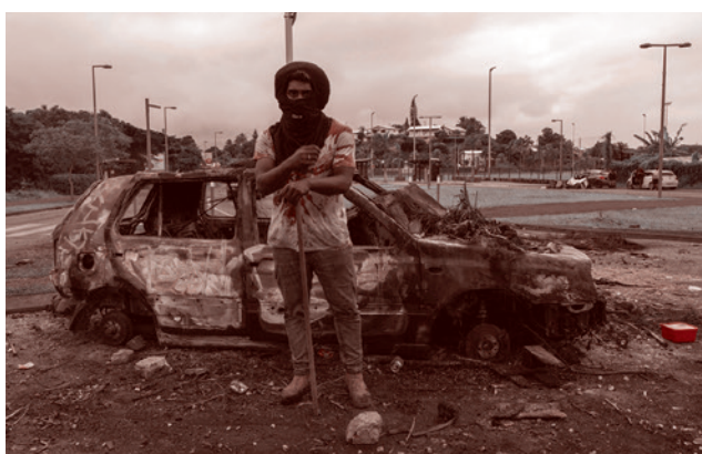
Погромы в Новой Каледонии

Это решение рассматривается как значительный геополитический шаг в сторону развития сотрудничества с Ираном, который будет иметь серьезные региональные последствия. Предполагается, что порт, представляющий собой ключевое связующее звено Индии с Афганистаном, Центральной Азией и большим евразийским пространством, может составить конкуренцию пакистанскому порту Гвадар, а также китайской инициативе «Один пояс — один путь».