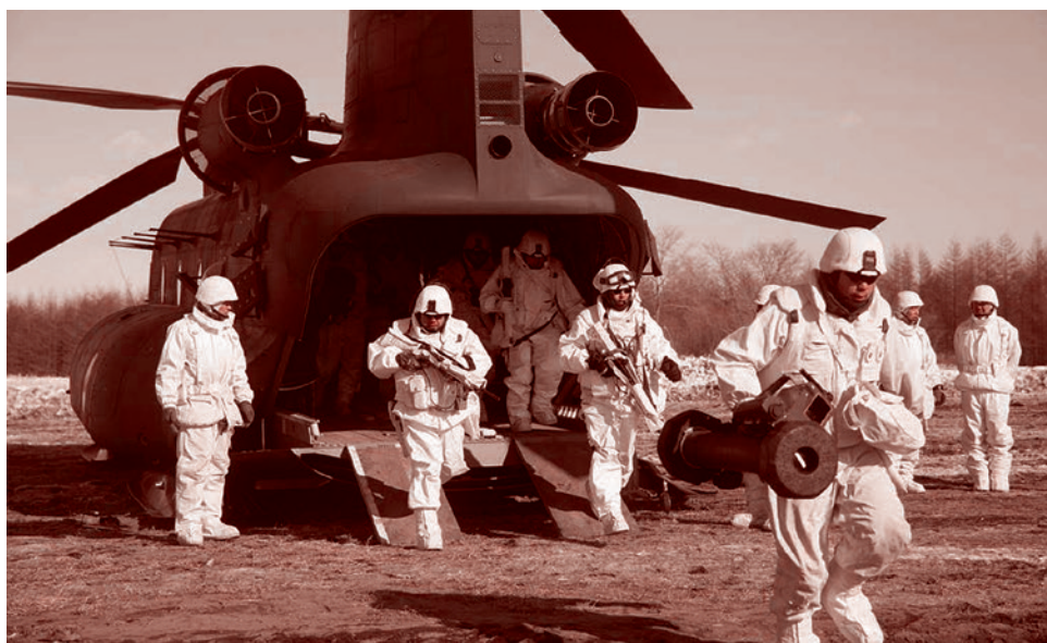
Силы самообороны Японии отрабатывают десантирование в ходе совместных учений с армией США на Хоккайдо. 2016

Впрочем, отчего бы не столкнуться Японии, которая так настойчиво хочет помочь США, с Китаем, чтобы, ослабив обе державы, самим оказаться в выигрыше? Максима «разделяй и властвуй» по-прежнему работает.