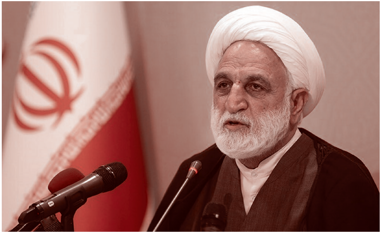
Глава разведки Ирана Голям-Хоссейн Мохсени-Эджеи

описана в терминах про- и антизападных элитных башен.