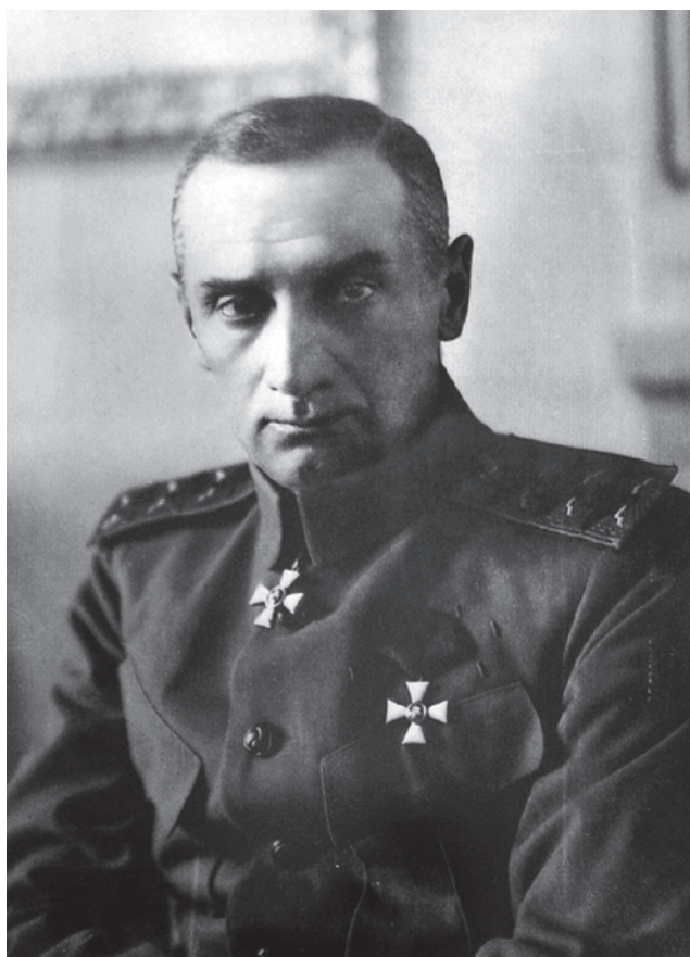
Адмирал Александр Колчак

о форме правления и других важнейших проблем. Созыв нового Учредительного Национального собрания — центральная идея его программы. Но более подробно он так и не раскрыл содержание своей программы, так как в полном смысле ее у него не было». Историк утверждает, что отсутствие четко оговоренной и привлекательной для простых людей политической программы стало одним из факторов поражения Колчака.