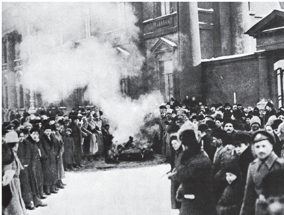
Сжигание царских символов. Февраль 1917