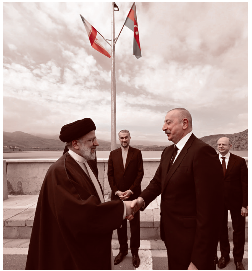
Раиси с Ильхамом Алиевым на границе с Азербайджаном 19 мая 2024 года, за несколько часов до своей гибели

Восток и впрямь очень специфически относится к похоронам и церемониальности как таковой. Так что даже отсутствие на похоронах Раиси бывших президентов Ирана — далеко не безболезненно. Но