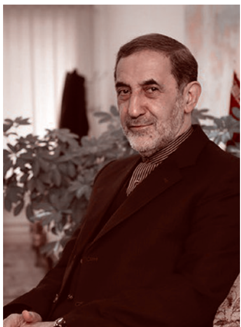
Али Акбар Велаяти