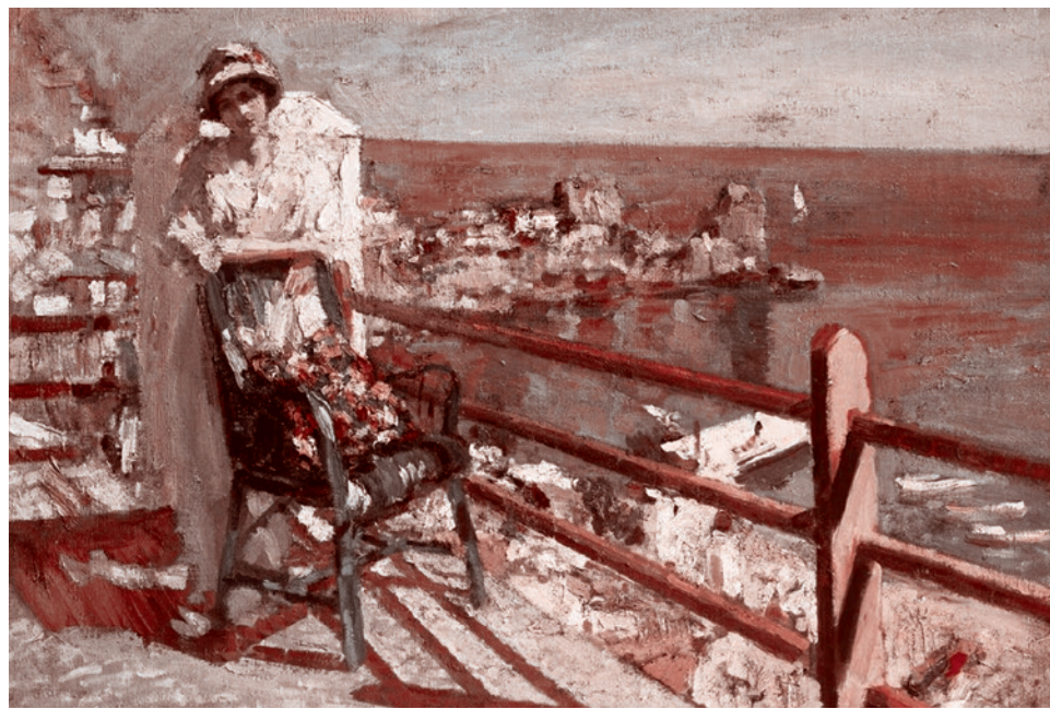
Константин Коровин. Гурзуф. 1914

Но можно ли представить себе, что Анна Сергеевна, «дама с собачкой», будет вести такой же образ жизни, как Анна Петровна? И тут мы видим, что это две различные женщины, с различным отношением к жизни и к морали. Безусловно,