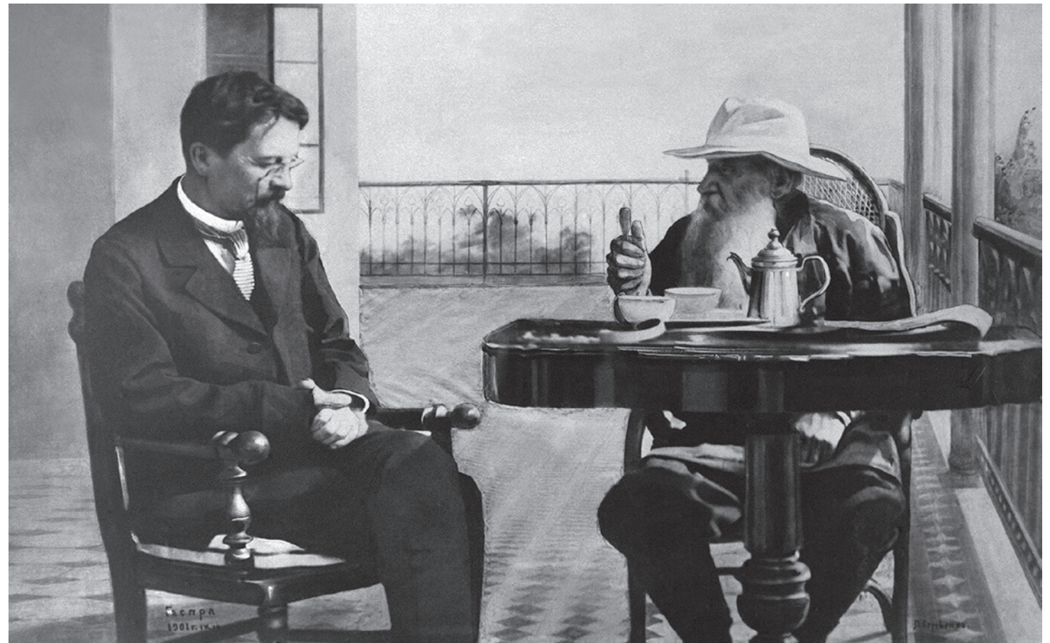
Антон Чехов и Лев Толстой. 1901

Газета «Суть времени» зарегистрирована Федеральной службой по надзору в сфере связи, информационных технологий и массовых коммуникаций (Роскомнадзор) Свидетельство ПИ № ФС77-50554 от 9 июля 2012 года