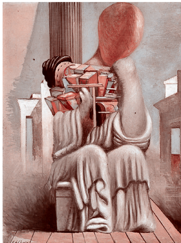
Джорджо де Кирико. Ужасные игры. 1925

Реальная цель этого и других документов, которые мы будем упоминать, — обрушить с помощью цифровизации основные базовые системные элементы, на которых держалась всякая массовая система образования, и вместо нее соорудить систему