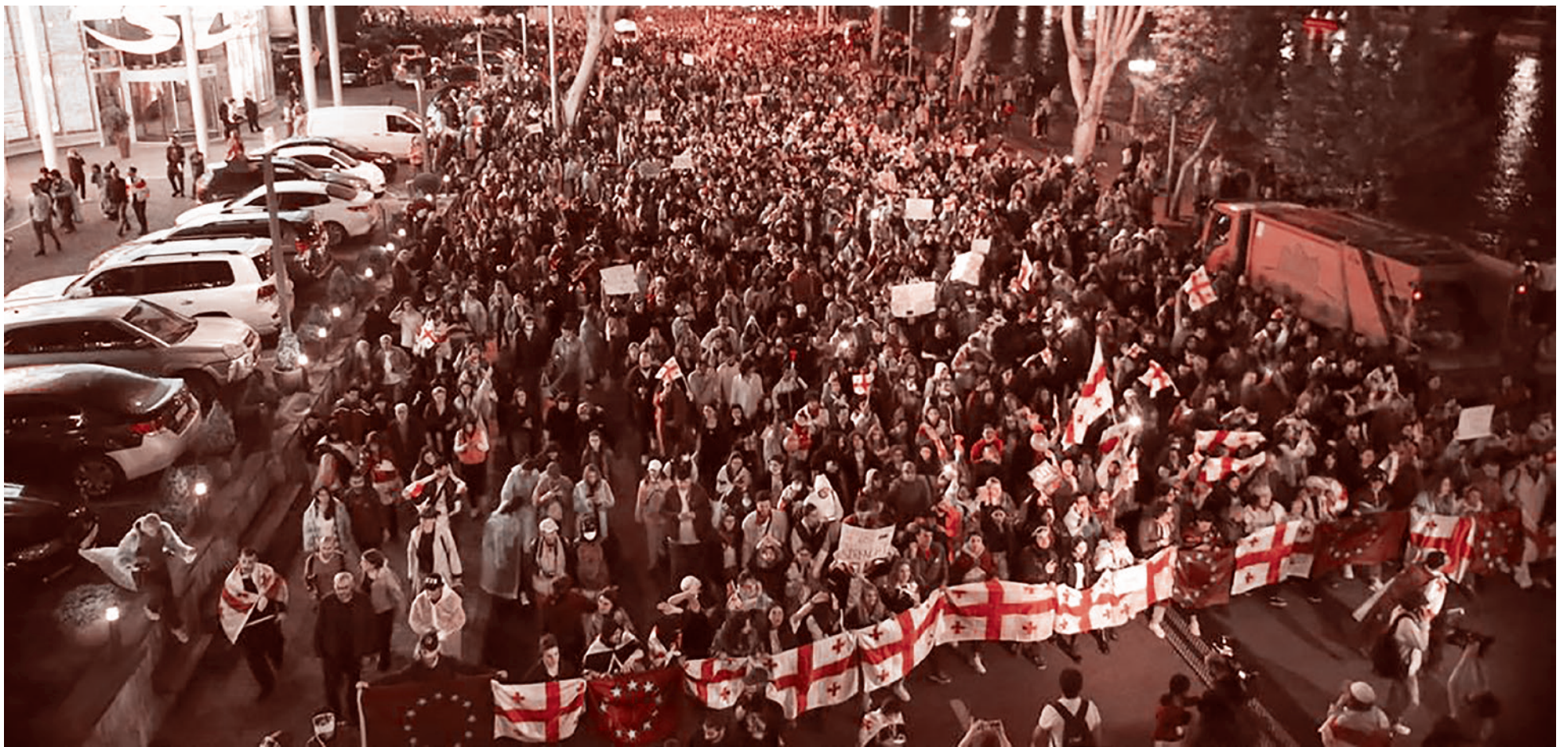
Демонстранты маршируют во время протеста оппозиции против «российского закона» в центре Тбилиси. Грузия. 3 мая 2024

А с другой стороны, мы видим, что и в Армении набирают обороты антироссийские настроения. И здесь тоже всё далеко не спокойно. Давайте сегодня об этом поговорим. Что же происходит, с Вашей точки зрения, здесь?