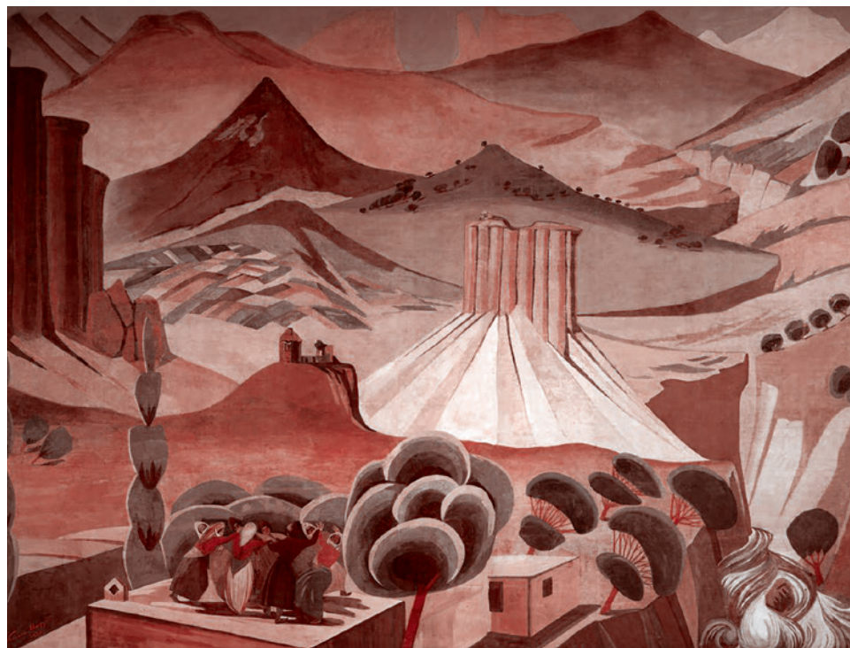
Мартирос Сарьян. Занавес государственного драматического театра Армении. 1923

Кончилось это войной и вот тем, что сейчас имеет место быть. И до сих пор во-