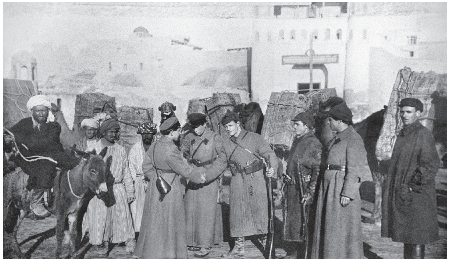
Красноармейцы у стен крепости Арк. Бухара. 1927