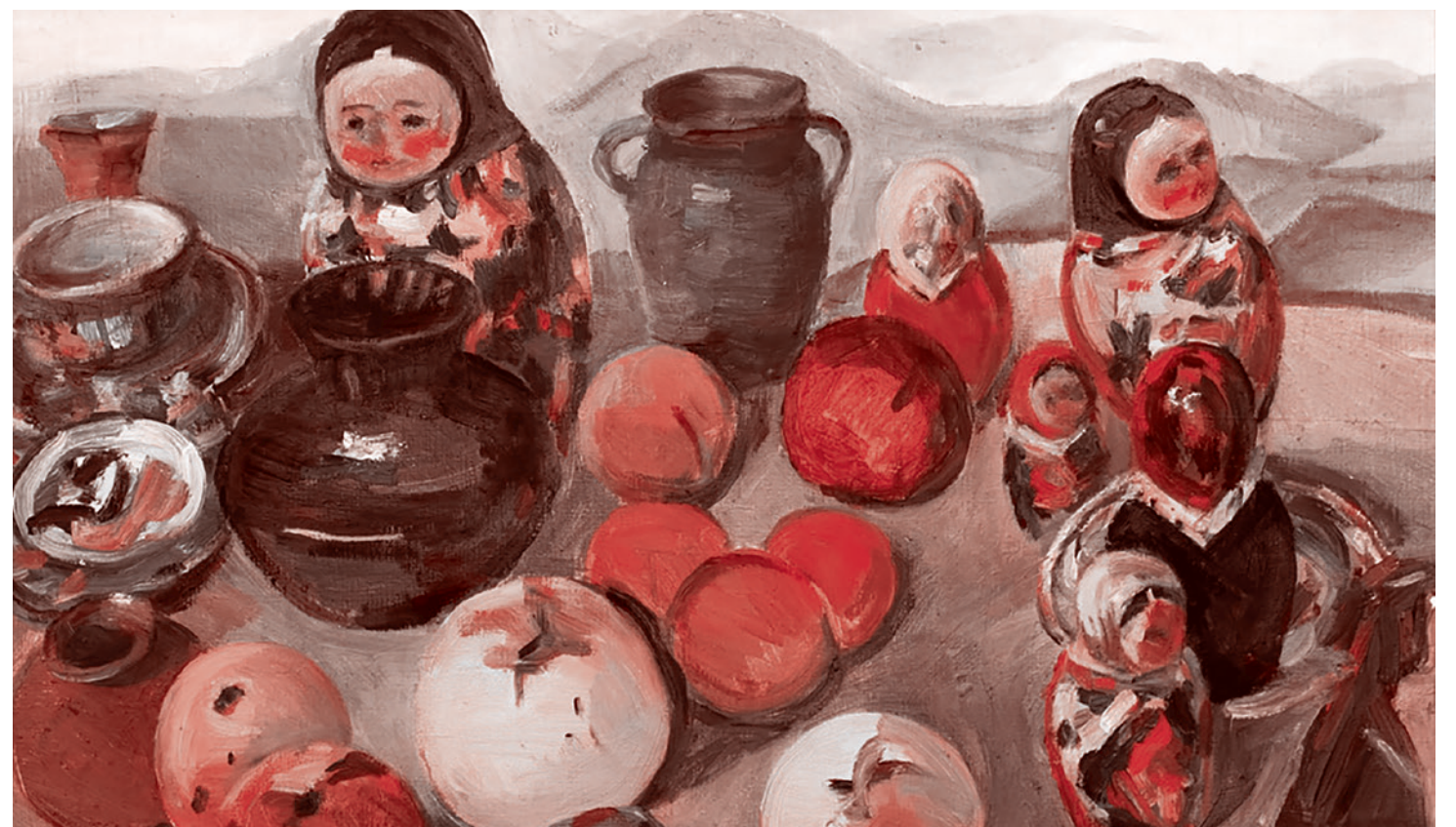
Мартирос Сарьян. Натюрморт с матрешками. 1965