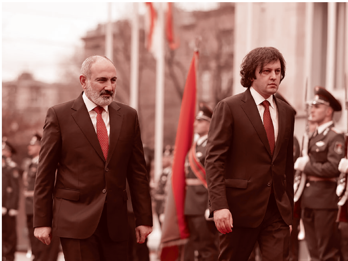
Премьер-министр Армении Никол Пашинян и спикер парламента Грузии Ираклий Кобахидзе

Я этим не оправдываю некую избыточную нашу патетику по отношению к Карабаху в момент, когда заключался мир. Как говорил когда-то Федор Михайлович Достоевский, точнее, его герой: «Некрасивость убьет». А эта некрасивость с нашей стороны была. Но она меркнет на фоне того, как Армения, оравшая, что для нее Карабах — это всё, выбрала Пашиняна, главная идея которого — сдать к чертям собачьим Карабах и лечь под Азербайджан и Турцию. Армения это выбрала. И возник острый разговор: с одной стороны, армяне говорят: «Вы нас не защищаете», а наши им говорят: «Но вы хоть выберите кого-то,