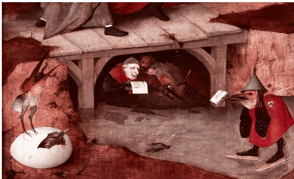
Иероним Босх. Испытание Святого Антония (фрагмент). 1523

Каким образом эксперты глобальных международных организаций объясняют необходимость сбора данных? Например, сбор данных о материальном благополучии семей, о системе финансирования образовательных учреждений можно организовать под видом борьбы с «неравенством в образовании» и «социальным исключением в образовании». Эти идеологиемы часто встречаются в стратегических документах и стали удобной причиной объяснения необходимости цифровизации образования. И, конечно же, для сбора статистики о том, насколько доступным в стране является образование