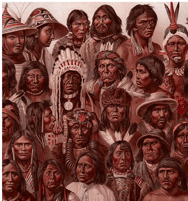
Коренные народы Америки. Иллюстрация из шведской энциклопедии. 1904

Испанские миссионеры подошли к задаче широко и творчески. Они стремились найти точки соприкосновения с культурой местных и даже интегрировали индейцев в свою иконографию. Широкою известность, например, приобрел образ Девы Марии Гуаделупской, на котором Богородица изображена в виде индианки. Существуют похожие иконы, изображающие Христа и апостолов с индейскими или метисскими чертами лица. Поэтому неудивительно, что приобрели массовость и межрасовые браки. Последствия этого подхода видны невооруженным глазом в демографиче-