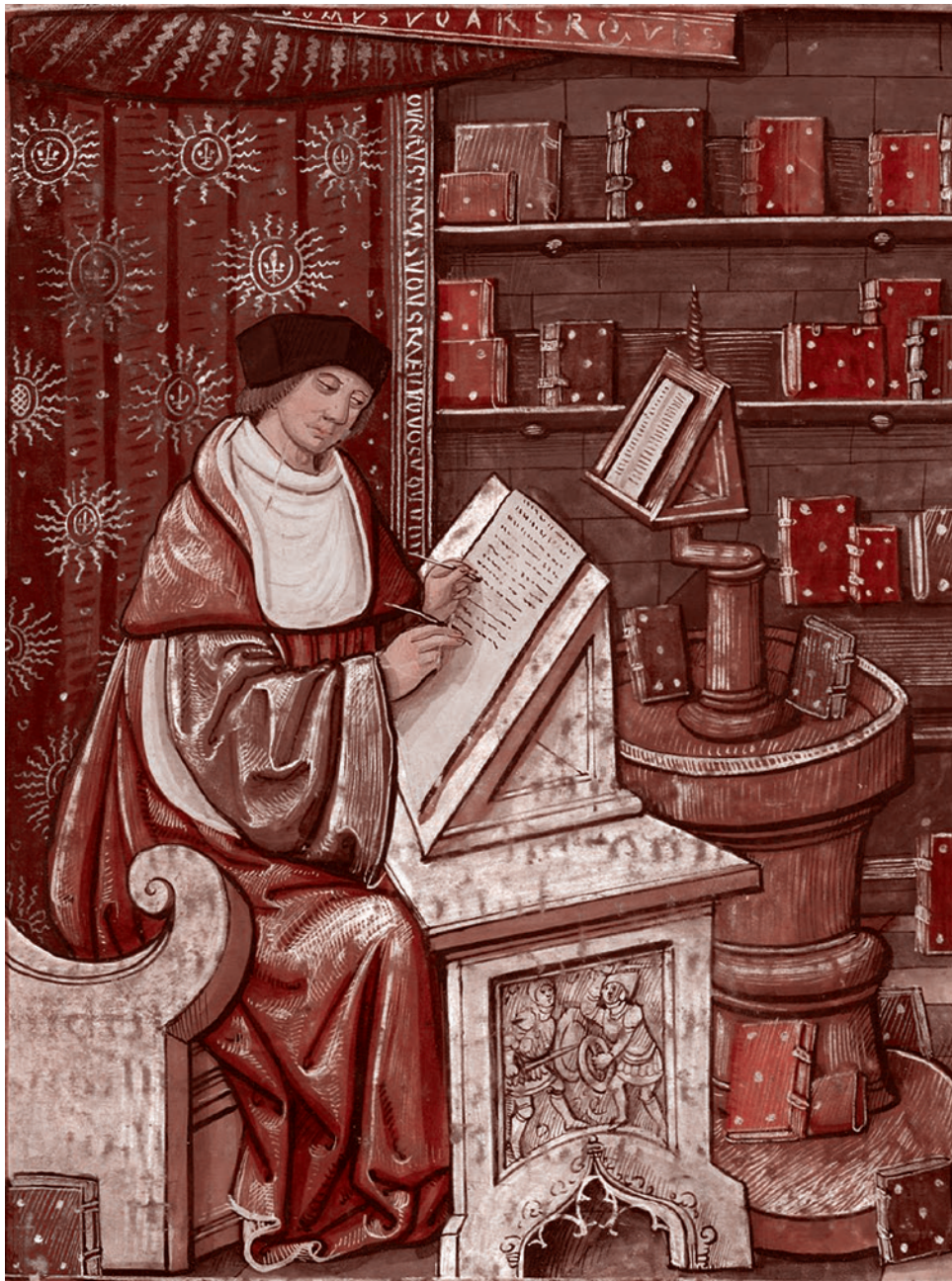
Монастырский скрипторий. Средневековая миниатюра

не хотелось преувеличивать могущество и мобилизованность мировой империи, которую олицетворяют США как совокупный Запад. Это очень расхлябанная, вялая, противоречивая субстанция — дурно пахнущая, саморазлагающаяся. Всё так. Это Рим эпохи, я не знаю... Тиберия? Он уже не цветет и пахнет, он смердит, гниет, разлагается. Но это не значит, что Рима нет.