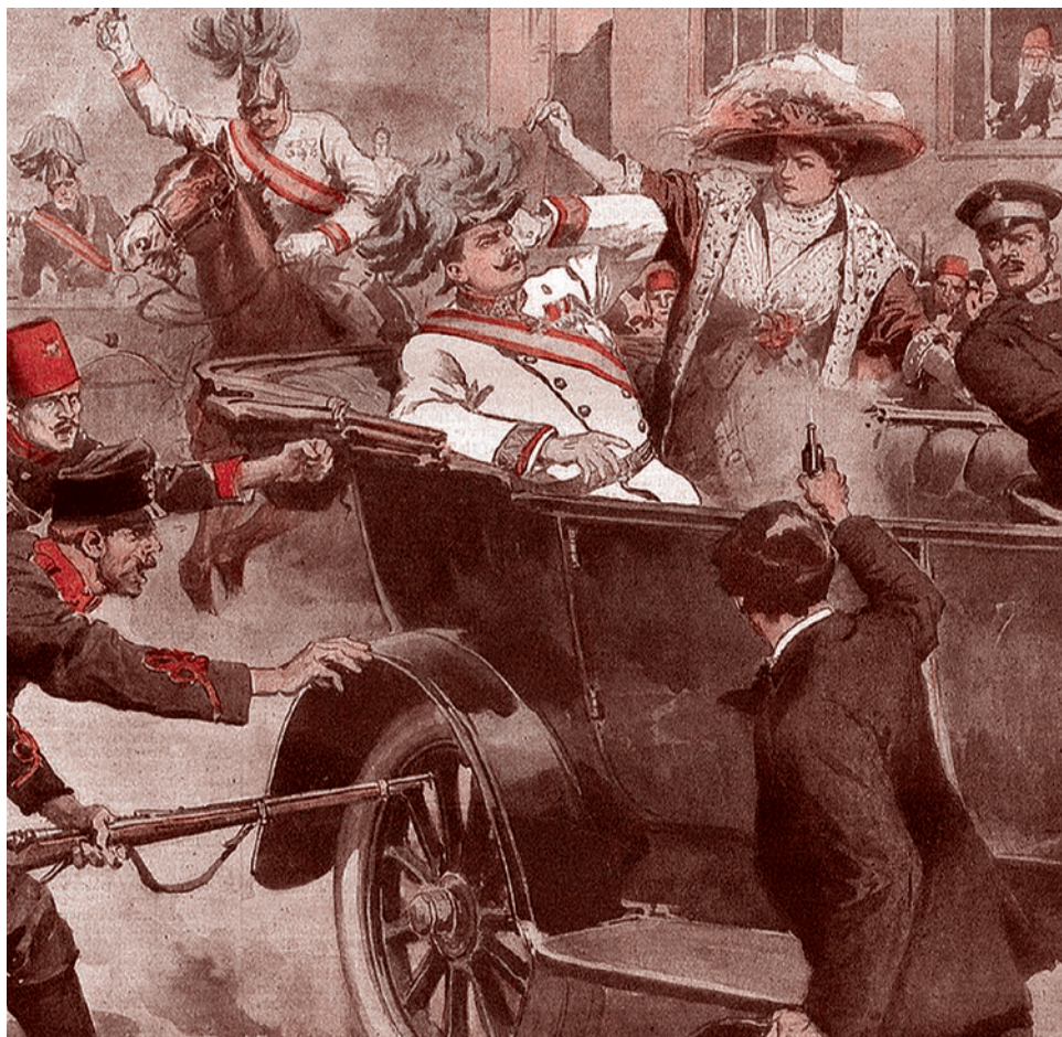
Убийство эрцгерцога Франса Фердинанда. 1914

ны были сорваны Сербией, Австро-Венгрия была готова аннексировать и ее. В 1915 году Сербия (включая Косово) действительно была захвачена и аннексирована, причем половину присоединила к себе сама Австро-Венгрия, а вторую половину она оставила Болгарии. Черногория также была оккупирована.