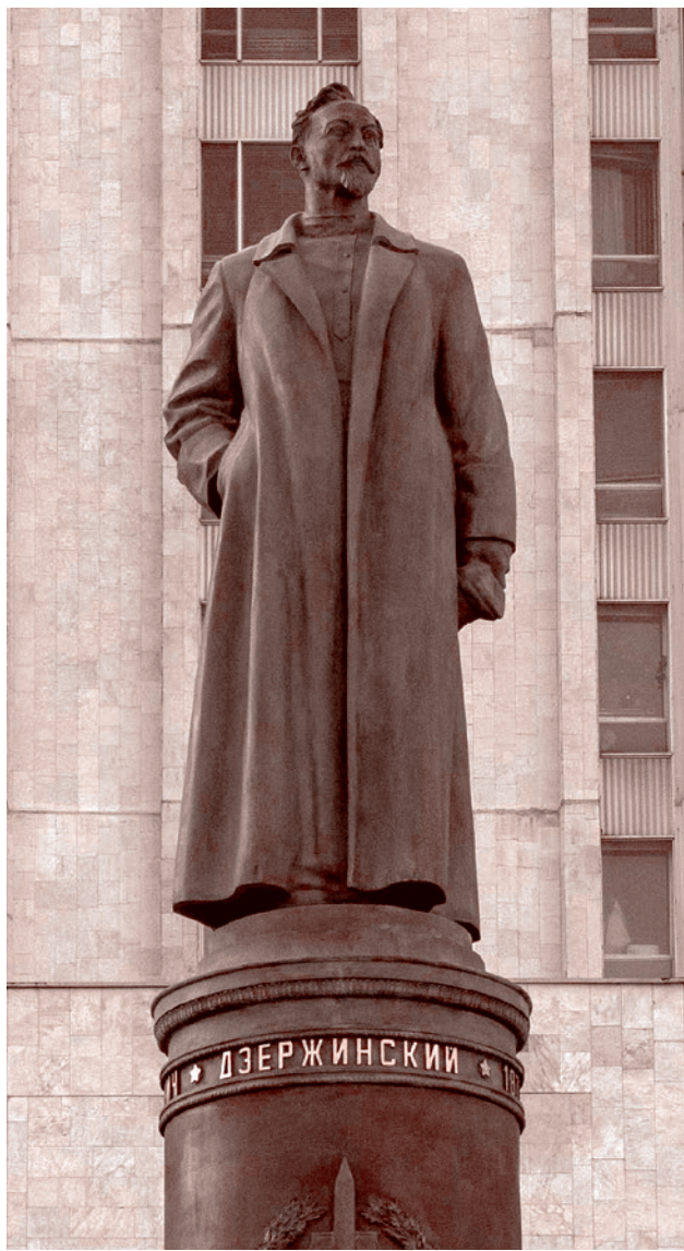
Памятник Феликсу Эдмундовичу Дзержинскому на территории штаб-квартиры Службы внешней разведки РФ

Это вопрос о том, что некая расслабуха, очень плотно въевшаяся в плоть, кровь, в душу, кончилась, и всё равно ее придется избавлять. Чехов когда-то говорил: «Я по капле выдавливал из себя раба». Можно ли по капле выдавливать из себя расслабушного, кайфующего западника, я не знаю. Может быть, это можно сделать сразу, а может, нет. У меня нет готового ответа на этот вопрос. Но это придется делать, враг заставит это делать, и враг достаточно для этого силен (хотя, конечно, преисполнен всяческих маразмов) — это точно. Нам придется собрать нечто из эклектики, которая сочетает в се-