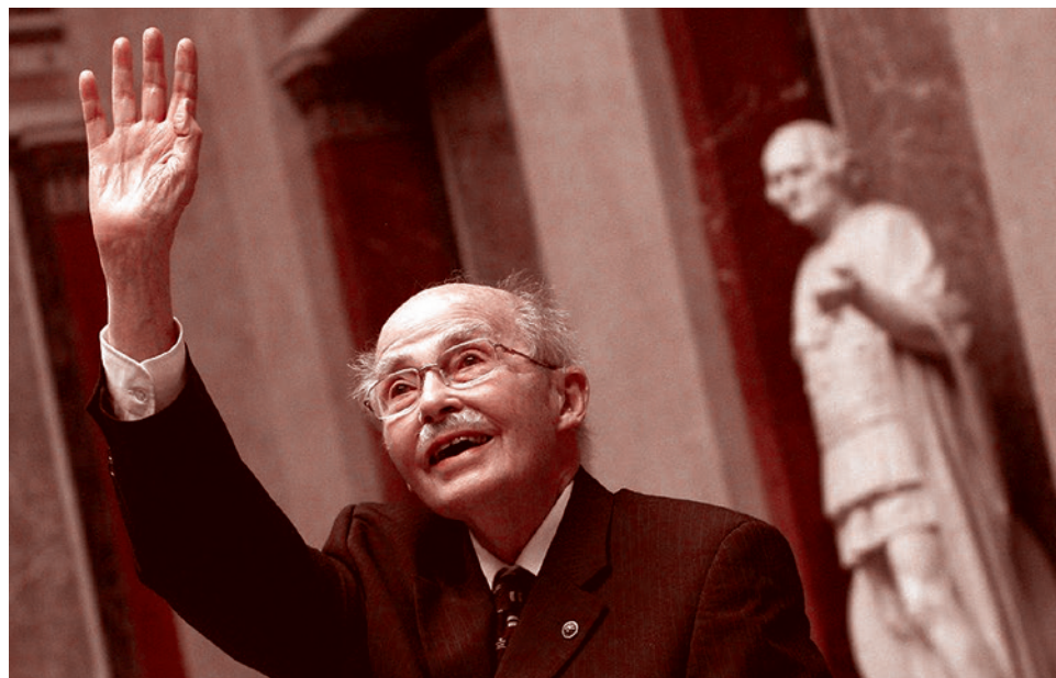
Отто фон Габсбург

Австрийская империя просуществовала не 600 лет, как утверждает Отто, а чуть более 200 — с момента захвата императором Леопольдом всей Венгрии до разгрома в 1918 году. Однако эти два длинных века дают нам хорошее представление о том, что представляла собой эта империя. Она состояла из прямых внутренних владений и внешних зависимых территорий, находившихся под ее сюзеренитетом (например: Баварии, Саксонии, Тосканы, даже Сербии в 1830 году). Кроме того, как и в любой