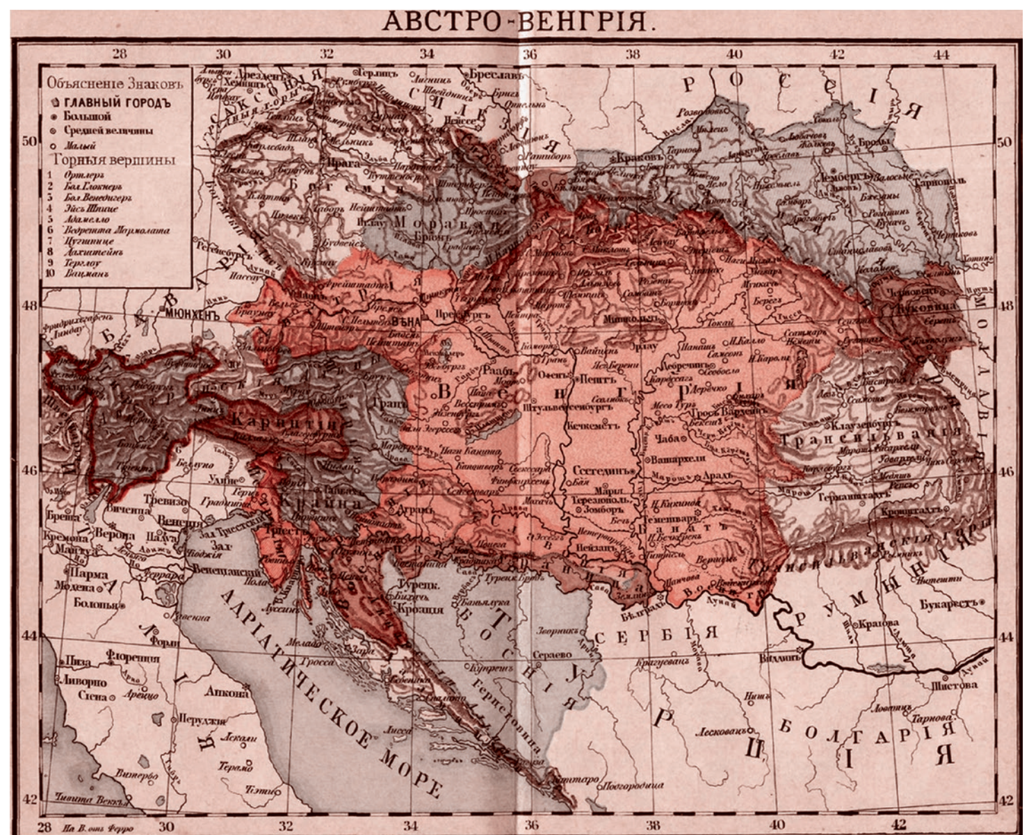
Карта Австро-Венгрии. 1914

Конечно, он бессовестно лгал и об Австрии, и о ЕС, и обо всех многонациональных образованиях — о Римской, Османской и Монгольской империях, «забывая», что они вели величайшие завоевательные войны в истории. Для того, чтобы представить Австрию и ЕС добренькими, ему приходилось скрывать немалую часть истории Австрии: свирепое завоевание Венгрии и расправу над религиозными противниками в конце XVII и начала XVIII века, страшную венгерскую войну за независимость 1848–1849 годов, антиправославные крестовые походы, постоянные завоевательные походы в Италию (1701–1714, 1796–1798), на Балканы, в Польшу (1772, 1795), в румынские княжества (оккупированные в 1854–1857 годах), в Гольштинию (1864), преобладающую ответственность Габсбургов за кровавую резню 1914–1918 годов и многое другое. Приходилось даже скрывать, что внутри Австро-Венгрии в 1914 году войны против Сербии хотела вовсе не «партия» австрийских немцев и тем более не «партия» венгров, а «партия» двора, то есть самого Франца Иосифа, его семьи и ближайших советников. Иными словами, Габсбурги несли личную ответственность за начало военных действий и навязывали свое воинственное решение австрийским и особенно венгерским