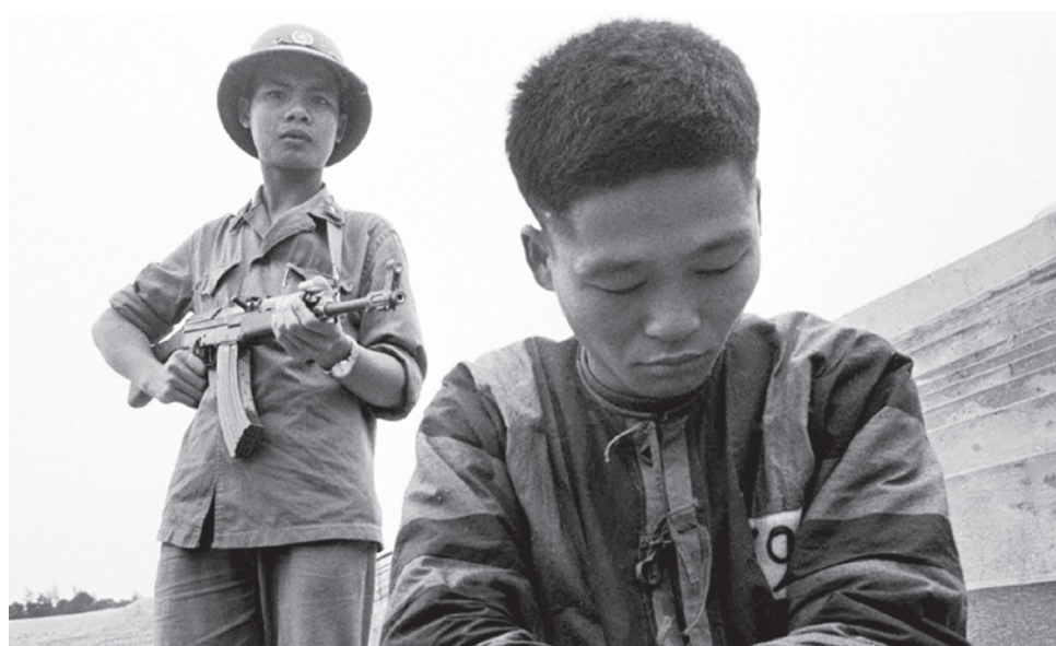
Вьетнамский солдат держит под прицелом военнопленного китайской армии

Вьетнам уже страна с огромным самоуважением, с пониманием того, как они выстояли, с памятью о великой традиции