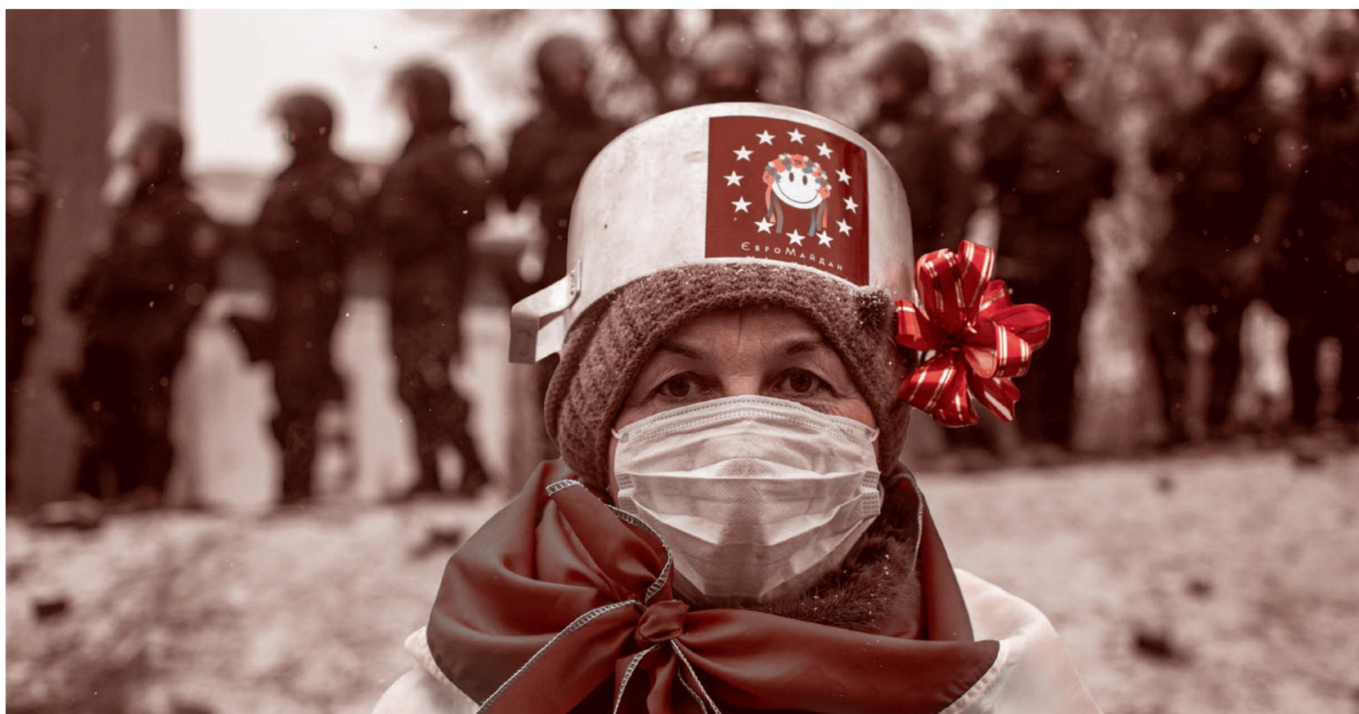
Украинский майдан. 2014.