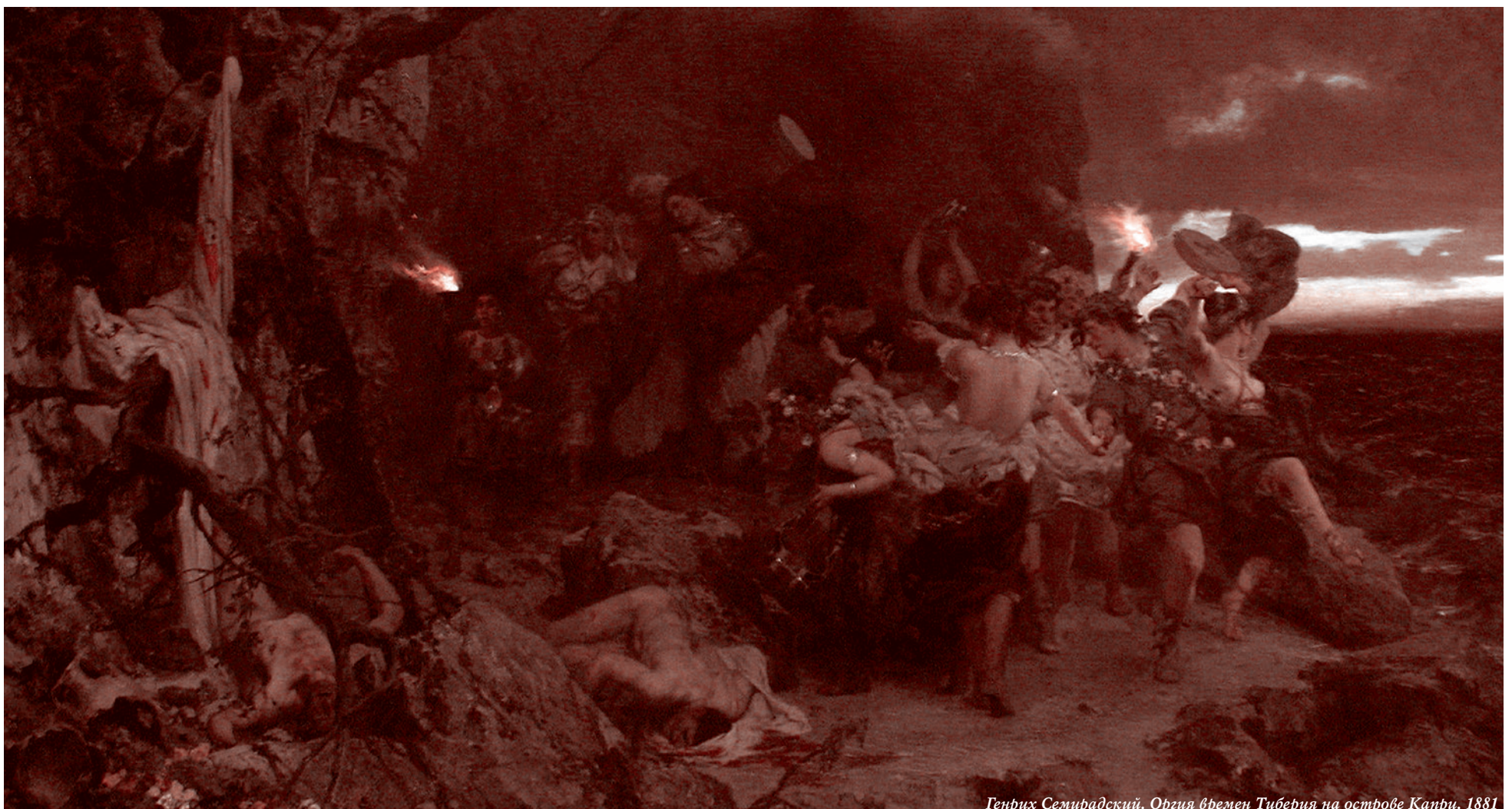
Генрих Семирадский. Оргия времен Тиберия на острове Капри. 1881

Если это произойдет через пять лет, то все эти пять лет придется длиться мяг-