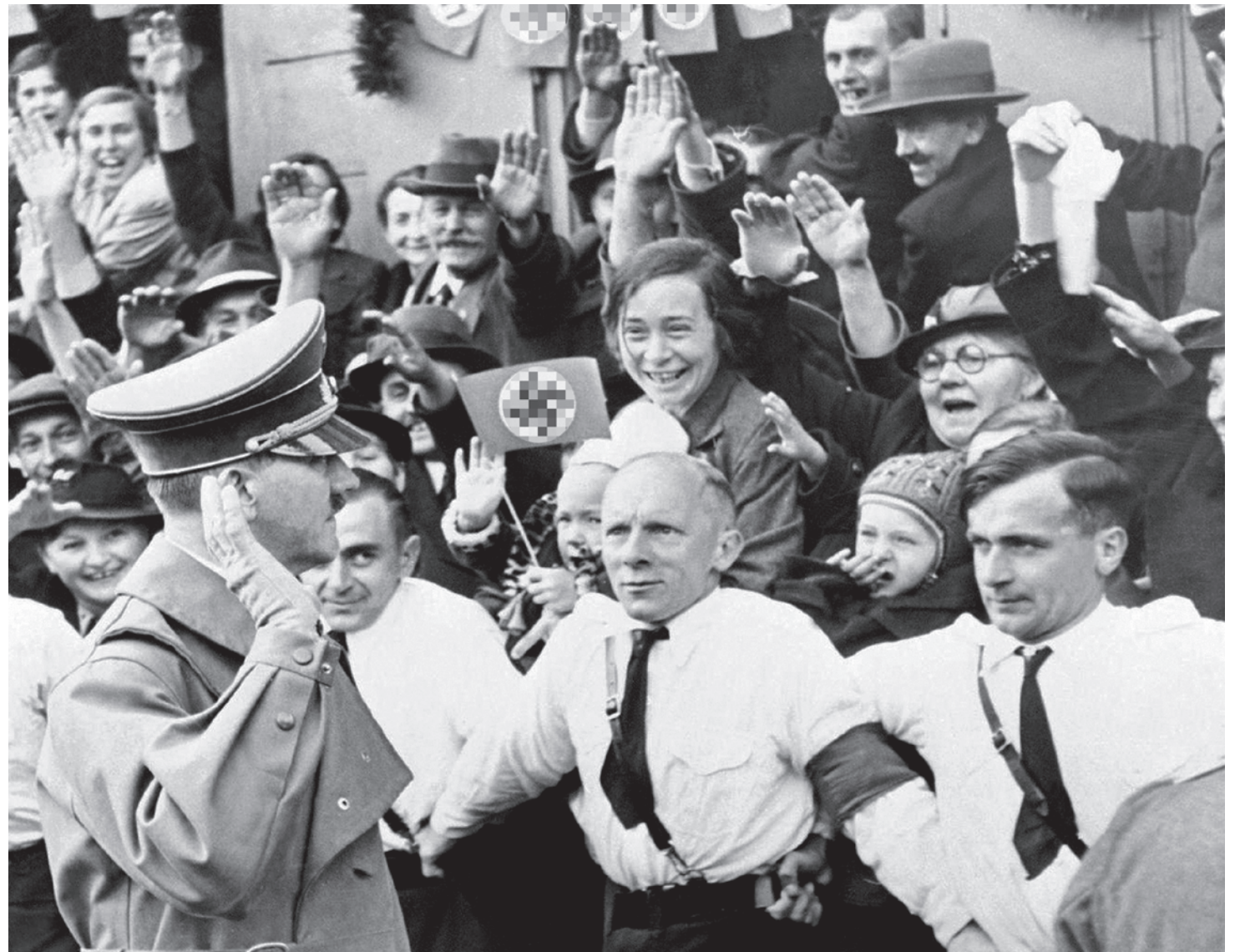
Толпа приветствует Гитлера. 1939

Несмотря на то, что термин «нацизм» употребляется в настоящее время весьма широко и часто, смысл его до сих пор в до-