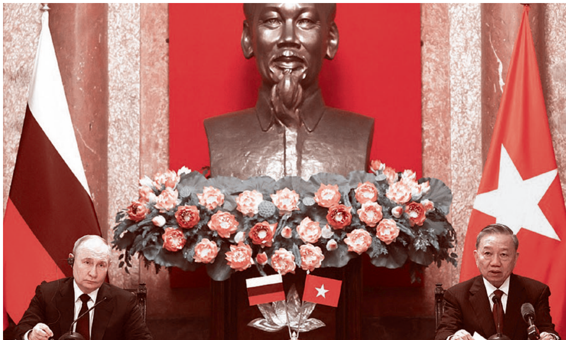
Владимир Путин и То Лам на пресс-конференции после переговоров