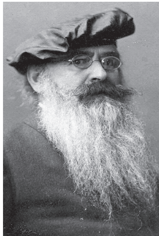
Гвидо фон Лист

Еще сложнее дело обстояло с Украиной, появившейся на карте мира гораздо позднее Италии, однако демиурги украинского неонацизма справились с задачей. Они смогли внедрить в сознание части русских людей миф о том, что они тоже избранная нация — украинцы, у которых презренные варвары, именующие себя русскими, смогли отобрать всё: территорию, историю, язык, даже имя. Жители юга России вначале с удивлением узнали, а потом поверили в то, что они потомки угнетаемого народа, который в своей тысячелетней истории был автором всех изобретений человечества, секретного народа, о котором никто никогда не слышал. И виноваты в том, что этот народ не занимает ныне, да и не занимал никогда достойное его место, те самые презренные «москальи», «моксели», «орки», «колорады», которые, украв имя у великого государства Киевская Русь, именуют себя русскими.