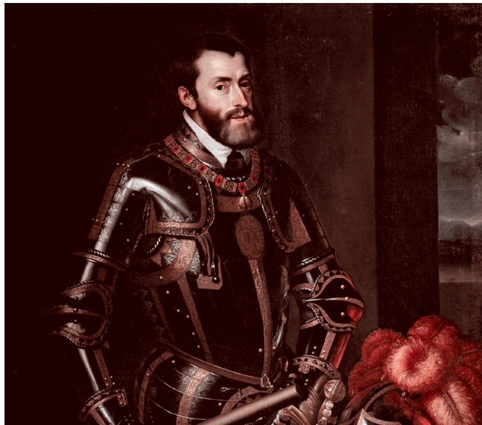
Тициан. Карл V

Габсбурги стремились восстановить свою империю не только в Венгрии и на Балканах. В Италии они использовали бывшие права Священной Римской империи, чтобы получить полный суверенитет над Ломбардией, Пармой, Моденой и Тосканой. То же самое касается Бельгии и Люксембурга. Они даже попытались вернуть себе всю испанскую корону, хотя им удалось захватить лишь Арагонское королев-