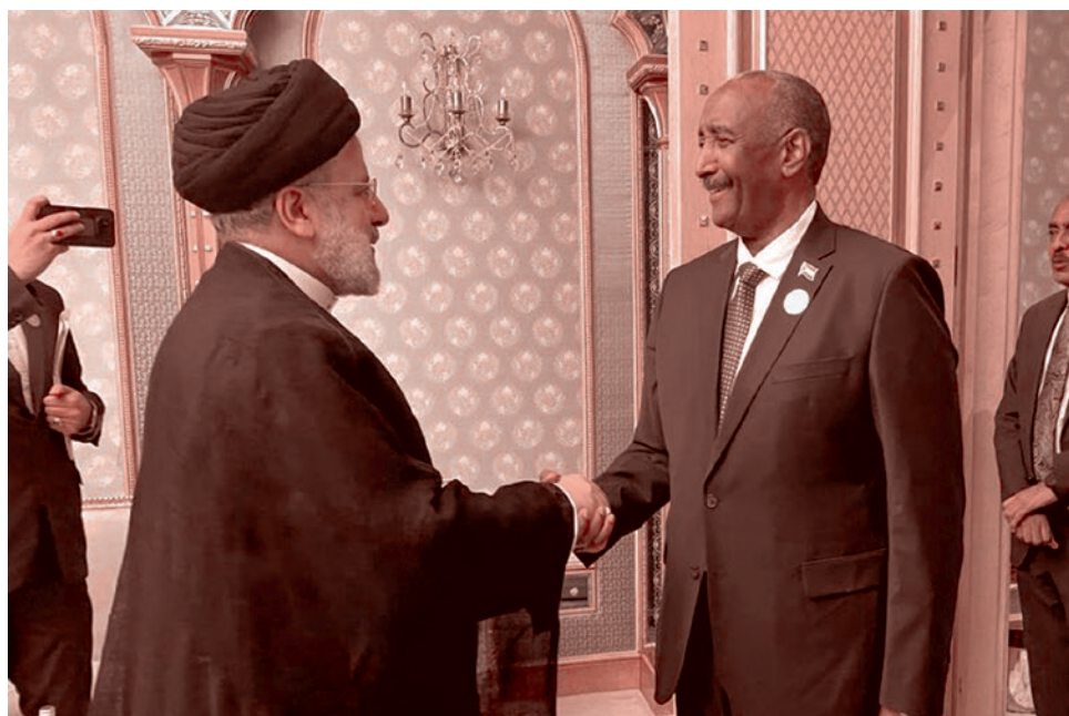
Абдель Фаттах Аль-Бурхан пожимает руку президенту Ирана Раиси в Эр-Рияде. 11 ноября 2023

Режим Пашиняна, несмотря на громкие заявления, намерен полностью лишиться Армении суверенитета, превратив страну в очередного лимитрофа.