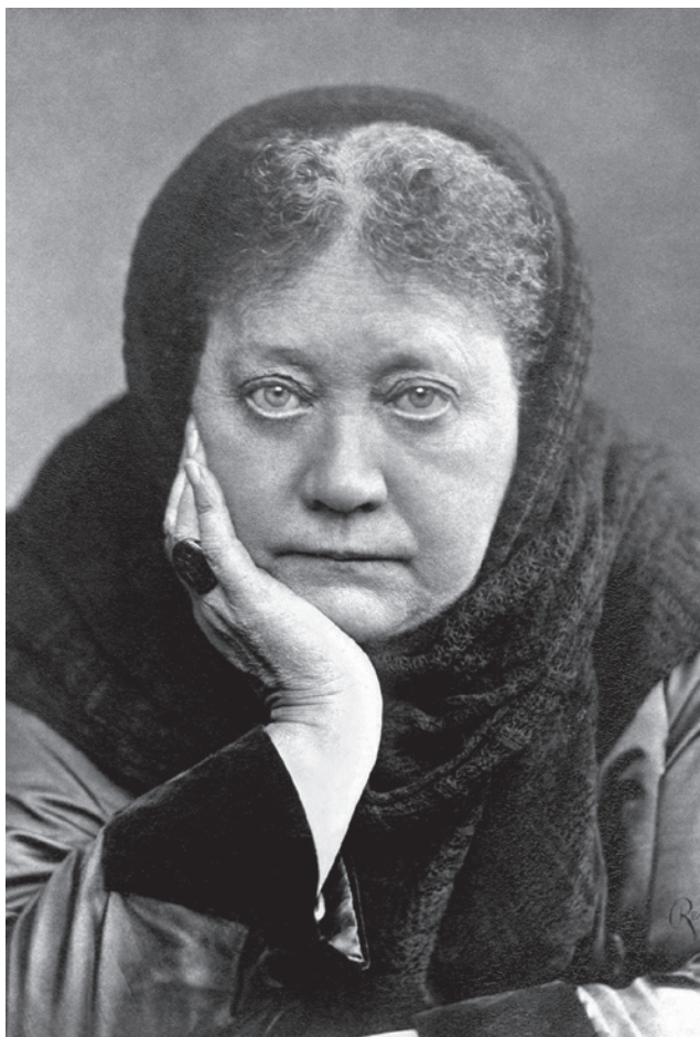
Елена Блаватская. 1889

термин ввел проявлявший повышенный интерес к культурам Востока германский ученый Фридрих Шлегель в 1819 году, обозначив им представителей большой языковой группы, включающей индийцев, а также германцев, славян и другие народы Европы. Впервые еще Геродот называл ариями племена не знавших ни железа, ни городов белокурых голубоглазых кочевников, прибывших на боевых колесницах между XVII и XIII веками до новой эры откуда-то с северо-запада на территорию современной Индии.