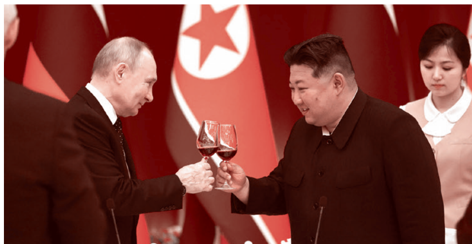
Владимир Путин на торжественном приеме от имени Председателя Государственных дел Корейской Народно-Демократической Республики

Как утверждает газета, военное сотрудничество Москвы с Тегераном, Пхеньяном и Пекином стало более тесным с февраля 2022 года и привело к тому, что между союзниками ведется обмен требованиями защиты передовыми технологиями, которые могут угрожать США и их партнерам еще долгое время даже после окончания конфликта на Украине. Издание также утверждает, что РФ и эти страны заключили соглашения о совместном производстве вооружений, что улучшает долгосрочные возможности России и ее союзников.