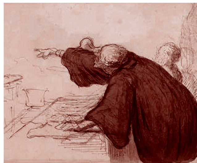
Оноре Домье. Из серии «Судьи и адвокаты». 1850

Люди же из дружественных стран и вовсе относятся к нам с теплом и, я бы сказал, как будто с благодарностью. Ведь гегемония «развитых» стран держала