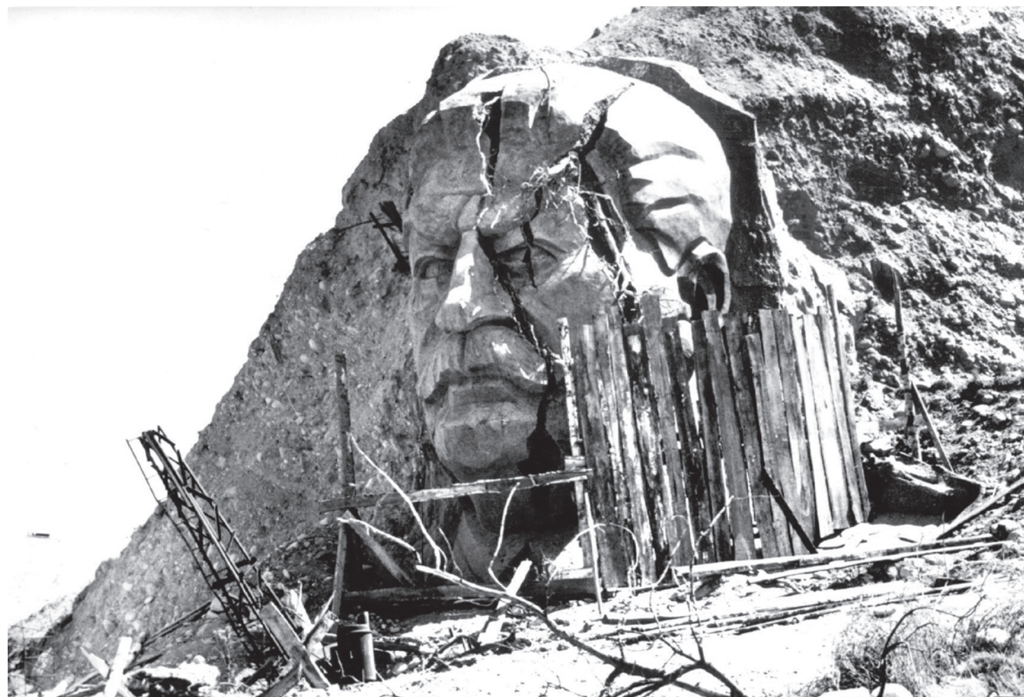
После забвения...