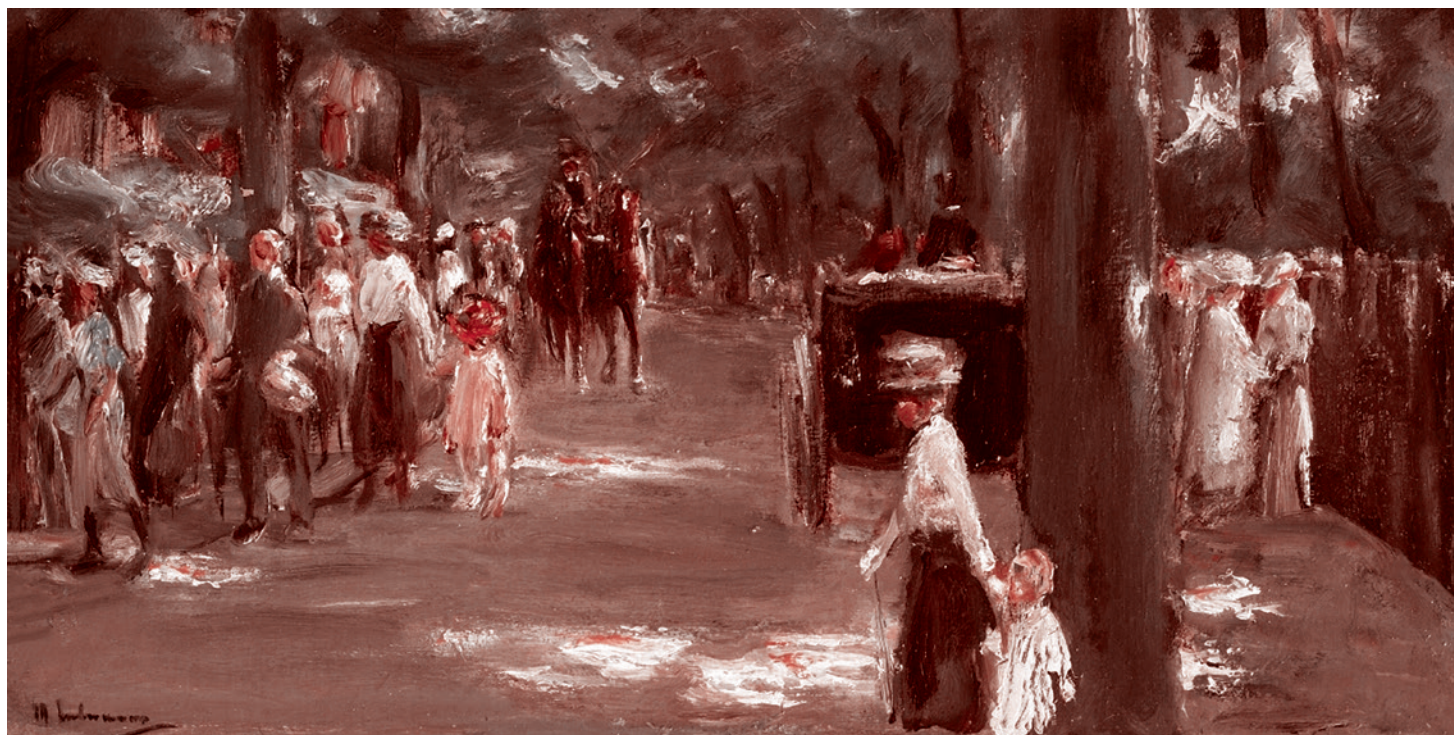
Макс Либберман. Большая улица Зеештрассе в Ванзее с пешеходами. 1921

Все эти причины привели к тому, что желание унижать русских и Россию немного поутихло. Вряд ли Россия и Германия снова станут друзьями в обозримой перспективе, но есть надежда, что мы не станем врагами до конца.