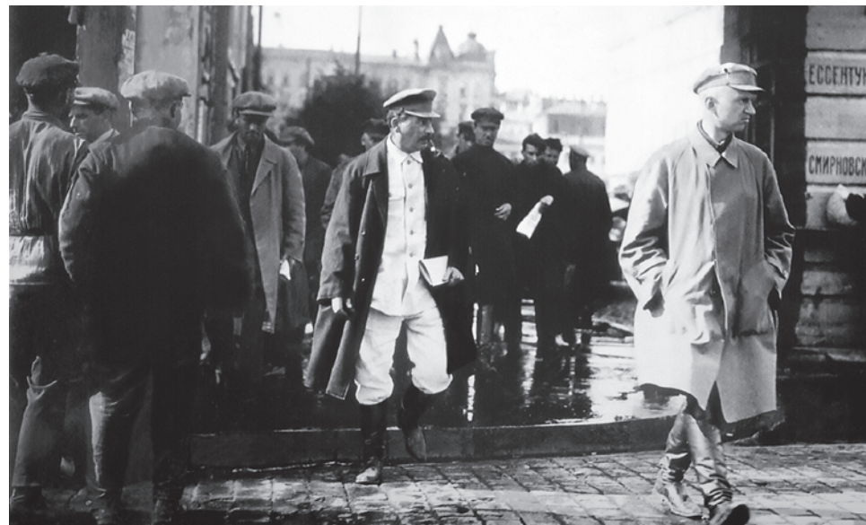
Сталин на площади Свердлова в Москве. 1930

В следующих номерах газеты будут опубликованы остальные статьи коллективной монографии «Эзотерика Сталина. Аналитика конфликта интерпретаций»