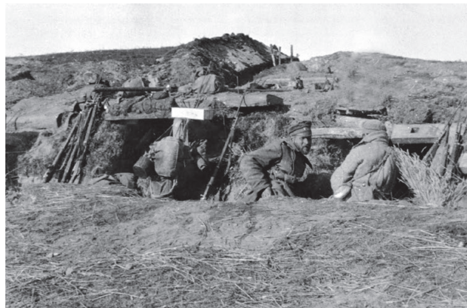
Русские солдаты в окопах. 1914

Российская специальная военная операция на Украине, которая в начале задумывалась как «небольшая победоносная война», своими последствиями уже самым серьезным образом повлияла не только на Восточную Европу. Сам ход СВО поставил под вопрос многие параметры того устройства, к которому Европа и весь Запад успел привыкнуть в последние десятилетия. И этим, возможно, российская спецоперация может быть чем-то схожа с Первой мировой войной, приведшей в свое время к изменению многих, как тогда казалось незыблемых, констант жизни человечества и запустившей невиданные ранее процессы в мировой истории.