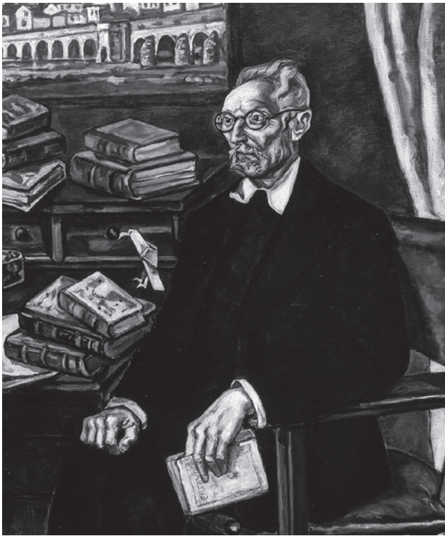
Хосе Солано. Портрет Мигеля де Унамуну

В этой связи я вынужден, обсуждая метод, примененный авторами, обратиться не только к творчеству Гуссерля и Рикёра, но и к творчеству других исследователей и отрекомендовать читателю исследование, осуществленное авторами, еще и как опыт по созданию такой дисциплины, как аналитическая история.