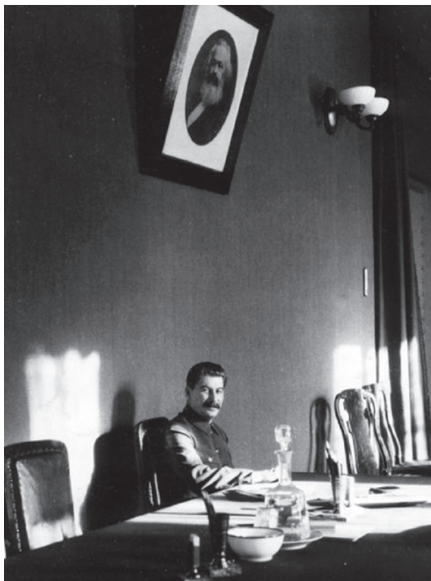
Сталин в Кремле. 1932

Насущно необходима была метагерменевтика, вбирающая в себя все вышеуказанные герменевтики и определенным