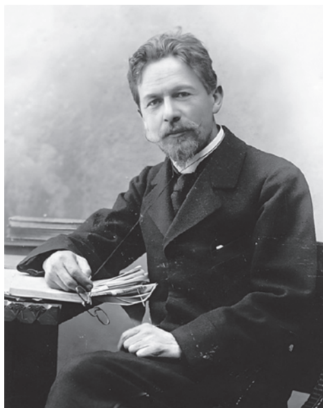
Антон Чехов. 1889

Живым же началом, противостоящим этой мертвечине, является культура. И опять же налицо связь между представлениями Унамуно и Блока. Неважно, кем и как опосредуется эта связь: иррационализмом великого философа-интуитивиста Анри Бергсона (1859–1941) или иррационализмом Артура Шопенгауэра (1788–1860). Важно, что музыкальность Блока и оживляющая цивилизацию иррациональность культуры знаменуют собой некую переключку, в основе которой — предчувствие губительности всего механического,