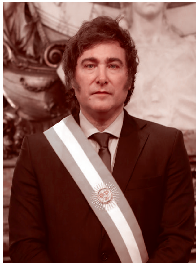
Президент Аргентины Хавьер Милей

Более того, де-факто транспортный коридор, который не затрагивает территории ни России, ни Китая, уже есть и действует — это Срединный коридор, проходящий по территории Азербайджана и Грузии. Он включает в себя и транскаспийскую паромную переправу, и железную дорогу Баку — Тбилиси — Карс. Но об этом тоже не было сказано ни слова. То ли потому, что в представительстве нынешней администрации в центре любых проектов должна находиться Армения, то ли потому, что Грузия проявила непопустительное непослушание в вопросе НКО.