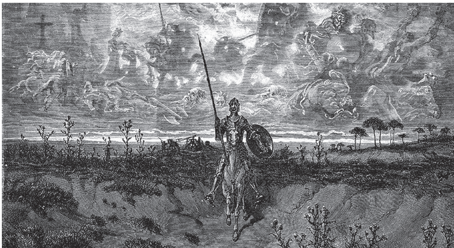
Гюстав Доре. Иллюстрация к роману Мигеля де Сервантеса «Хитроумный идальго Дон Кихот Ламанский». 1863

понимание чего-нибудь, имеющего отношение к жизни (а что может иметь к ней большее отношение, чем внутренний мир человека вообще, а такого человека, как Сталин, в особенности?), основано на том, что исследователи творчества Унамуно иногда называют художественно-философским дискурсом. Тут главное — художественность, вводимая в серьезную философскую мысль.