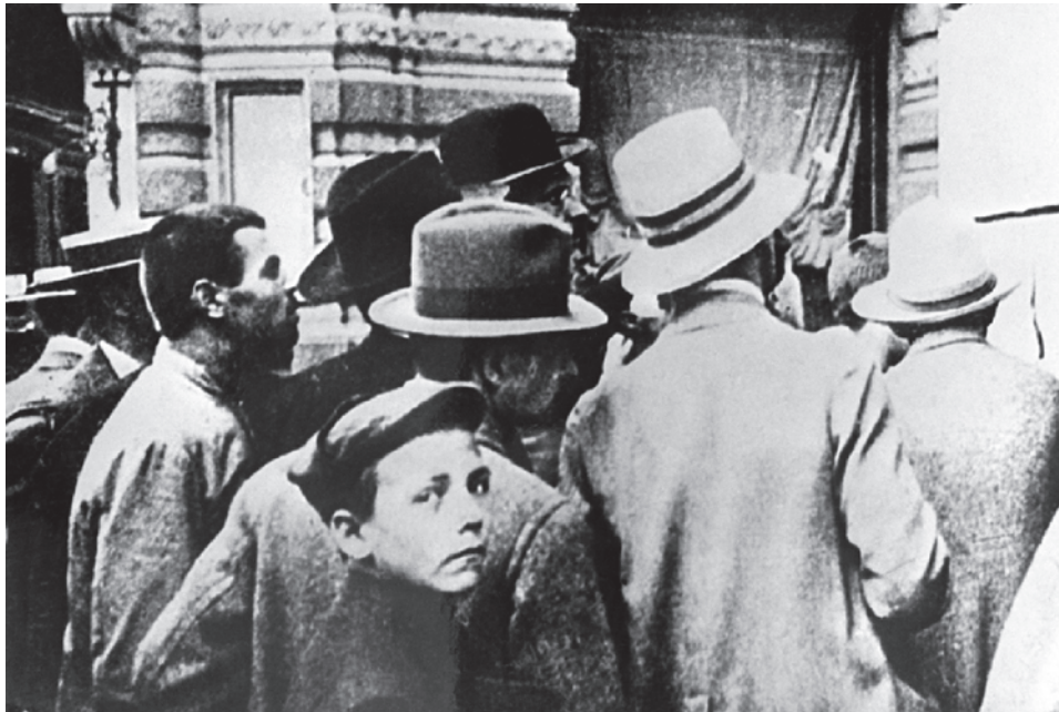
Москвичи читают приказ о мобилизации. 1914

Конфликт на Украине перечеркнул все прежние концепции военных теоретиков.