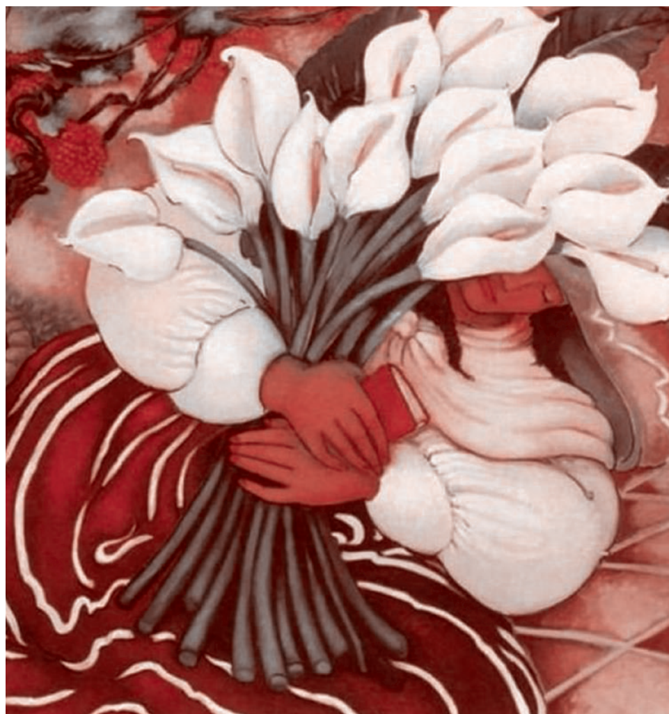
Диего Рибера. Женщина с фруктами. 1941