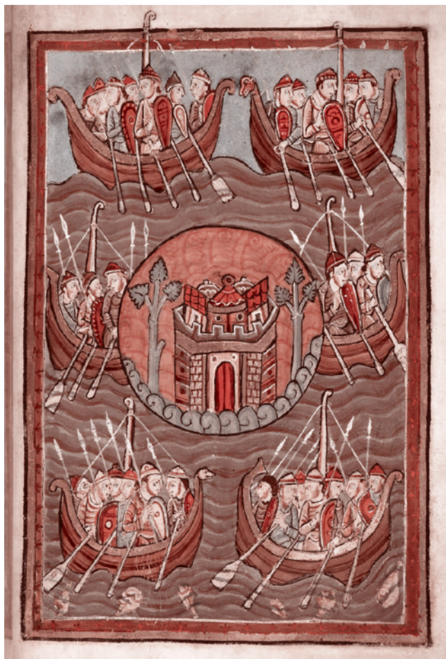
Англы, саксы и юты плывут в Британию. Миниатюра из «Жития святого Эдмунда». 1130

Но ведь октавиане или те же самые Боргезе, Сфорца, Медичи — это не евреи. Когда каждый раз говорится о всемирно-исторической роли Ротшильдов, то все забывают, что Ротшильды — это кто? Это банкиры Габсбургов. Так кто главные-то? Те, кому правящий дом дал возможность создавать финансовую империю, или сам этот правящий дом? А он же существует, и, между прочим, его роль и на Украине, и не только, достаточно велика даже сейчас. И, скажем так, в той же Венгрии.