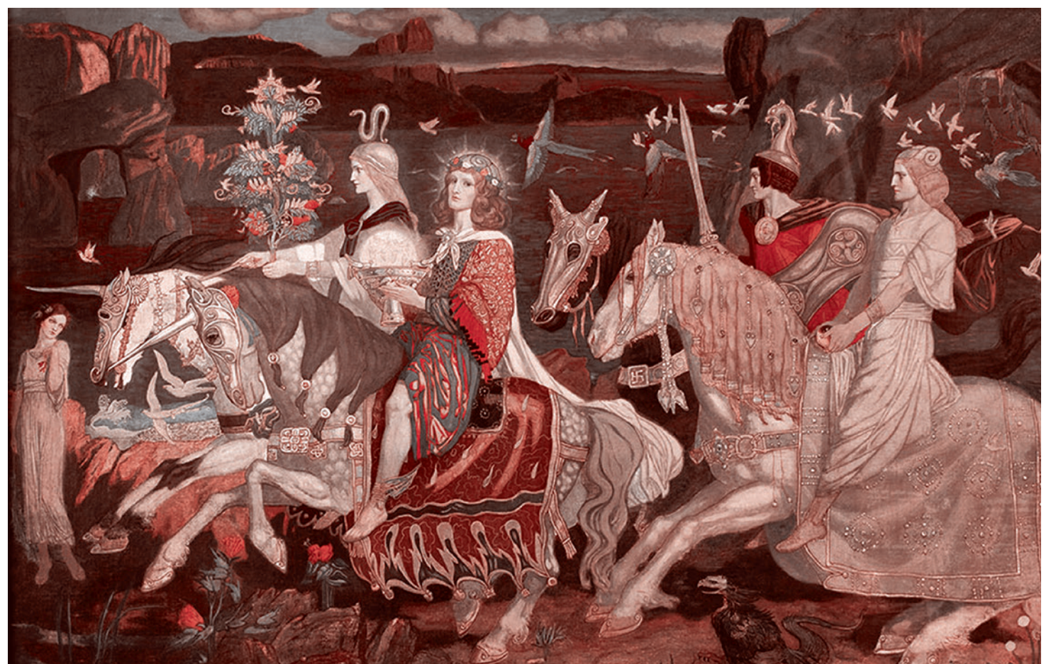
Джон Дункан. Всадники сидов. 1911