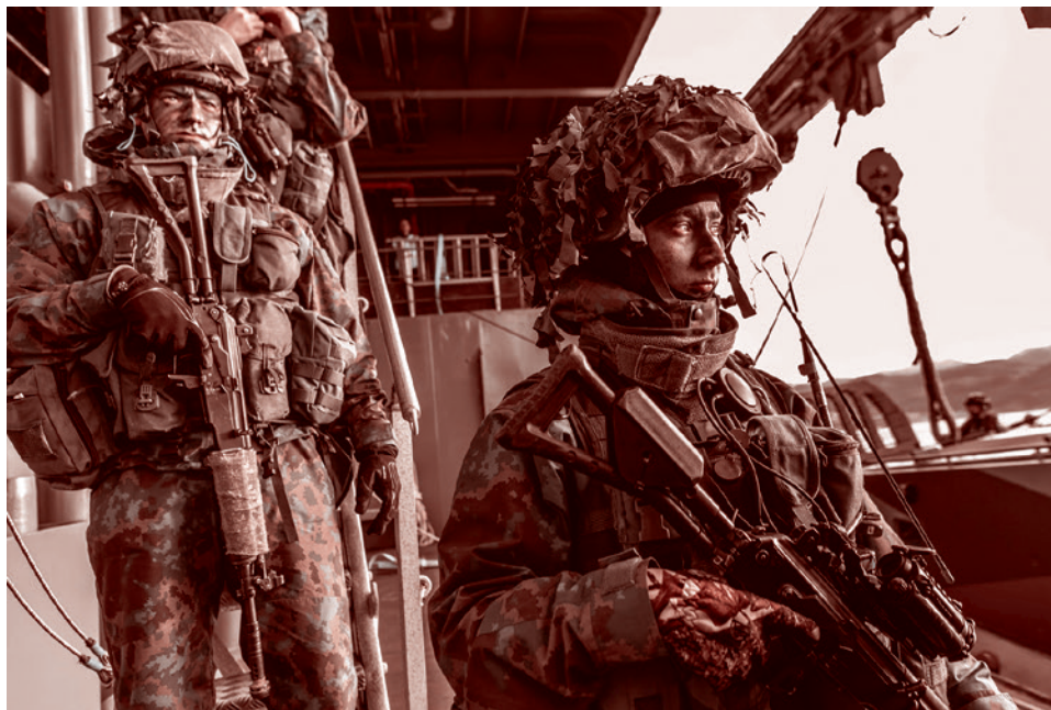
Финские солдаты в ходе учений НАТО Trident Juncture в Норвегии. 2018

Канал «ИМИ МГИМО» сообщил: в контексте развития военно-политической ситуации на севере Европы наиболее вероятное место размещения будущего командного центра и контингента НАТО — Рованиеми. По новому оборонному соглашению США получили доступ к аэродрому Рованиеми и полигону Роваярви, что также не-