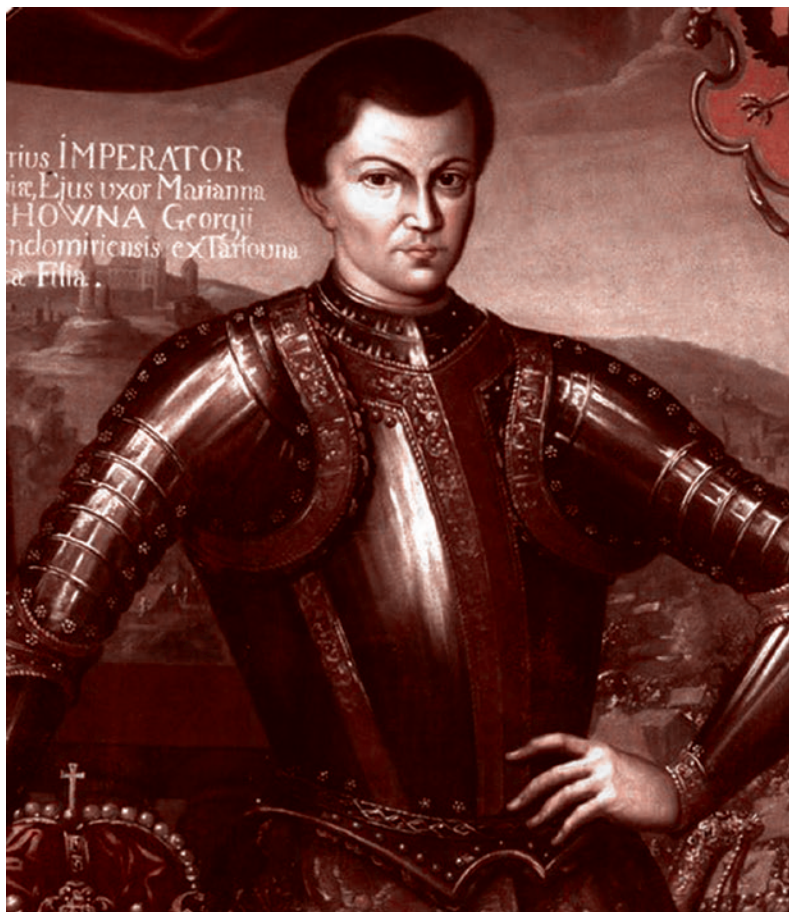
Александр Лжедмитрий I

Конечно, divide et impera — это вроде как римский тезис, но мы же помним, что на самом деле извечен был конфликт Карфагена с Римом, и именно Карфаген был той финансовой цивилизацией, которая