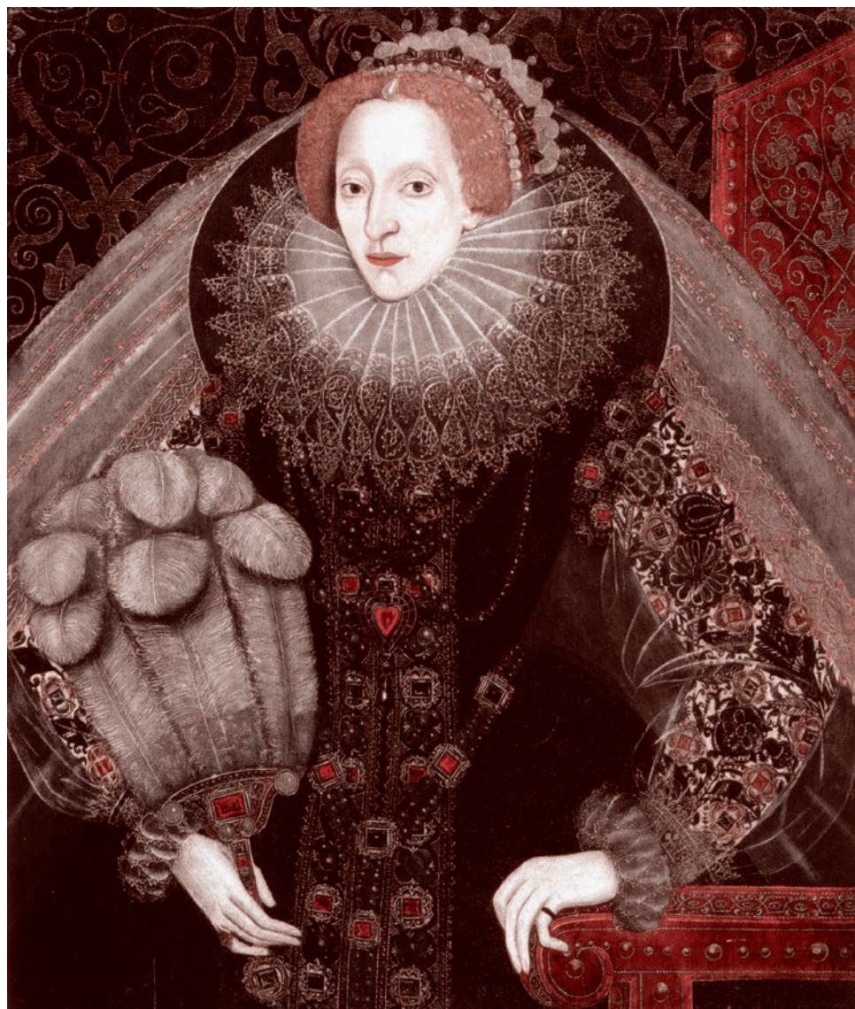
Елизавета английская. Портрет кисти неизвестного художника. Вторая пол. XVI в.