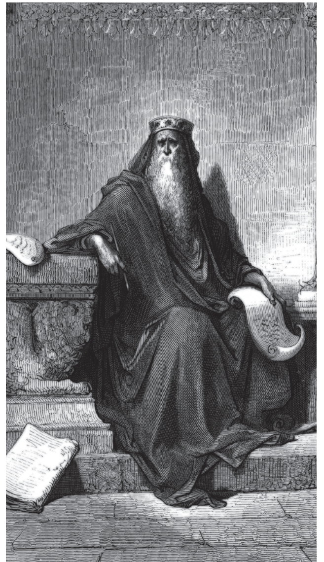
Густав Доре. Царь Соломон в старости. 1866

Сохраняется так называемая черная аристократия, она же есть. А она, в свою очередь, каким-то образом связана с предыдущими этапами существования этого кочевья: Карфагеном (который был разгромлен Римом) и докарфагенскими этапами. Когда по этому поводу — справедливо, отчасти — говорится об особом влиянии еврейского компонента, то это часть правды. Конечно, кто же будет спорить, что нидерландские семьи или еврейские круги были достаточно сильны в Англии. Но все забывают, что на какое-то время евреи вообще были из Англии изгнаны, что это чуть-чуть начало меняться при Елизавете, что реальным человеком, обеспечившим евреям место в Англии, был Оливер Кромвель, что в основе этого были глубокие оккультные представления, объединявшие Кромвеля с теми, кто приехал к нему от лица еврейских банковских семей.