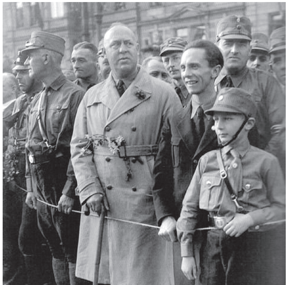
Грегор Штрассер и Йозеф Геббельс

Меллер ван ден Брук дал немецкому консерватизму новый импульс в условиях, когда правонационалистические круги Германии уже не могли игнорировать популярность коммунистических идей. Для того чтобы дискредитировать идеи марксизма и классовой борьбы и привлечь рабочие массы к идее нации, Меллер ван ден Брук начал играть на левом политическом поле, пользуясь лексиконом своих политических оппонентов, но вкладывая в их терминологию иное содержание. Так, под «революцией» он подразумевал приход к власти праворадикальных кругов силовыми средствами, под «социализмом» — немецкий (национальный, корпоративный) социализм. То есть социализм, очищенный, по завету Освальда Шпенглера, от марксизма — социализм без классовой борьбы, диктатуры пролетариата и интернационализма. И очень понятно, почему эти слага-