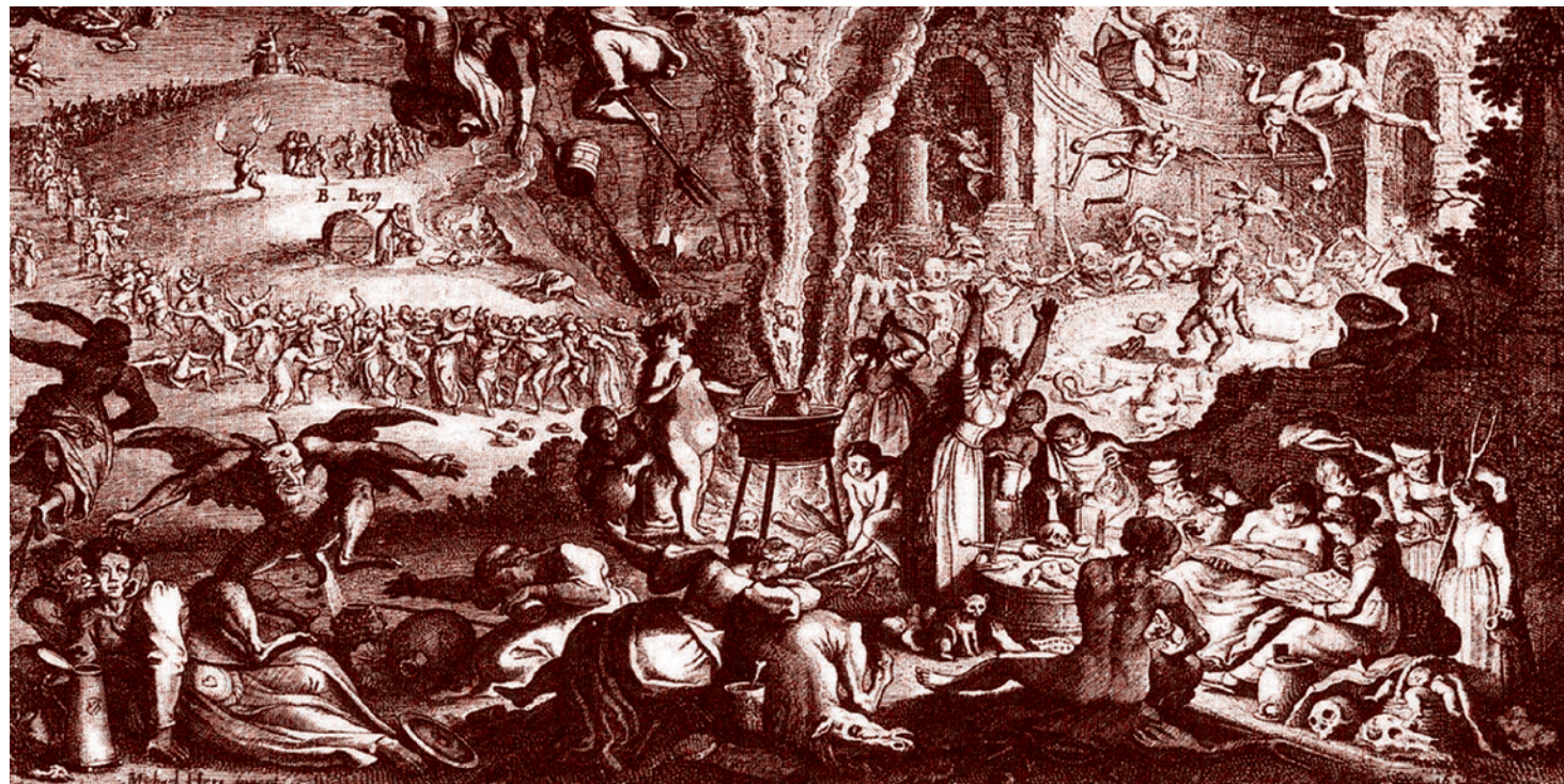
Михаэль Герр. Ведьмы (Суббота в Блоксберге). 1650

При этом, согласно лишь официальным данным, число приверженцев шаманизма с 2011 по 2021 год выросло