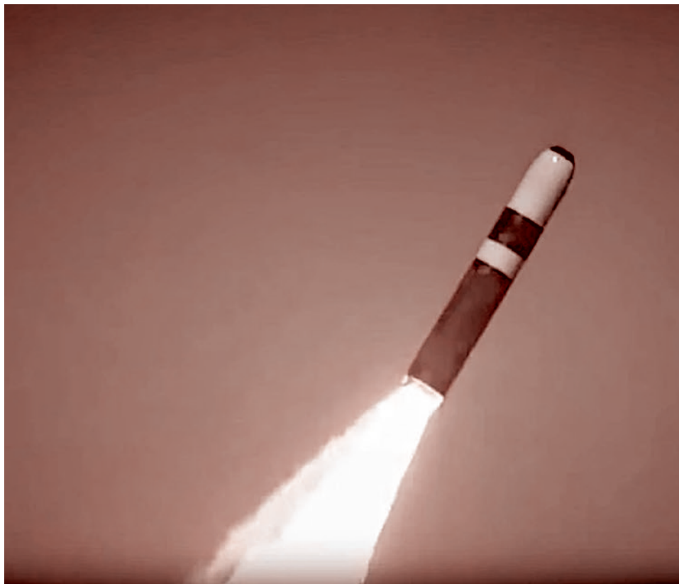
Американская трехступенчатая баллистическая ракета Trident II

Объекты поражения «Орешником» с территории Белоруссии у вероятного про-