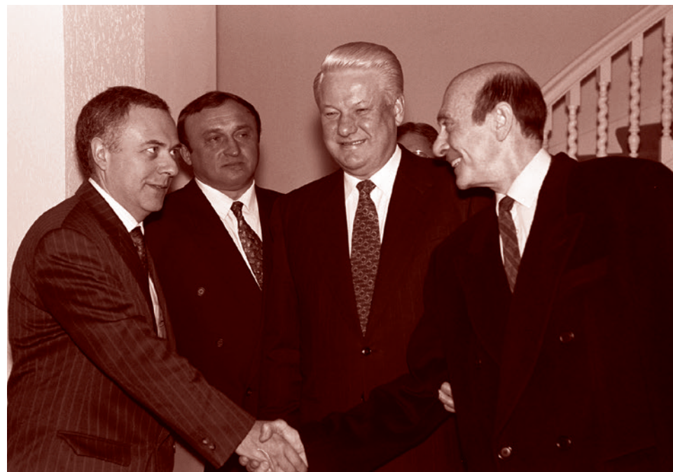
Встреча генерального секретаря НАТО Манфреда Вернера и президента России Бориса Ельцина. Декабрь 1993

Вопрос о необходимости формирования новой белорусской идентичности поднимался в Chatham House* в 2018 году в рамках доклада «Гражданское общество под угрозой со стороны России: Создание устойчивости на Украине, в Белоруссии и Молдавии». Ключевой посыл доклада заключается в следующем: Западу нужна такая белорусская идентичность, которая была бы устойчива к воздействию русской культуры!