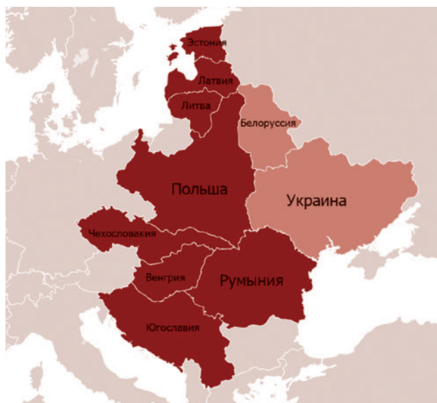
Проект «Междуморье». Выделенные Украина и Белоруссия были включены в состав Советского Союза в 1922 году

и правившей до XVI века. Династия Ягеллонов была основана литовским князем Ягайло, который в 1368 году взошел на королевский престол Польши под именем Владислава II. Идея Ягеллонов вращается вокруг создания федерации, в составе которой должны оказаться народы Литвы, Белоруссии и Украины, или так называемых Восточных кресов (окраин). Главным противником в данном случае выступают не западные соседи, в том числе Германия, а Россия, которая не будет безусловно смотреть на то, как Польша возвращает себе Восточные кресы.