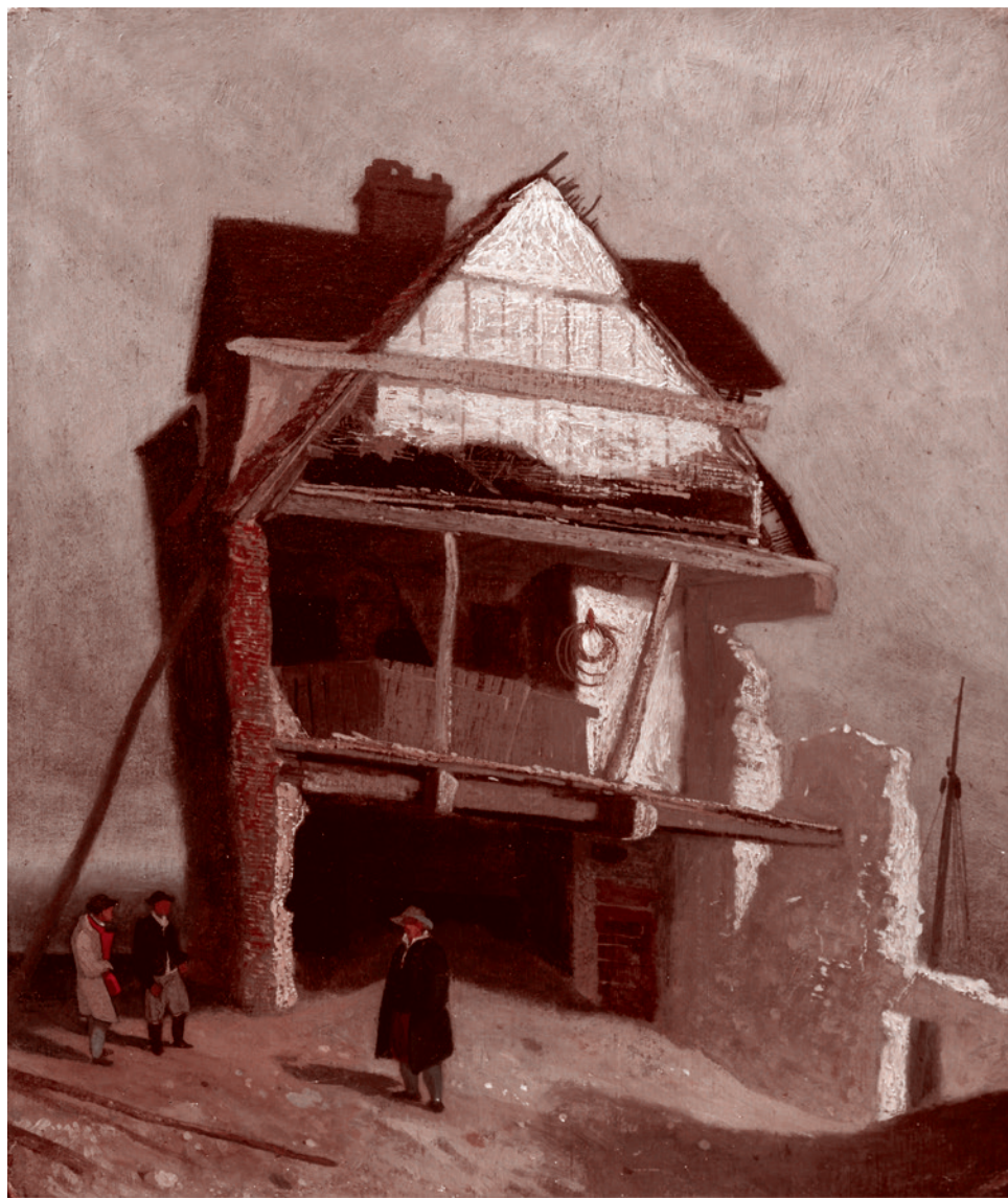
Джон Котман. Разрушенный дом. 1807–1810