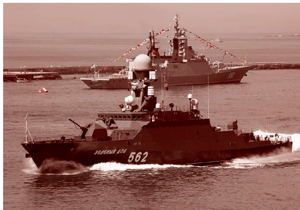
Корабли Балтийского флота

Пропаганду западных ценностей следует распространять через целевую аудиторию в социальных сетях и через поисковые системы, чтобы обеспечить максимальный охват населения. Запад должен добиться хоть какой-нибудь победы с точки зрения снижения давления на белорусскую оппозицию, чтобы на следующем этапе расширить ее поддержку, в том числе за счет молодежи, которой можно предложить визы для обучения в странах ЕС. По мнению британских экспертов, значительный процент белорусской молодежи стремится получить образование в европейских университетах. Эта молодежь и могла бы стать основой для будущих протестов.