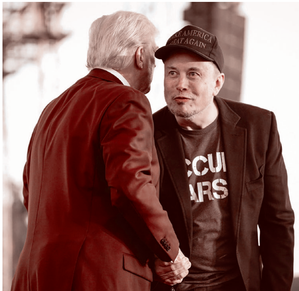
Дональд Трамп и Илон Маск

рит в революцию, которую произведет рост биткоина.