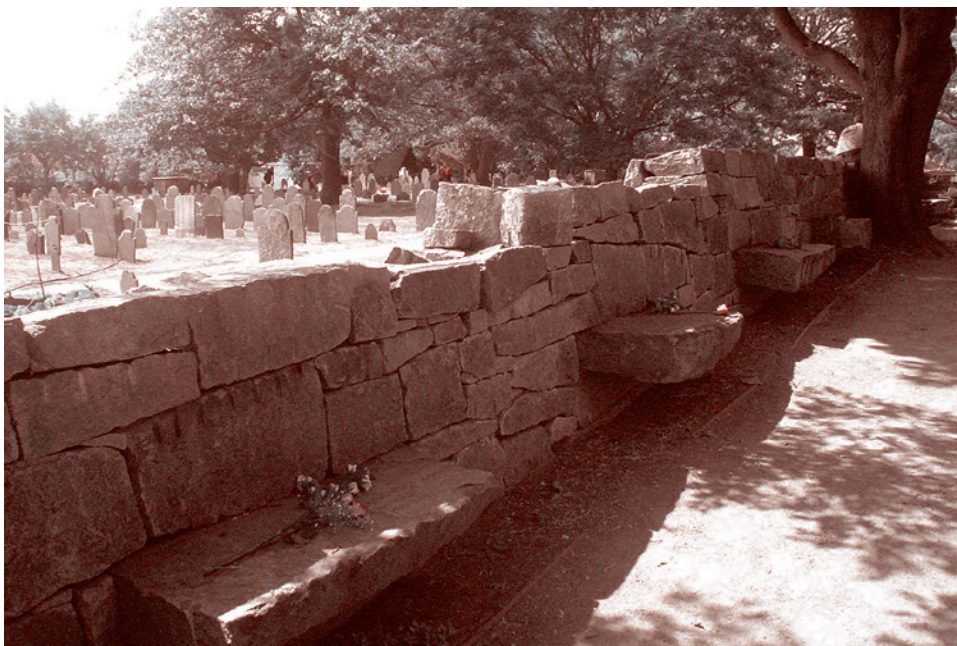
Мемориальный парк в память о пострадавших ведьмах в Салеме. Каменные скамьи в память о казненных