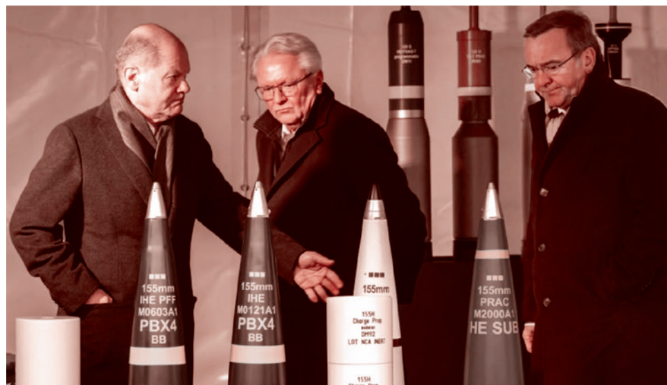
Олаф Шольц, Армин Паппергер и Борис Писториус

«€100 млрд у нас было в спецфонде (для модернизации бундесвера), таким