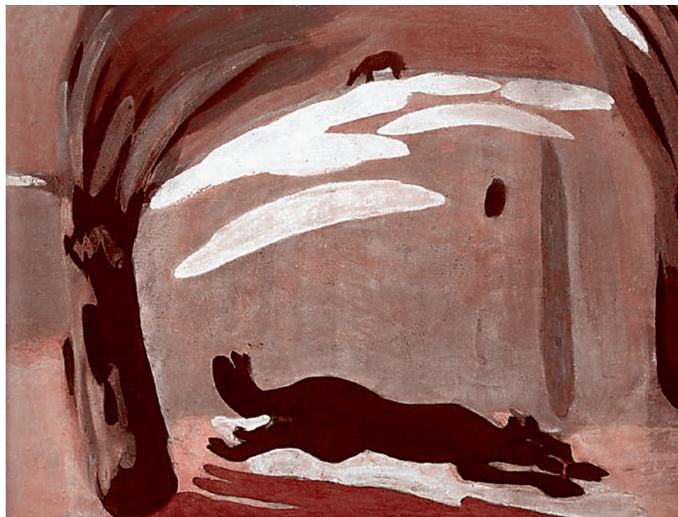
Мартiros Сарьян. Бегущая собака. 1909