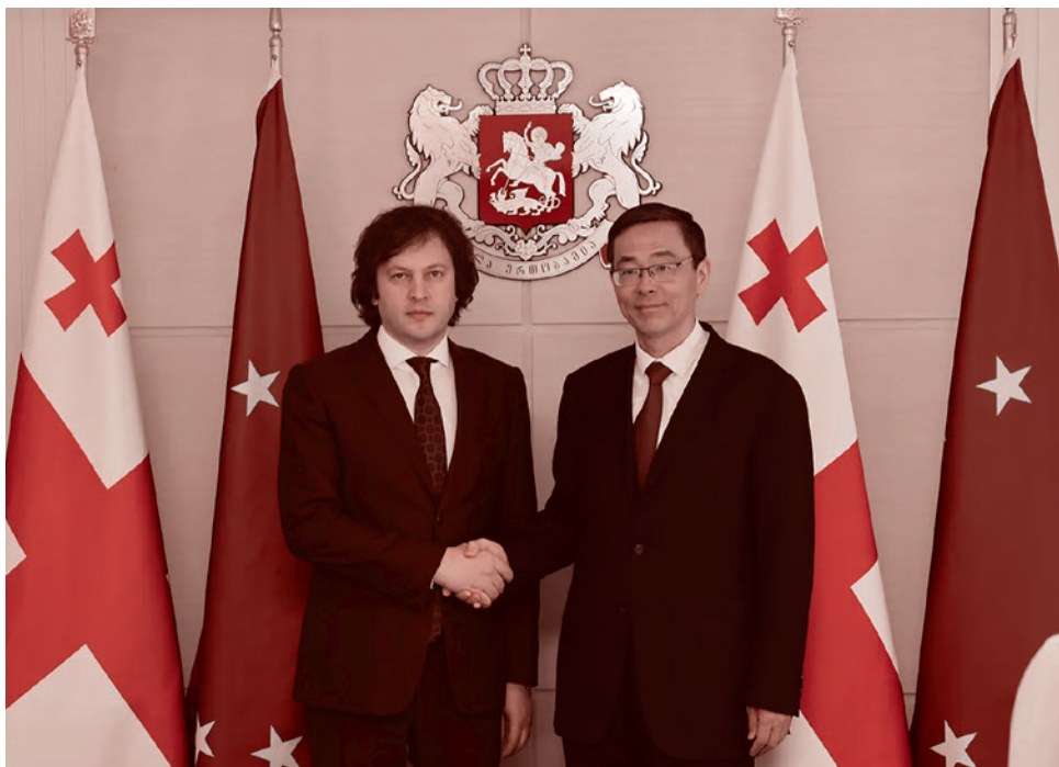
Премьер-министр Грузии Ираклий Кобахидзе и посол КНР в Грузии Чжоу Цзянь