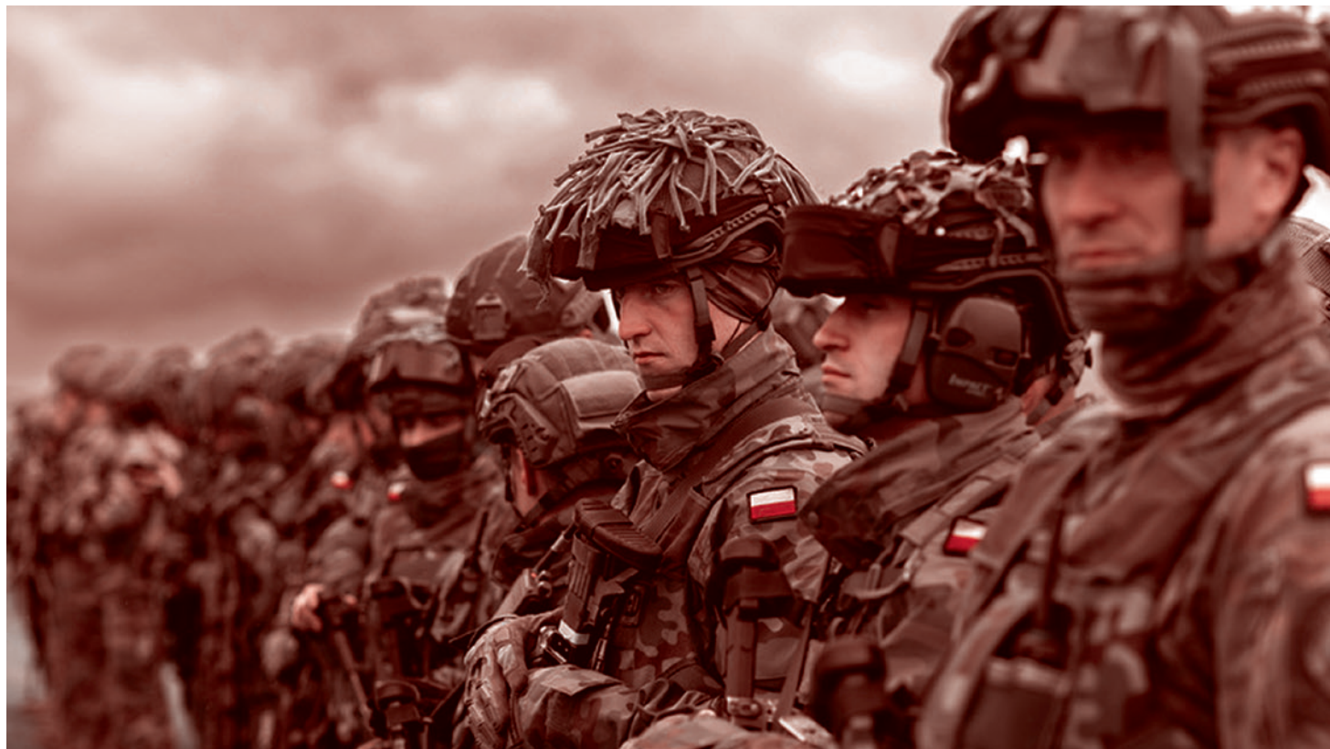
Польские солдаты из сил реагирования НАТО (NRF)