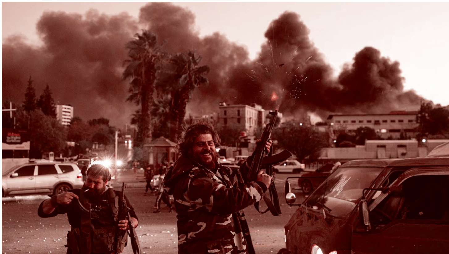
Члены отрядов вооруженной оппозиции в Дамаске

чали наступление на позиции правительственных сил, а к 8 декабря захватили Дамаск и положили конец полувековому правлению семейства Асад, стали неожиданностью для всего мира. «Произошедшее в целом, наверное, удивило весь мир, мы в данном случае не исключение», — признал 9 декабря пресс-секретарь президента РФ Дмитрий Песков. Он ушел от прямого ответа на вопрос о политическом убежище экс-президенту САР и членам его семьи. Однако отметил, что «подобные решения без главы государства принимать не могут».