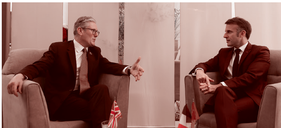
Кир Стармер и Эммануэль Макрон на саммите НАТО

Практически все вопросы по интеграции России и Белоруссии, которые вызывали