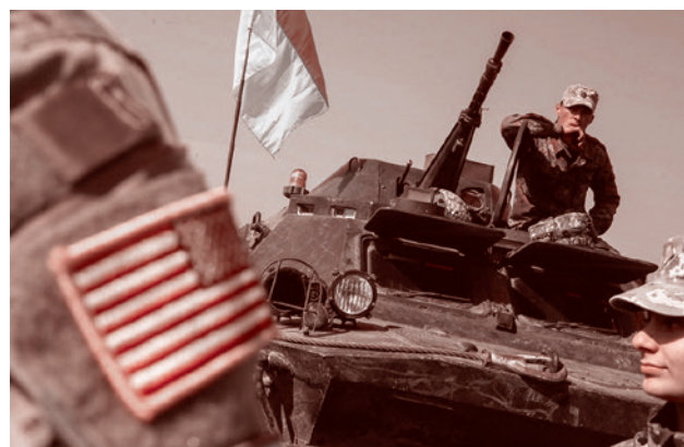
Советники НАТО на Украине

Резервные бригады (до 10 механизированных и штурмовых) занимают характерную «дугу» в тыловой зоне на юго-востоке