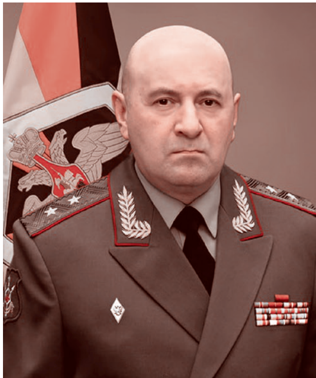
Начальник войск радиационной, химической и биологической защиты ВС РФ генерал-лейтенант Кириллов Игорь Анатольевич