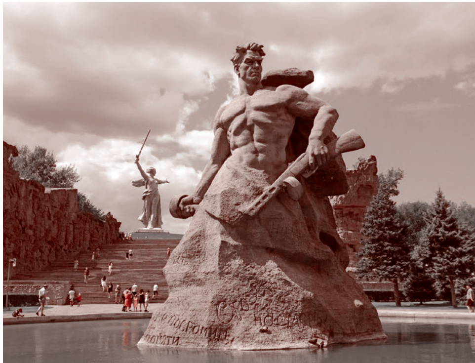
Памятник-ансамбль «Героям Сталинградской битвы» на Мамаевом кургане

Мать моя, когда мы с ней вместе смотрели фильм «Калина красная» Шукшина, сказала: «Ну понятно, почему его разрешили». Я говорю: «Почему?» «Ну, — говорит, — просто то, что играет Шукшин, было бы запрещено. Вот этот русский типаж. Но рядом же был брат Любы, который только молчит и работает. И этот образ так понравился партийным геронтократам, это был их идеал человека, что они махнули рукой на Егора».