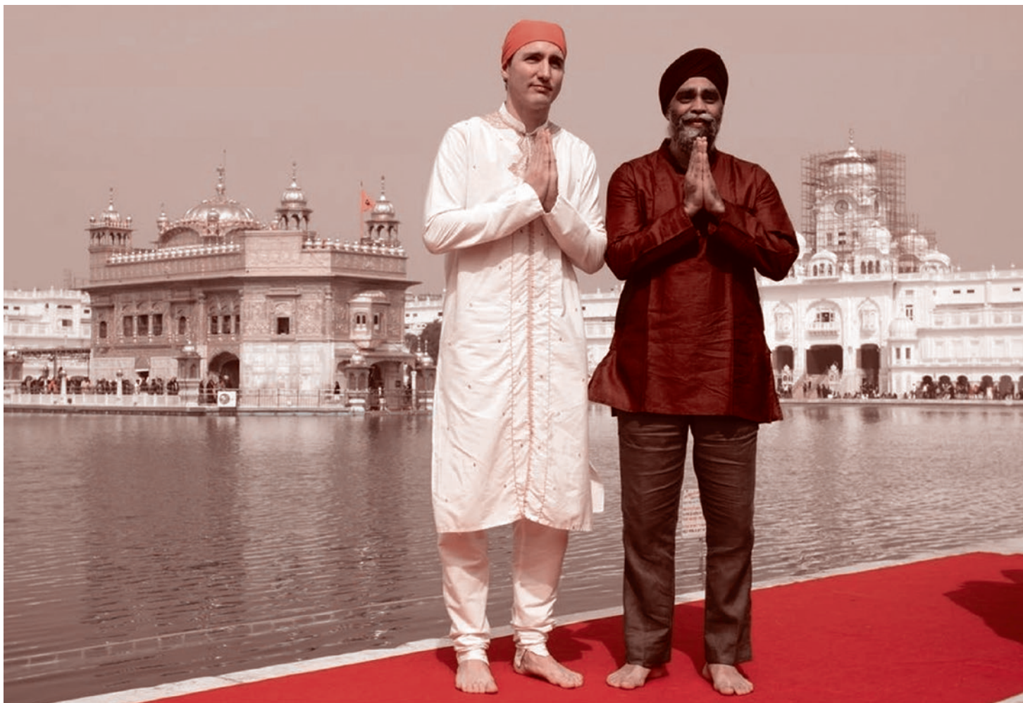
Джастин Трюдо с министром обороны Канады Харджитом Саджаном

Газета «Суть времени» зарегистрирована Федеральной службой по надзору в сфере связи, информационных технологий и массовых коммуникаций (Роскомнадзор) Свидетельство ПИ № ФС77-50554 от 9 июля 2012 года