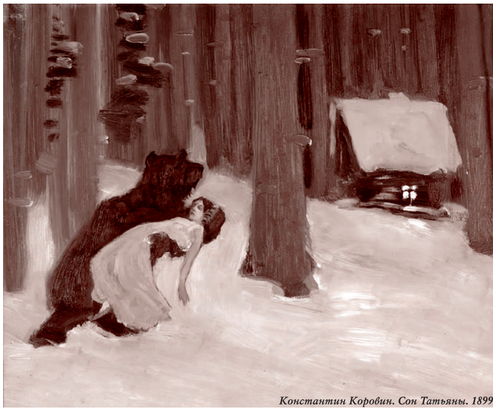
Константин Коровин. Сон Татьяны. 1899

Откуда то, что она по совету няни ворожит и использует архаично-крестьянские обряды? Когда она хочет узнать свою