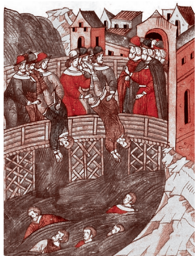
Казнь тригольников в Новгороде. 1375

«К моим мыслям о человеческом счастье всегда почему-то примешивалось что-то грустное, теперь же, при виде счастливого человека, мною овладело тяжелое чувство, близкое к отчаянию. <...> ...как, в сущности, много довольных, счастливых людей! Какая это подавляющая сила! Вы взгляните на эту жизнь: наглость и праздность сильных, невежество и скотоподобие слабых, кругом бедность невозможная, теснота, вырождение, пьянство, лицемерие, вранье... Между тем во всех домах и на улицах тишина, спокойствие; из пятидесяти тысяч живущих в городе ни одного, который бы вскрикнул, громко возмутился.»