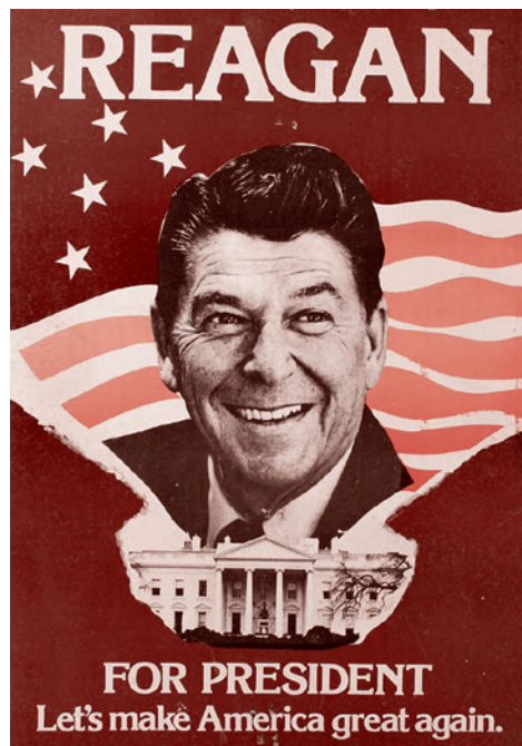
Предвыборный плакат Рональда Рейгана с лозунгом «Давайте сделаем Америку снова великой»

В интервью газете The New York Times в марте 2016 года Трампу прямо задали вопрос, когда же, по его мнению, Америка была великой. Трамп назвал два периода военной и промышленной экспансии США: в начале XX века, а также в годы после Второй мировой войны. По его словам, в те времена «нами не помыкали, нас все уважали, мы только что выиграли войну, мы в основном делали то, что должны были делать».