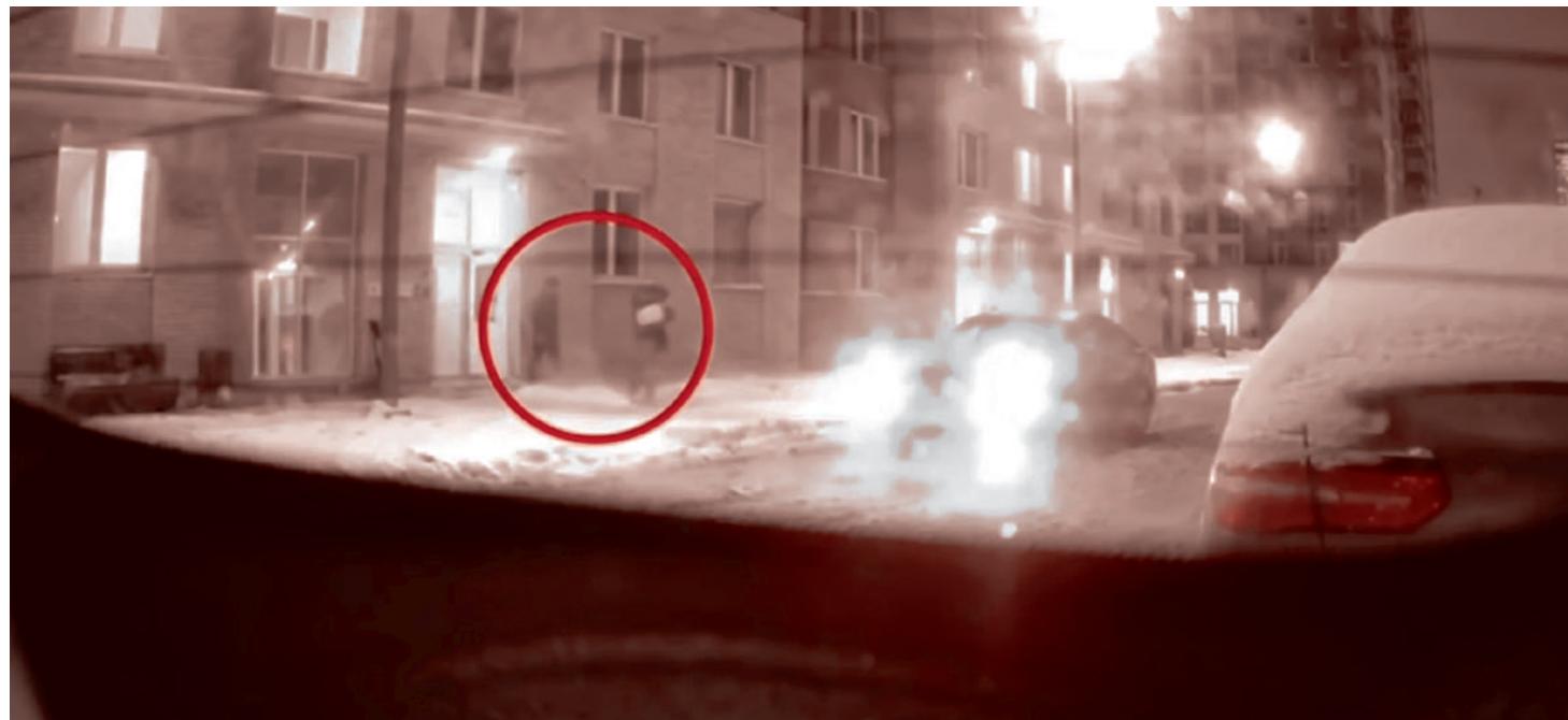
Кадры с видеорегистратора автомобиля, на который было заснято убийство генерал-лейтенанта Игоря Кириллова. Начальник войск РХБЗ и его помощник вышли из подъезда жилого дома на Рязанском проспекте (в центре кадра), после чего сдетонировала взрывчатка, заложенная в электросамокат (слева от подъезда)

«Прошел уже весь день. Где же хоть какая-нибудь реакция из-за рубежа? Где «цивилизованные»? Где «объективные»? Только Financial Times и BBC сообщают, что Игорь Кириллов, по мнению СБУ, —