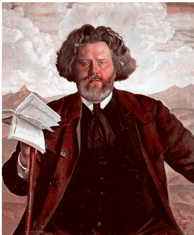
Борис Кустодиев. Портрет Волошина. 1924

И здесь, конечно, возникает вопрос о душе мира. Есть глубокое заблуждение людей, иногда искренне религиозных, думающих, что они что-то понимают до конца, но просто что-то не дочитавших