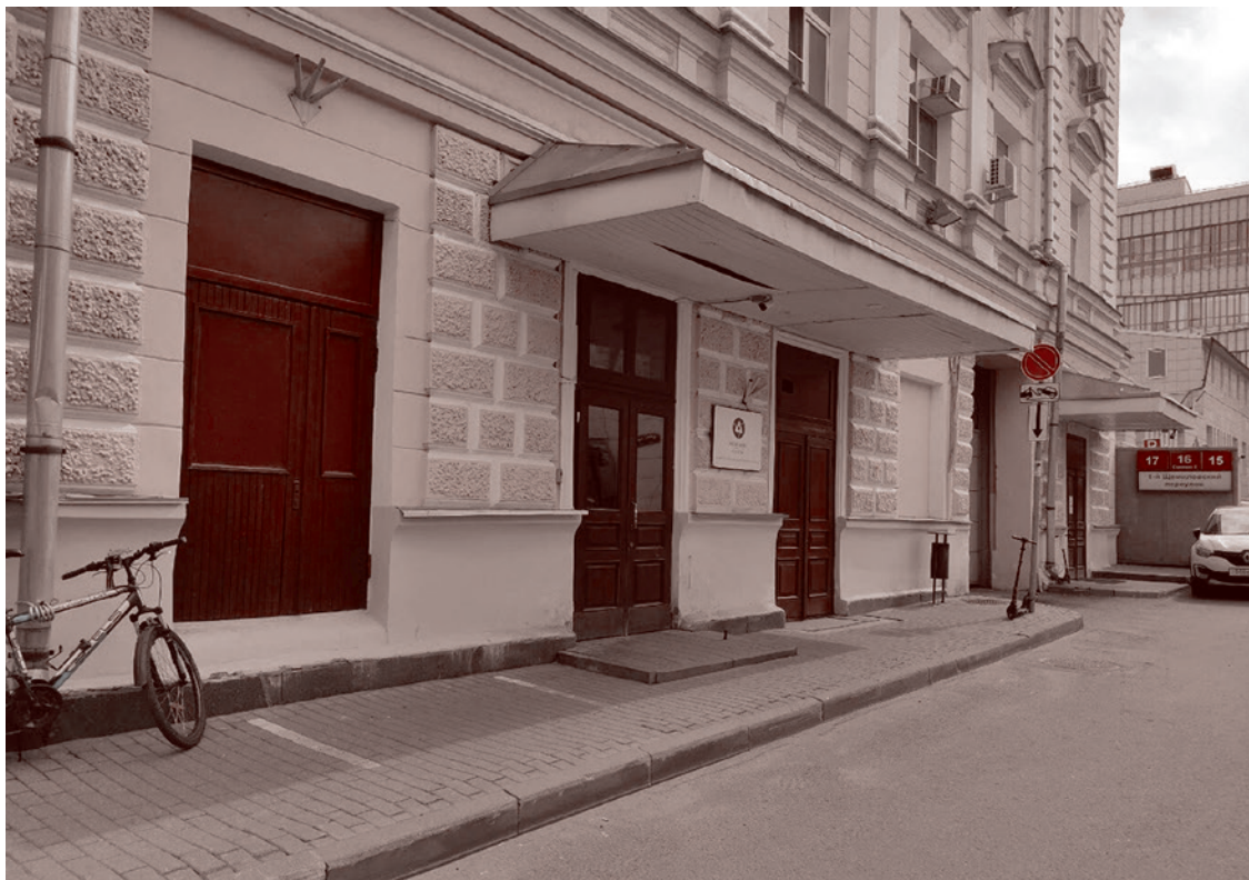
Вход в здание МОКБ «Марс» в центре Москвы. Справа от входа припаркованы два электросамоката

«абсолютно законная цель». Видимо, это и есть реакция Запада», — задает странные вопросы Захарова и сама же на них отвечает.