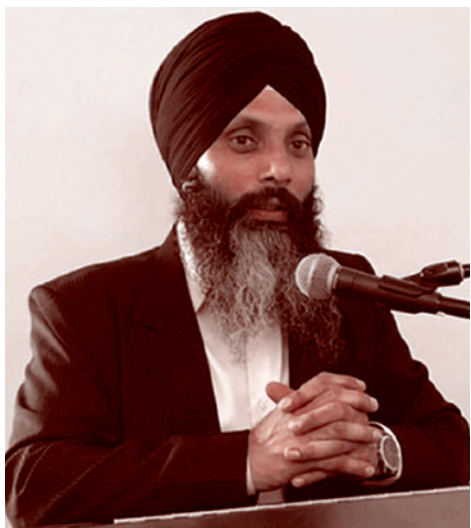
Хардип Сингх Ниджар

вила никаких доказательств своих обвинений. МИД Индии назвал обвинения частью «преднамеренной клеветнической кампании».