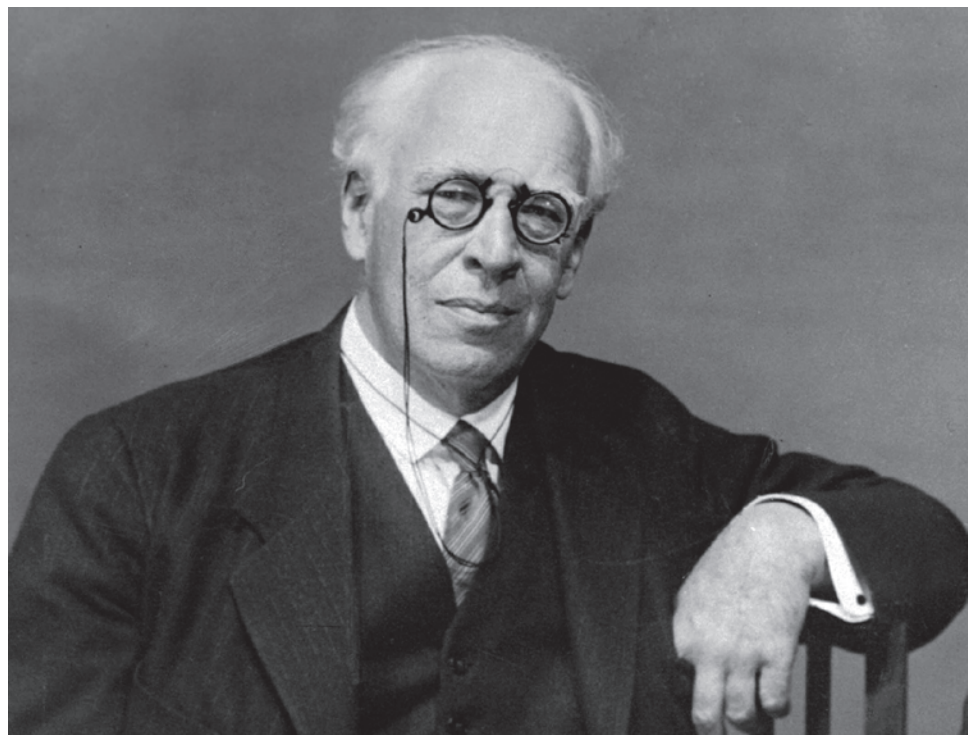
К. С. Станиславский

Под этим же флагом шли изменения — «мы станем как они», «сменим коды». А коды-то своеобразные. Но это бы