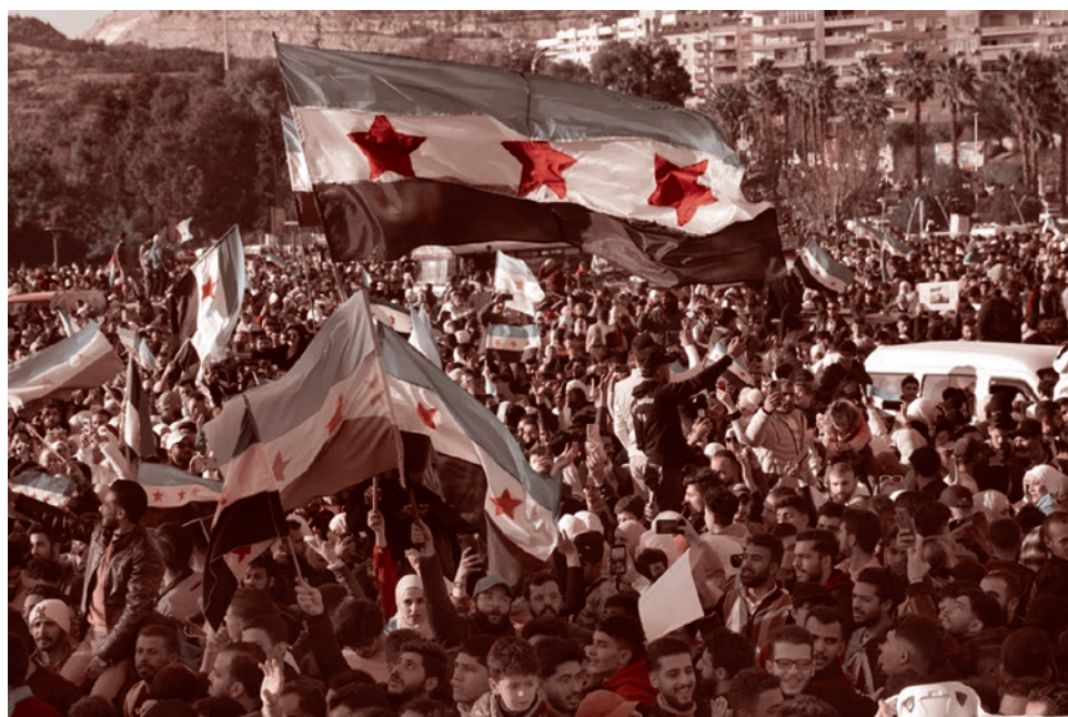
Митинг в Дамаске после бегства Башара Асада из страны. 13 декабря 2024

3. Иран в целом перестал быть ближневосточной страной. Его ожидает трансформация в игрока, жизненные интересы которого будут сосредоточены в регионе Залива, Южного Кавказа и Центральной Азии. Здесь Ирану в краткосрочной перспективе угрожает поглощение Турцией Закавказья и более агрессивный вход в Центральную Азию. «Зангезурский коридор», который будет получен тем или иным способом, этот вход обеспечит.