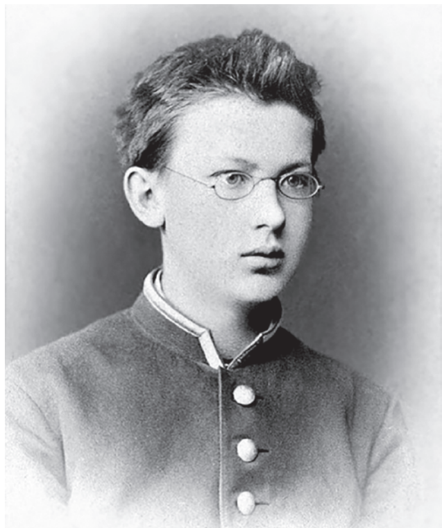
Гимназист Владимир Вернадский. 1878

авторитетные ученые, политики, философы говорили о таком будущем. Каким они его видели? Насколько актуальны их идеи сегодня? Обсуждение этого не менее важно, чем критика антигуманных концептов, лишаящих человечество масштабной перспективы. Поэтому в дополнение к циклу об «экологическом пороге» мы начинаем серию статей об альтернативных взглядах на будущее человечества.