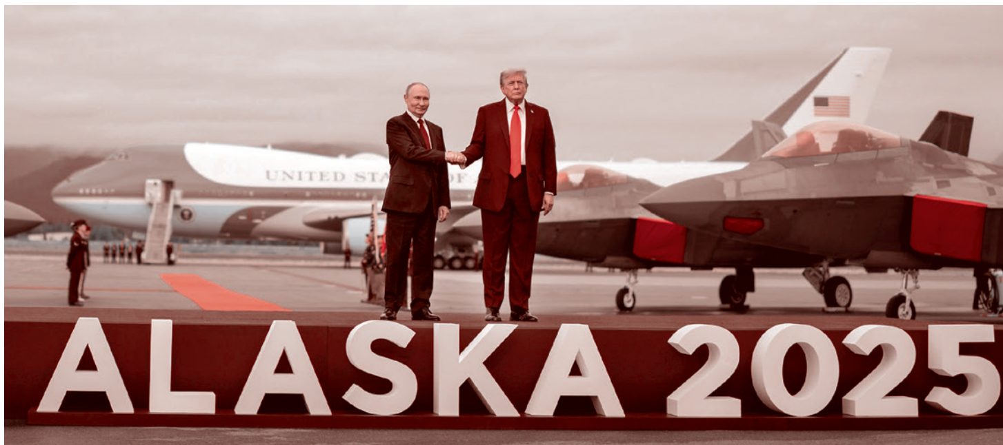
Президент России Владимир Путин и президент США Дональд Трамп на саммите в Анкоридже. Аляска. 2025

Но американцы тоже, как уважающая себя (и только себя) нация, решили показать, что под давлением не пойдут на диалог, а вместо этого возобновят ядерные испытания, которые не проводили более 30 лет — с 1992 года. Казалось бы, на этом о духе Анкориджа можно было бы и забыть, или, если он действительно жив, вместо того чтобы бряцать оружием, сесть за стол переговоров, а не ставить мир перед необходимостью новой ядерной гонки вооружений. Но этого-то и не происходит.