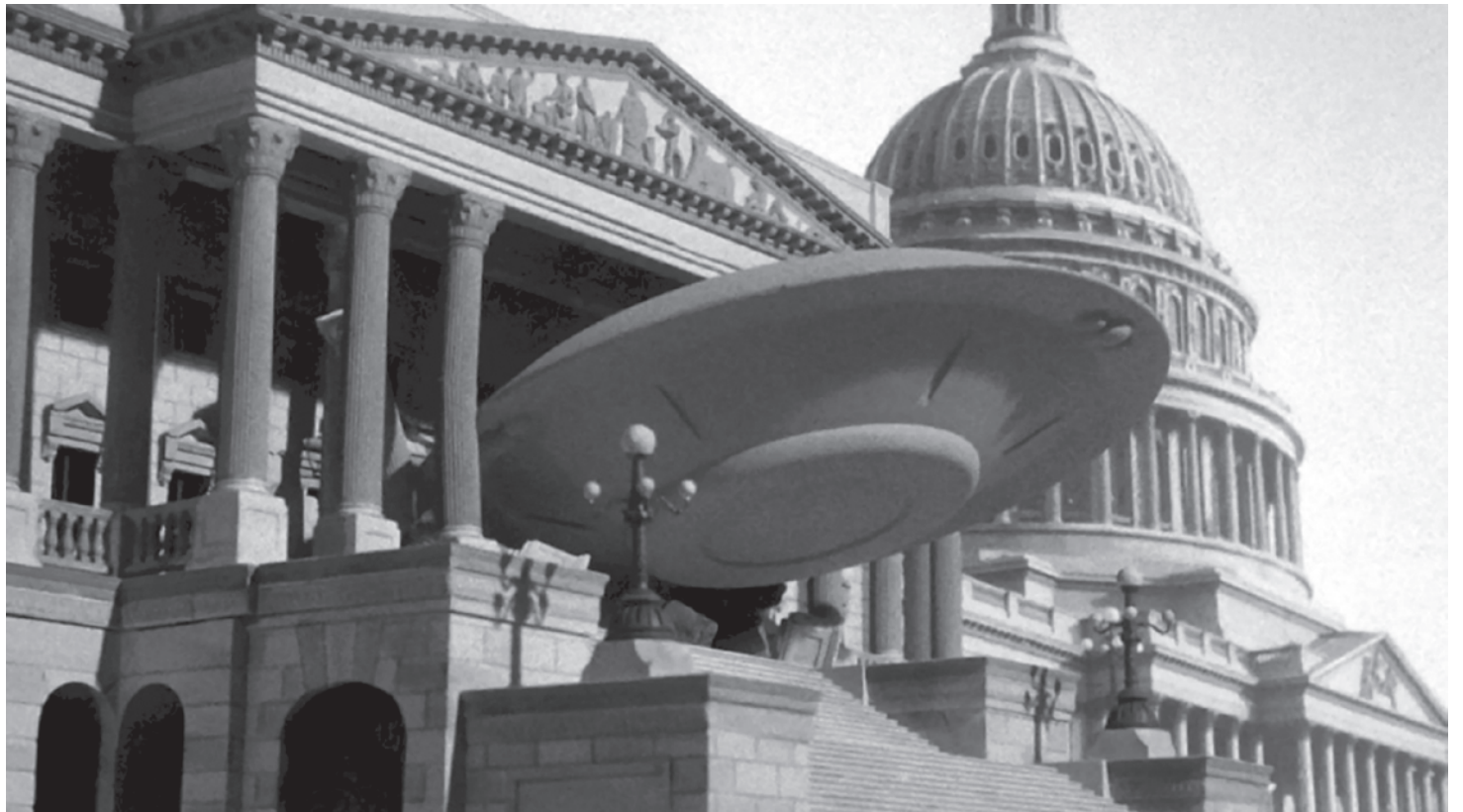
Цитата из х/ф реж. Фреда Сирса «Земля против летающих тарелок». США. 1956

Законопроект был принят сенатом США, но палата представителей, на тот