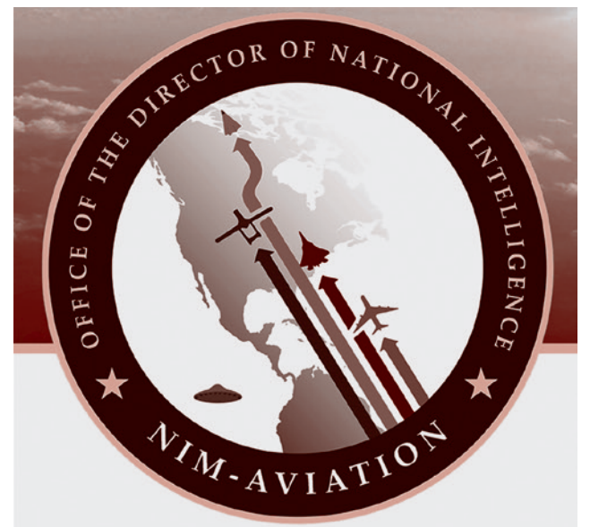
Логотип Управления национальной разведки США по авиации (NIM-A) с летающей тарелкой

С другой стороны, есть основания полагать, что аппараты, использующие нетрадиционный принцип движения, могут не иметь к инопланетянам никакого отношения и быть вполне земными, базирующимися на военных базах США. При этом информация о существовании этих аппаратов может быть настолько засекреченной, что о них не знают даже люди, готовившие брифинги для президента США (таковым является Дэвид Граш) и уж тем более конгрессмены.