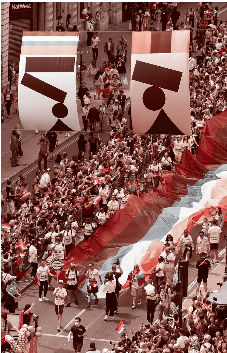
Прайд в Лондоне. 2022

вершенно неуместно, всерьез отказываясь от человеческого поведения.