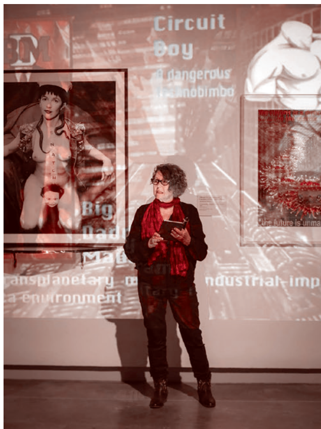
Выступление соучредительницы группы VNS Matrix Джозефины Старфс на выставке Dark Rooms в художественном музее Университета Гриффита в Брисбене, где были представлены работы VNS Matrix