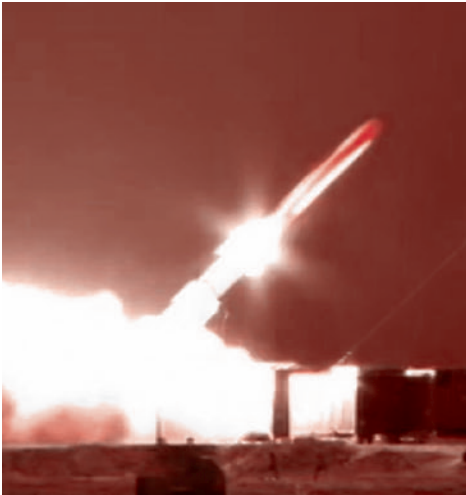
Запуск крылатой ракеты «Буревестник»

Россия отозвала ратификацию Договора о всеобъемлющем запрещении ядерных испытаний (ДВЗЯИ) из-за позиции США, которые его подписали, но так и не ратифицировали. Об этом заявил зам. главы