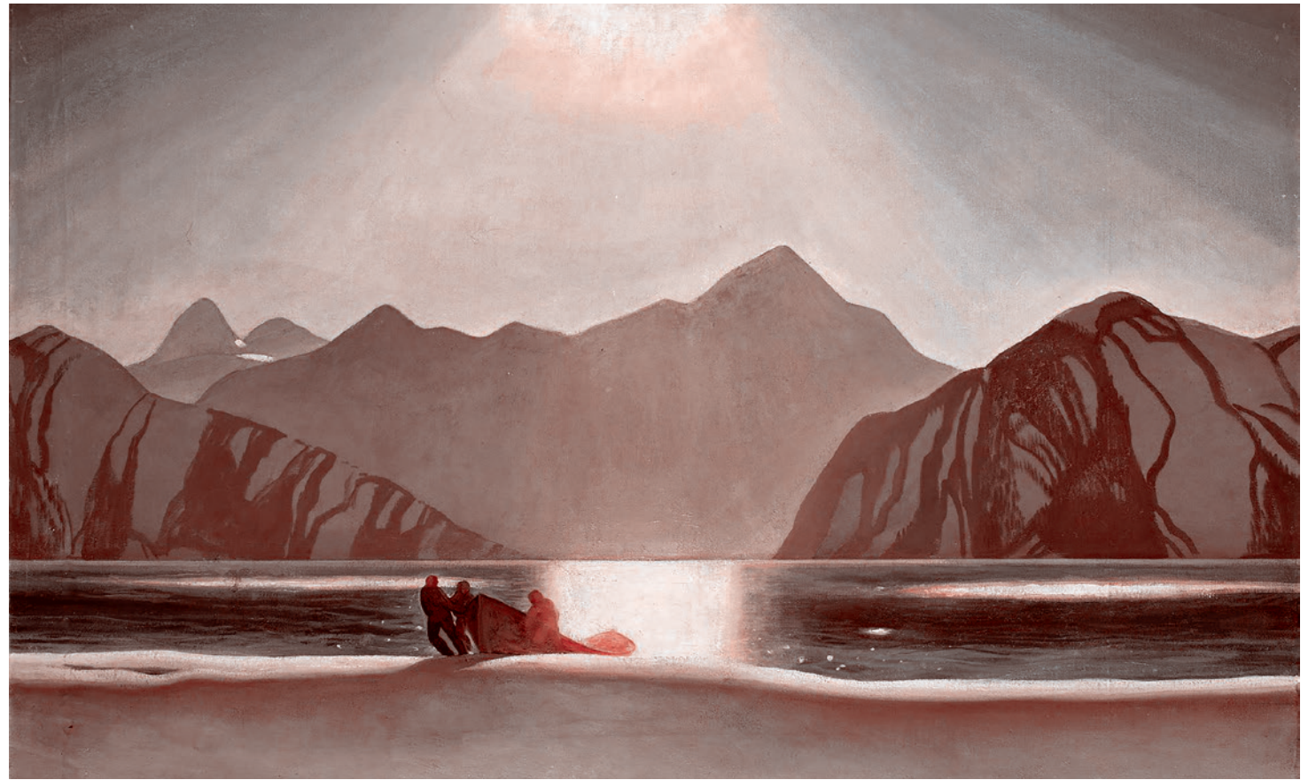
Рокуэлл Кент. Аляска, солнце. 1919

Так, в начале октября российский МИД устами зам. министра Сергея Рябкова констатировал, что импульс Анкориджа практически исчерпан из-за позиции европейских стран. На что аппарат президента РФ в лице его помощника Юрия Ушакова и пресс-секретаря Дмитрия Пескова зая-