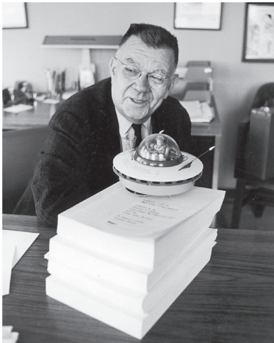
Американский физик Эдвард Кондон. 1969