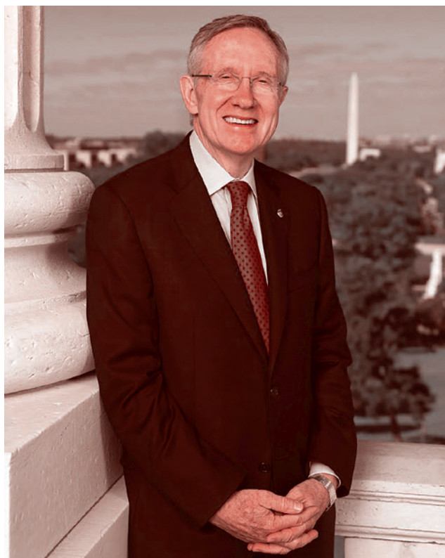
Сенатор Гарри Рид