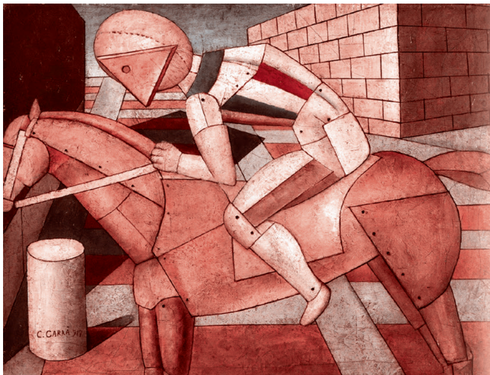
Карло Карра. Всадник с Запада. 1917

Получив прямой или уклончивый ответ, согласно которому экстазики книгу