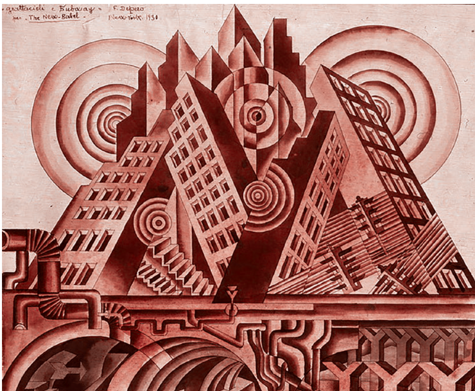
Фортунато Денеро. Небоскребы и туннель. 1930–1931