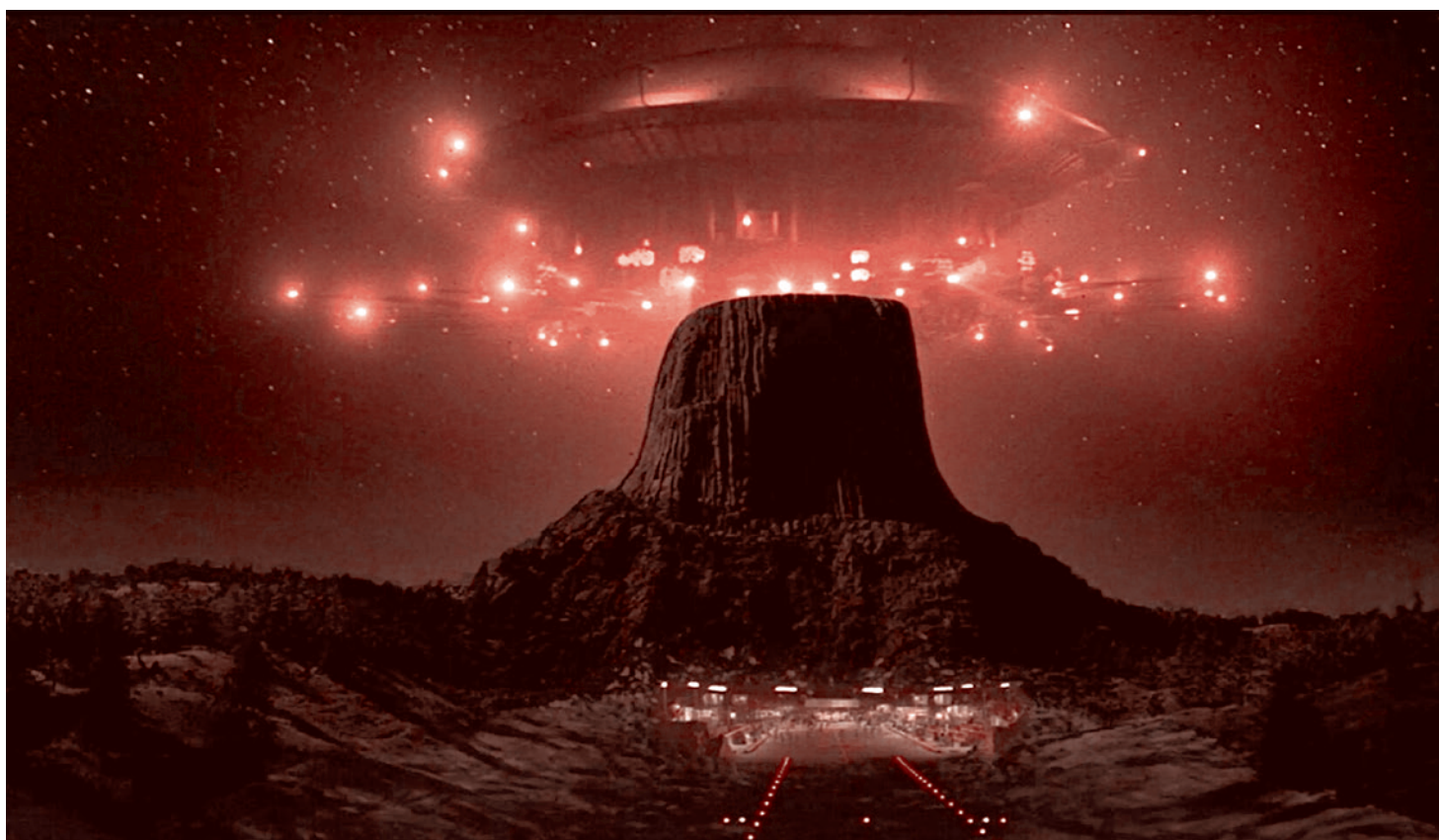
Цитата из х/ф реж. Стивена Спилберга «Бликие контакты третьего рода». США. 1977

Тем самым в сознании играющих нормализуется идея нападения на НЛО, захвата пленных, тайного исследования внеземных технологий, зарабатывание на этом денег, и все это не обязательно при