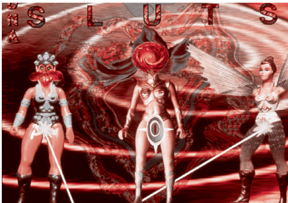
Видеоигра All New Gen

В 1997 году в ФРГ в городе Кассель состоялась первая конференция Киберфеминистского интернационала, участие в которой приняли представительницы из стран Европы, США, Австралии, Японии и России. Мероприятие прошло в рамках крупной художественной выставки современного искусства Documenta X. На конференции был коллективно составлен и принят юмористический манифест «100 антигезисов киберфеминизма», в котором, в качестве жеста против жестких определений, использовался апофатический метод. То есть вместо того, чтобы говорить, чем ки-