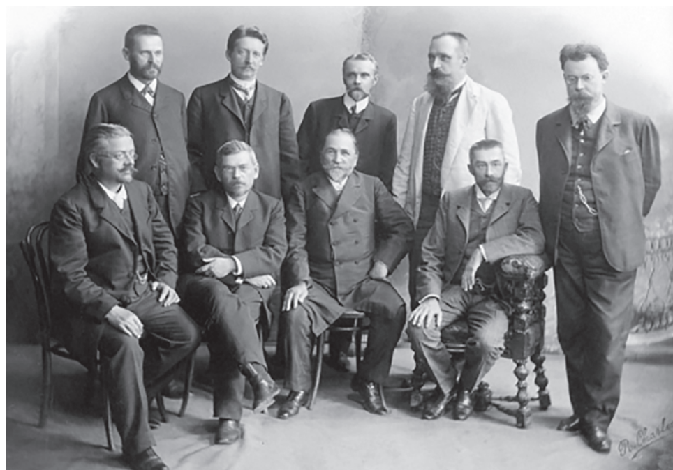
Вернадский в Государственном совете. 1906