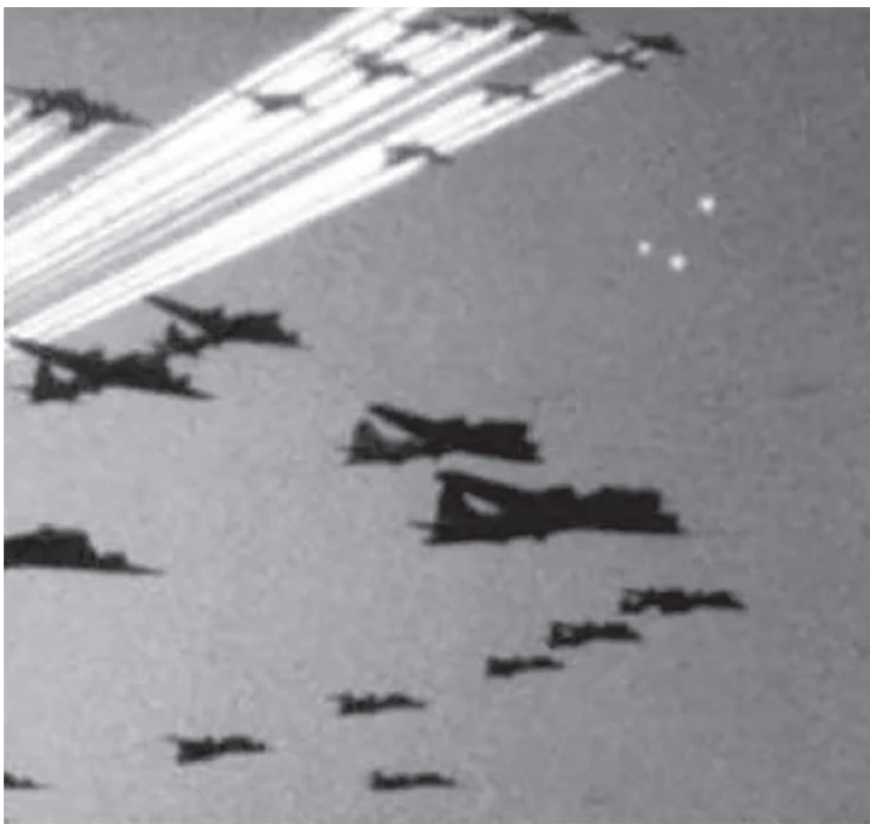
Фу-файтеры в небе над Европой во время Второй мировой войны. 1944

В 1965 году СМИ США захлестнула очередная волна сообщений о наблюдениях НЛО, после чего астроном и консультант «Синей книги» Дж. Аллен Хайнек написал письмо Научно-консультативному совету ВВС США (AFSAB) с предложением о созыве комиссии для повторного изучения «Синей книги». AFSAB согласилась, и сформированный ею комитет под председательством Брайана О'Брайена собрался на однодневное заседание в феврале 1966 года. Комитет предложил проводить исследования НЛО «более детально и глубоко, чем это было возможно до настоящего времени» в сотрудничестве «с несколькими избранными университетами». Предлагалось ежегодно изучать около 100 хорошо документированных наблюдений НЛО, выделяя на каждый случай около 10 человеко-дней. 6 октября 1966 года Университет Колорадо согласился провести исследование НЛО с физиком Эдвардом Кондоном в качестве директора проекта. Группа исследователей наиболее известна под названием «комитет Кондона».