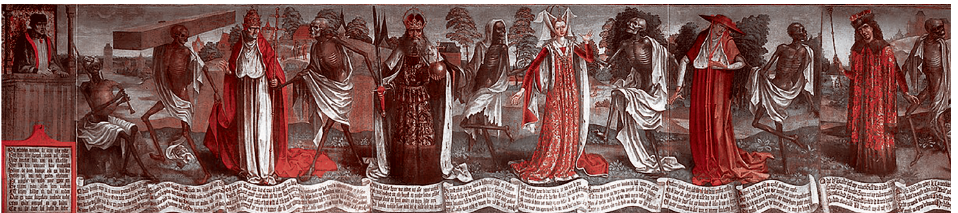
Бернт Нотке. Пляска смерти. 1475–1499 гг.