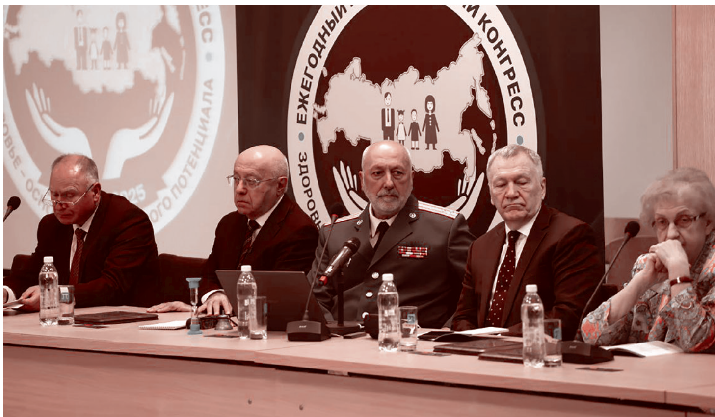
Президиум XX международного конгресса «Здоровье — основа человеческого потенциала: проблемы и пути их решения». 2025

Главное «действующее лицо» в элите, которое мне снится иногда по ночам, — это «шоколад». Ты начинаешь беседу, тебе говорят: «Все в шоколаде!» В каком шоколаде?! В каком смысле?! А в том смысле,