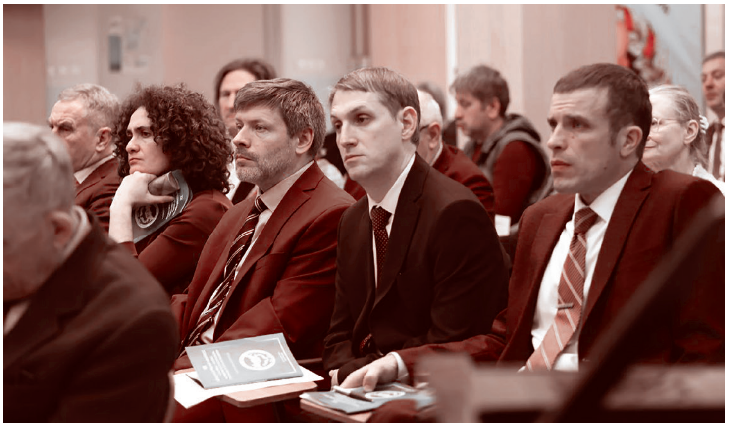
Участники XX международного конгресса «Здоровье — основа человеческого потенциала: проблемы и пути их решения». 2025

Поэтому на конференциях в рамках конгресса все чаще, помимо научных проблем, обсуждается не просто здравоохранение, а процесс его обрушения, не просто образование, а его уничижение, не вопросы демографии, а ее катастрофическое состояние.