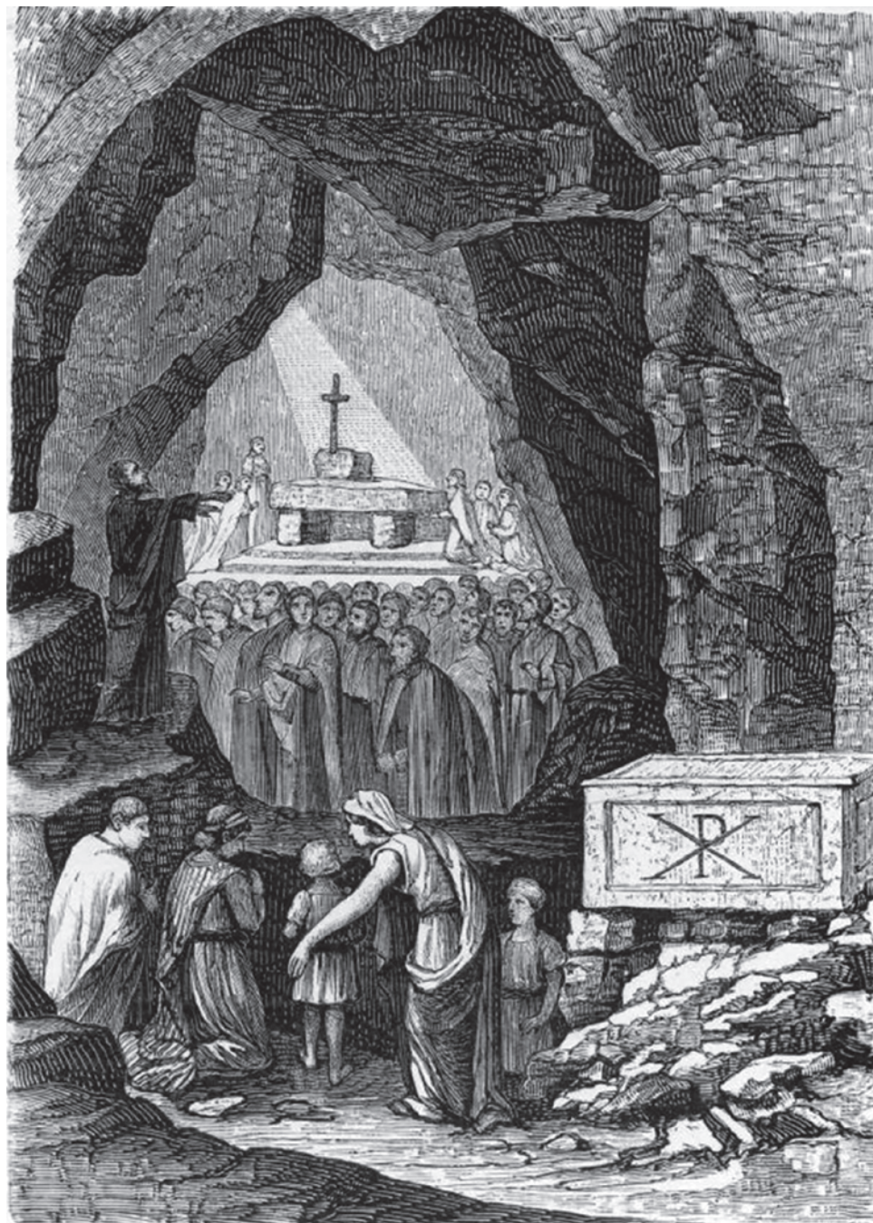
Неизвестный художник. Христиане в катакомбах Святого Каллиста ок. 50 год н. э. XIX век

Как быть с этим регрессом и что с ним делать? По Марксу, у каждой общественно-политической формации есть свой могильщик. Точно ли пролетариат — могильщик буржуазии — это вопрос спорный. А вот то, что буржуазия — могильщик феодализма, это было точно, со всеми чертами: высокотехнологические производства — мануфактурные заводы, тип одежды — коричневые сюртуки вместо расшитых камзолов, тип философии — просвещение, тип религии — протестантизм, жилища (посмотрите какие-нибудь флорентийские палаццо — это не дворцы, это совсем другое)... Буржуазия всё сделала и сконцентрировала,