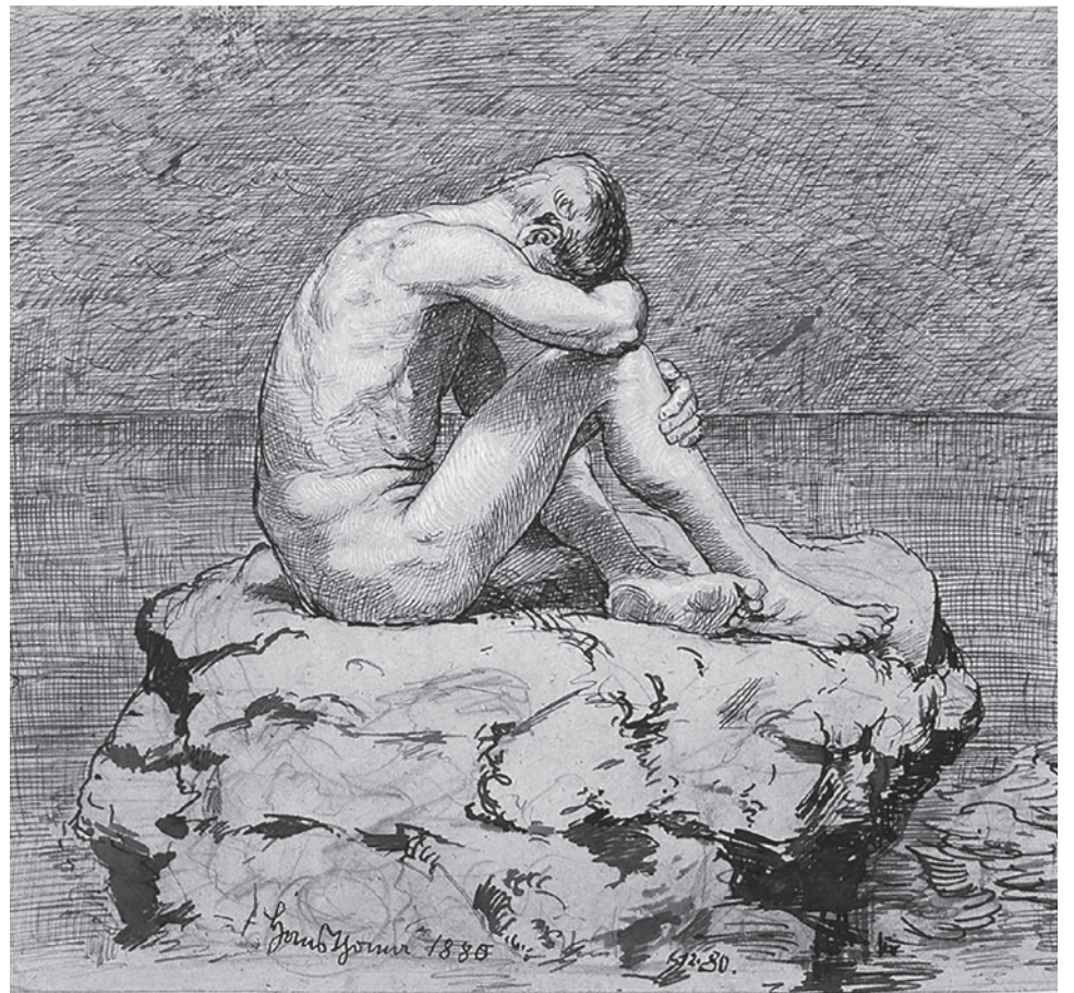
Ханс Тома. Одиночество. 1880