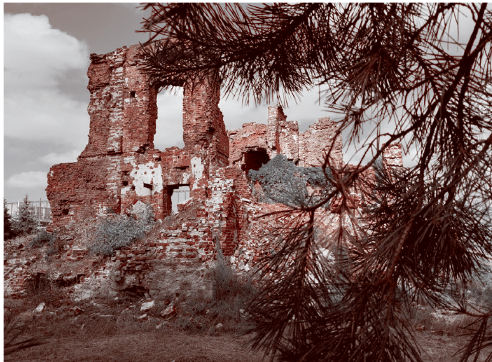
Руины дома, в котором находился командный пункт дивизии Людникова