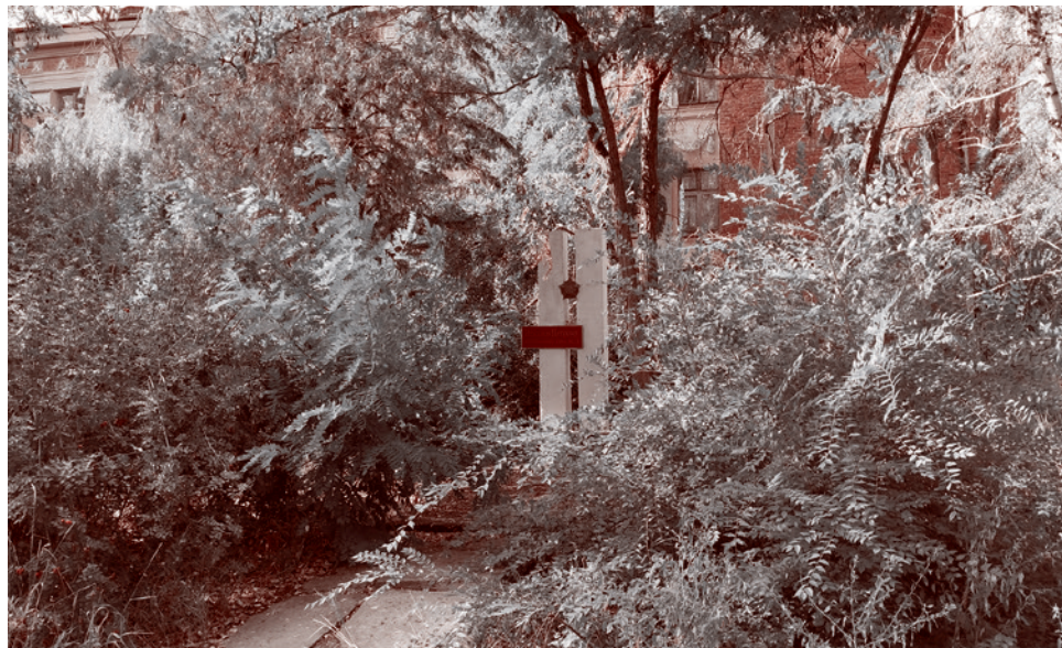
Памятник комсомольцу Николаю Петухову — разведчику 138-й дивизии Людникова