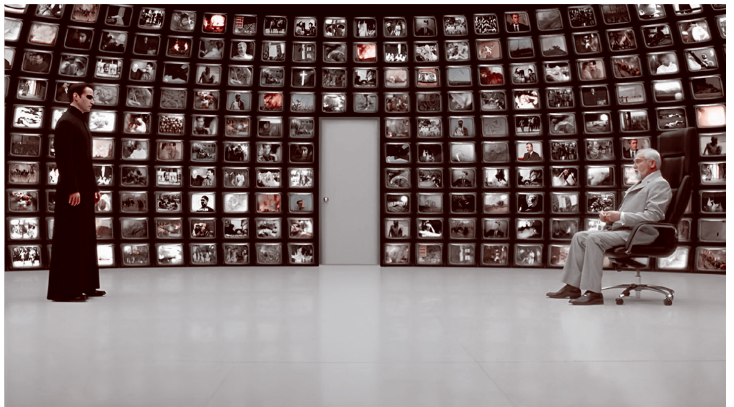
Разговор с богом. Цитата из х/ф «Матрица. Революция» реж. Лана Вачовски, Лилли Вачовски. 2003

Уже ни для кого не секрет, что за Трампом стоят не только лоббисты аме-