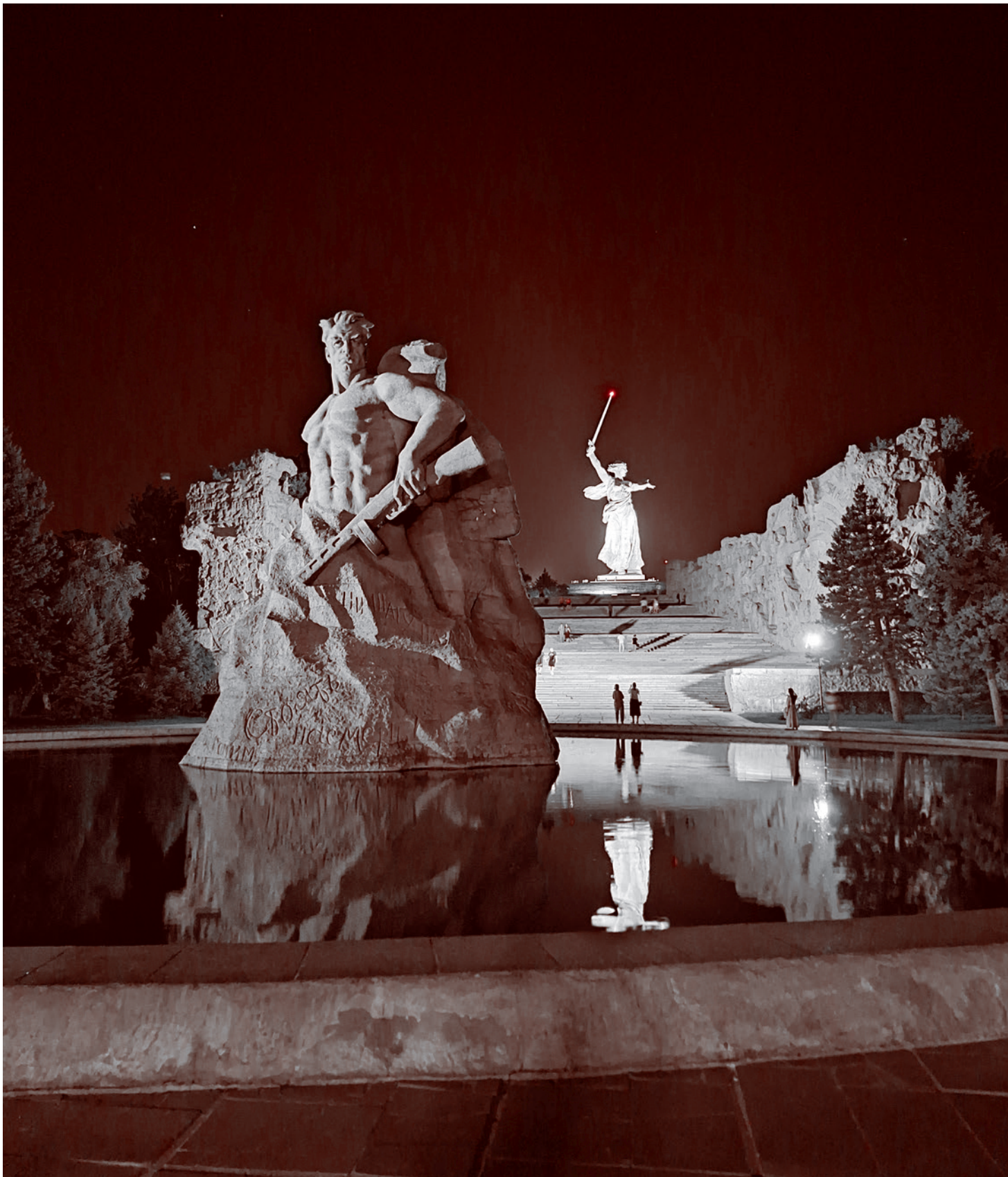
Мамаев курган ночью

И даже примерно понятно, как произошел этот переворот. Советские люди воевали