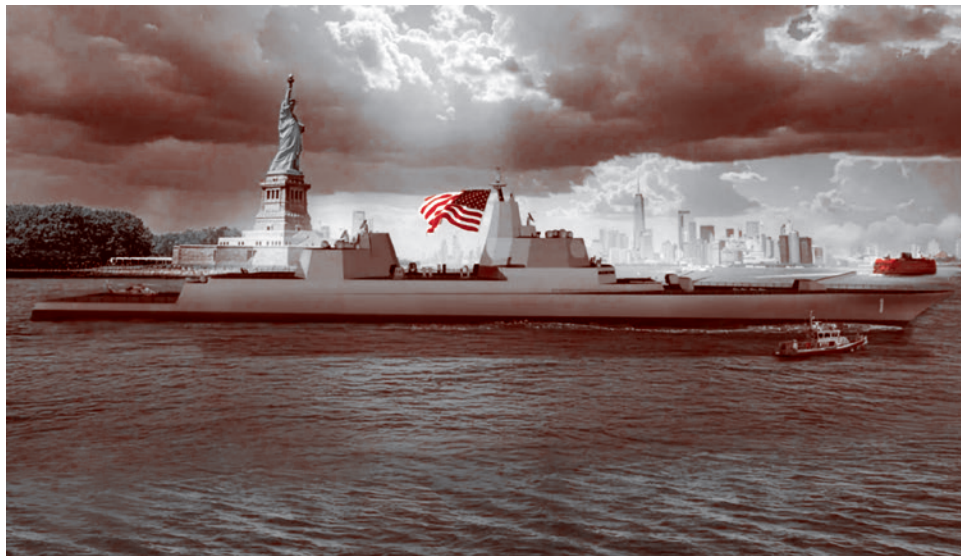
Планируемые проекты для USS Defiant, флагмана нового «Золотого флота» президента Трампа

Вот только это вряд ли сможет помочь США снова стать великими.