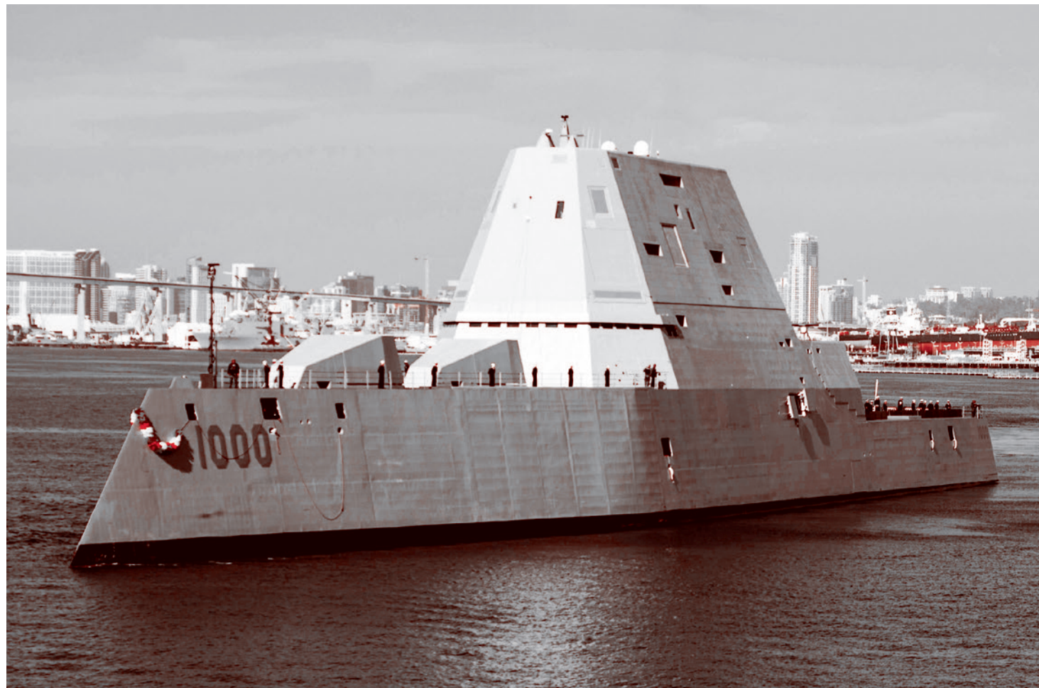
Ракетный эсминец USS Zumwalt

Жертвами подобных столкновений по принципу «око за око» стали тысячи человек, но, по оценке правозащитников, нет данных, подтверждающих, что нападению подвергается преимущественное христианское население.