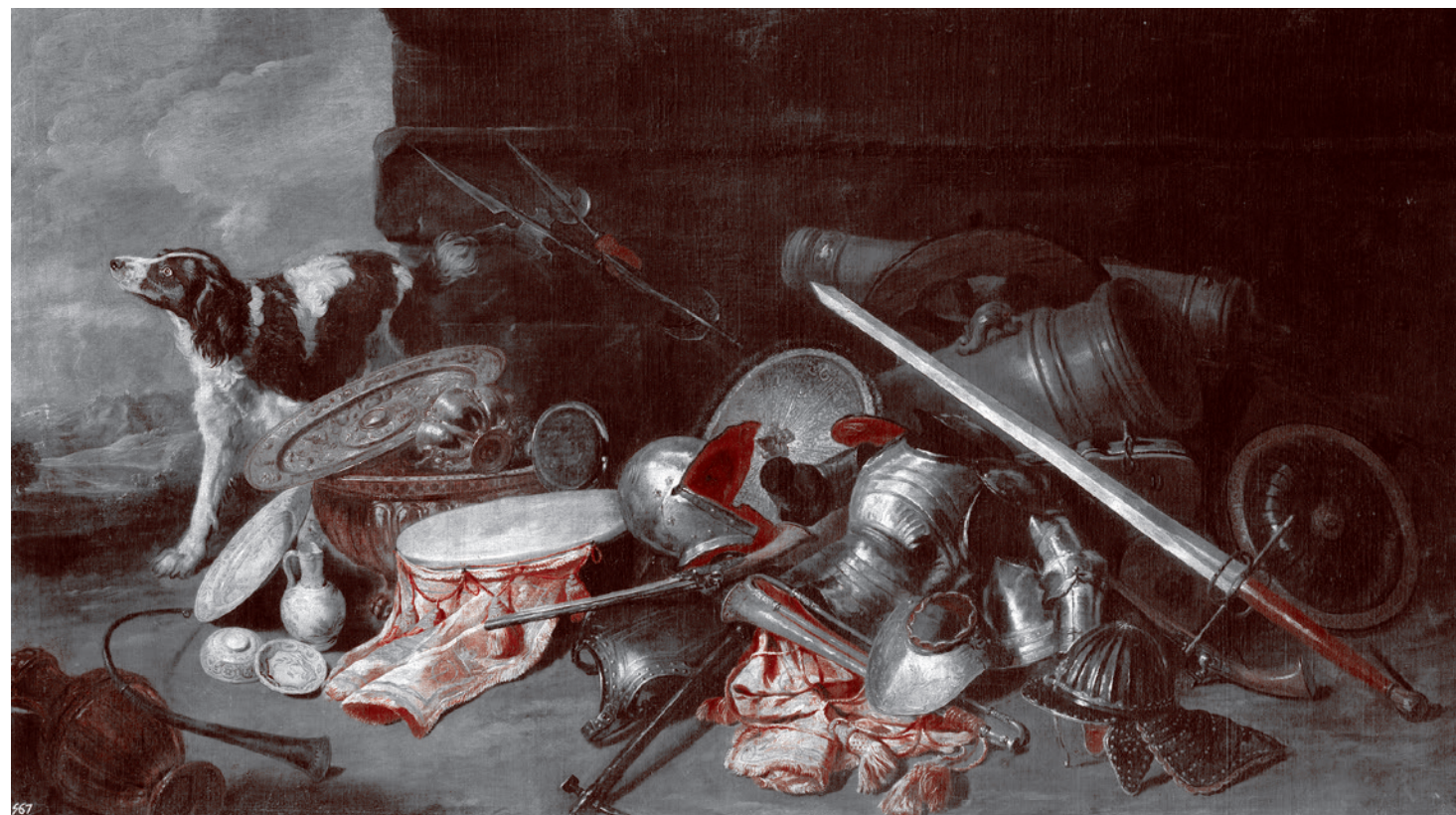
Питер Буль. Оружие и военные орудия. 1650