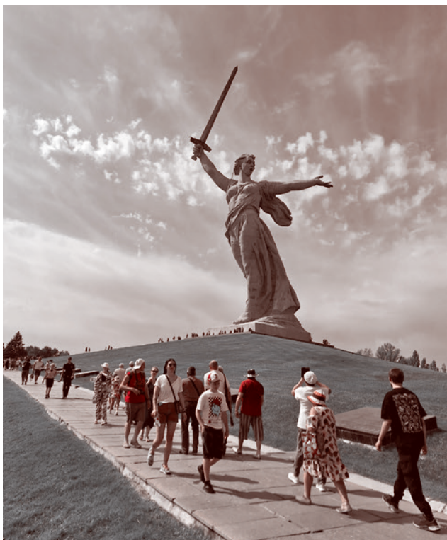
Монумент «Родина-мать зовёт!»

Милые девушки рвут беззастенчиво цветы с клумб, обрамляющих памятники, чтоб волосы себе украсить или кофточку.