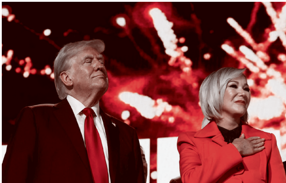
Президент США Дональд Трамп и его духовный наставник Пола Уайт

Здесь важно вспомнить, что айтишная элита в массе своей всегда тяготела к Демпартии и щедро жертвовала деньги на избирательные кампании демократов. А это значит, что приход Трампа в Белый дом — не просто очередной переход власти от демократов к республиканцам, а некий переломный момент во всей американской политике. Это начало «консервативной революции», главными бенефициарами которой, по всей видимости, окажутся не классические консерваторы, ориентированные