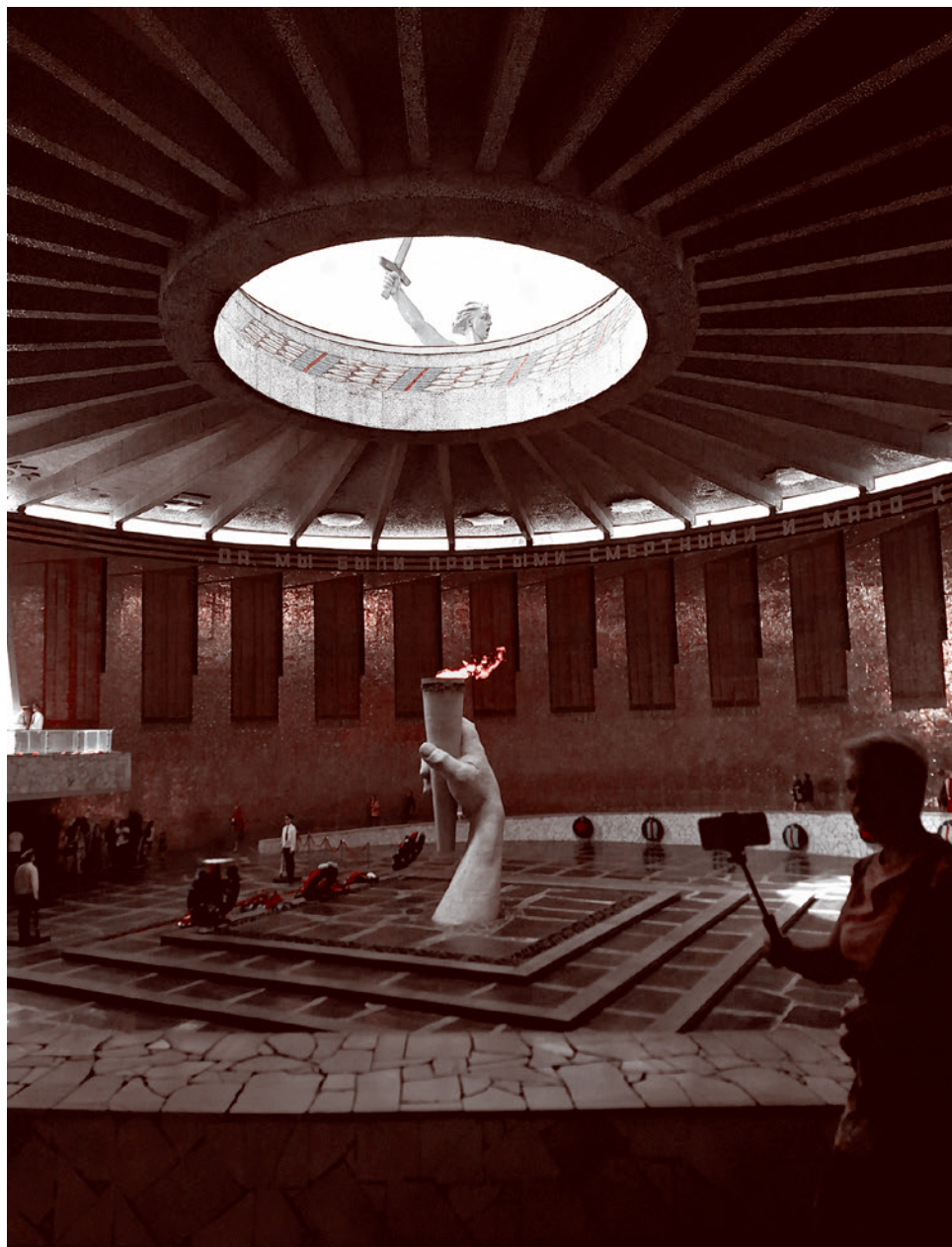
Зал Воинской славы на Мамаевом кургане