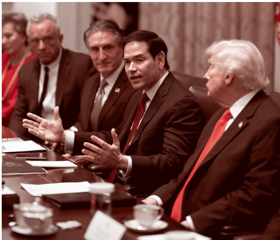
Госсекретарь Марко Рубио выступает во время заседания кабинета министров, проводимого президентом Дональдом Трампом