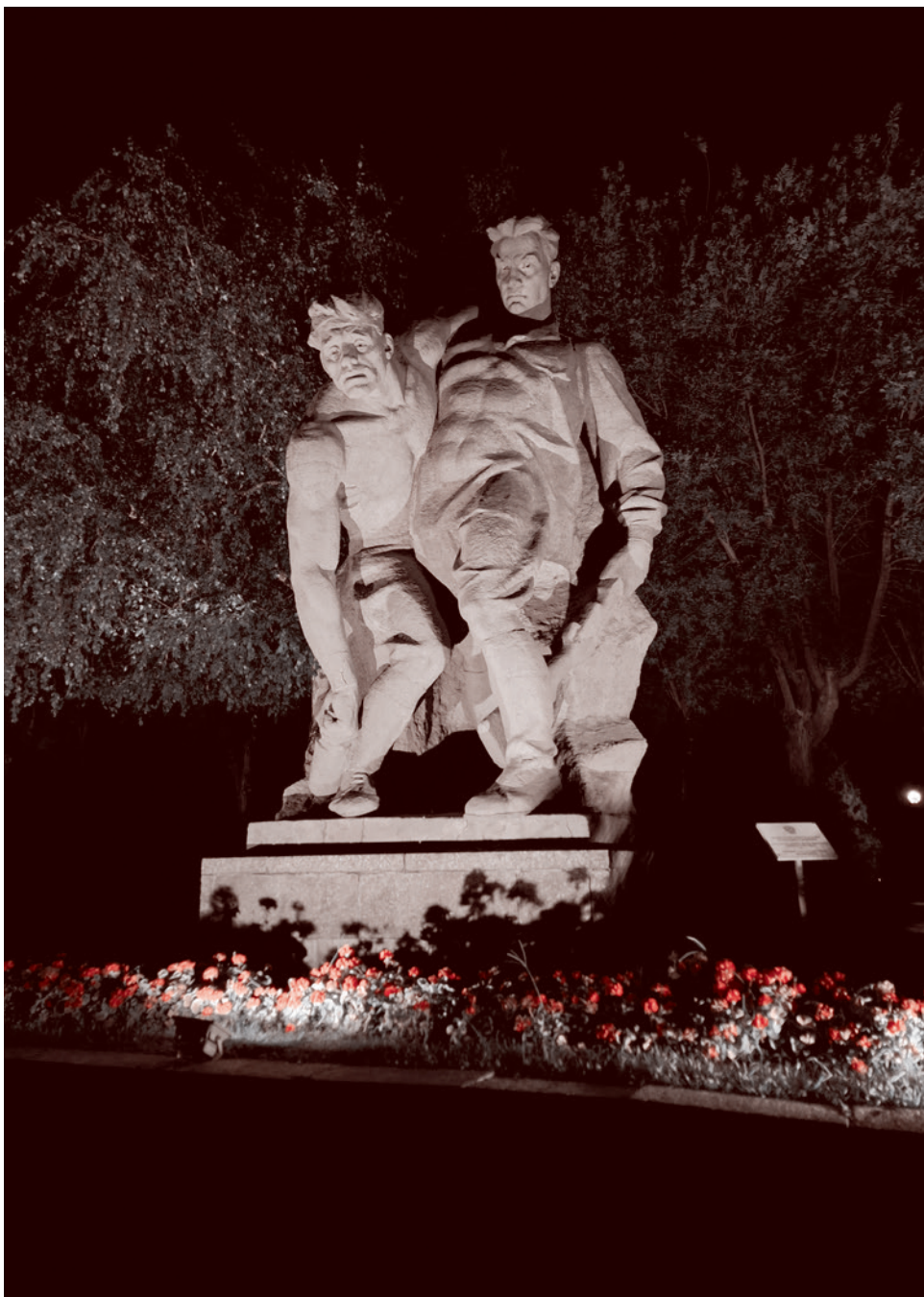
Скульптура «Раненый воин» в ночное время