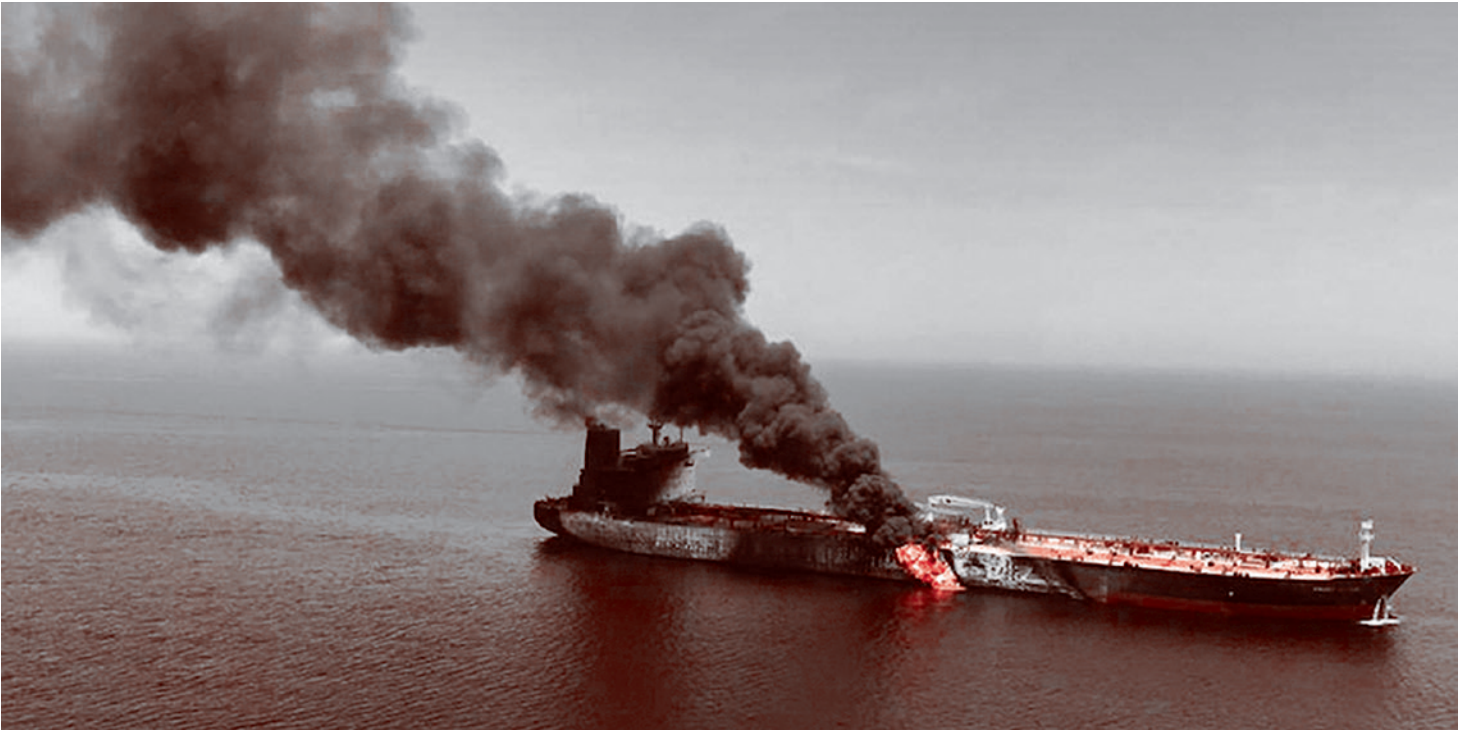
Горящий танкер Qendil

Администрация Белого дома объявила о продаже Тайваню оружия на $11 млрд, включая установки РСЗО HIMARS, самоходные гаубицы и различные ракеты. Об этом сообщает CNN. Решение еще должен одобрить конгресс. В таком случае это будет вторая военная поставка Тайваню после возвращения Дональда Трампа в Белый дом.