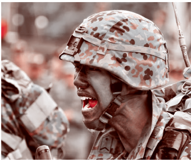
Военнослужащий сил самообороны Японии

«По сути, подобные высказывания должны были повлечь отставку, однако