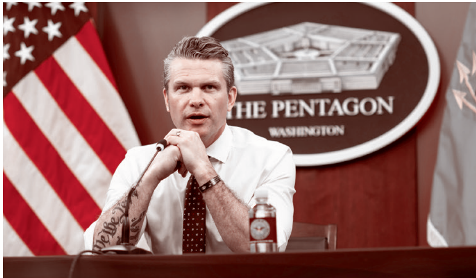
Министр обороны США Пит Хэгсет

А там напрямую идет разговор, если вы нас оставляете, — о, наконец-то! — то есть деокупируете, и потом вытаскиваете вправо, так мы с радостью пойдем, и вы