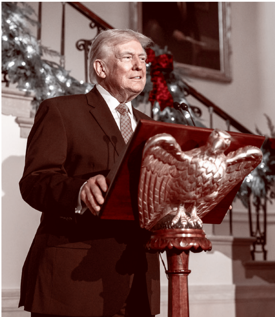
Дональд Трамп во время выступления в Белом Доме

Сергей Кургинян: Я не против него, если они поставят в результате этого духа на десять каких-нибудь установок меньше, и погибнет меньше наших солдат. За чем же против-то? Они нам пудрят мозги, и мы будем им пудрить. Это, по-моему, не худшим способом осуществляют лица, которые даже перечислять не буду, потому что всем видно, кто осуществляет это все