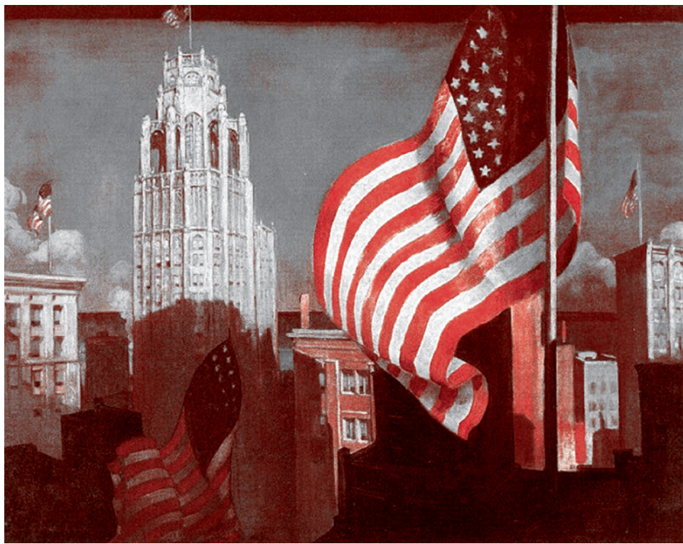
Джон Уорнер Нортона. Флаг США

Сергей Кургинян: Потому что идут какие-то переговоры. Вообще, он дядька-то оригинальный. Он чуть-чуть нестандарт-