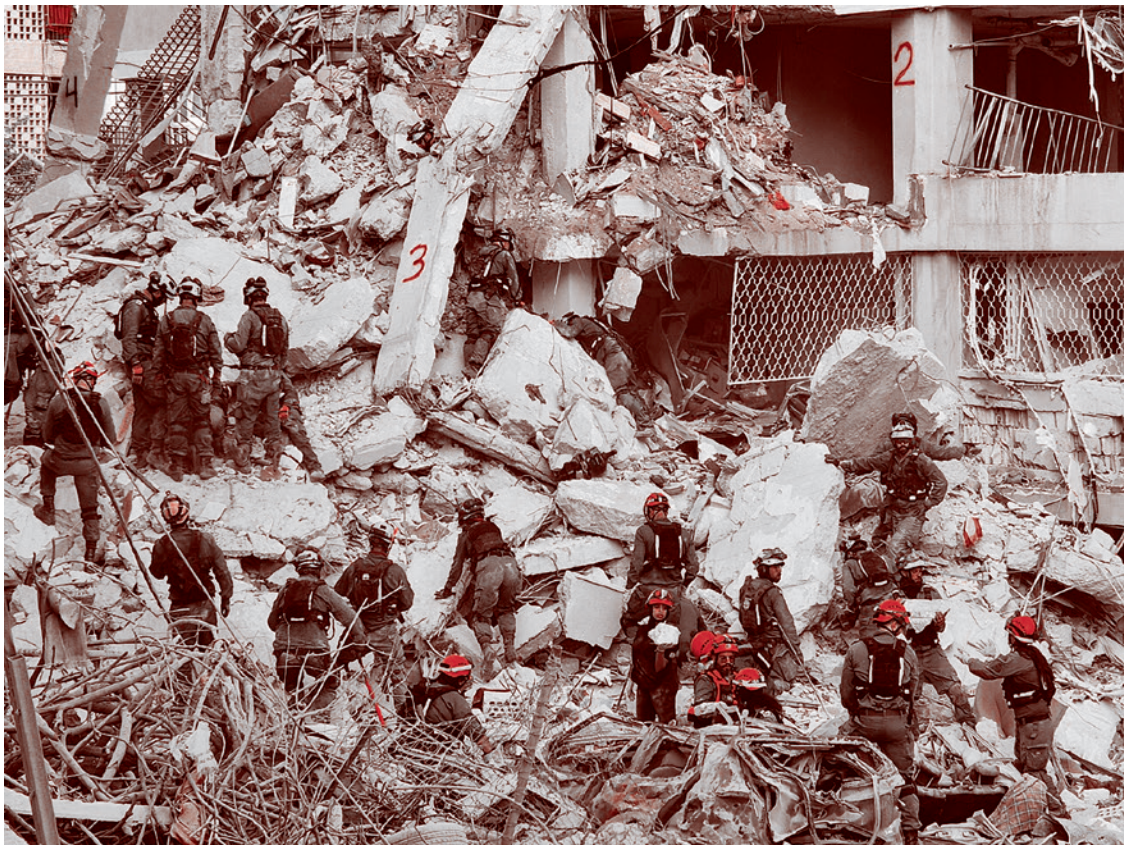
Разрушенные здания в Израиле после ракетного удара со стороны Ирана. Июнь 2025