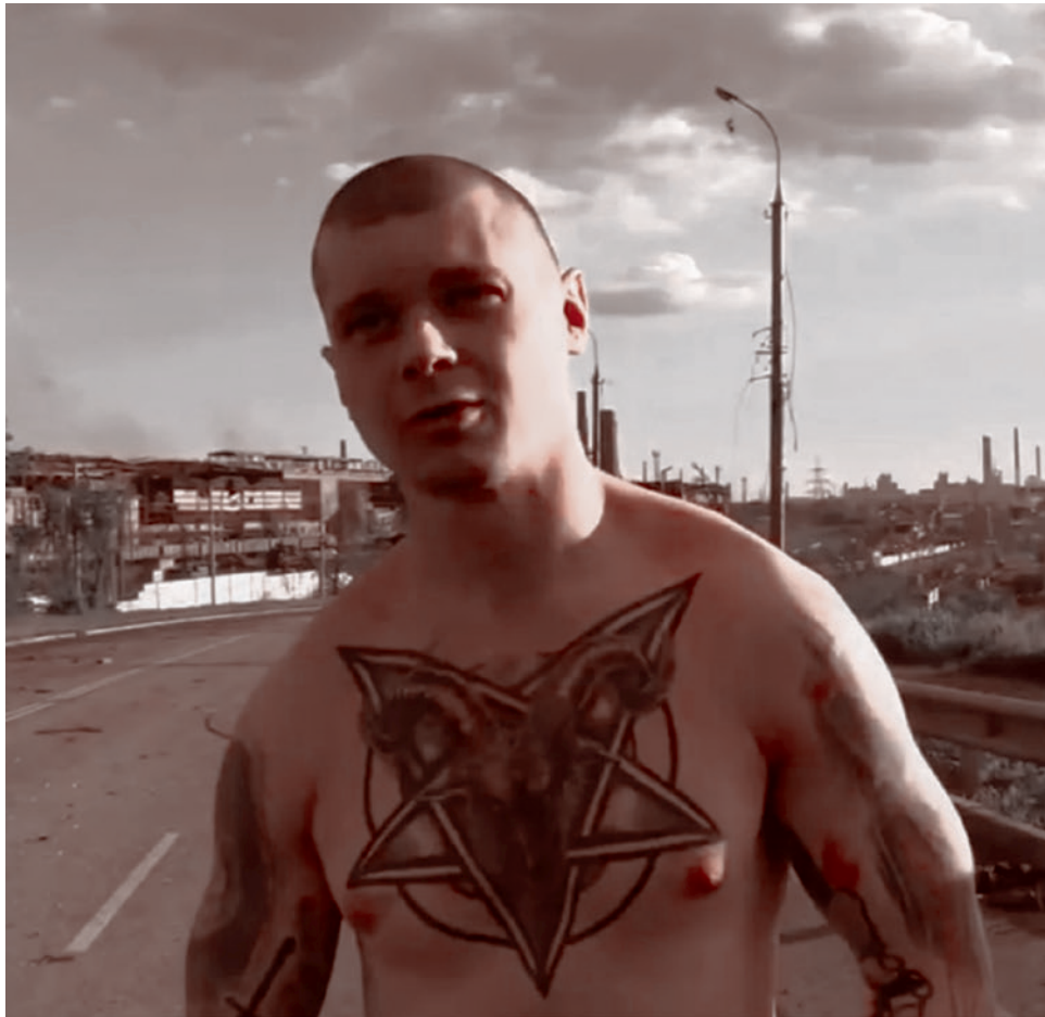
Оккультные татуировки командира снайперского отделения батальона украинских националистов

Я специально побывал на этом месте — на Набережной и Гурьевской улице в Мариуполе, где пленных бандеровцев и нацистов наши воины заставляли обнажать тела для демонстрации неопровержимых доказательств сатанинской идеологии ВСУ. Мне было важно пережить еще раз те же ощущения реальности победы Света над силами Тьмы. Уверен, что это место в Мариуполе надо обозначать специаль-