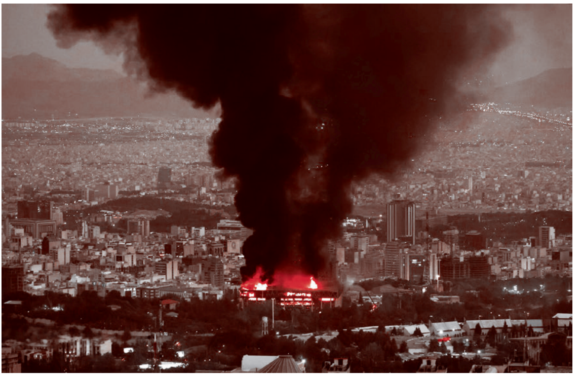
Израильская атака на студию иранской государственной телерадиокомпании IRIB в Тегеране 16 июня 2025 года

Иран — помимо одного очень сомнительного персонажа, в позиции которого мне всегда проглядывалась двусмысленность, который одно время был президентом, и очень ярко антиизраильски выступал, — совершенно не хочет воевать с Израилем. Он хочет национально-модернизационного развития с религиозной спецификой. Это страна шиитская, в том числе и очаг замечательного шиитского суфизма, который гениально описал Анри Корбен, крупный востоковед. Она в суннитском море чувствует себя специфически. Я был на большом радикальном мероприятии исламской молодежи, проходившем в Иране, и каждый раз, когда этот слишком экзотический персонаж (двусмысленно экзотический) кричал «Смерть сионизму!», все выли в восторге. А каждый раз, когда он упоминал Махди, все выражали крайнюю степень недовольствия. Иран в этом суннитском море, в том числе и в море суннитского радикализма, очень