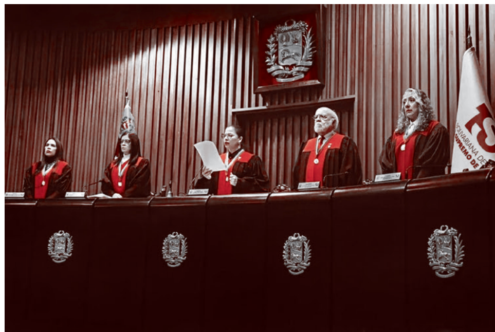
Конституционная палата Верховного суда (TSJ) приказывает назначить Дельси Родригес исполняющей обязанности президента Венесуэлы

Впрочем, на этом фоне европейские лидеры начали прощупывать почву на