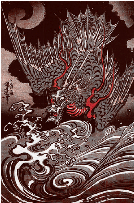
Утагава Куниса. Гравюра «Дракон, летящий над бурными волнами». XIX век

стран встретились с президентом США Дональдом Трампом в Вашингтоне.