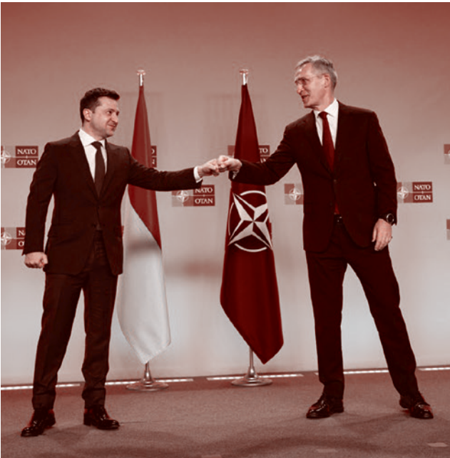
Президент Украины Владимир Зеленский и бывший генеральный секретарь НАТО Йенс Столтенберг. Брюссель. 2021

Газета «Суть времени» зарегистрирована Федеральной службой по надзору в сфере связи, информационных технологий и массовых коммуникаций (Роскомнадзор) Свидетельство ПИ № ФС77-50554 от 9 июля 2012 года