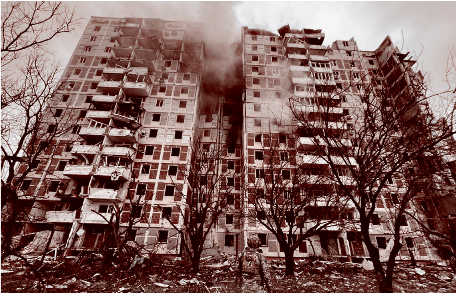
Жилые дома после удара ВСУ. ДНР