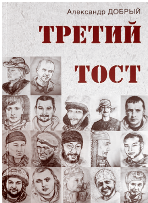
Обложка книги Александра Доброго «Третий тост»