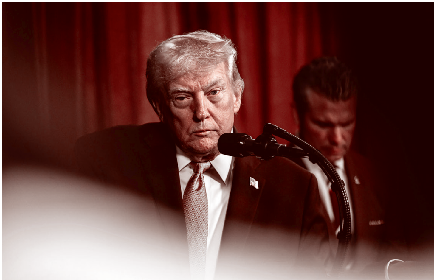
Президент Дональд Трамп на пресс-конференции после операции «Абсолютная решимость» в Венесуэле, завершившейся захватом президента Венесуэлы Николаса Мадуро, 3 января 2026 года

странно. А когда Макрон чем-нибудь обидит Трампа или там Мерц — их тоже возьмут в пижамах?