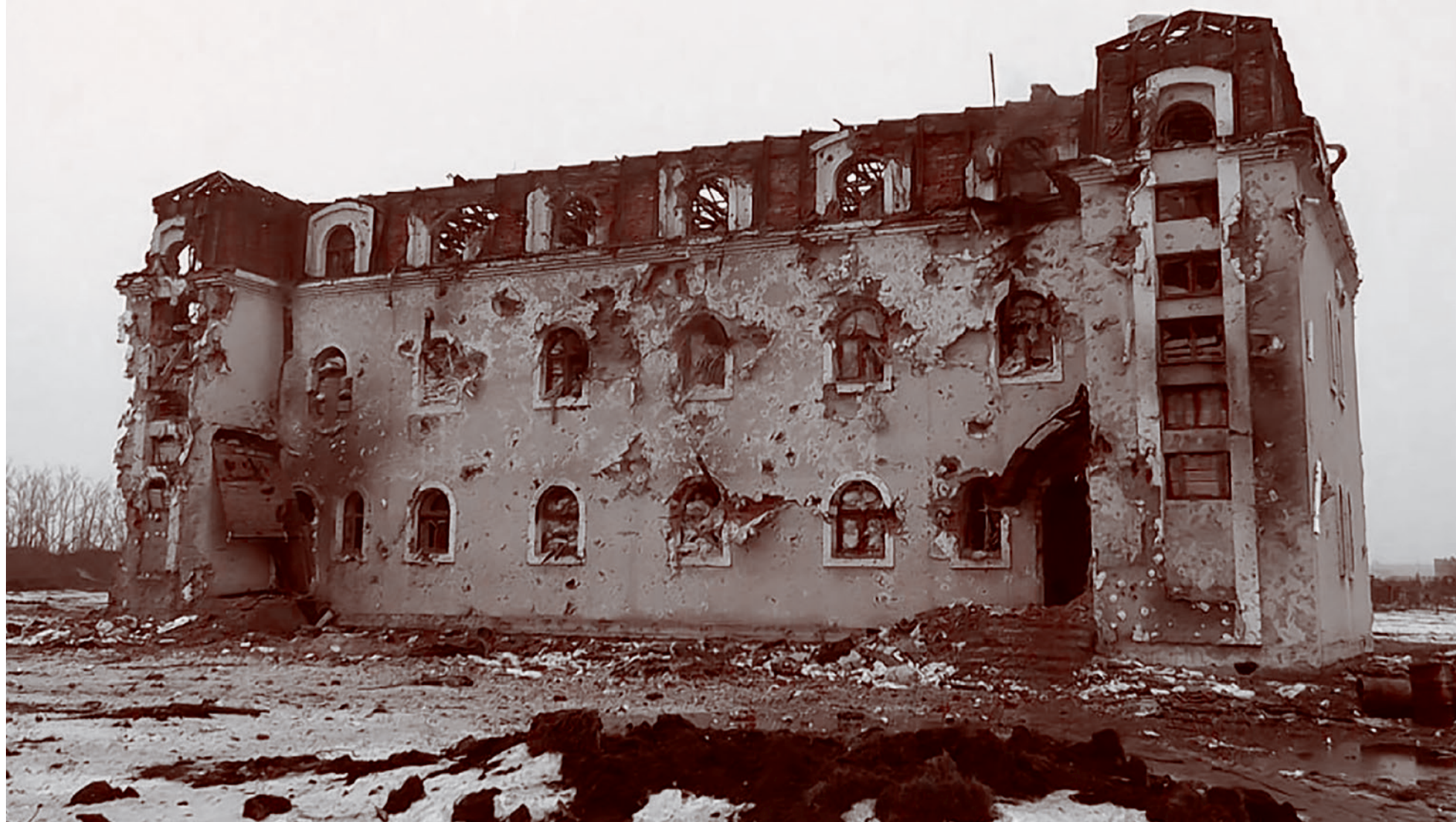
«Трешка» после боя 17 января 2015 года