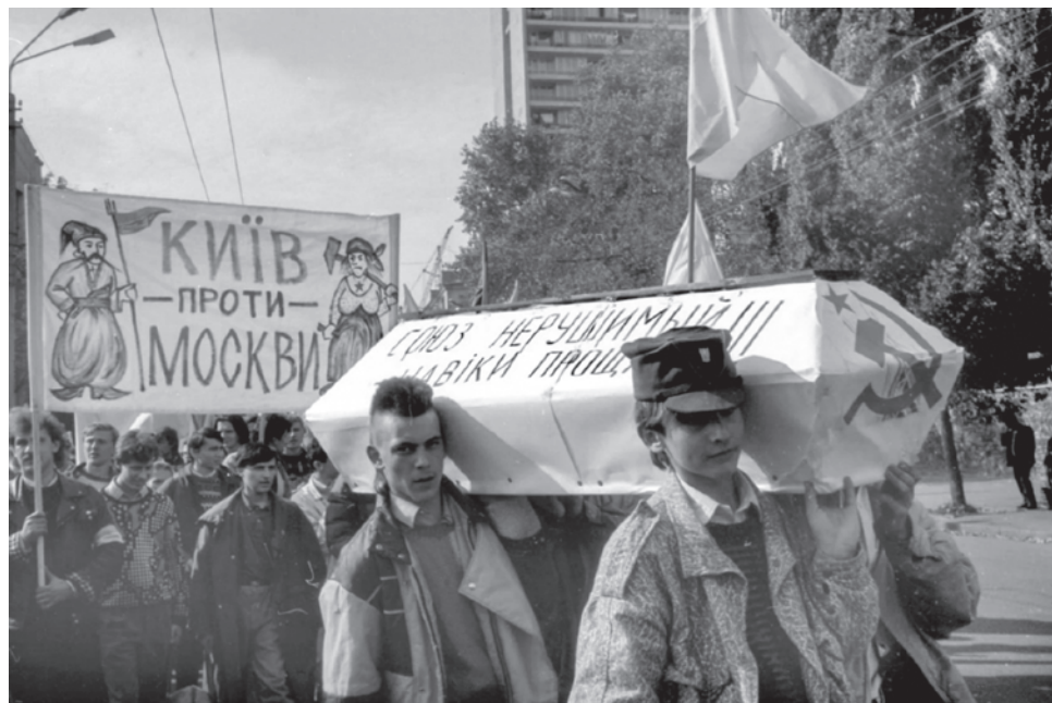
Демонстрация украинских националистов в 1990-е

Я понимаю, что это сейчас кажется утопичным. Русский мир сейчас оболган,