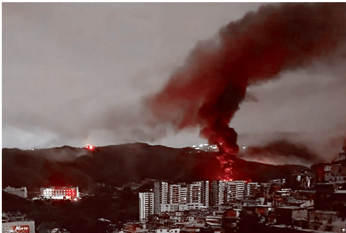
Удары США по Венесуэле