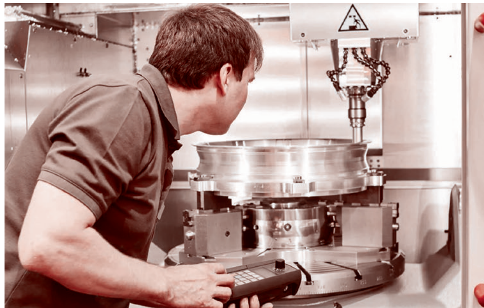
Работа современного станка ЧПУ

Следующий момент, который бы хотелось отметить. Основные заказчики, особенно в авиастроительной и космической отраслях, требовали поставки станков супервысокого уровня, чтобы производимая ими продукция как минимум была на уровне мировых аналогов или превосходила их. Отечественные станкозаводы, несмотря на все проблемы, могли разрабатывать и производить образцы сложных станков на уровне мировых производителей.