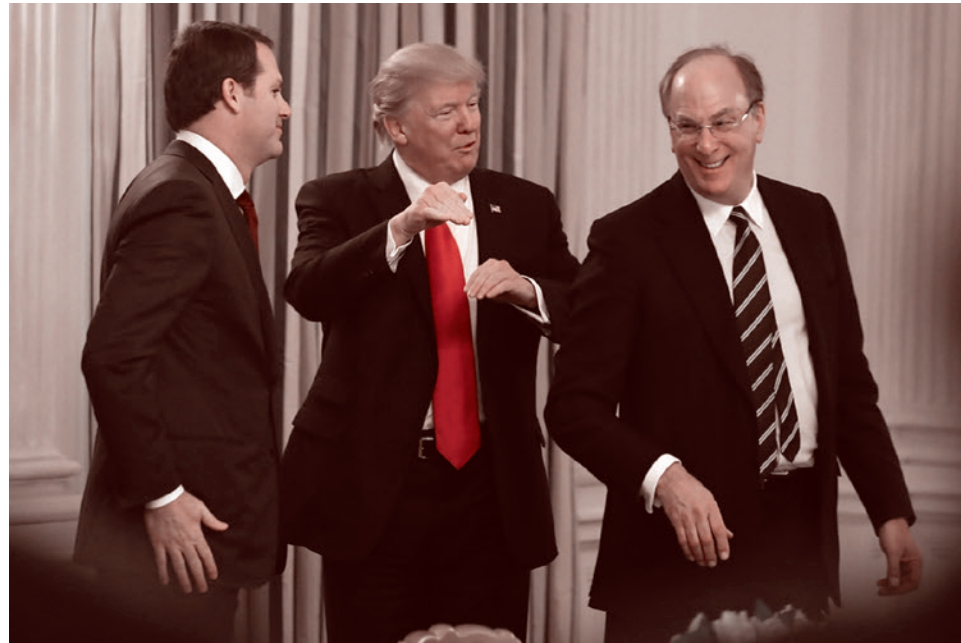
Генеральный директор BlackRock Ларри Финк (справа), вместе с главой Walmart Дагом МакМиллоном (слева), встречаются с Дональдом Трампом

При этом, по словам американского лидера, коллективная Европа проявила феноменальную неблагодарность по отношению к Вашингтону вообще и к нему лично. США, утверждал Трамп, помогали европейским союзникам по блоку «так много лет и никогда ничего не получали