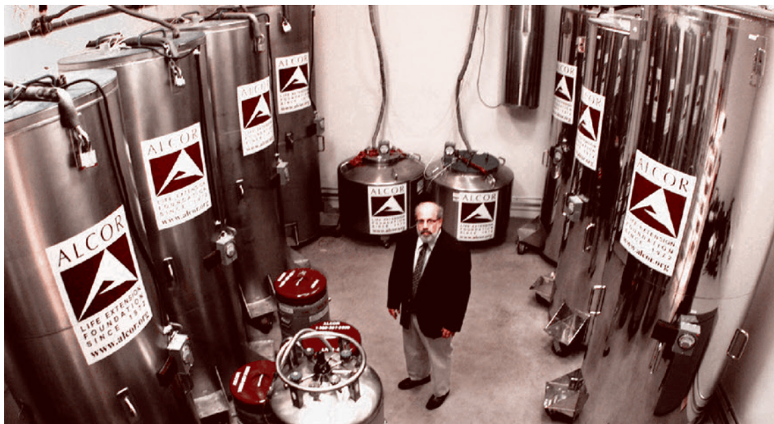
Криокамеры компании Alcor

В разговоре о борьбе за долголетие нельзя не упомянуть существующую в США «Церковь