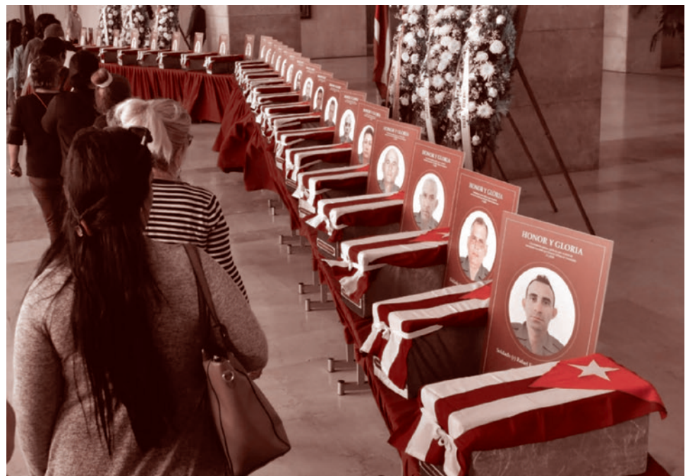
Похороны 32 погибших охранников президента Венесуэлы Николаса Мадуро на Кубе