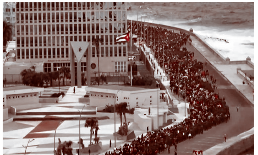
Многотысячные массы народа стекаются ко входу в зал Министерства революционных вооруженных сил Кубы для прощания с прахом павших бойцов