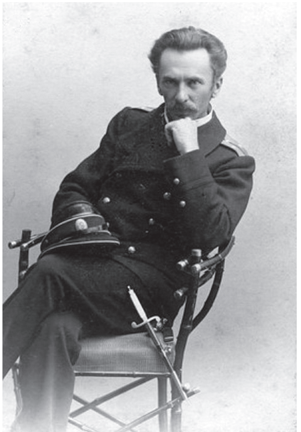
Пётр Петрович Шмидт. 1905

Три героя (говорю без шуток) начинают ломиться в дверь закрытого магазина. И делают это очень шумно. Деревня большая, желающих подраться много. И человек пятнадцать идут к магазину (кто с ло-