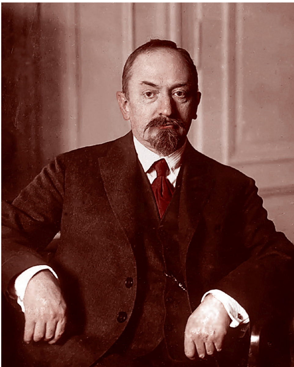
Нарком иностранных дел СССР Георгий Чичерин

Знаете, из какой семьи был нарком иностранных дел Чичерин, член РСДРП с 1905 года? Его отец — дипломат (люди, компетентные в этом вопросе, утверждали, что истоки рода Чичериных — это Чичерини — князья Священной Римской Им-