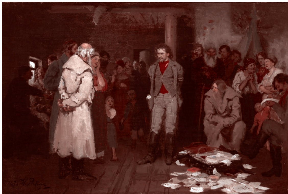
Илья Репин. Арест пропагандиста. 1878

Мой знакомый, сам придя и выселив недобросовестного арендатора, еще и гордился, сколько он при этом сэкономил. А я получил крупную бесценную награду в вопросе о том, что такое «онормализация», когда речь идет не об абстрактном представителе этноса, крайне тяготеющего в определенной своей части (ни Эйнштейн, ни Ландау к этому не тяготели) к некоей обобщенной нормальности, а вполне героического спецслужбиста.