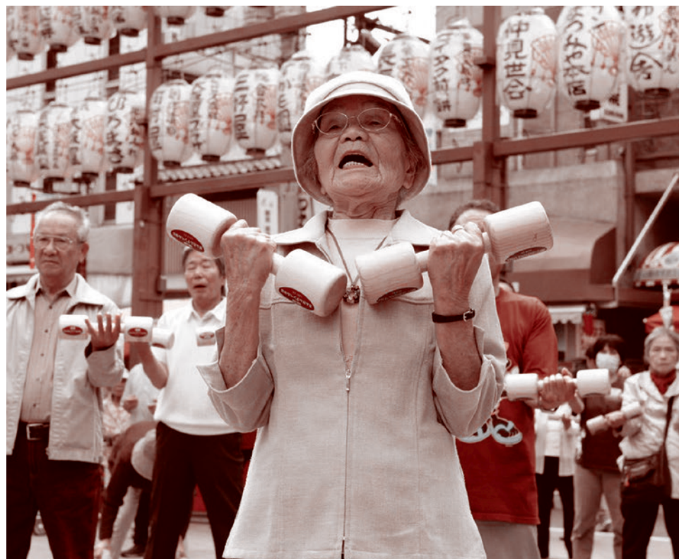
Жительница японского острова Окинава