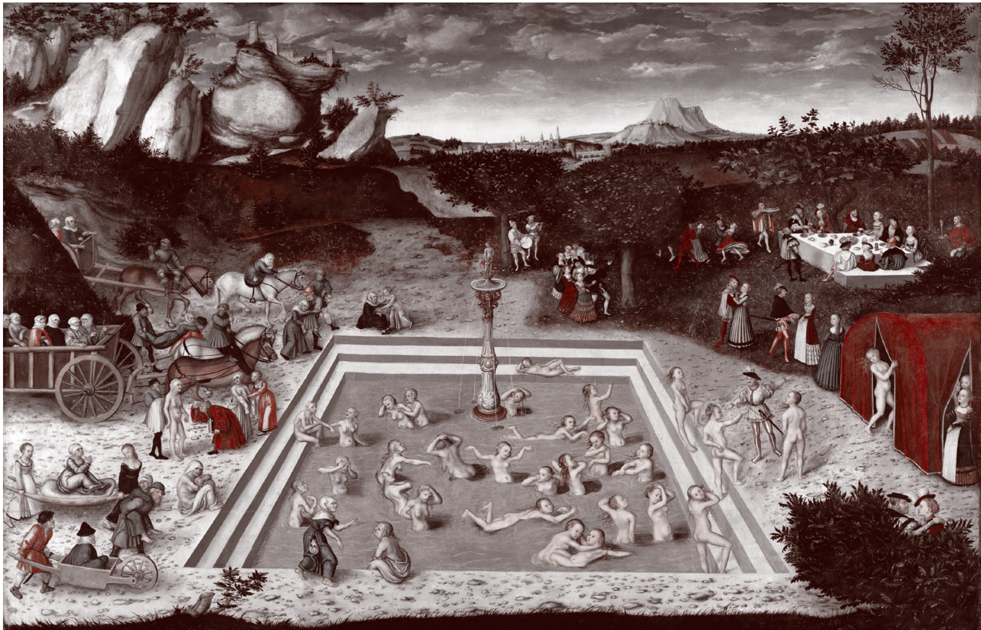
Лукас Кранах Старший. Источник молодости. 1546