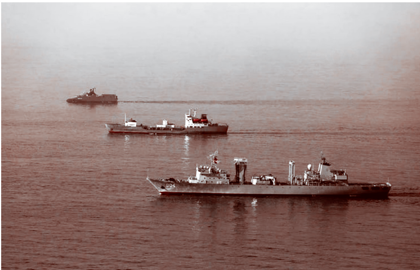
Корабли трех ядерных держав (США, Китая и России)

Трещина прошла не только в вопросах политики, но и затронула более глубокие аспекты. На форуме стало видно, насколько различны видения будущего у команды технарей и бизнесменов, кото-