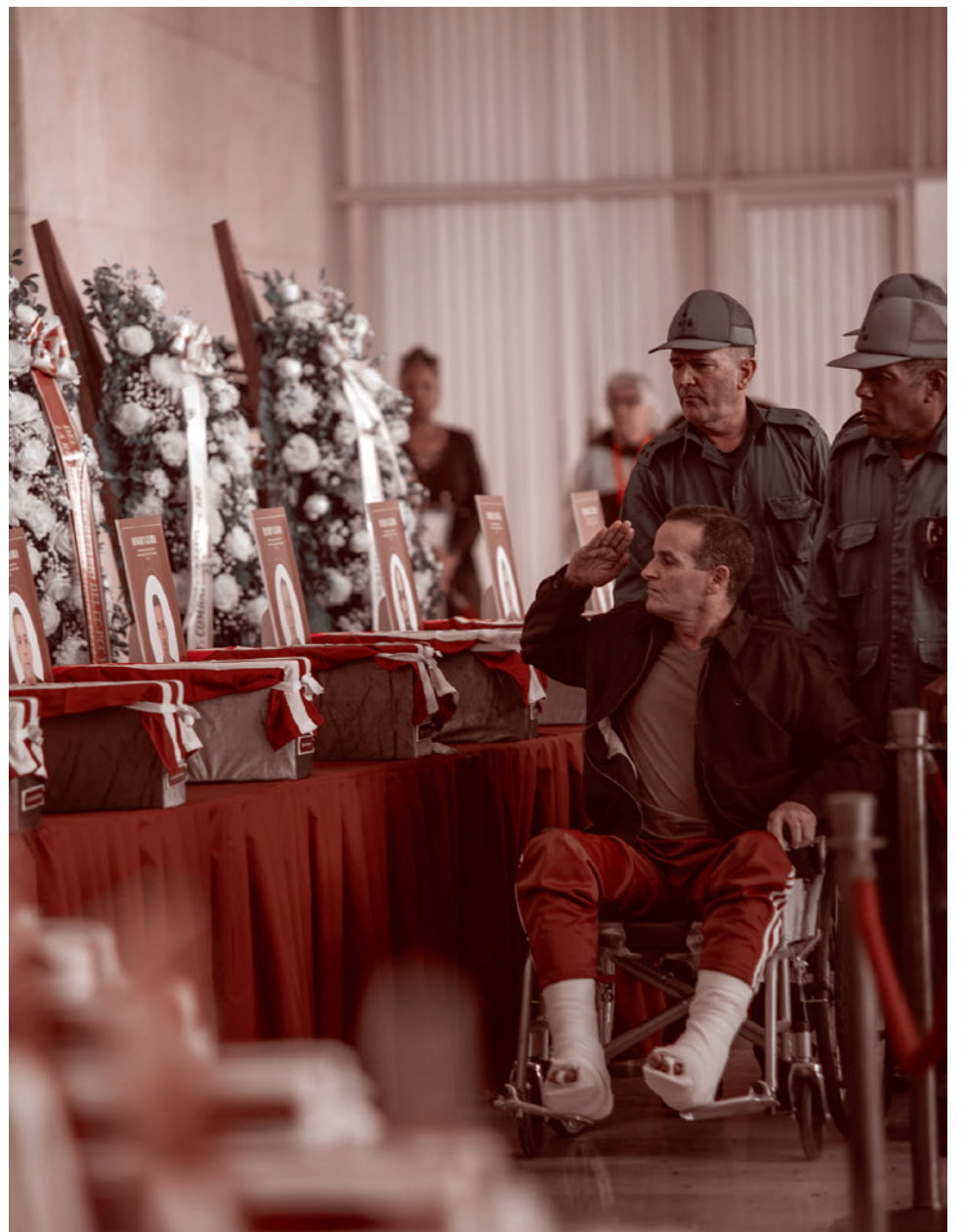
Похороны 32 погибших охранников президента Венесуэлы Николаса Мадуро на Кубе