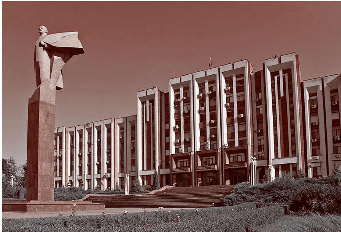
Памятник Владимиру Ленину перед зданием Верховного Совета в Тирасполе