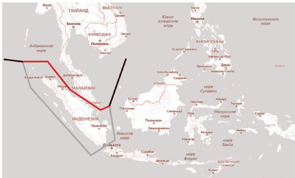
Красным цветом — маршрут через Малаккский пролив, серым — через Зондский