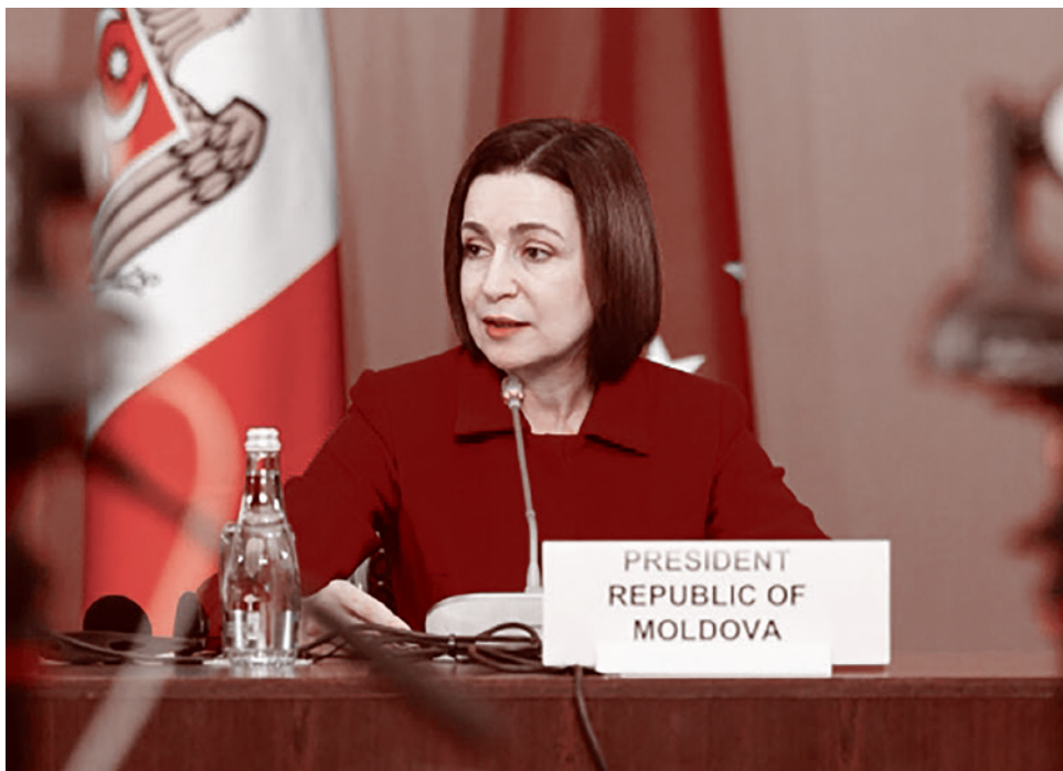
Президент Молдавии Майя Санду

После начала СВО Санду заявила, что «никто не даст гарантий, что нейтралитет нас защитит». После этого Молдавия начала перевооружаться и переходить на стандарты НАТО. США, Германия, Франция, Румыния и Великобритания начали активно помогать республике в перевооружении, информационной поддержке, обучении. В 2025 году госсекретарь МИД Молдавии Валериу Мижка заявил, что бюд-