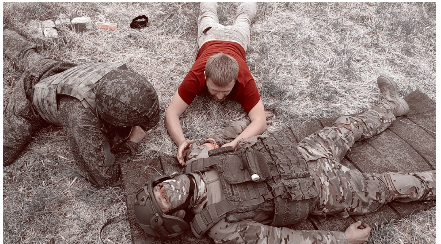
На занятии по тактической медицине в зоне боевых действий. 2023

Поэтому, когда началась СВО, мы все восприняли это с воодушевлением — Россия проснулась и по-настоящему пошла против фашизма, решила освободить Украину от этого бандеровского нашествия. Хотя понятно, что современная Россия уже далеко не Советский Союз, что это капиталистическая страна, в которой многое диктуется в первую очередь финансами, и эффектив-