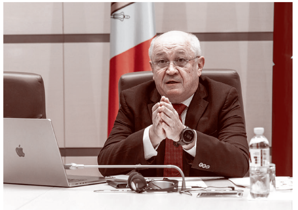
Премьер-министр Молдавии Александр Мунтяну