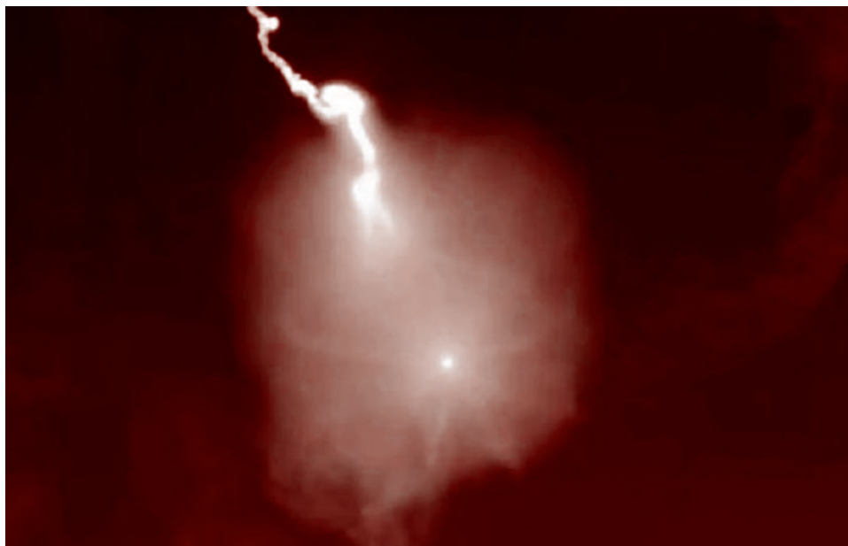
Удар гиперзвуковой ракеты «Фаттах» в ходе конфликта с США и Израилем

Он растерян, а растерянные люди такого психопатически наглого, гангстерского типа в момент, когда становится ясно, что им абзац, теряются. Тогда «ведутся» они. А когда они ведутся, то психопатия диктует одно средство («Остан Бендер знал один ход: Е 2 — Е 4»), — наращивание наглости риторики. Как говорилось в прологе к «Фаусту», если вы не можете