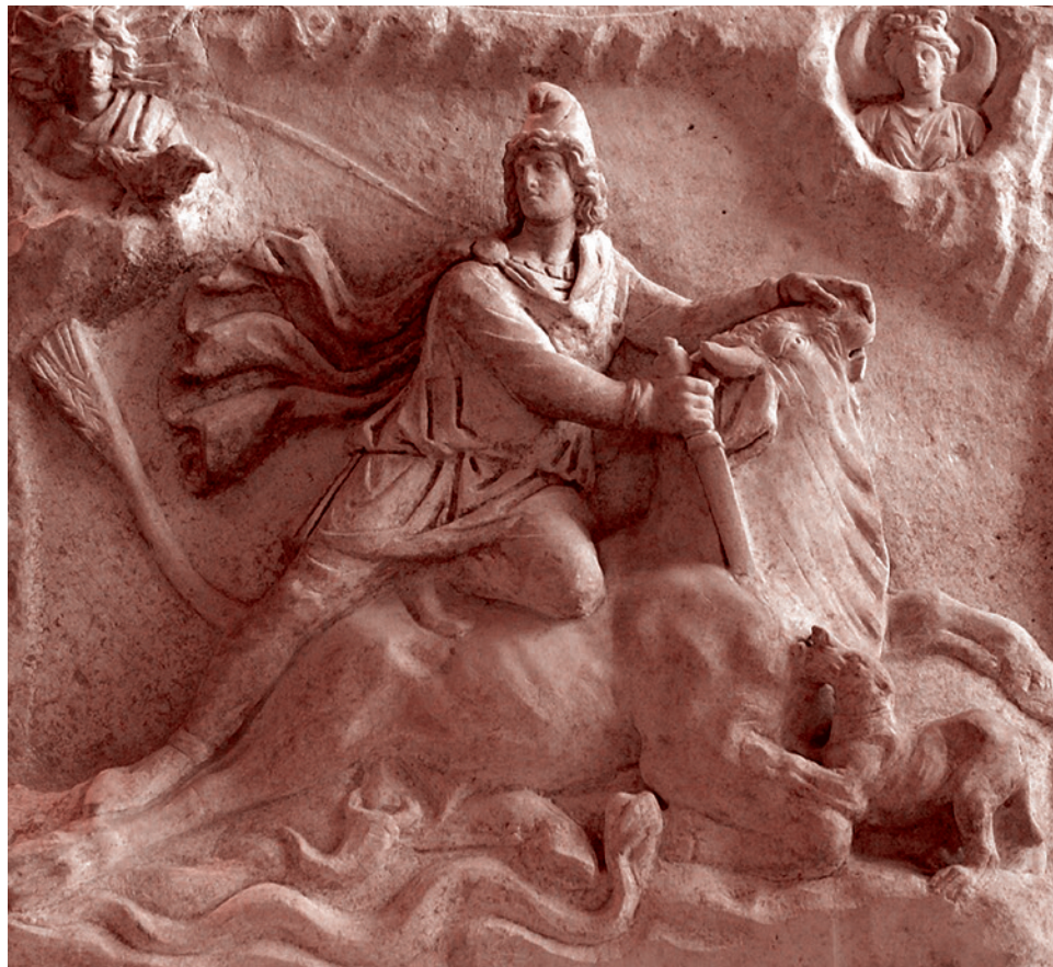
Митра, убивающий быка. I-II век н. э.

Это крайне важно. Конечно, Иран — страна с несопоставимо меньшим потенциалом, чем Соединенные Штаты. Это несопоставимо меньшее население, технические возможности, экономический уровень и так далее... Это как некие племена, которые бросали вызов Риму в последний период его существования (даки и другие), и Рим считал, что черта лысого — наши силы несопоставимы. С одной стороны, железная поступь легионов, огромные ресурсы, а с той стороны — какие-то дикие племена, живущие в хижинах из ивовых прутьев, обмозанных глиной. Как мы можем проиграть? И тем не менее Рим проигрывал в таких ситуациях.