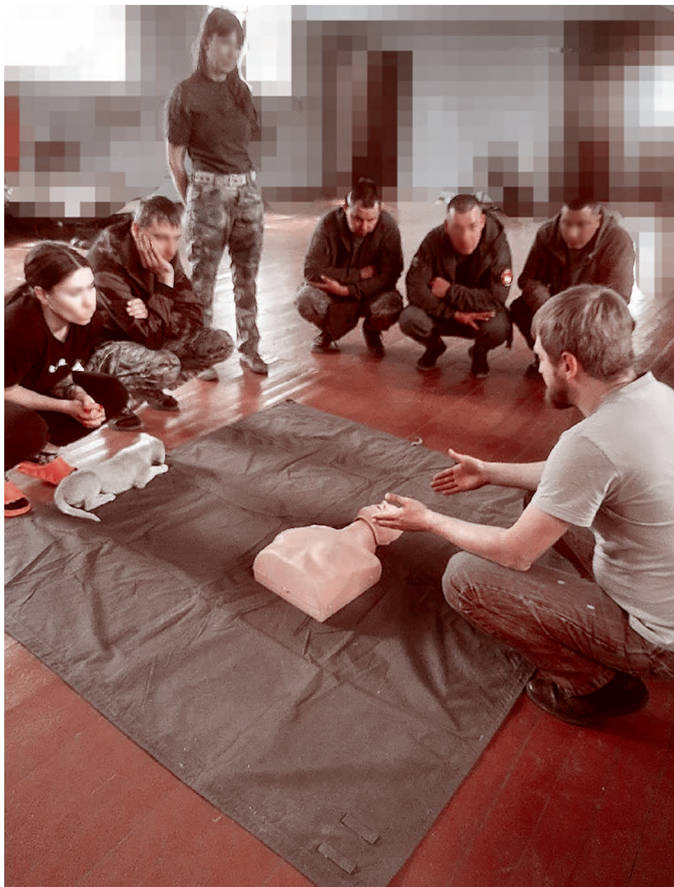
Работа с военными медиками. 2024

в телеграм-каналах немедицинских, а мне предложили стать координатором этого проекта здесь, в ДНР. Я сказал, что готов. Нужно было координировать тех медиков-добровольцев, которые потом в итоге приезжали. Была задействована сразу масса людей в этом процессе. А в начале СВО еще ведь было большой проблемой проехать через границу, знакомый юрист помог тогда — мы вместе составили нужное письмо, документы. Какие-то частные предприятия фиктивно делали справки о том, что человек едет сюда работать, потому что не пропускали из России ввиду ковидных ограничений.