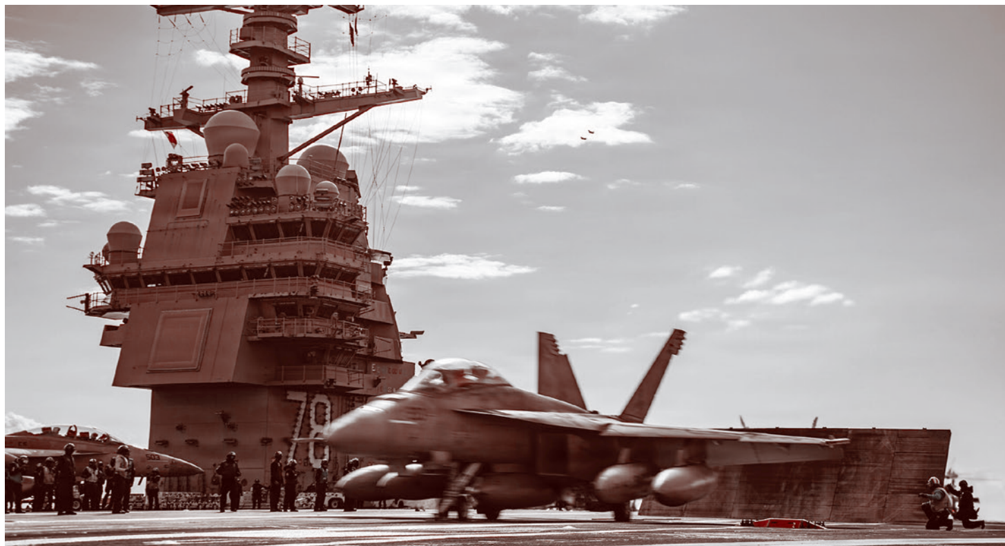
Эсминец «Джеральд Р. Форд» в ходе операции Epic Fury. С полетной палубы взлетает самолет EA-18G Growler

Израиль достаточно талантливо их использовал, потому что еще в 30-е годы на дверях некоторых ресторанов было написано «Евреям и собакам вход воспрещен». И это всеобъемлющее сионистское лобби, которое якобы управляет Америкой, это «Zionist Occupation Government» (сионистское оккупационное правительство) —