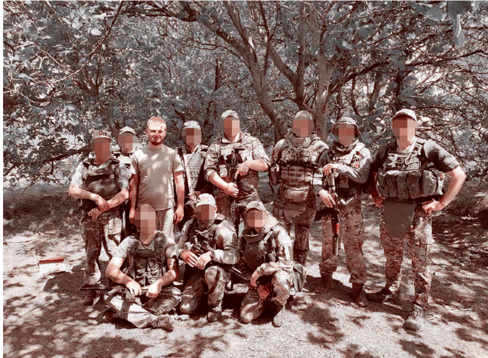
На подготовке военных в Запорожской области. 2023

Параллельно с этим всем, отработав там, возвращался в свою больницу в Донецке и продолжал оперировать, принимать пациентов.