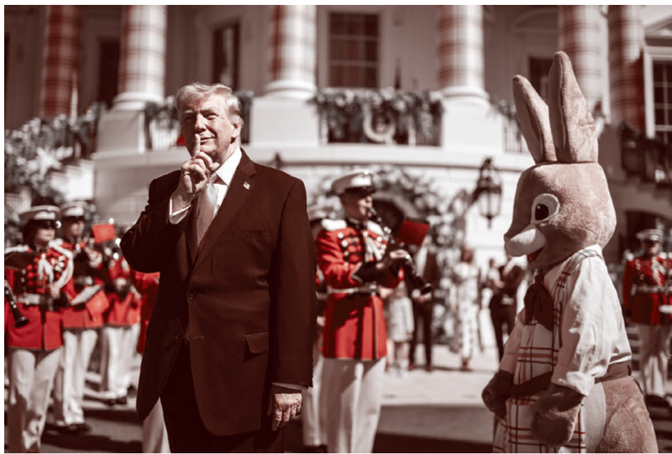
Президент Дональд Трамп во время пасхальных мероприятий

Население это на самом деле не так однородно, каким оно было в начале 80-х годов. Религиозная революция, победившая в Иране, которую очень сильно