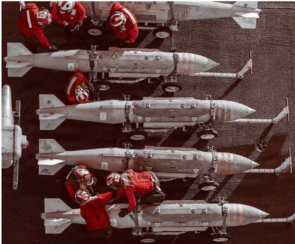
Американские моряки ведут подготовку к размещению боеприпасов на полетной палубе авианосца «Абраам Линкольн» во время операции Eric Firy

Слишком многое показал Иран. Потому что перед этим мы видели митинги, «базары», протесты, разумеется, спонсируемые Израилем, Америкой или кем угодно, но все равно мы видели некую разболтанность. Раз! — и ее не стало. Разболтанности не стало. Пятая колонна готова к любому мятежу, и я надеюсь, что руководство Ирана этот мятеж блистательно подавит. Хотя кто знает, и это нельзя предположить. Но она пока в тиши находится.