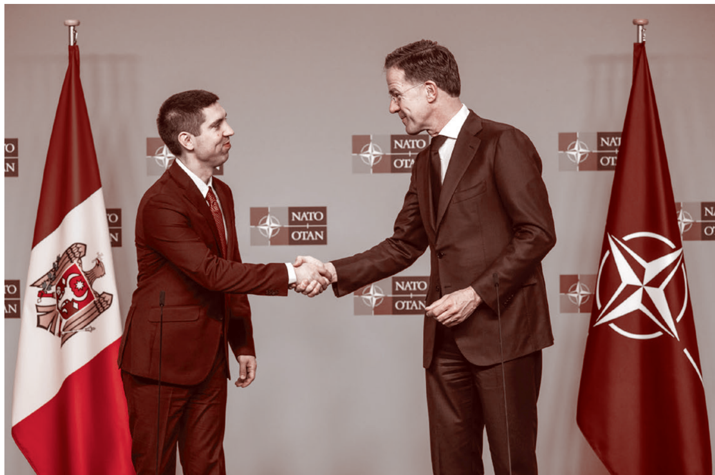
Заместитель премьер-министра Республики Молдова Михай Попшой и Генеральный секретарь НАТО Марк Рютте. 2026

Новый президент объявила главной целью республики вхождение в Евросоюз. Однако подготовка к сближению с ЕС началась не со строительства дорог и новых предприятий, школ, больниц, не с реформ су-