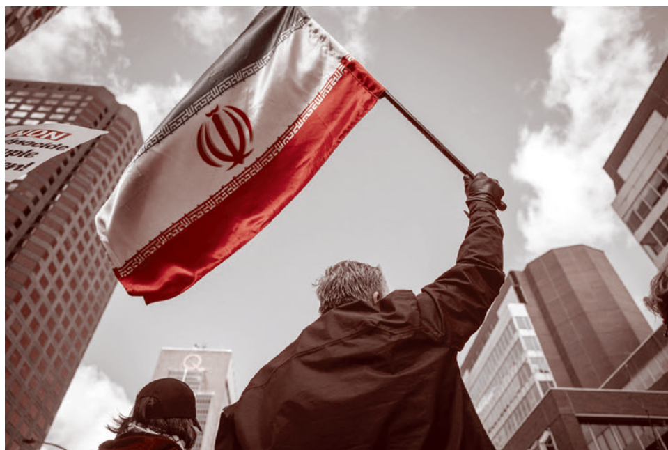
Демонстрант размахивает иранским флагом во время протеста против действий США и Израйля, развязавших войну на Ближнем Востоке. 2026

Но Трампа поддержали и силы совсем другие. Трампа поддержали, скажем прямо, не только антиизраильские, но, если речь идет о каком-то числе достаточно знаковых фигур, то антиссионистские силы. Антисемитские, в пределе. Они же его тоже поддержали. И радикальные католики, и те евреененавистники, которые говорили только об одном: что «это евреи разлагают Израиль, а мы хотим создать христианскую нацию», поэтому хотя евреев мы не любим, но Трампа поддержим.