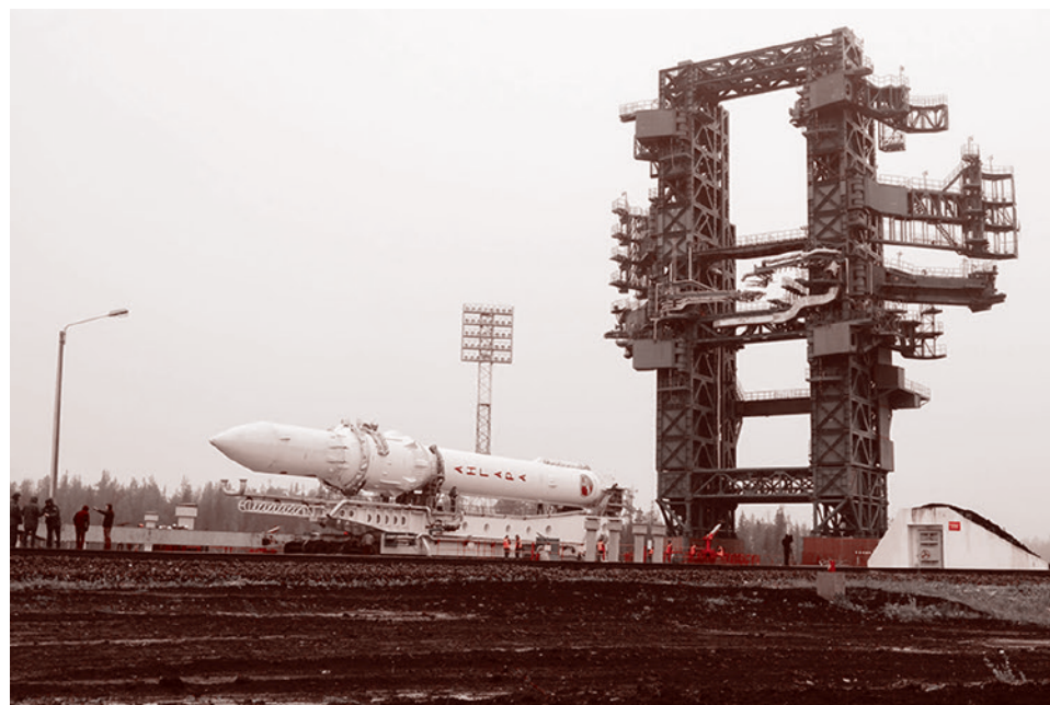
Стартовая площадка комплекса космодрома Плесецк

Решение нескольких стран Европы нарастить производство и поставку беспилотников Украине и ударов по территории России ведет к «резкой эскалации военно-политической обстановки на всем европейском континенте», заявила пресс-служба Минобороны России.