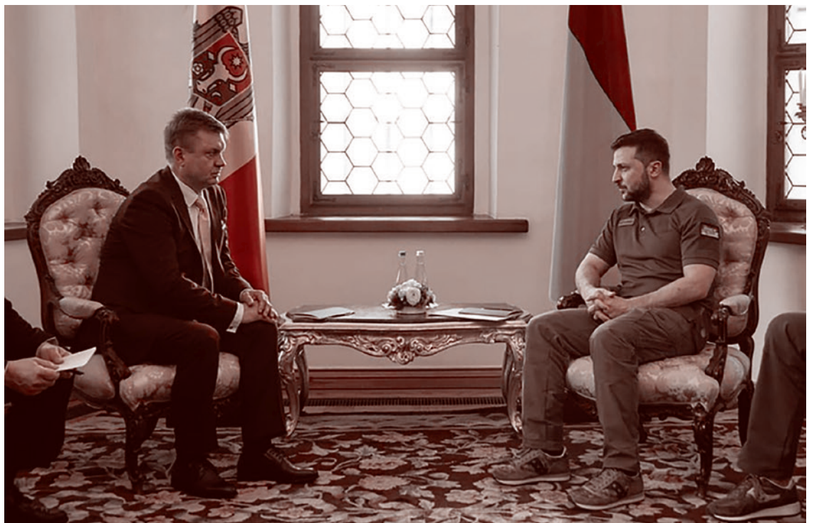
Вице-премьер по реинтеграции Молдавии Валериу Киверъ и президент Украины Владимир Зеленский. 2022

«Данное решение принято с целью обеспечения бесперебойного снабжения авиационным топливом, а также для