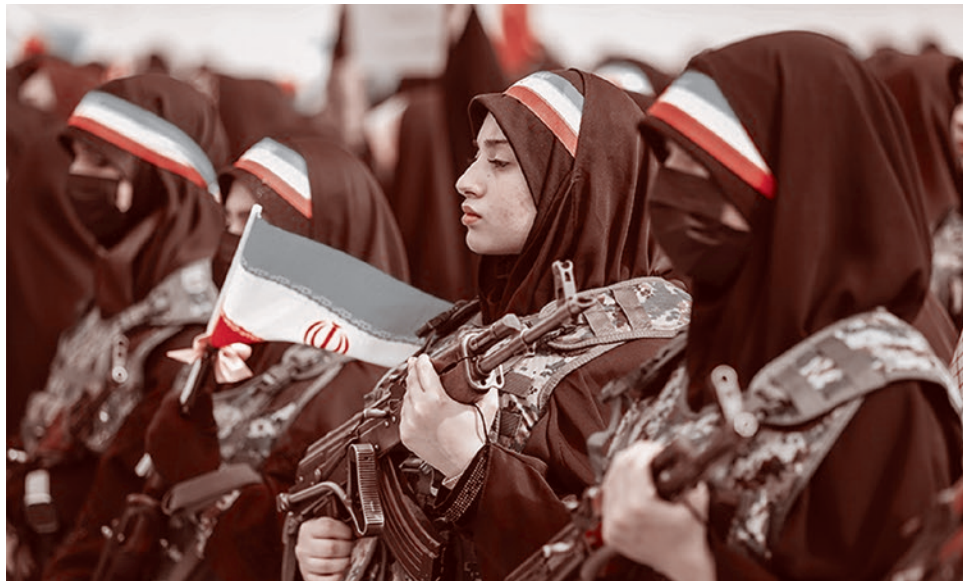
Женский митинг в поддержку Исламской Республики в городе Тебриз (Иран). 2026

Анна Шафран: Сергей Ервандович, огромное спасибо за этот, как всегда, очень интересный, глубокий анализ. Сергей Ервандович Кургинян, политолог, публицист, театральный режиссер и лидер движения «Суть времени», был сегодня с нами в программе «Разговор с мудрецом» на радио «Звезда». До новых встреч!