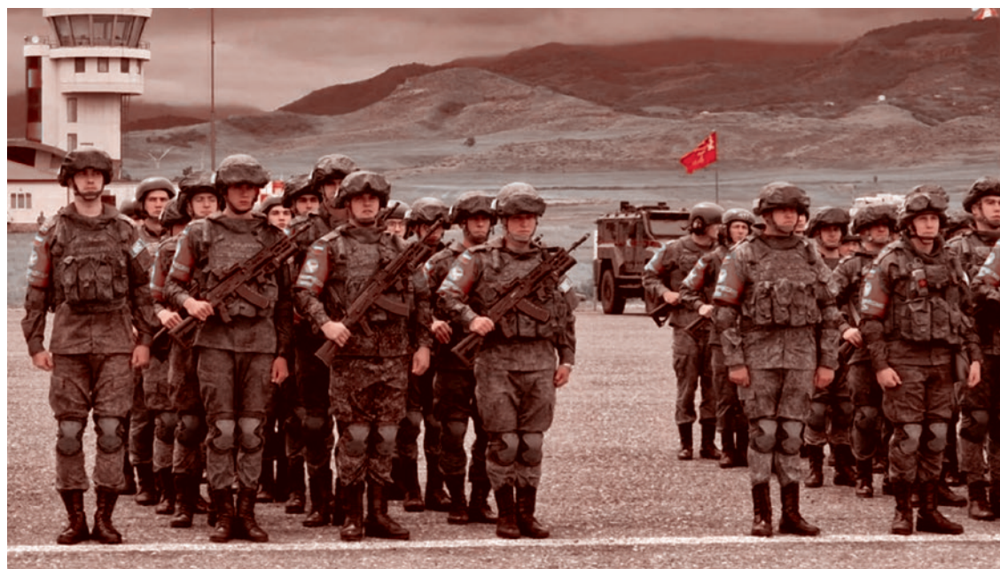
Военнослужащие миротворческого контингента ВС России