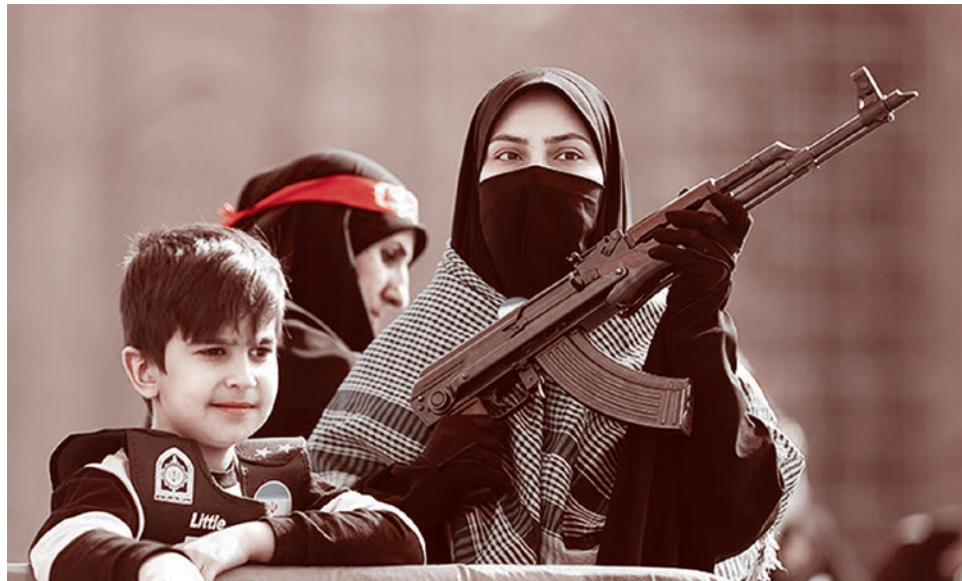
Женский митинг в поддержку Исламской Республики в городе Тебризе (Иран). 2026