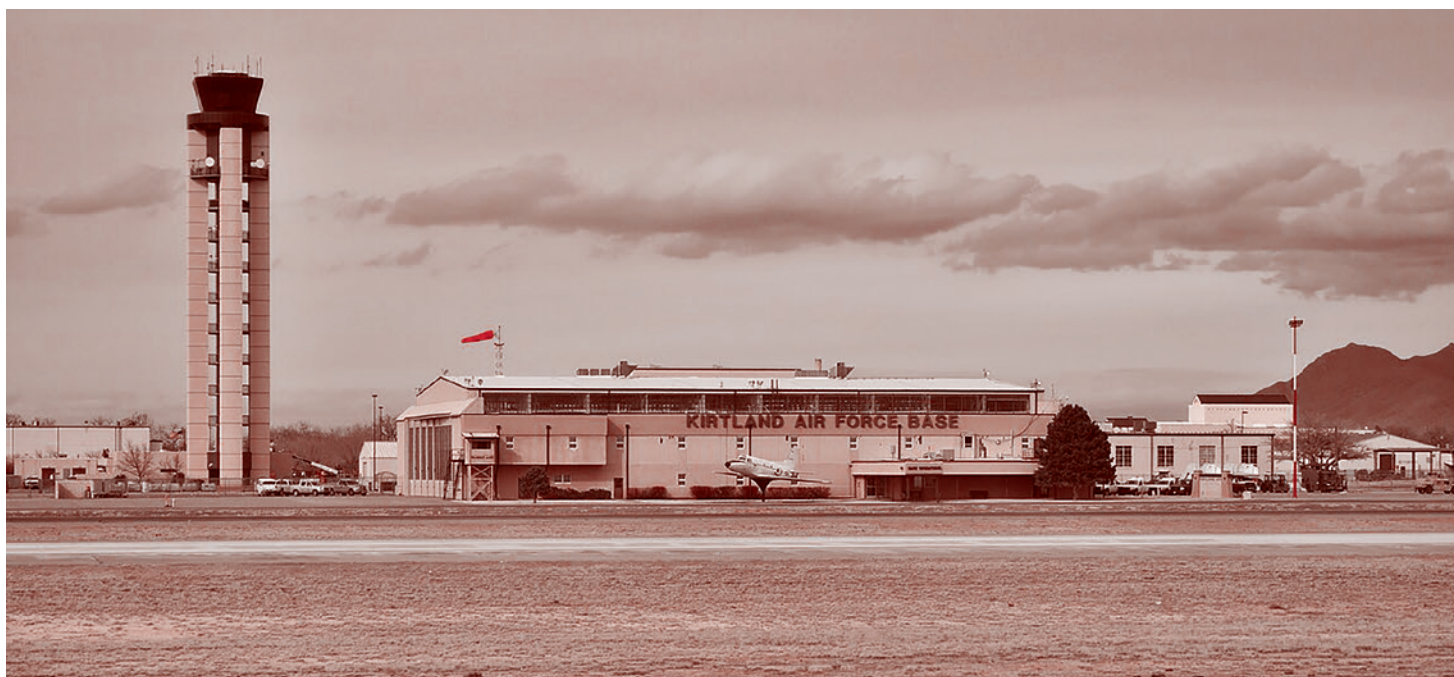
База ВВС США Киртланд