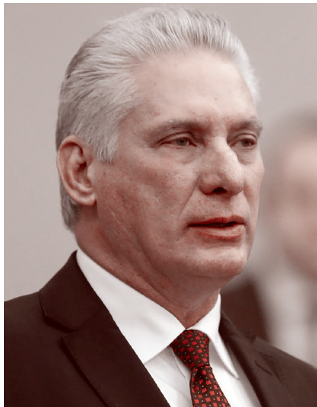
Президент Республики Куба Мигель Диас-Канель Бермудес