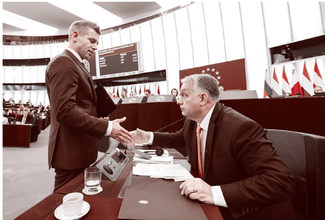
Петер Мадьяр и бывший премьер-министр Венгрии Виктор Орбан. 2024

2 мая, выступая во Флориде, где очень сильна кубинская диаспора, Трамп заявил, что на обратном пути с Ближнего Востока авианосец «Авраам Линкольн» может подплыть к берегам острова Свободы, и Куба сразу сдастся. В ответ президент Кубы Мигель Диас-Канель заявил, что США «усиливают свои угрозы военной агрессии против Кубы до опасного и беспрецедентного уровня», и призвал международное сообщество обратить на это внимание.