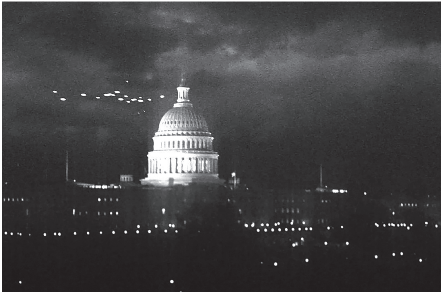
«Вашингтонская карусель». НЛО в небе над каптолием. 1952