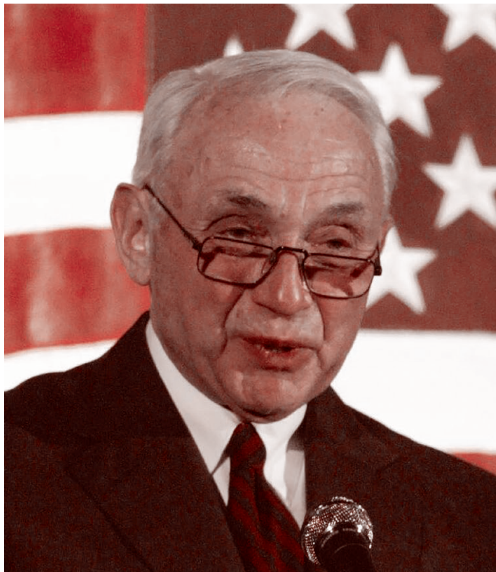
Американский предприниматель-миллиардер Лесли Векснер

Эта передислокация произошла в период наиболее тесных контактов Джеффри Эпштейна с тогдашним президентом США Биллом Клинтоном. Во время первого президентского срока Клинтона Эпштейн посетил Белый дом не менее 17 раз. Сам Клинтон, в бытность свою губернатором штата Арканзас с 1979 по 1981 гг., а затем с 1983 по 1991 гг., предоставлял аэродромы в своем штате для организации логистики наркотической и оружейной контрабанды в интересах метакартеля. После ухода из Белого дома Клинтон плодотворно сотрудничал с Эпштейном в ходе организации своего «филантропического» (язык не поворачивается назвать его благотворительным) фонда Клинтонов. Примерно в этот же период Эпштейн участвовал в создании и развитии фонда Билла и Мелинды Гейтс. Оба эти фонда сыграли одиозную роль в подготовке к пандемии COVID-19.