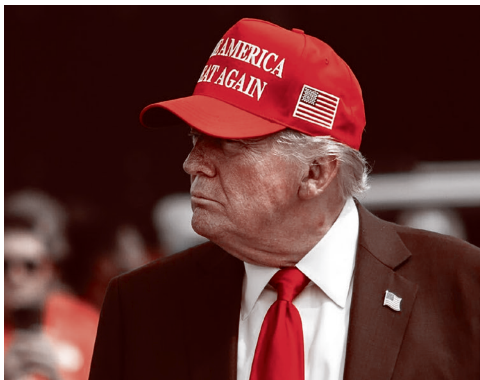
Президент США Дональд Трамп

Я говорю: «Ну хорошо, последняя попытка. У Магды Ритшель были дети, и когда уже Гиммлер и все предали фюрера, то