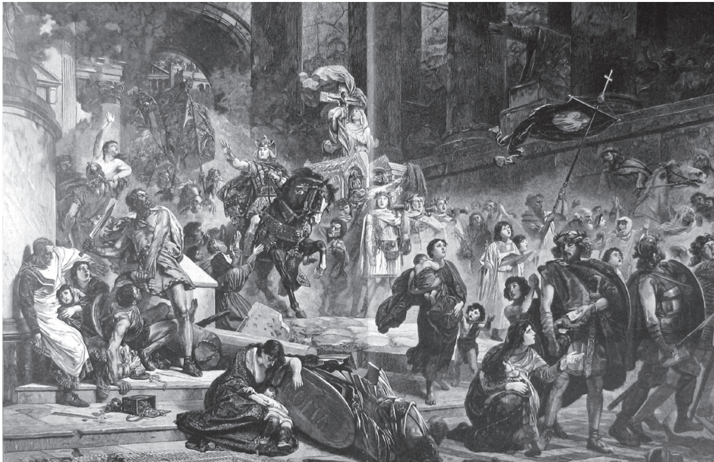
Вильгельм фон Линденшмит (младший). Король Аларих в Риме. 1888

беж, как говорили в марксизме, перехода количества в качество, мне кажется, вероятно близок. Может быть, я ошибаюсь. И здесь, думаю, и мне, и коллегам, и зрителям было бы интересно узнать Ваше мнение.