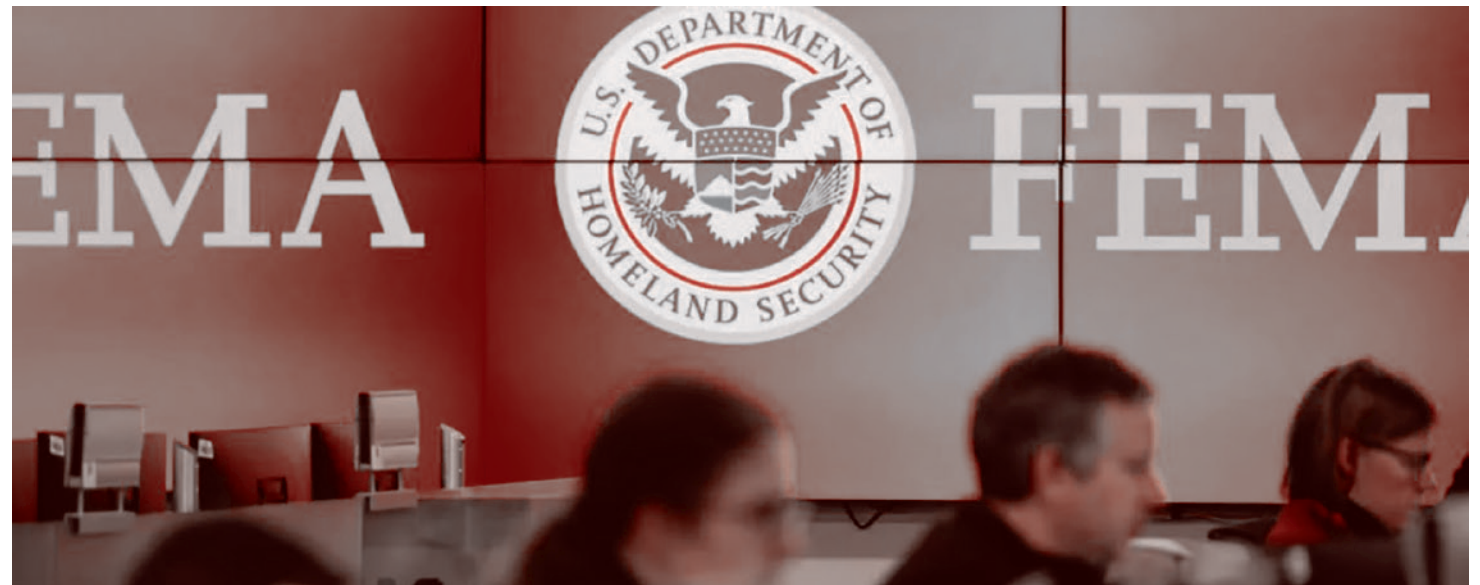
FEMA (Federal Emergency Management Agency) — Федеральное агентство по управлению в чрезвычайных ситуациях — подразделение Министерства внутренней безопасности США (DHS)