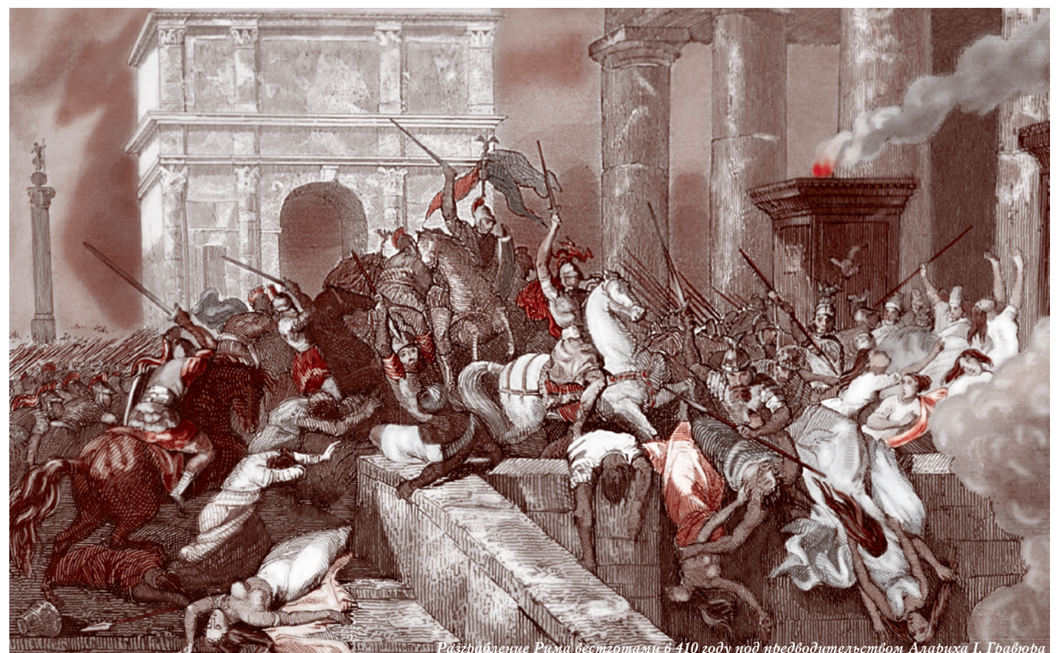
Разграбление Рима вестготами в 410 году под предводительством Алариха I. Гравюра