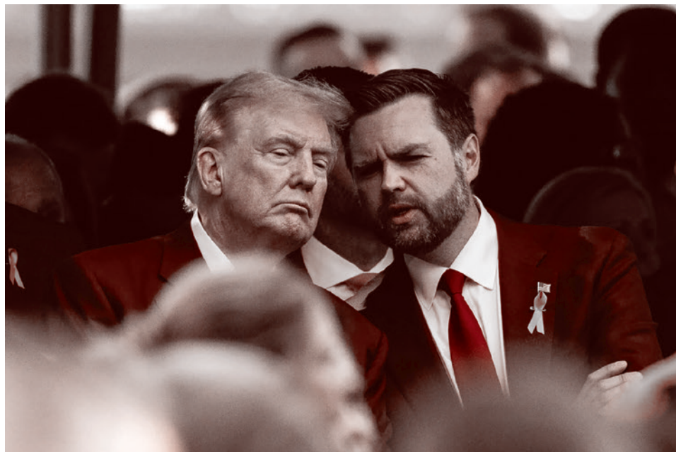
Президент США Дональд Трамп и вице-президенты США Джей Ди Вэнс

Ярвин утверждает, что технологические магнаты условного царства Сан-Франциско («Фрискорп») могли бы произвольно отрубать руки своим гражданам, не опасаясь юридических последствий, — потому что они являются суверенной властью, не подчиняющейся никакому федеральному правительству или законам.