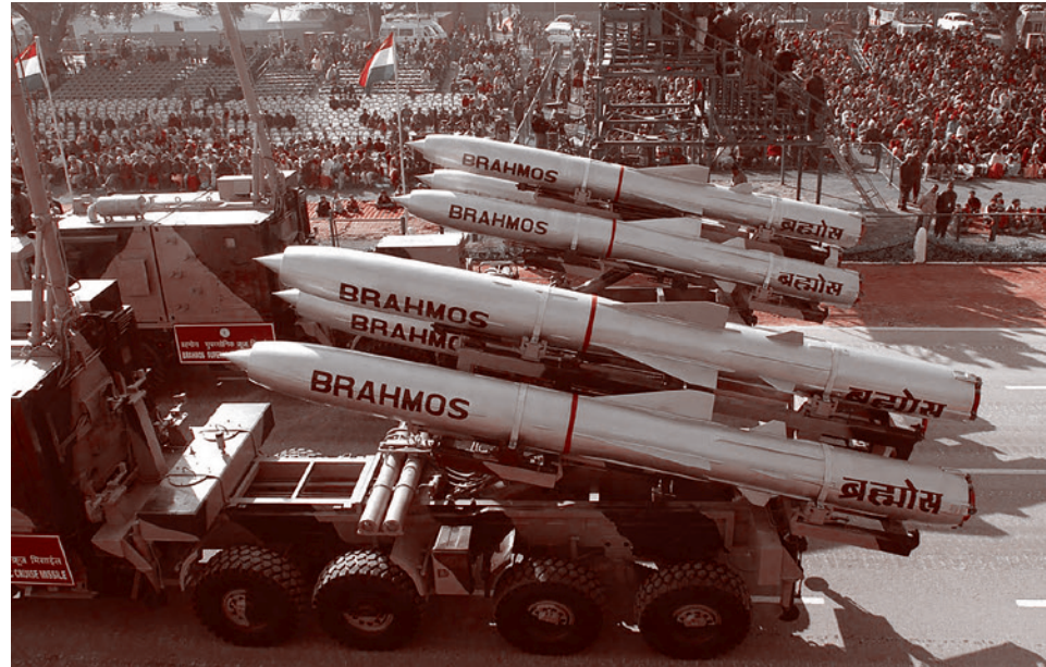
Ракетная система Brahmos проходит через Раджат во время генеральной репетиции парада ко Дню Республики. Индия

По данным издания, блок уже организовал три встречи со сценаристами, ре-