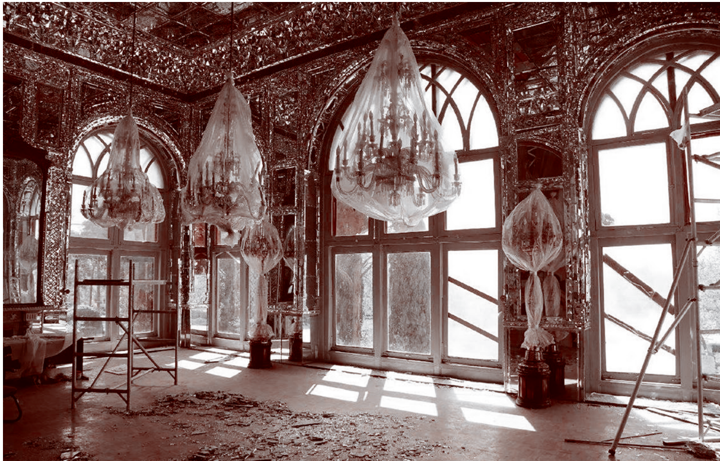
Повреждения после обстрела во дворце Голестан. Тегеран. Иран

США), но, прежде всего, в провозглашении культы силы как нового стандарта международных отношений. Начиная с Кеннеди, американцы прикрывали и обосновывали свои несправедливые притязания благами обещаниями (сказками), что они, мол, несут всем демократию, ратуют за права человека и всеобщий доступ к благам цивилизации, и даже разработали целый пакет инструментов так называемой мягкой силы. То есть хотя бы на уровне языка все выглядело прилично.