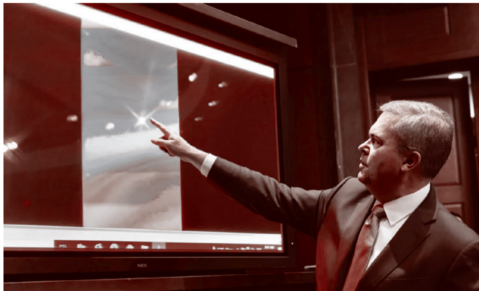
Замдиректора военно-морской разведки США Скотт Брей демонстрирует видеозапись НЛО на слушаниях в конгрессе