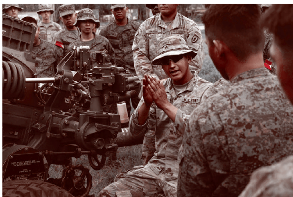
Американский инструктор обучает филиппинских военнослужащих в ходе совместных американо-филиппинских военных учений

Маск заявлял ранее, что роботы-хирурги могут заменить людей уже в ближайшие пять лет. По его словам, Neuralink уже использовала такого робота для введения электродов в ткань мозга человека, поскольку эта процедура требует скорости и точности, недоступных человеку.