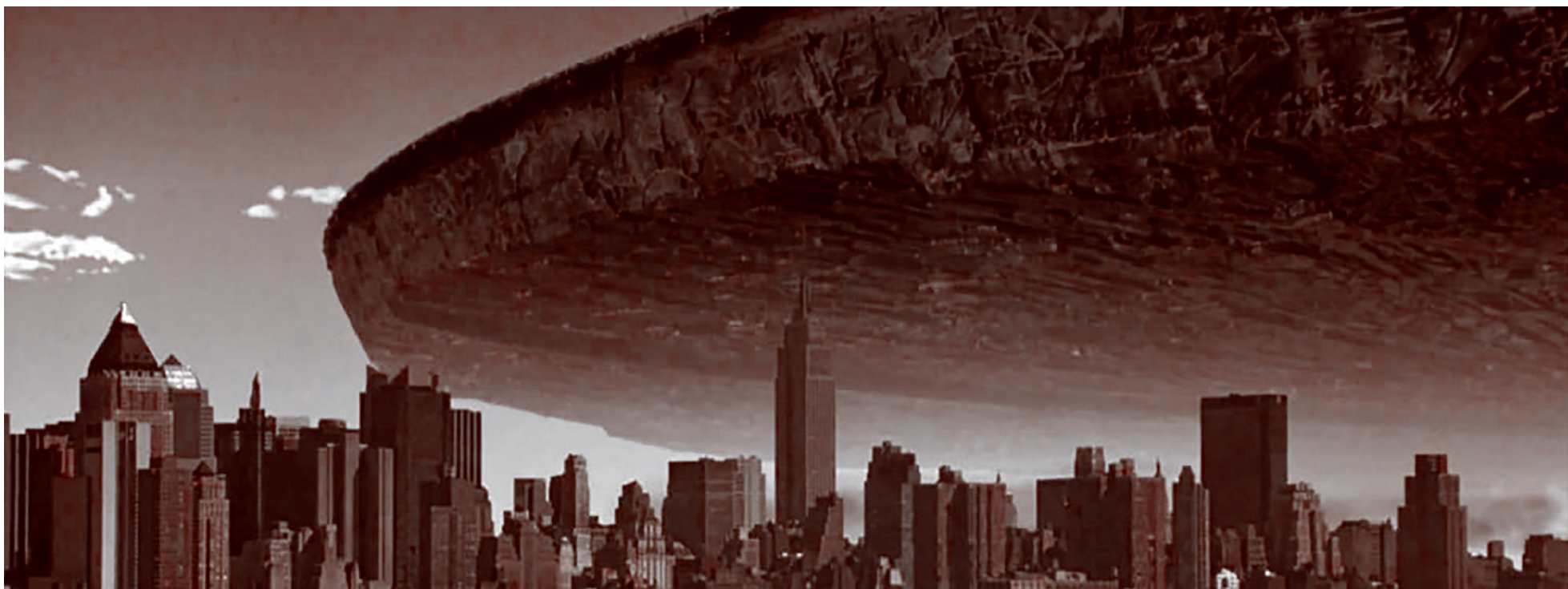
Цитата из х/ф «День независимости». Реж. Роланд Эммерих. США. 1996

Газета «Суть времени» зарегистрирована Федеральной службой по надзору в сфере связи, информационных технологий и массовых коммуникаций (Роскомнадзор) Свидетельство ПИ № ФС77-50554 от 9 июля 2012 года