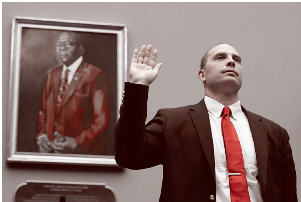
Дэвид Граш во время выступления в конгрессе США

них подверглись насмешкам за свои заявления.