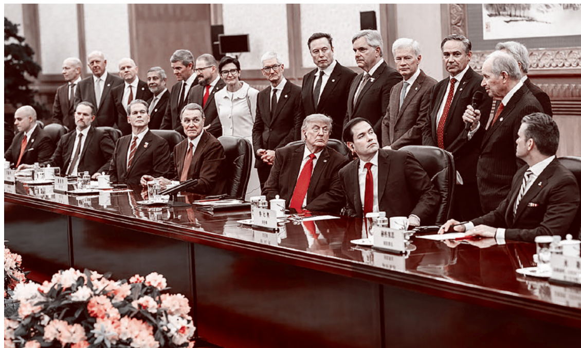
Генеральные директора крупных компаний в составе американской делегации на встрече лидеров США и КНР в Пекине