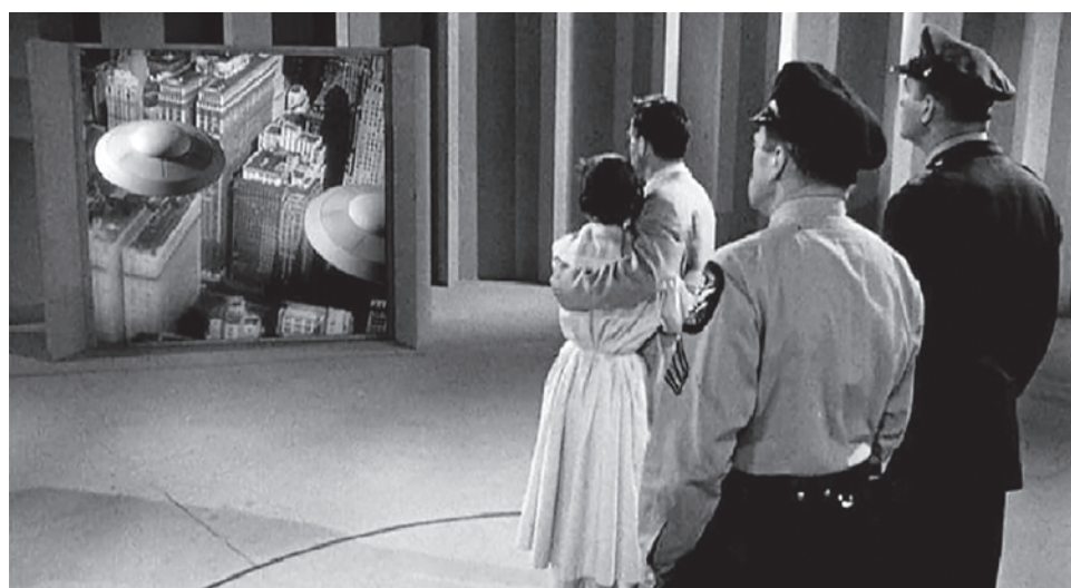
Цитата из х/ф «Земля против летающих тарелок». Фред Сирс. США. 1956