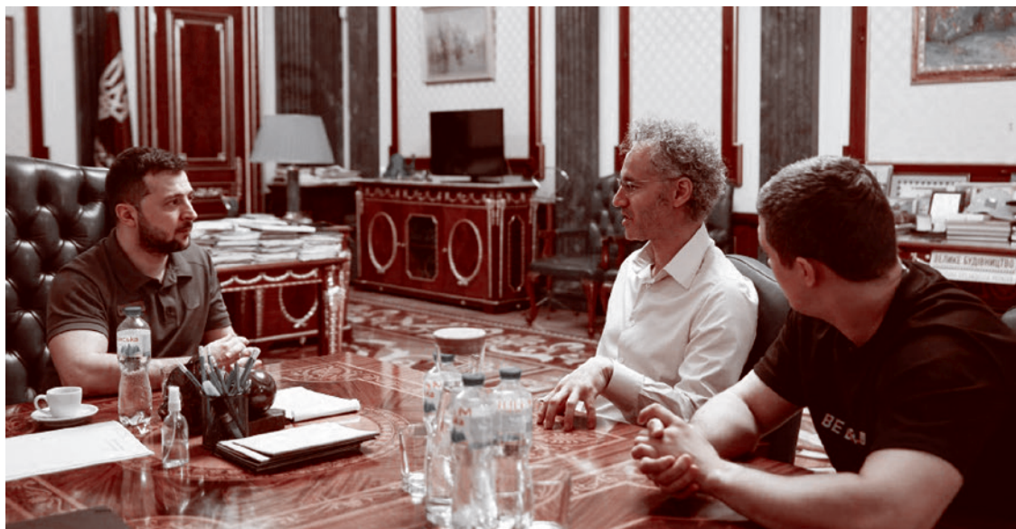
Президент Украины Владимир Зеленский и заместитель премьер-министра, министр цифровой трансформации Михаил Федоров провели встречу с генеральным директором Palantir Алексом Карпом

Вопрос о том, насколько рентабельна разработка и добыча редкоземельных и других