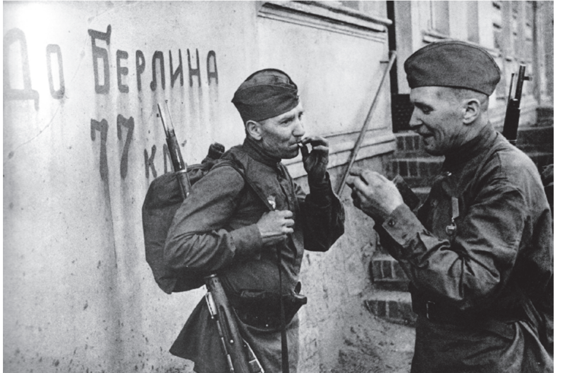
Перекур советских бойцов. До Берлина остается 77 километров

Для меня бесценна личность моего отца. Он меня восхищал при жизни. Может быть, еще больше восхищает сейчас. Я его безумно люблю, ценю и все прочее. Он воевал и в Финскую, и в Великую Отечественную. Но я же видел это все с близкого расстояния. Великие солдаты, воины Великой Отечественной войны — великие в силу их свершений, в силу их уникального героизма и прочего, — возвращались с войны (которую в исламе называют «джихад мечи») не на «джихад духа». Они в мир возвращались! Они возвращались для жизни, которую видели благой, честной, замечательной. Но для жизни! И они даже все время повторяли, что ради этой жизни они и совершали свои героические подвиги.