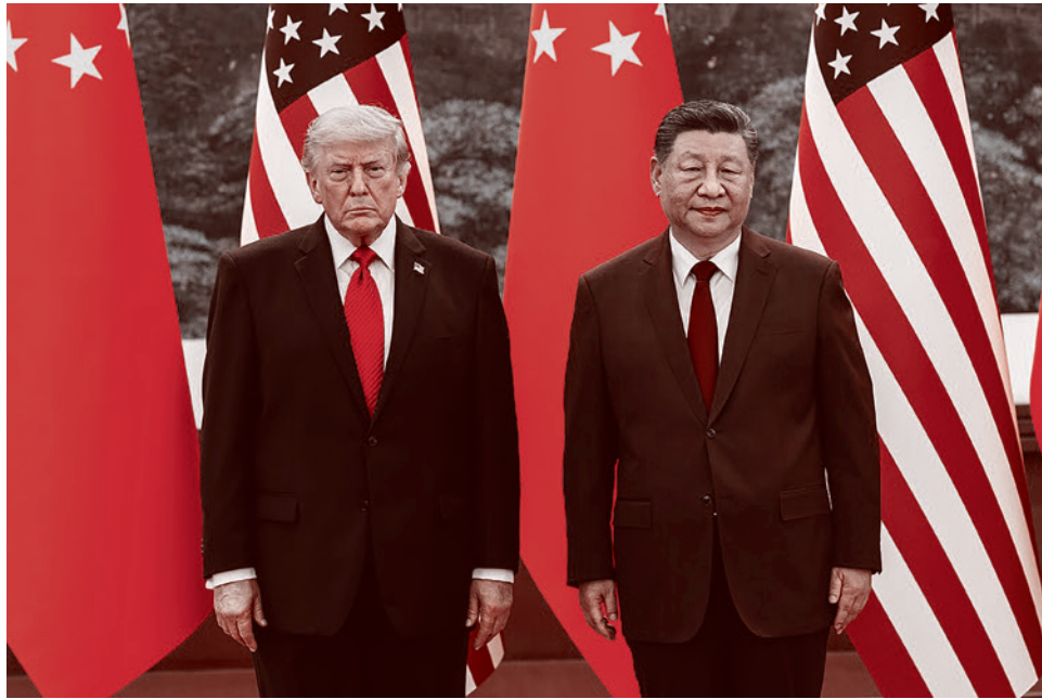
Президент США Дональд Трамп и лидер КНР Си Цзиньпин

Большая часть действий Трампа на внешнеполитическом поле так или иначе привязана к выборам в конгресс, которые пройдут в ноябре этого года. То есть у него примерно 4–5 месяцев, чтобы как-то отыграть провал иранской кампании. Как ни парадоксально, но демократы то-