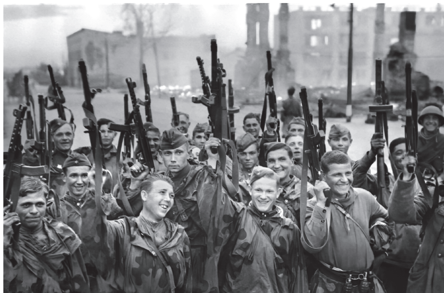
Советские бойцы салютуют в честь освобождения Выборга. 1944