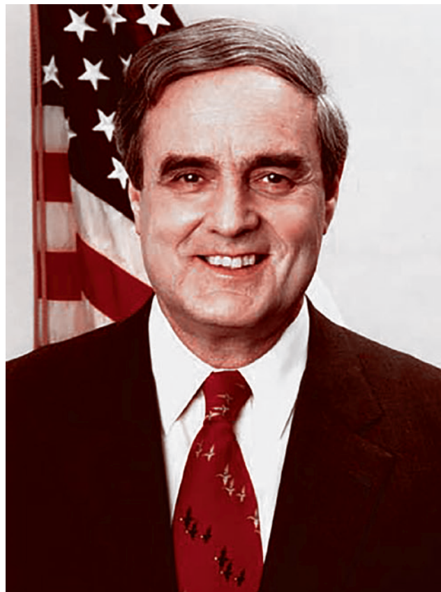
Дипломат Уильям Грин Миллер

Соединенные Штаты много усилий и средств потратили на то, чтобы оторвать Украину от России. Общая сумма затрат не ограничивалась названными в апреле 2014 года помощником госсекретаря США