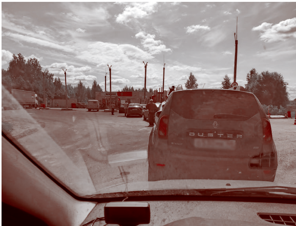
Очередь на АЗС