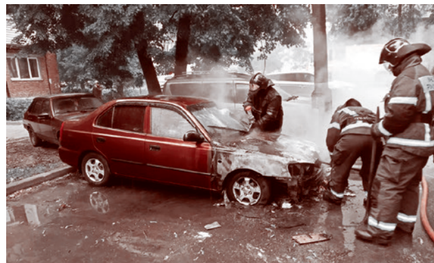
Ликвидация последствий атаки БПЛА в Подмоскowie

Дальнбойные удары Украины по РФ поддерживаются разведанными США, которые западные союзники настоятельно