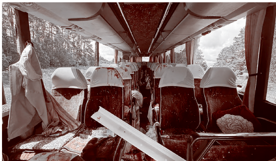
Последствия удара украинского БПЛА по автобусу белорусской детской футбольной команды