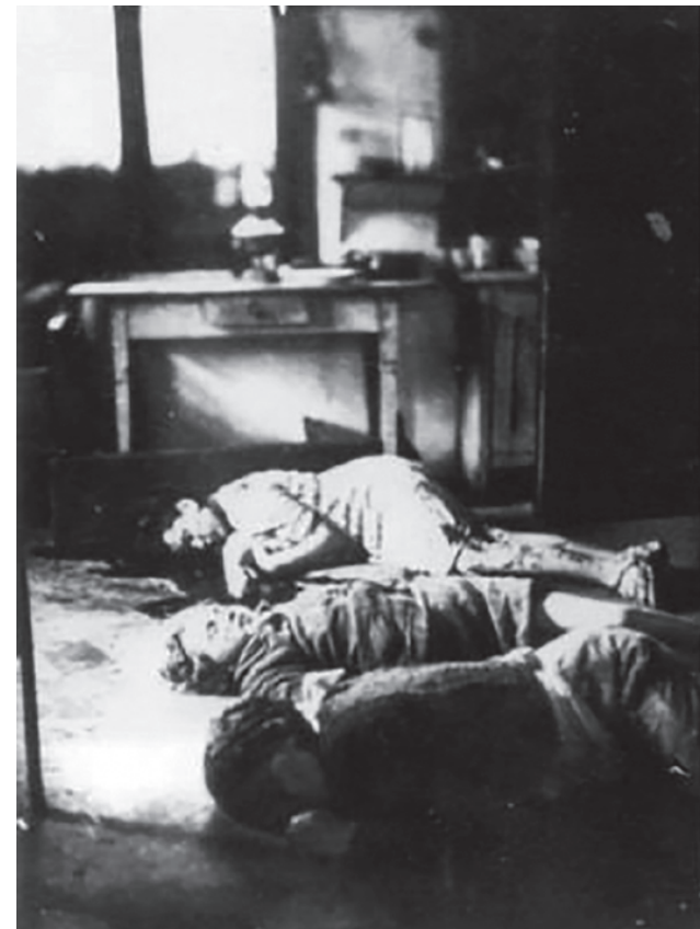
Польская семья Шайер, мать и двое детей, вырезана у себя в доме во Владинополе. 1943