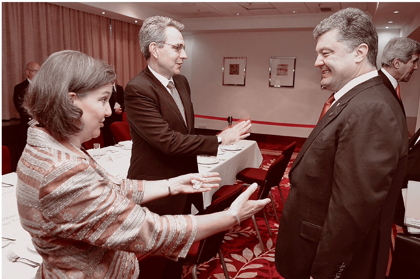
Помощник госсекретаря США по европейским и евразийским делам Виктория Нуланд и посол США на Украине Джеффри Пайетт приветствуют избранного президента Украины Петра Порошенко*. Варшава. Польша. 2014

этом посту почти три года, до мая 2009 года. От министра иностранных дел Украины Павла Климкина Тейлор — младший заслужил звания «хорошего друга Украины». По мнению личного адвоката Дональда Трампа Руди Джулиани, высказанному им в 2019 году в интервью New York Magazine, Тейлор был одним из послов США на Украине, за назначением которых стоял не столько государственный департамент Соединенных Штатов, сколько главный спонсор «цветных революций» финансист и миллиардер Джордж Сорос.