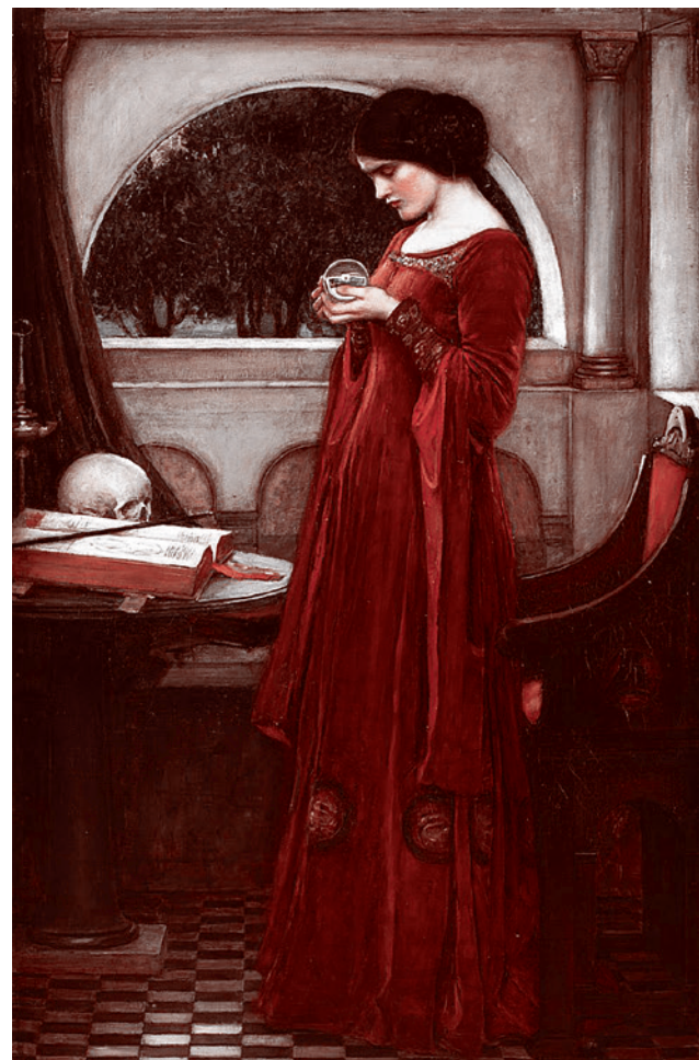
Джон Уильям Уотерхаус. Хрустальный шар. 1902

И, как все понимают, речь в данном случае не о человеке и его величии, а о том, в чьих руках окажется контроль над инструментом тотальной слежки и обеспечения безопасности. А то, что речь идет