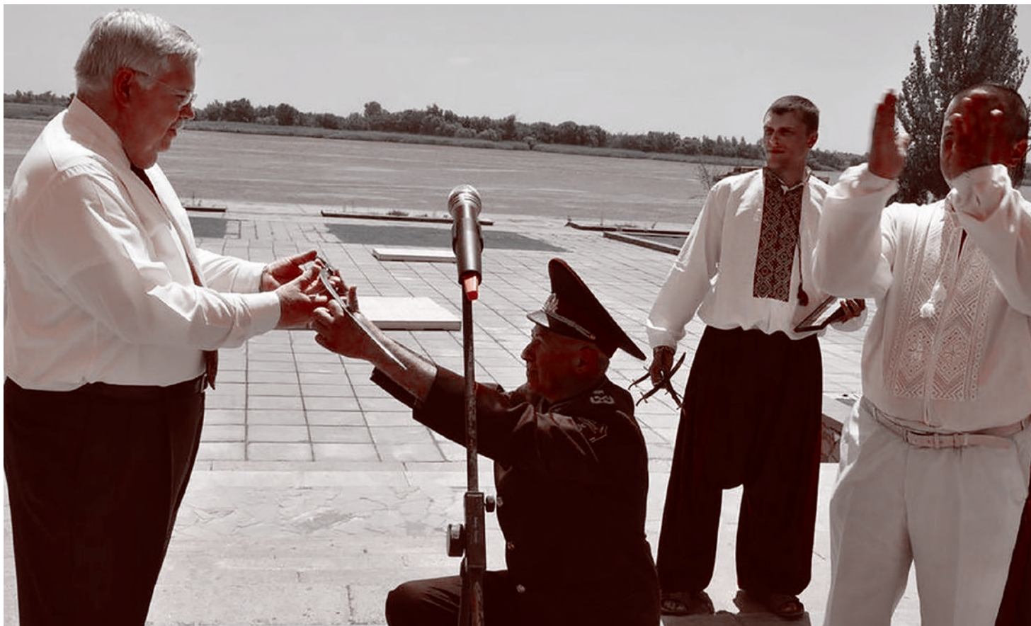
Украинский генерал на коленях вручает саблю бывшему послу США Джону Тейфту

В мае 2006 года его сменил на посту ветеран вьетнамской войны Уильям Брокенбро Тейлор — младший, побывавший на