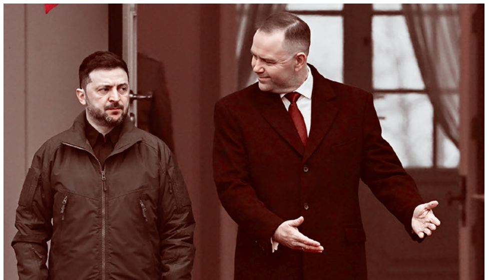
Владимир Зеленский и Кароль Навроцкий

Дальше начинается знаменитый зерновой скандал. Вдруг украинцам сказали: беспрошленно торгуйте с Европой зерном. Они начали это зерно завозить, а Польша — сильно аграрная страна. Там не меньше 10–12% населения напрямую связано с аграрным сектором, а значит, косвенно вдвое больше связано, так или иначе. Это очень серьезно с точки зрения выборов, с точки зрения вообще общественной поддержки власти. Там уже перегораживали трассы тракторами, вскрывали вагоны с зерном, выбрасывали это зерно, там уже чуть не штурмовали официальные здания, пока, наконец, польское правительство не передало колоссальную льготу польскому аграрному сектору, просто заткнув эту дыру деньгами и сказав: «Не возбуждайте, мы вам так заплатим, что вы не пострадаете». Ну, конечно, все равно достаточно заплатить — очень трудно.