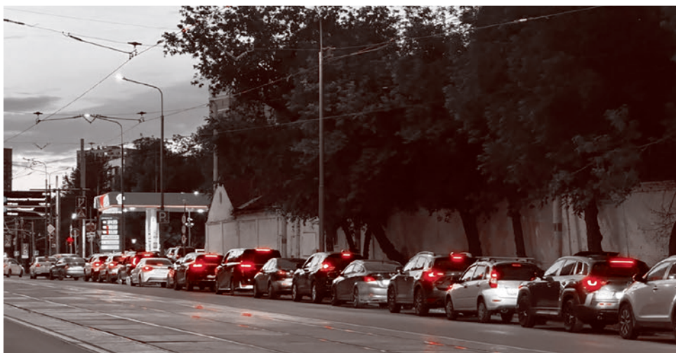
Очередь на АЗС. Москва