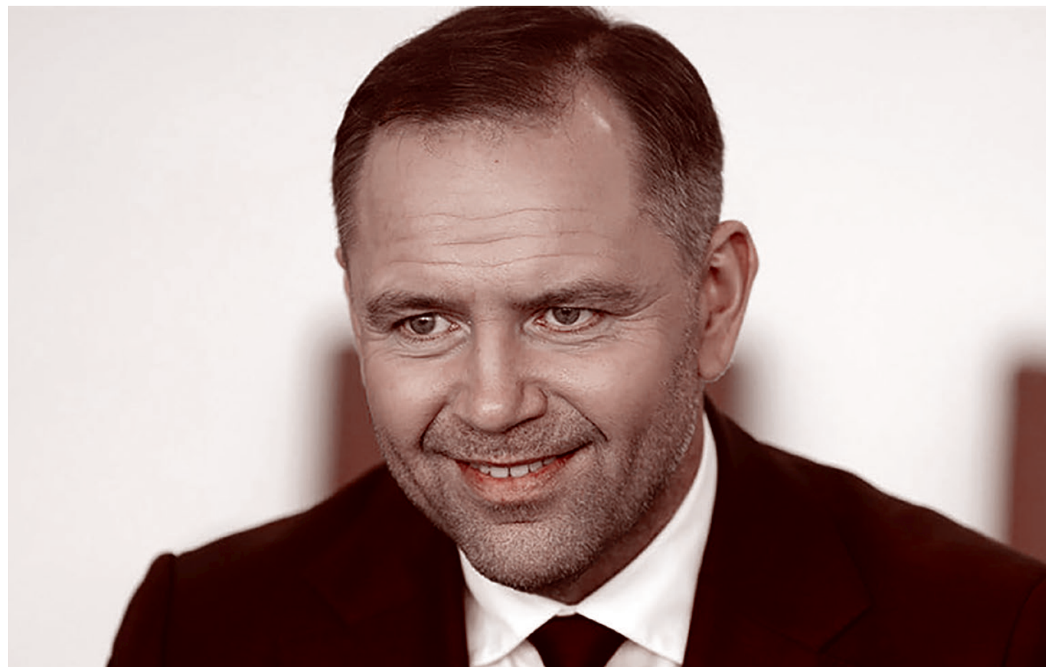
Президент Республики Польша Кароль Навроцкий

** — включен в список террористов и экстремистов на территории РФ.