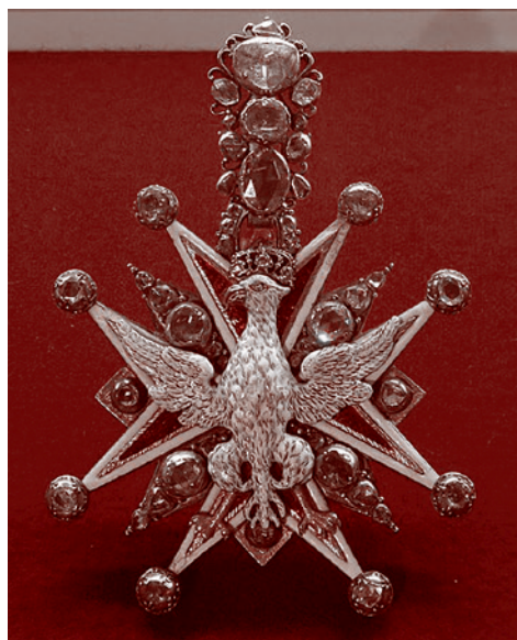
Орден Белого орла. XVIII век

Все время говорится, что Украина выдерживает за счет колоссальной помощи европейской и прочей. Кстати, об этой помощи. Вот тут-то у поляков большой интерес к Украине. Польский военно-промышленный комплекс раскручивается только за счет того, что европейцы и американцы платят полякам деньги за поставки различного рода вооружений. Поляки очень облизнулись на восстановление Украины, — программу, в которой они хотят получить 50%. А это, по заявкам (так не будет, конечно), по официальным серьезным заяв-