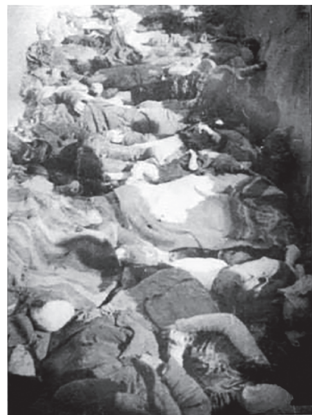
Жертвы резни в Липниках в братской могиле