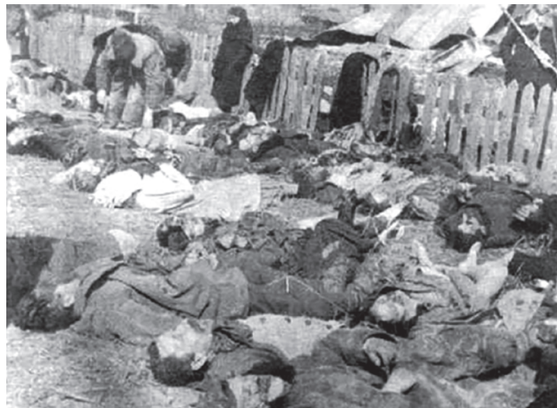
Польские мирные жители, погибшие в результате резни в селе Липники (Костопольский уезд) Рейхскомиссариата Украина. 1943

И аналогичных ей групп здесь в России я не вижу. Все гораздо прагматичнее.