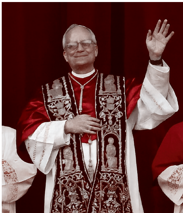
Папа Лев XIV

И мы видим, что США действительно перешли к политике жесткой силы. Вспомним, что Трамп сразу после прихода к власти в январе 2025 года начал разгром Агентства США по международному развитию (USAID) — организации, за десятилетия своей работы ставшей символом той мягкой силы, которую так яростно критикует руководство Palantir. Ну, а 2026 год ознаменовался началом прямой военной