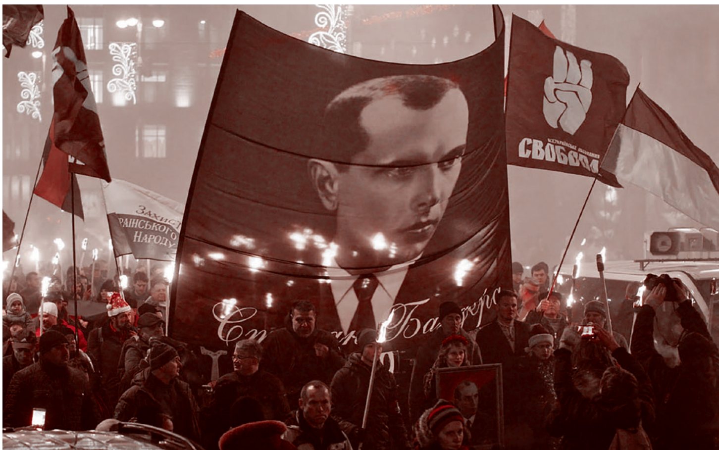
Украинские националисты с портретами Бандеры во время марша в Киеве